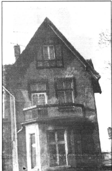
W dzisiejszym numerze rozwiązanie konkursu nr 76. Zdjęcie nr 76 przedstawia budynek położony w Kwidzynie przy ul. Warszawskiej 8. Zagadkę prawidłowo rozwiązało 11 osób, a nagrodę wylosowała pani Zofia Wierzbicka zamieszkała w Kwidzynie przy ul. Spółdzielczej 1027.

Za tydzień rozwiązanie konkursu nr 77. Odpowiadamy na konkurs nr 77 i 78 prosimy przysłać na adres redakcji lub przynosić osobiście - Kwidzyn, ul. Bratrstwa Narodów 46 tylko na kartach pocztowych i pocztówkach z zaznaczonym numerem konkursu, którego odpowiedź dotyczy. Odpowiedzi zamieszczone nie będą brały udziału w losowaniu nagród! Życzymy miłej zabawy.