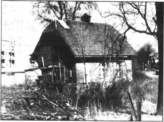
W dzisiejszym numerze rozwiązanie konkursu nr 88. Zdjęcie nr 88 przedstawia budynek położony w Kwidzynie przy ul. Toruńskiej 2. Zagadkę prawidłowo rozwiązało 19 osób, a nagrodę wylosował pan Wojciech Radomilski zamieszkały w Kwidzynie przy ul. Grudziądzkiej 42/1.

Za tydzień rozwiązanie konkursu nr 89. Odpowiedzi na konkurs nr 89 i 90 prosimy przysyłać na adres redakcji lub przynosić osobiście - Kwidzyn ul. Bratierstwa Narodów 46 tylko na kartach pocztowych i pocztówkach z zaznaczonym numerem konkursu, którego odpowiedzi dotyczy. Odpowiedzi zamieszczone nie na kartach pocztowych, a w listach czy na zwykłych kartkach, nie będą brały udziału w losowaniu nagród! Życzymy miłej zabawy.