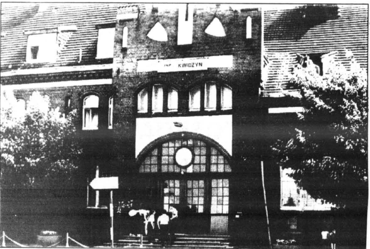
ZABYTKI MOGĄ SPEŁNIĆ SWĄ WŁAŚCIWĄ ROLĘ DO DZIS