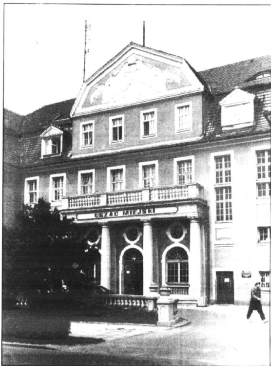
NIE TYLKO ZAMEK I KATEDRA.

"KK" - Co jest najważniejsze w ochronie zabytków?