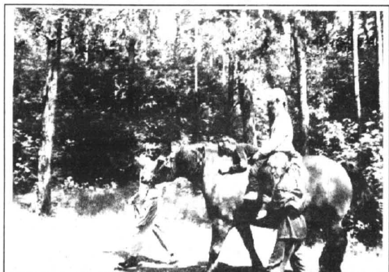
DZIECI MOGLY KORZYSTAĆ Z HIPOTERAPII

trwania zajęć itp. Zdaniem Kola Rodziców Dzieci Niepełnosprawnych Ośrodek wywarł na nich duże wrażenie. Dzieci, które brały udział w wyjeździe były w wieku od 10 miesięcy do 15 lat. Miały one okazję spotkać się z młodzieżą niepełnosprawną z Niemiec, z głuchoniemi i z dziećmi niepełnosprawnymi nie wywołując wśród obsługi ośrodka zdziwienia czy znaczącego ki-