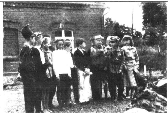
Młodzież ze Szkoły Podstawowej w Wandowie przygotowała program artystyczny.