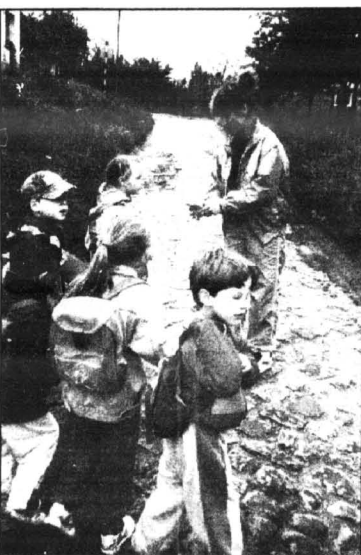
Nauczycielki z Przedszkola Nr 8 w Kwidzynie

Juz od dziś zaczynamy odliczać czas do rozpoczęcia III Rajdu Ekologicznego w przyszłym roku.