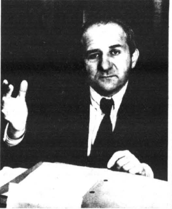
dziesięć lat temu tyle płacono za codzienną gazetę lub bilet tramwajowy.

- Odkładamy portfele, do task wracają portmonetki? - Polecam popularnego czasu podkówek z melową opaską! - Denominacja to pogoda dla rymarzy? - Rymarze nie powinni narzekać, tak jak nie powinno z tego powodu narzekać społeczeństwo. Denominacja bowiem jest wielką operacją techniczną, która ma nam wszystkim uprościć rachunki i ułatwić codzienne czynności. - Wszyscy zyskują, nikt nie traci? - Przecież rozmawiamy o denominacji, a nie o dewaluacji - czy tak? - Niby oczywiste, ale... - Dewaluacja, to, w skrócie, osłabienie waluty krajowej w stosunku do zagranicznej. Jak pan wie, była już przeprowadzona parę razy w sposób skokowy, a obecnie ma charakter pełzający. Denominacja natomiast polega wyłącznie na skróceniu określonej ustawy liczbzyr. Wzrostie ma wymowę antydevalacyjną i antyinflacyjną. Dwa i pół złota za dolara brzmi dla ucha posiadacza złotych zupełnie przyzwoicie, przynajmniej?