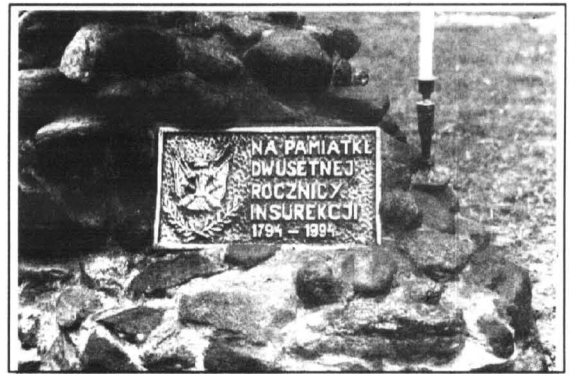
PAMIĄTKOWA TABLICA BĘDZIE PRZYPOMINAŁA O 200 ROCZNICY