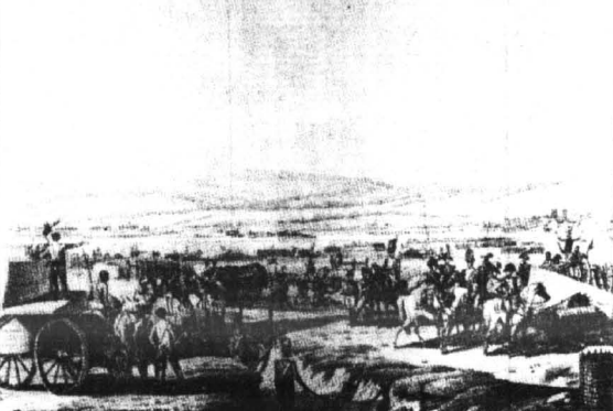
Napoleon na przeglądzie prać przy oblężeniu Gdańska (3 maja 1807 r.)

wojskami pruskimi pod Jeną i Austerlitz poprzedził uroczysty wjazd cesarza Napoleona do Berlina. Stało się to 27 października 1806 roku. W tym czasie resztki pruskiej armii, wspaniczone ucieczce przemykały na tereny pomiędzy wschodnią Łabą i Odrą, aby w następnych dniach - po przekroczeniu Odry - ukryć się w nadbrzeżnych lasach Pomorza. Witym i Bratymy Brandenburskiej przez pruskich ministrów i notabli. Bonaparte zapewne nie był jeszcze całkiem zdecydowany, czy ruszy dalej na wschód dobiec ostalecznego wojdca nieprzyjaciela, czy też podpisać traktat pokojowy na wyjątkowo korzystnych i zaszczepnych warunkach, które proponował mu król Fryderyk Wilhelm II. z jednej bowiem strony Rosjanie perspektywę zwycięstwa kontrolni nad całym Prusami, z drugiej zaś odstraszała pewność, że po wkróceniu na tereny porzobiorowe