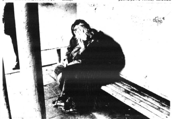
paroma tegorocznymi absolwentami oraz ich problemami.