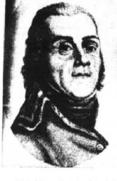
F. Lefebvre książę Gdańska marszałek Francji