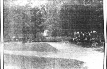
Za niebezpieczne miejsca uważane są często parki w Kwidzynie

Komendant Komendy Rejonowej Policji Tomasz Klemm chce również, żeby w programie "Bezpieczne Miasto" uczę-