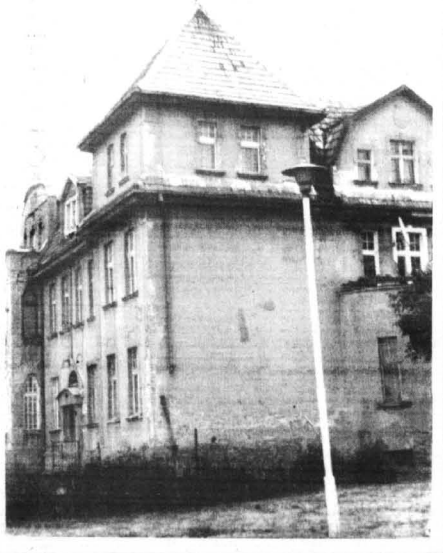
Zyczymy miłej zabawy.