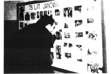
Jedną z imprez towarzyszących to wystawa fotografii przedstawiających Janowo