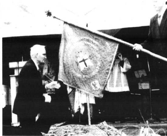
Przekazanie historycznego sztandaru Katolickiego Stowarzyszenia Młodzieży. Na zdjęciu jeden z nielicznych żyjących jeszcze członków KSM

1920 r. Mówił o wpływie historii na losy dzisiejszej Polski. Zaapelował również o udział w wyborach prezydenckich mówiąc: "Ze kandydat na prezydenta winien re-