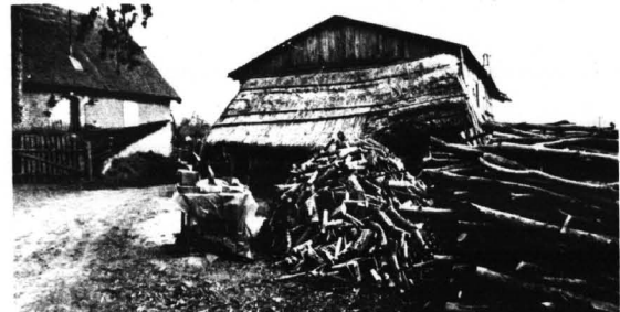
Mieszkańcy gminy Osiek mają sporo problemów - przed zimą na przykład zaopatrzyć się w opał, co widac na zdjęciu. Tylko bardzo ważne wydarzenia może spowodować, że na zebranie sołectwie zajdzie się ok. 200 osób.

Wielce interesujących sonek przesuwa mi się przed oczami - i np. ta kiedy piecio - no... może sześćioletnia córka widziiera się na matkę. łupiac przy tym nóżkami - kiedy ta oponuje w sprawie Kupna kolejnej "Barbie". Oczywiście, dziecko wygrywał. Tym właśnie spogląda na matkę, że nie po raz pierwszy, Szpesczona kobieta usiłuje tłumaczyć "coś" obserwowując ten