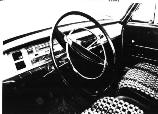
Originalne wnętrze fiata 125p z 1968 r.