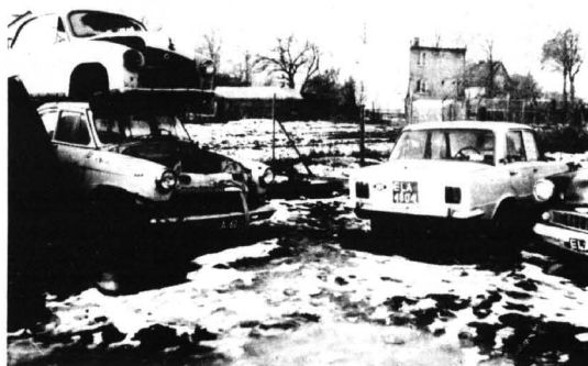
KDL-owska spuścizna: wołga, na niej syrenka, obok "duży" fiat, o którym mowa w tekście, fragment motowizja