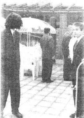
Na trasie powrotu nowożeńców do domu weselnego pojawiają się coraz liczniejsze zapory: całe watahy całkiem obcych osobników...