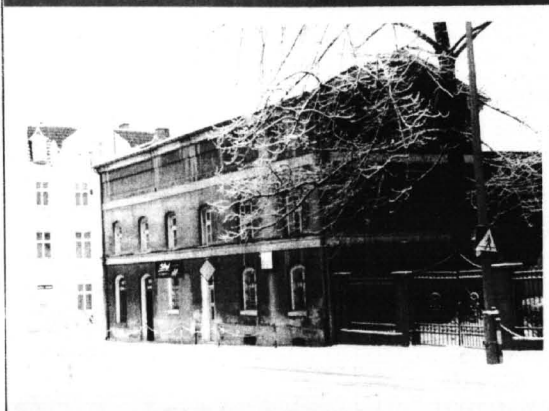
Zdjęcie nr 175 przedstawiało budynek przy ul. Piłsudskiego 9. Zagadkę prawidłowo rozwiązało 17 osób, a nagrodę otrzymuje pan Bolesław Imbirkiewicz z Kwidzyna.

Za tydzień rozpoczyna konkurs nr 176. Za tydzień rozpoczyna konkurs nr 176. Za tydzień rozpoczyna konkurs nr 176. Za tydzień rozpoczyna konkurs nr 176.