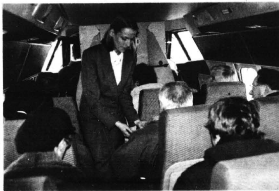
Honorowi pasażerowie pierwszego lotu na trasie Królewo Malborskie - Warszawa