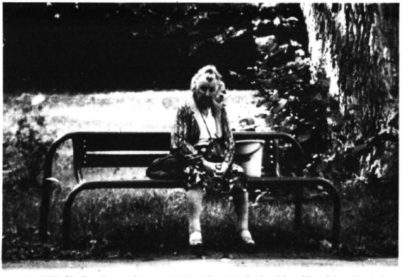
Latu 1995. Chwila odpooczynku w wypatrywaniu nowych skupisk roślin wiatropylnych, bez których nie byłoby kleju pszczelego

Na Śląsku naukowe badania nad propolisem zapoczątkowano przed 60 laty, na terenie miejscowości pszczałnicy i trwają one do dziś. Specjalnie powołane zespoły zlozozone nie tylko lekarzy medycyny i weterynary, ale także chemików i biologów, dokonywały analizy skład chemiczny propolisu, a następnie opracowały i opatentowały tzw. EEP (etanolowy ekstrakt propolisu).