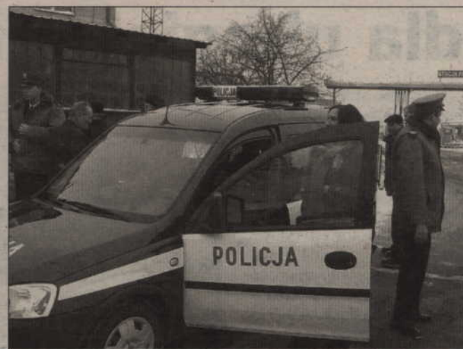
Do Prabut trafił nowy samochód policyjny.

- Pieniądze na nowy samochód przekazaliśmy na początku ubiegłego roku. I skoro przez tak długi czas nie było auta, to nie widzę sensu przyprawiania do Prabut używanego samochodu tuż przed przekazaniem nowego – komentuje bur-