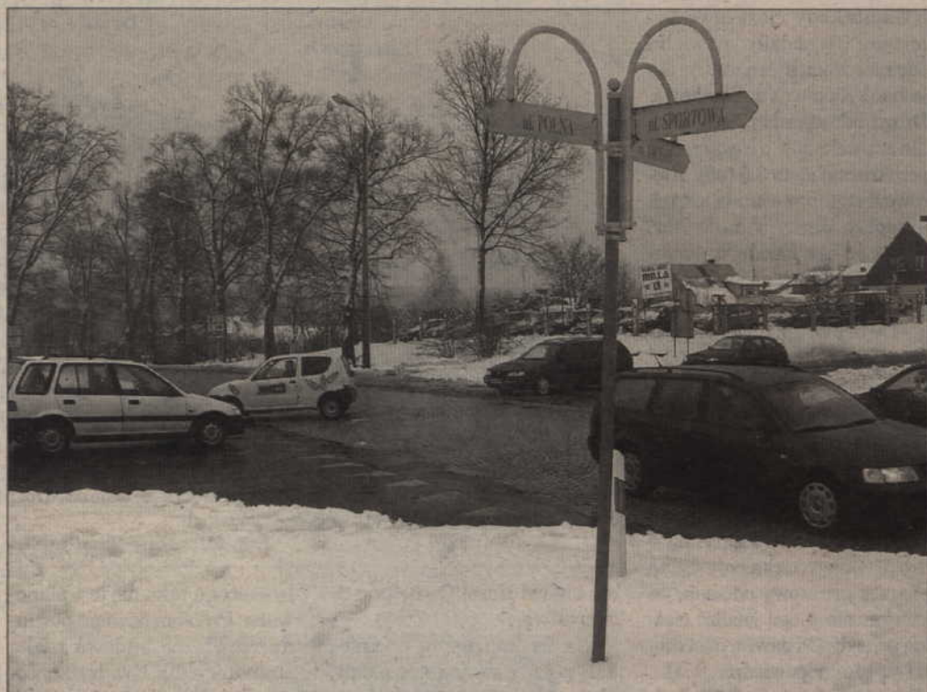
Jedno z trzech nowych kwidzyńskich rond powstanie u zbiegu ulic Polnej, Sportowej i Wiejskiej.