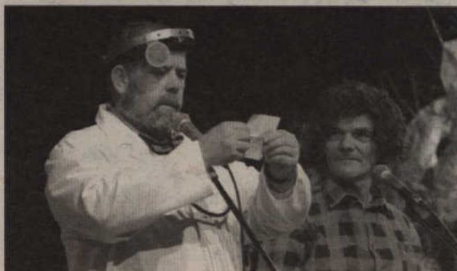
XXII Ogólnopolski Przegląd Kabaretów Wiejskich odbył się w Kwidzynie. Wygrał kabaret z Bartoszyc.