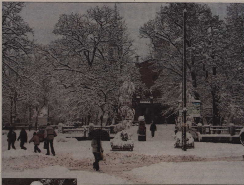
Ulica Grudziądzka. Kościół pw. Świętej Trójcy w zimowej szacie.