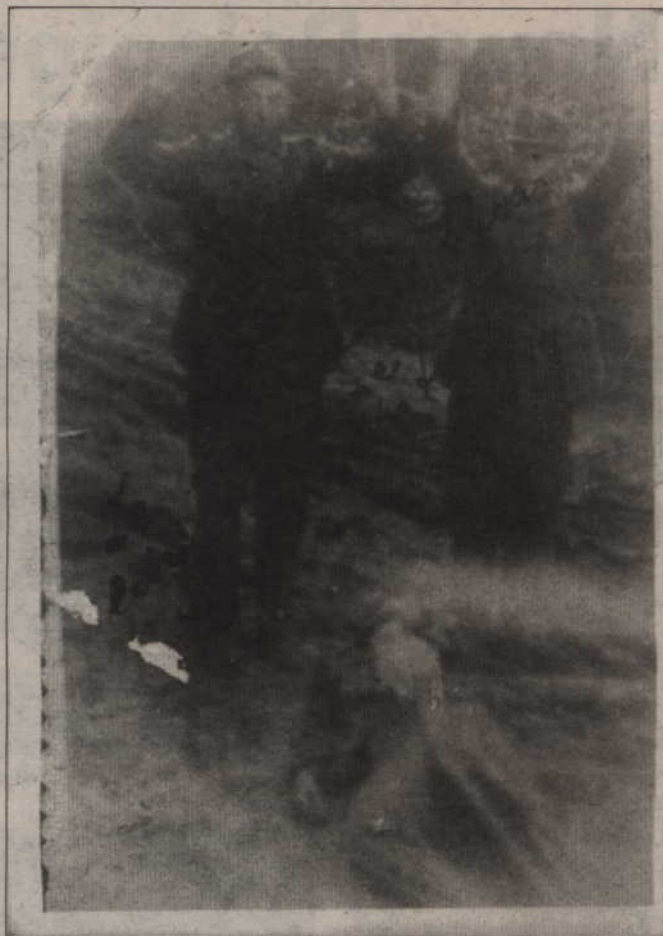
Rok 1943. Żołnierze niemieccy wzięci do niewoli. Niestety nie wszyscy przeżyli wojnę.