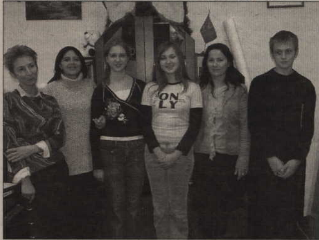
Troje młodych ludzi z Ukrainy uczy się w Społecznym Liceum Ogólnokształcącym w Kwidzynie. Mieszkają i nauczycieli liceum. Przyjechali dzięki Gdańskiej Fundacji Oświatowej.