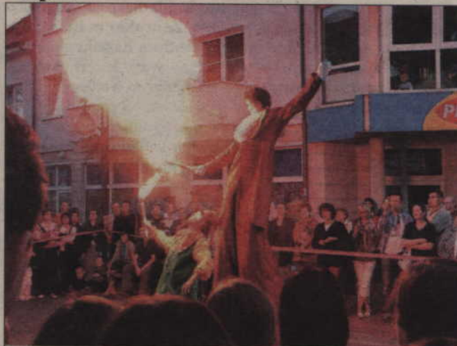
Na deptaku przy ul. Piłsudskiego odbył się V Festiwal Teatrów Ulicznych. Przyjechały grupy teatralne z całej Polski.

Zatrzymano 29-letniego mieszkańca powiatu kwidzyńskiego podejrzewanego z zgwałcenie 14-latki. Mężczyzna porwał ją do auta, gdy szła ulicą, i wywiózł do zagajnika w Górkach. Za prawdopodobne uznano, że wcześniej zgwałcił w Miłosnej 58-letnią kobietę, a także wiele innych kobiet w innych częściach kraju.