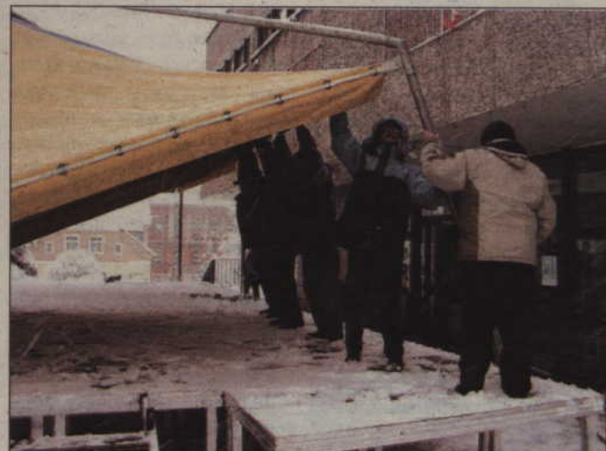
Ulica Katedralna. Pracownicy Kwidzyńskiego Centrum Kultury stawiają scenę przed tradycyjnym powitaniem Nowego Roku.