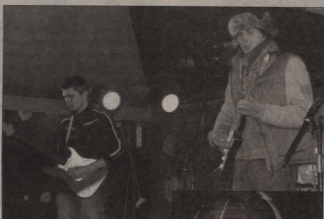
Na głównej scenie wystąpiła m.in. Przebieralnia.