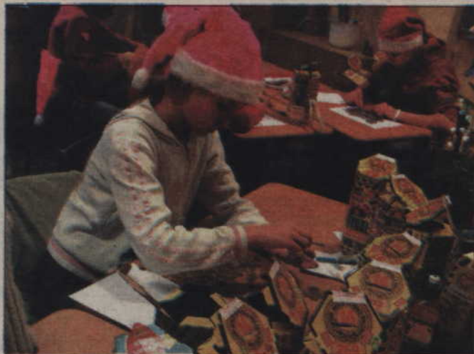
Wolontariusze pracujący w Szkole Podstawowej nr 2, czyli sztabie głównym Kwidzyńskiej Wielkiej Orkiestry, mieli sporo pracy z przełiczeniem zawartości wszystkich skarbonek.