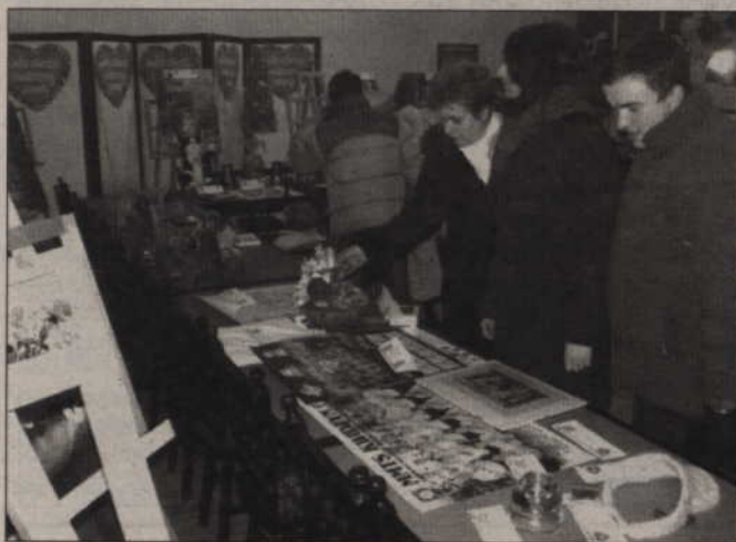
Na licytacji można było kupić m.in. plakat z podpisami zawodników MMTS.

MMTS Kwidzyn pokonał Warmię Traveland Olsztyn 32:20 w meczu na rzecz Wielkiej Orkiestry Świątecznej Pomocy. Kwidzyńska drużyna nie miała kłopotów z grającymi nadzwyczaj ostrożnie olsztynianami.