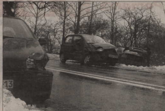
Do wypadku doszło w minioną środę. Samochody zderzyły się prawdopodobnie dlatego, że jezdnia była śliska.

-Musielśmy czekać w dużym korku, bo puszczano po