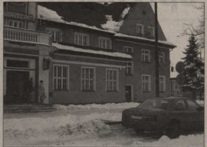
W Prabutach z taxi korzystają najczęściej starsi ludzie, którzy mają duże torby, czasami podróżni. Inni zazwyczaj chodzą pieszo.

Gdy pytaliśmy prabucian o numer na taxi, odpowiadali, że albo nie wiedzą, albo pytali ze zdziwieniem, czy w Prabutach jest w ogóle taksówka. Nie znają tego numeru ani w sklepach,