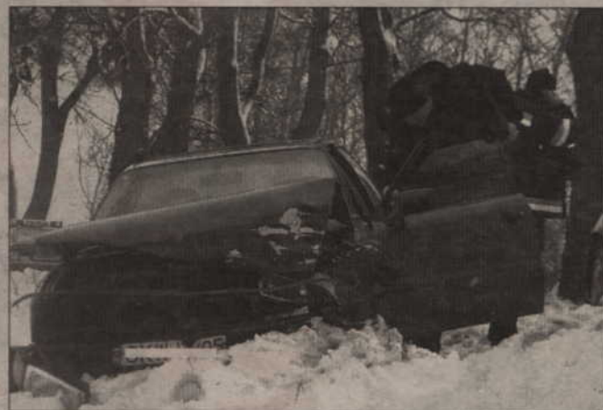
Początkowo wydawało się, że to zwykła kolizja. Jednak pasażerka jednego z aut zmarła kilka godzin po tym zdarzeniu.