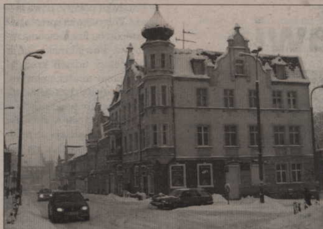
O usunięciu śniegu z dachu lub chodnika powinien zadbać właściciel budynku.

Kwidzińscy strażacy coraz częściej proszeni są o usunięcie śniegu z dachów budynków. Śnieżne nawisy mogą być niebezpieczne, jednak likwidowanie wszystkich nie należy do zadań straży pożarnej.