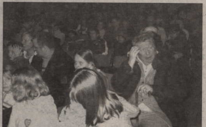
Prabucianie chętnie spędzili niedzielne popołudnie w domu kultury. Słuchali muzyki, uczestniczyli w aukcji, kupowali rękodzieła wykonane przez uczniów SP nr 2. Spotkanie zakończyło się występem zespołu Sanatorium P.