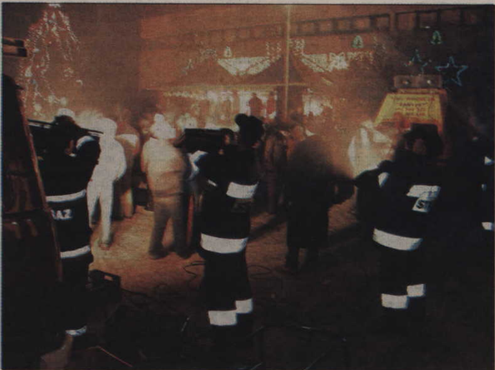
Strażacy z Państwowej Straży Pożarnej w Kwidzynie pomogli w nietypowej organizacji „Światelka do nieba”. Za pomocą lamp halogenowych oświetlili niebo, w które wleciały dziesiątki białych balonów.