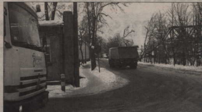
Zdaniem naszych Czytelników ul. Wojska Polskiego jest jedną z najgorzej oświetlonych i najbardziej dziurawych w Prabutach.

Do naszej redakcji dotarł list dotyczący ul. Wojska Polskiego w Prabutach (jego fragmenty przedstawiamy pochyloną czcionką). Komentuje go burmistrz Bogdan Pawłowski, którego nadawcy pozdrawiamy.