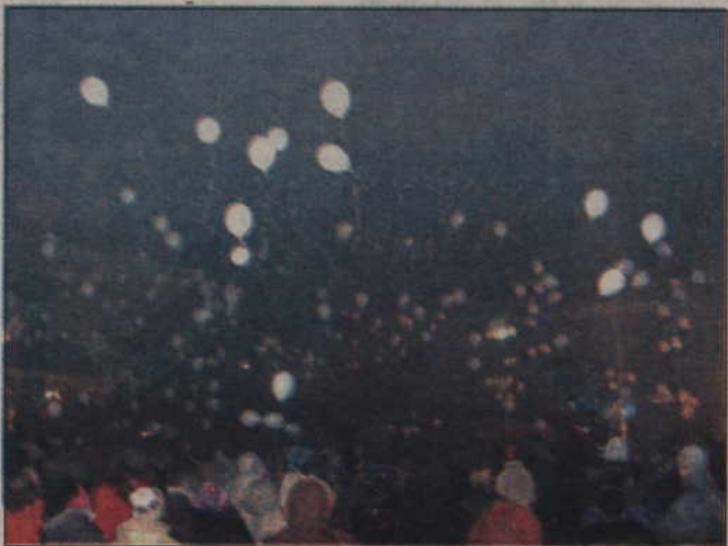
Punktualnie o godzinie 20 czekała wszystkich spora niespodzianka. Zebrani na placu otrzymali balony napelnione helem, kt óre jednocześnie wypuścili do góry.