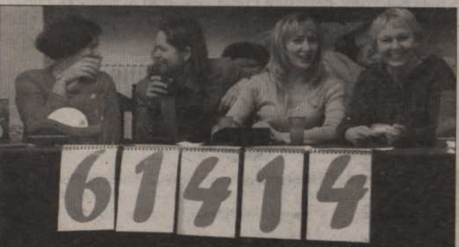
Humory dopisują. Godz. 20.56. Aktualny stan orkiestrowych zysków.