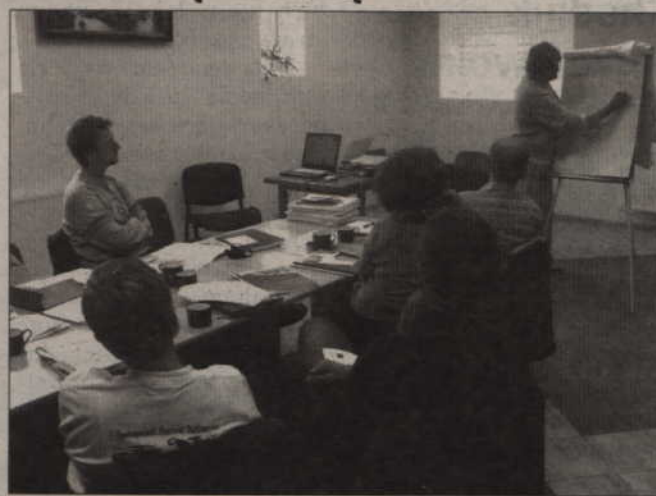
Starosta nagradził pięć wyróżniających się organizacji pozarządowych w powiecie. m.in. Stowarzyszenie „Eko-Inicjatywa”.