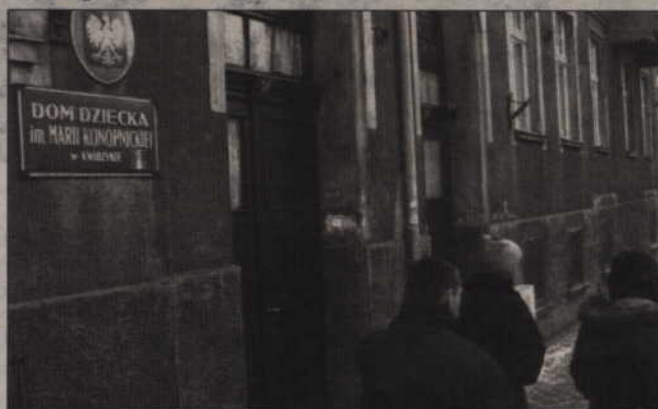
Trwają starania o to, by prowadzeniem kwidzyńskiego Domu Dziecka zajęła się organizacja pozarządowa.

Nadal nie wiadomo, jaka organizacja pozarządowa poprowadzi Dom Dziecka w Kwidzynie. Początkowo o jego przyszłości miały zdecydować negocjacje władz powiatu ze Stowarzyszeniem Pomocy Rodzinie „Wspólna Sprawa”, które zostało założone przez pracowników placówki. Rozmowy nie przyniosły jednak rezultatu. Ogłoszono więc konkurs otwarty dla organizacji pozarządowych. Wśród zainteresowanych znalazło się Stowarzyszenie „Nasz Dom”, które budzi jednak kontrowersje.