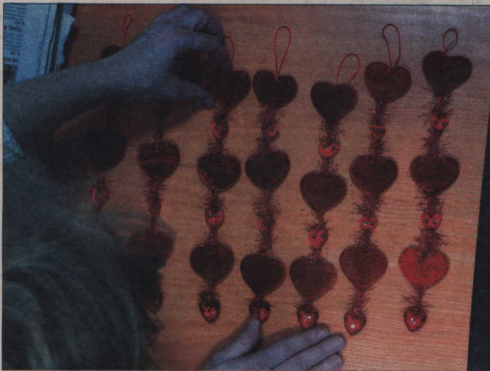
Zapraszamy Czytelników do redakcji - czekają walentynkowe upominki.