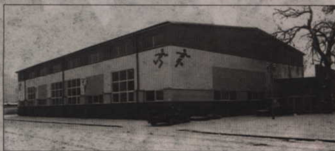
W tegorocznym budżecie zaplanowano m.in. pieniądze na wywiązanie się z ubiegłorocznych obietnic - np. dofinansowania oddanej w ubiegłym roku hali sportowej w Prabutach (500 tys. zł).