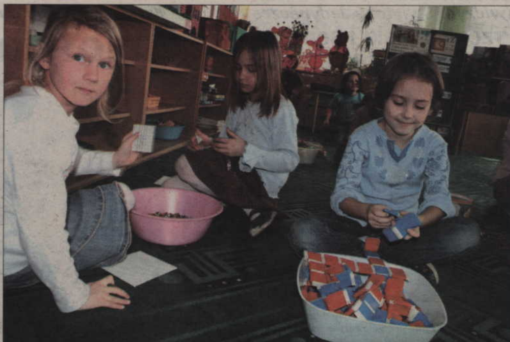
Do Publicznego Przedszkola nr 4 w Prabutach uczęszcza obecnie 121 dzieci. Wszystkie to sześciolatki. Bawią się i uczą według programu „zerówki”.