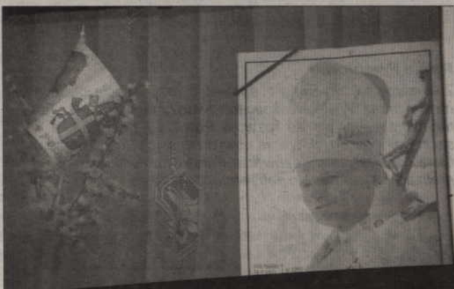
W dniach żałoby wielu kwidzynian ustawiało w oknach swoich mieszkań portrety Jana Pawła II.