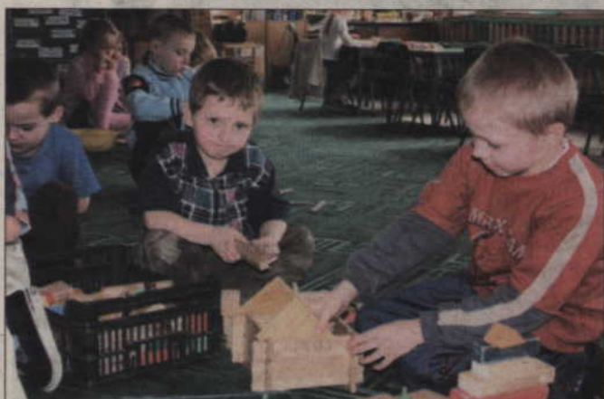
Na razie większość czasu dzieci spędzają w przedszkolu, ale jak tylko pogoda się poprawi, wybiorą się na wiosenną wycieczkę.