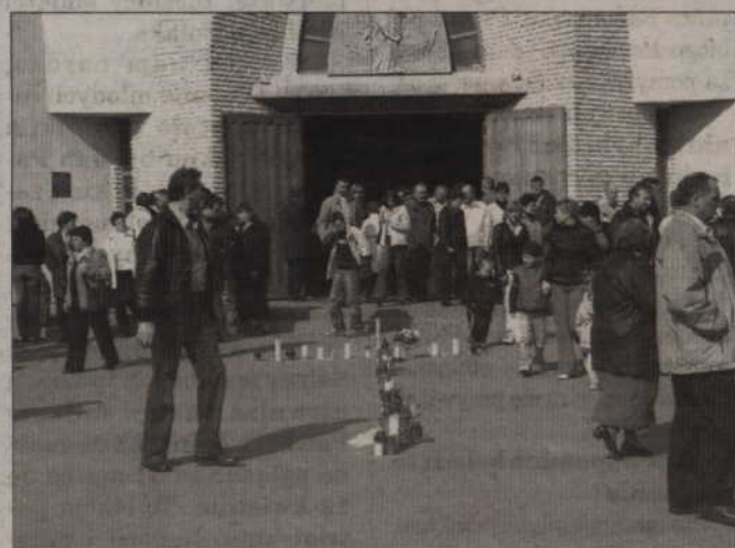
Wierni ułożyli krzyż z płonących zniczy przed kościołem pw. Św. Wojciecha.