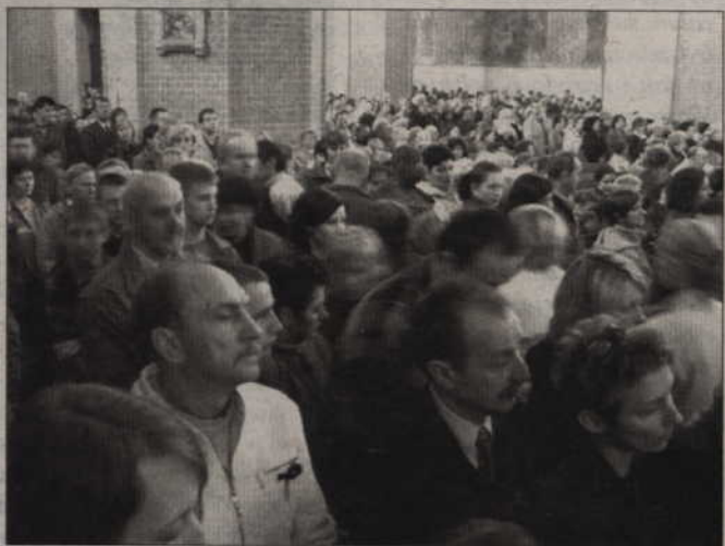
O godz. 21.37 na placu im. Jana Pawła II przed kwidzyńską katedrą planowana jest wspólna modlitwa mieszkańców.