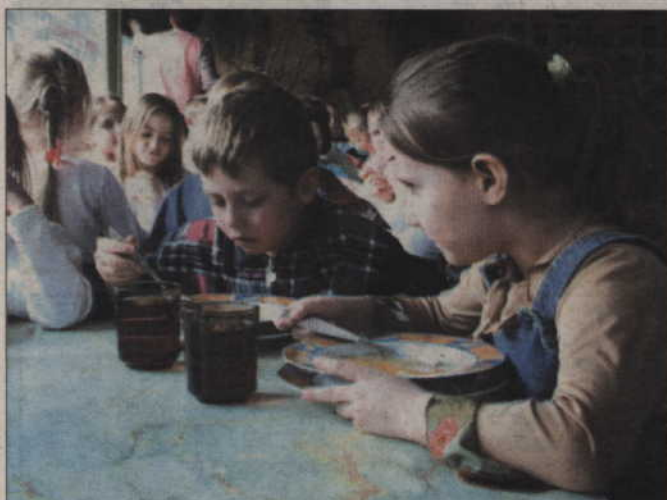
W Prabutach istnieją dwa przedszkola. Do jednego z nich uczęszczają dzieci do piątego roku życia, a do drugiego tylko sześciolatki.