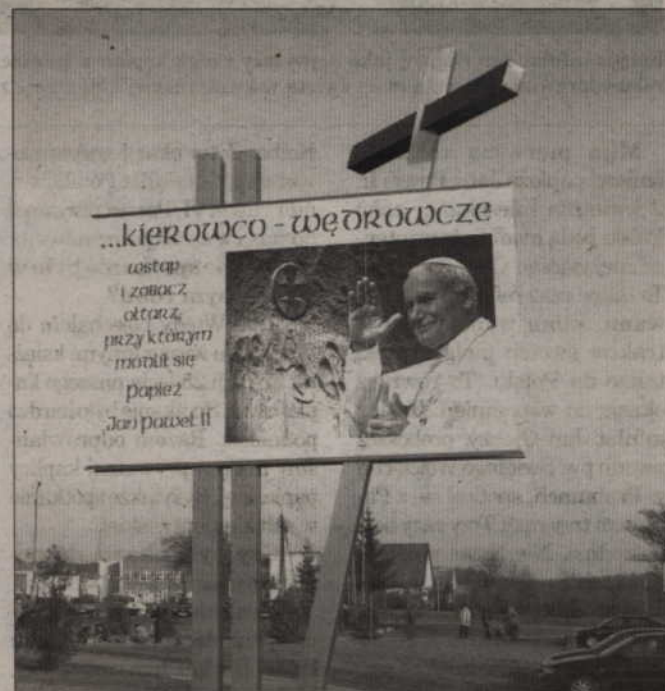
Taką tablicę umieszczono przed kościołem pw. Świętego Wojciecha w Kwidzynie.