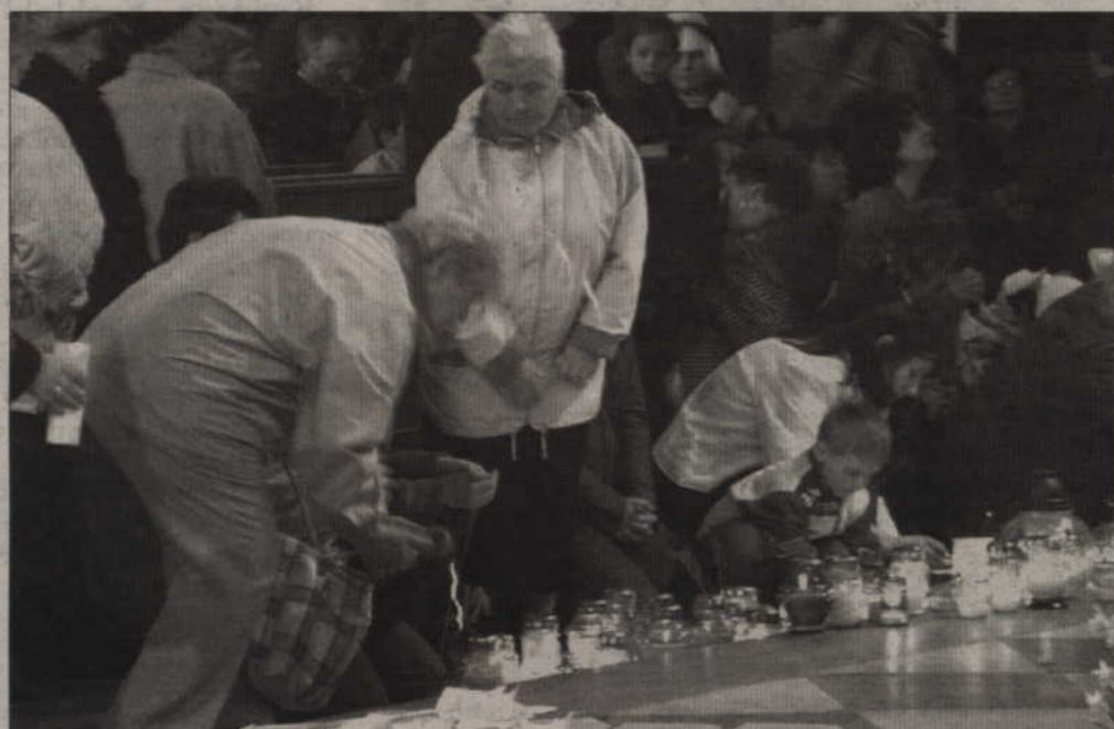
Na wieść o śmierci Papieża w kwidzyńskiej katedrze wyłożono księgę kondolencyjną. Wpisywali się do niej wszyscy uczestniczący w mszy odprawionej za jego duszę.

Kwidzynianie oplakiwali Papieża przez wiele dni. Na wieść o Jego śmierci tłumy wiernych zbierały się w kościołach, w domach. Dużo osób spotkało się na rondzie Jana Pawła II - przez wiele godzin widać było blask zniczy. Wpisywano się do księgi kondolencyjnej w katedrze, modlono w kościele pw. Św. Wojciecha przed ołtarzem, który jest wyjątkową pamiątką po Ojcu Świętym. To przed nim odprawił mszę podczas swojej wizyty w Elblągu w 1999 roku. Potem ołtarz trafił do Kwidzyna. Ludzie przesyłali sobie wzruszające sms-y i maile. Odwołano imprezy rozrywkowe, przed rozgrywkami sportowymi odmawiano wspólnie modlitwy. Smutek, żal, żalobę wyrażano w każdym miejscu, na różne sposoby. W oknach wielu mieszkań pojawiły się portrety Jana Pawła II, znicze, ołtarzy-