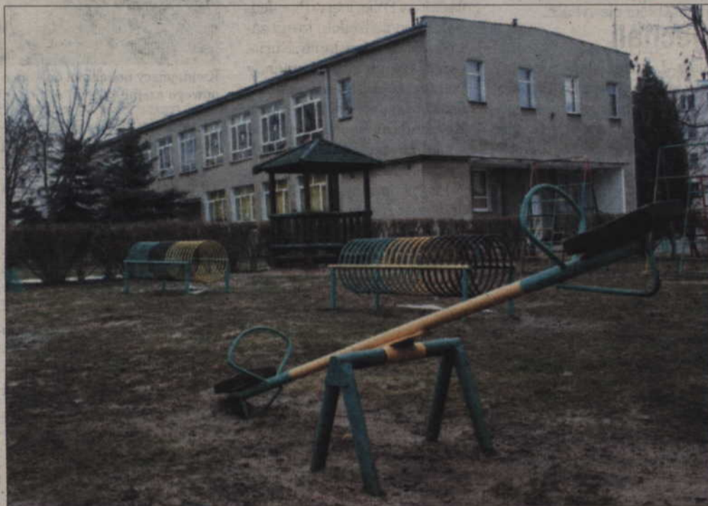
Przedszkole Ekologiczne nie zostało zamknięte. Salę, w której przebywała chora dziewczynka, zdezynfekowano - nie odbywają się tam zajęcia.

-Pierwszy sygnał to wysoka gorączka, podobnie jak podczas przeziębienia. Bar-