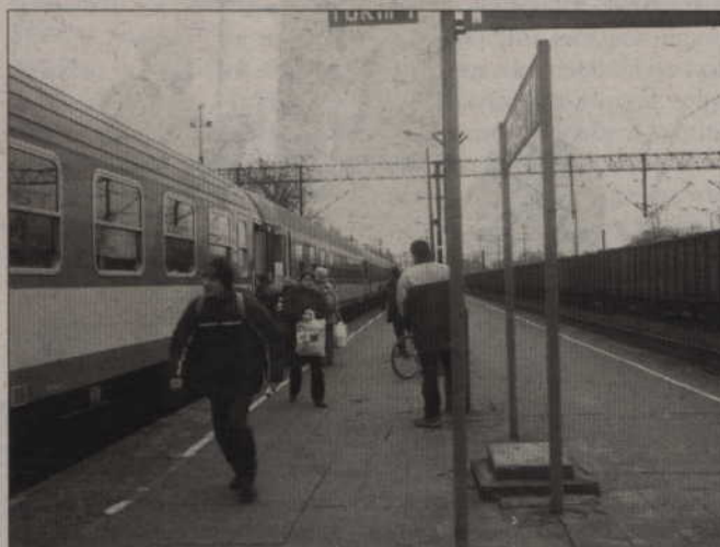
Ani wojewoda pomorski, ani wojewoda warmińsko-mazurski nie będą partycypować w kosztach kursów SKM z Trójmiasta do Iławy. W związku z tym połączeń nie będzie.