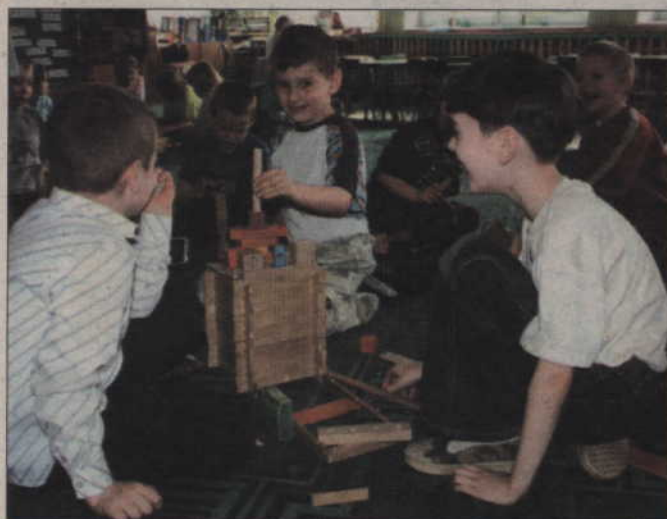
Dzieci uczęszczające do przedszkola podzielono na pięć grup.