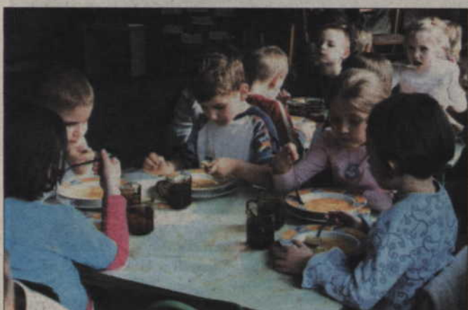
Trzy grupy dzieci spędzają w przedszkolu pięć godzin, a dwie aż dziewięć. Zależy to od czasu pracy ich rodziców.