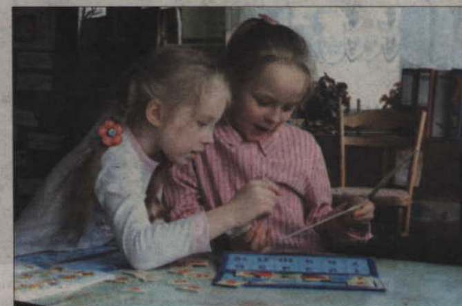
Przedszkolaki wykonują przeróżne ozdoby na święta. Rodzice mogą kupić je za przysłowiową złotówkę. Pieniądze przeznaczone są na wzbogacenie bazy dydaktycznej przedszkola.

Publiczne Przedszkole nr 4 istnieje od 1981 roku. (just)