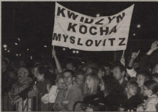
Jak co roku Dni Kwidzyna odbędą się w trzeci weekend czerwca. Gwiazdą ubiegłorocznego święta był zespół Mysłowitzi.

-W tym roku właśnie w tym miejscu planujemy zorganizowanie Festiwalu Piosenki Przedszkolnej. Wcześniej od-