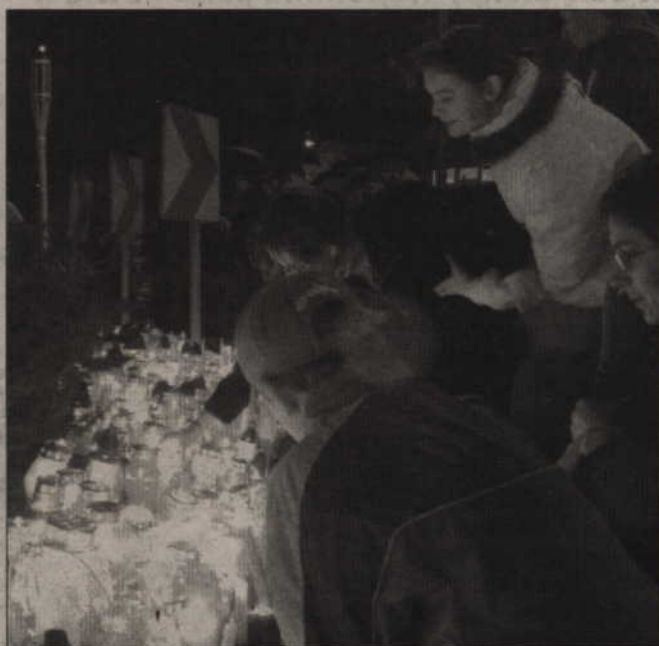
Na rondo Jana Pawła II w dniu śmierci Papieża przysłyły tłumy kwidzyńnian. Policja kierowała ruchem, zorganizowano objazd, by nie przeszkadzać modlącym się.

Kwidzynianie oplakiwali Papieża przez wiele dni. Na wieść o Jego śmierci tłumy wiernych zbierały się w kościołach, w domach. Dużo osób spotkało się na rondzie Jana Pawła II - przez wiele godzin widać było blask zniczy. Wpisywano się do księgi kondolencyjnej w katedrze, modlono w kościele pw. Św. Wojciecha przed ołtarzem, który jest wyjątkową pamiątką po Ojcu Świętym. To przed nim odprawił mszę podczas swojej wizyty w Elblągu w 1999 roku. Potem ołtarz trafił do Kwidzyna. Ludzie przesyłali sobie wzruszające sms-y i maile. Odwołano imprezy rozrywkowe, przed rozgrywkami sportowymi odmawiano wspólnie modlitwy. Smutek, żal, żalobę wyrażano w każdym miejscu, na różne sposoby. W oknach wielu mieszkań pojawiły się portrety Jana Pawła II, znicze, ołtarzy-