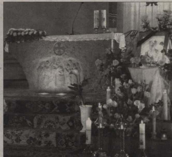
W kwidzyńskim kościele pw. Świętego Wojciecha znajduje się ołtarz przed którym modlił się Jan Paweł II podczas swojej wizyty w Elblągu. Po jego śmierci kwidzynianie czuwali przed nim przez wiele godzin.