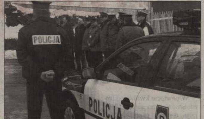
Kwidzyńscy policjanci do końca tygodnia poznają nazwisko swojego nowego szefa.

W tym samym czasie z pracy w pomorskiej policji odeszło kilku innych komendantów powiatowych (m.in. Malborku, Lęborku, Człuchowie, Wejherowie, Pruszcz Gd., Tczewie). Ma to związek z rządowymi planami „oczyszczenia” policyjnych szeregów z byłych funk-