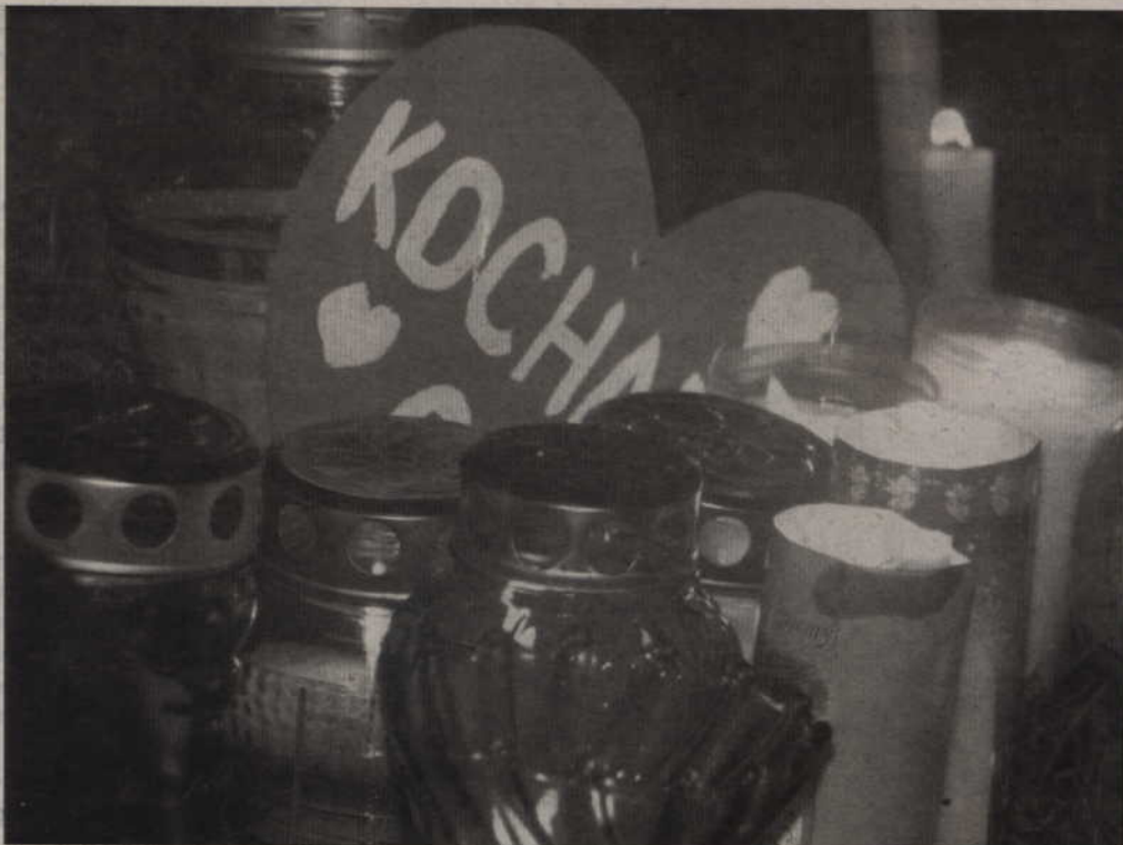
Ojciec Święty pozostanie na zawsze w sercach wielu ludzi. To zdjęcie nasz reporter wykonał rok temu w maju podczas wspólnej modlitwy kwidzyńian na rondzie Jana Pawła II.