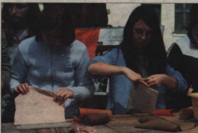
Jak się okazuje, czerpanie papieru nie jest takie trudne. Każdą kartkę można ciekawie ozdobić.

– Mnóstwo osób chce uczyć się wykonywać papier w tradycyjny sposób. Podobne zajęcia prowadzimy przez cały rok, np. z Zielonej Szkoły w Rodowie. Zapraszamy nas organizacje z całego kraju, np. ze Śląska, by pojechać do nich i pokazać, jak to się robi. Ja nauczyłem się tego od kolegi, który chodził do technikum papierniczego w Kwidzynie. Wiem, że na Kaszubach odbywają się podobne warsztaty, mamy kontakt ze stowarzyszeniem, które je prowadzi. Robienie papieru z makulatury jest proste, mamy własny warsztat. Jednak najważniejsza jest idea – papier czerpany jest ekologiczny, robi się z makulatury, a nie z drewna.