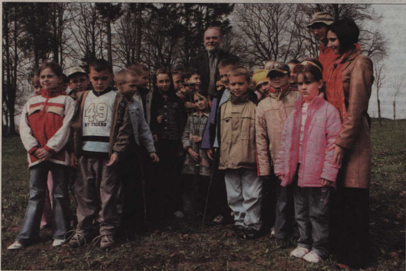
Uczniowie klasy II b Szkoły Podstawowej nr 2 posadzili drzewka za Urzędem Miejskim i nadali im oryginalne imiona. Pomagał im wiceburmistrz Piotr Halagiera i Dominik Sudół ze Stowarzyszenia „Eko-Inicjatywa”.