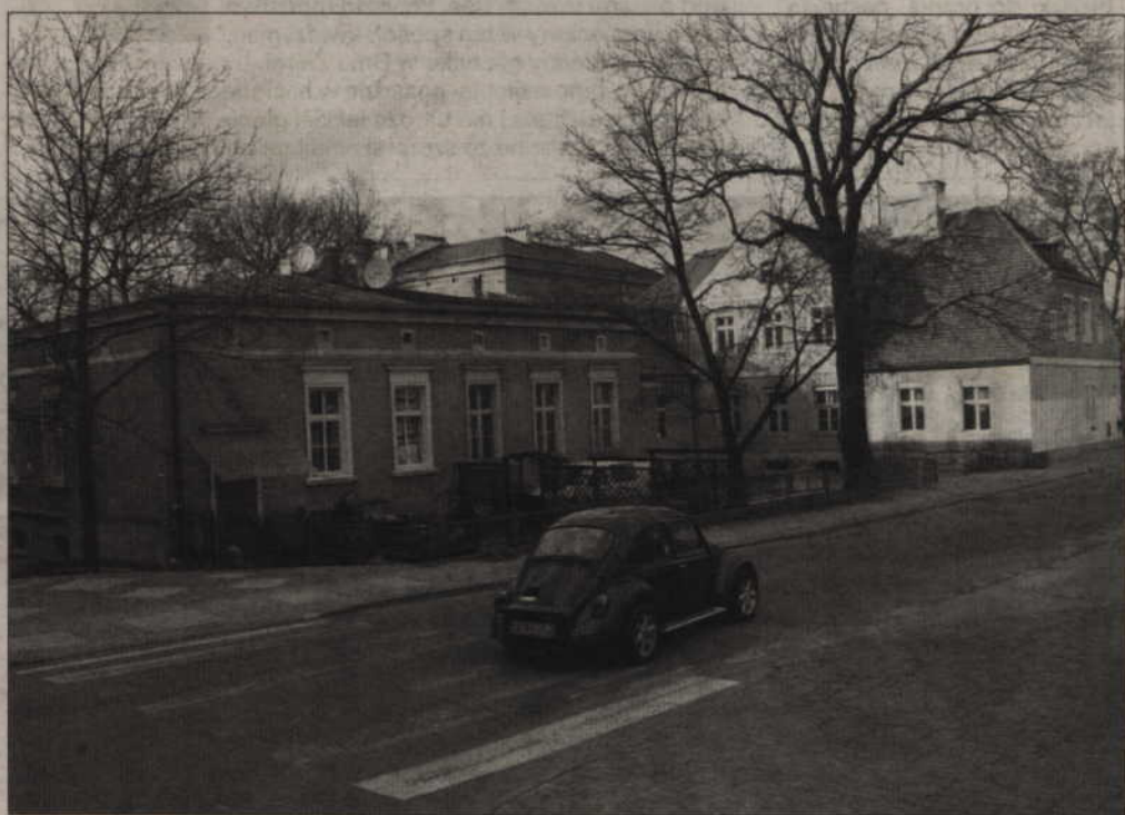
Sala gimnastyczna dla Zespołu Szkół Ponadgimnazjalnych nr 2 w Kwidzynie mogłaby powstać w odbudowanym budynku gospodarczym szkoły.

-Odtworzony zostałby dawny budynek gospodarczy Pałacu Fermora. Linia zabudowy jest widoczna do dzisiaj. Zostały bowiem fundamenty dawnego budynku gospodarczego. Hala mogłaby mieć rozmiary