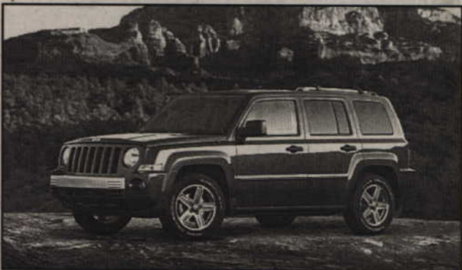
Już za rok będzie można kupić tego jeepa w Europie.

kompaktowych rozmiarów zewnętrznych, Patriot zapewnić ma wysoki komfort podróżowania, czego wyrazem jest, że pasażerowie tylnej kanapy dysponują przeszło metrową przestrzenią na nogi. Po złożeniu tylnej