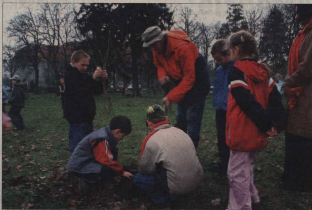
Klara, Sonia, Karol i Królewicz to niektóre z imion, jakie nadali swoim drzewom dziewięcioletni uczniowie Szkoły Podstawowej nr 2.