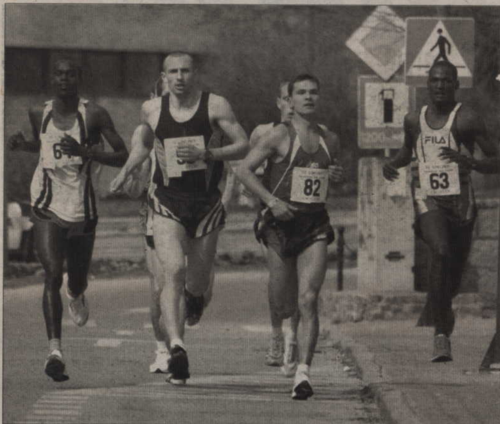
Już po raz trzeci ulicami Kwidzyna pobiegli lekkoatleci w ramach Ogólnopolskiego Biegu Unijnego. Największe tempo miała rywalizacja w Dużym Biegu Unijnym, gdzie faworytami byli Kenijczycy.

-Oczywiście nie licząc kobiet, które też mnie wyprzedziły – śmieje się zawodnik. – Większość uczestników trenuje jednak biegi na co dzień, a ja gram tylko w koszykówkę. Tam się tyle nie biega. Poza tym nie trenując lekkoatletyki, nie potrafię rozdysonować sił. Oni to wiedzieli, kiedy pobiec lżej, a kiedy przyspieszyć. Ja zacząłem zbyt szybko i potem zabrakło mi sił.