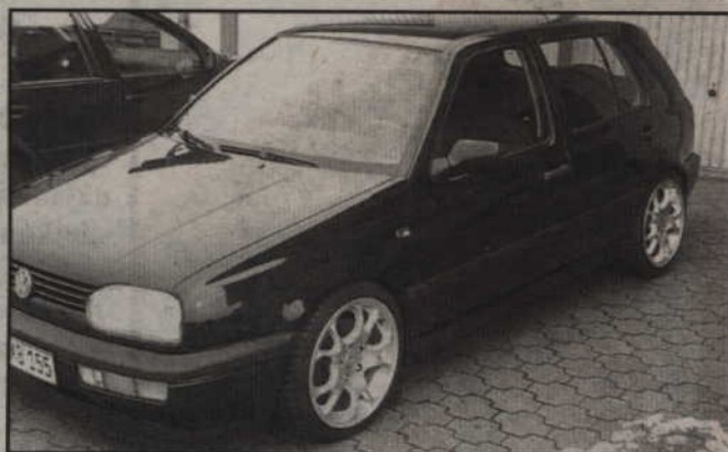
Za najpopularniejszego golfa z 1993 roku zapłacimy teraz 17 razy więcej.

Do zastąpienia akcyzy podatkiem ekologicznym przyszedł już rząd Marka Belki w 2005 r. ale Sejm jednomyślnie odrzucił ten pomysł. Dzisiaj nowy podatek ma zapewnić budżetowi dochody na takim poziomie jak zlikwidowana akcyza. Obecnie jest to prawie 1 mld zł rocznie.