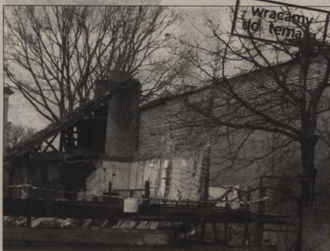
Dom przy ul. Szkolnej w Prabutach, w którym wybuchła butla z gazem, został doszczętnie zniszczony. Poparzony mężczyzna, który tam mieszkał, otrzyma lokal od gminy.

Przypomnijmy. Nocą, w domu przy ulicy Szkolnej w Prabutach, wybuchła butla z