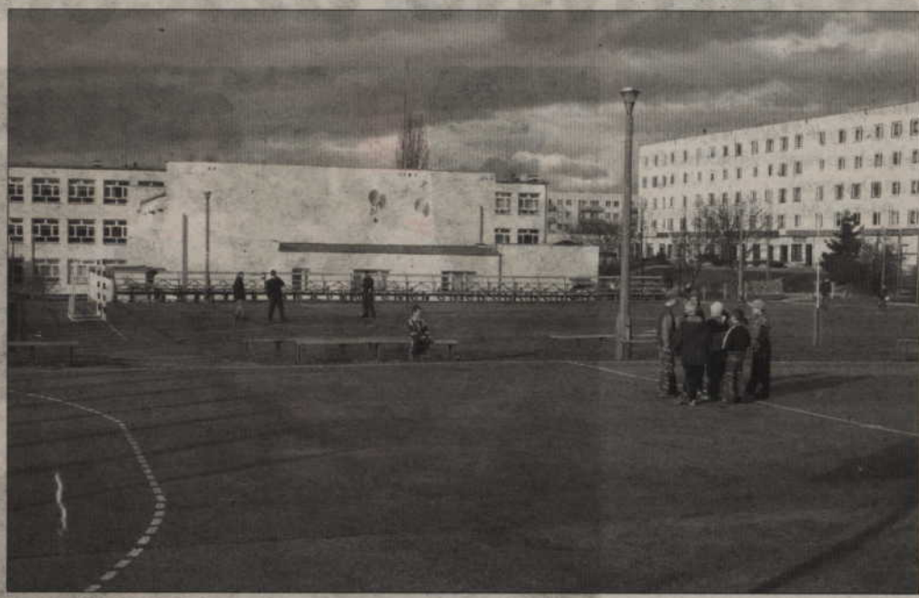
Przy każdej kwidzyńskiej podstawówce i gimnazjum mają powstać boiska do siatkówki, koszykówki i piłki ręcznej, a także bieżnia z małymi trybunami. Wkrótce rozpocznie się remont infrastruktury sportowej w Gimnazjum nr 3 (na zdjęciu).

-Modernizacja obejmie Szkołę Podstawową nr 6. Przygotujemy także projekt techniczny remontu boisk przy Gimnazjum nr 3. Co roku zamierzamy modernizować boiska przy jednej z naszych szkół - mówi Roman Bera, wiceburmistrz Kwidzyna.