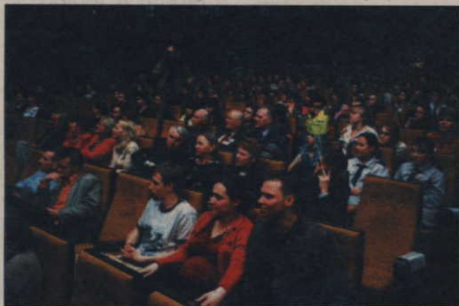
Na widowni zmieni się układ foteli - obecny nie jest zgodny z aktualnymi przepisami przeciwpożarowymi. Teatr będzie miał też nowoczesny sprzęt nagłaśniający.

Na modernizację teatru zaplanowano w budżecie miasta ok. 3 mln zł, w tym