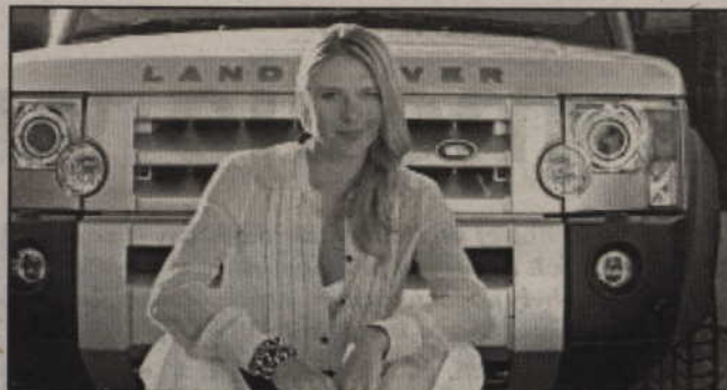
Szarapowa dla Forda

W Polsce przeciętny samochód ma 11 lat, nie spełnia więc żadnych europejskich norm toksyczności spalin. Propozycje podatkowe Komisji Europejskiej nie są dostosowane do polskich warunków. Pobór niewielkiej wysokości podatku od właścicieli ponad 11 mln samochodów w Polsce byłby też bardzo kosztowny. A jeśli chodzi o propozycje UE, to w ogóle nie wiadomo, czy wejdą one w życie. Dyrektywy dotyczące podatków wymagają jednomyślności, także zgody Polski. Obecny projekt podatku ekologicznego był konsultowany z UE i nie budzi zastrzeżeń Brukseli. Czy nie budzi on także zastrzeżeń polskich kierowców? (k.)