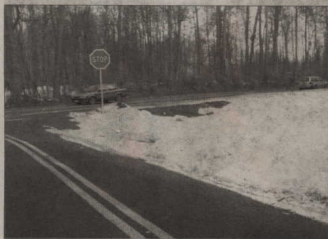
Mieszkańcy Gilwy mogą już bez problemów dojeżdżać do pracy w Kwidzynie. Do niedawna droga we wsi zniszczona była przez ciągniki jadące do Zakładu Utylizacji Odpadów.

Przypomnijmy. W podprabuckiej Gilwie jest droga,