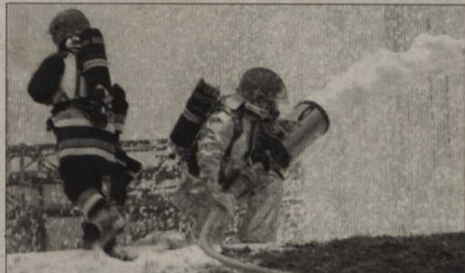
Strumień wody był na tyle silny, że ogień nie zdążył się rozprzestrzenić.