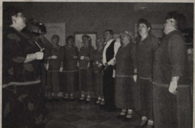
W najbliższą sobotę na deptaku przy ul. Piłsudskiego po raz pierwszy w Kwidzynie odbędzie się festiwal ludowych kapel. Organizuje go kwidzyński zespół Powiślanki.

często jeżdżą na festiwale organizowane w różnych zakątkach kraju, czasem bardzo odległych. Są zachwycone takim imprezami i dlatego postanowiły zorganizować podobną u siebie. W organizację włączyło się Kwidzyńskie Centrum Kultury. Festiwal odbywał się będzie podczas organizowanych już od kilku lat Targów Starości na kwidzyńskim deptaku. (ad)