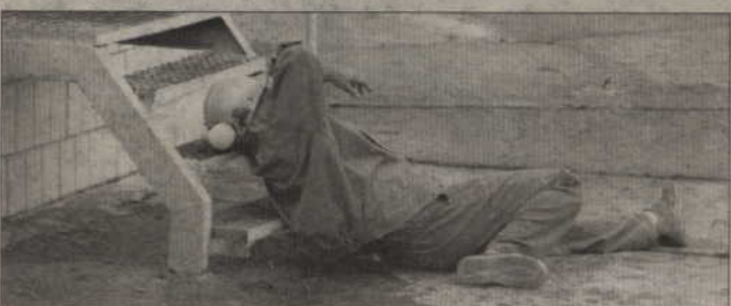
Kolejny poparzony pracownik czeka na pomoc ratowników.