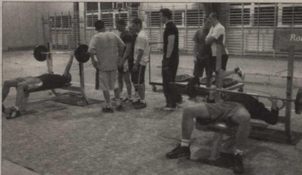
Prabuty słyną z silnych mężczyzn. W zawodach w wyciskaniu sztangi wzięło udział wiele młodych osób. Jak się okazuje, nieliczni uczęszczają na siłownię, która funkcjonuje w miejskiej hali.

-Gdy budowano halę w Prabutach, wóldarze wcięż, że powstanie ona dla mieszkańców. Każdy miał mieć do niej dostęp i możliwość korzystania. Oczywiście nikt nie zabrania tam chodzić, ale obowiązujące ceny sprawiają, że tylko niektórzy mogą pozwolić sobie na aktywny wypoczynek w hali – zadzwonił do nas Czytelnik, który prosił o zachowanie anonimowości.