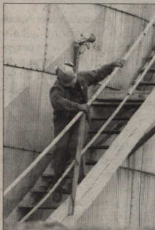
Ludzie obsługujący zbiornik zostali ranni. Jednak udało im się zejść o własnych siłach....