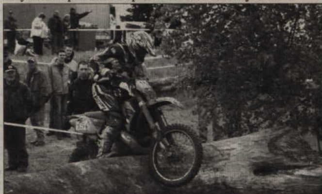
Największym utrudnieniem trasy była próba extreme. Zawodnicy pokonywali drewniane bale z wielkim trudem.