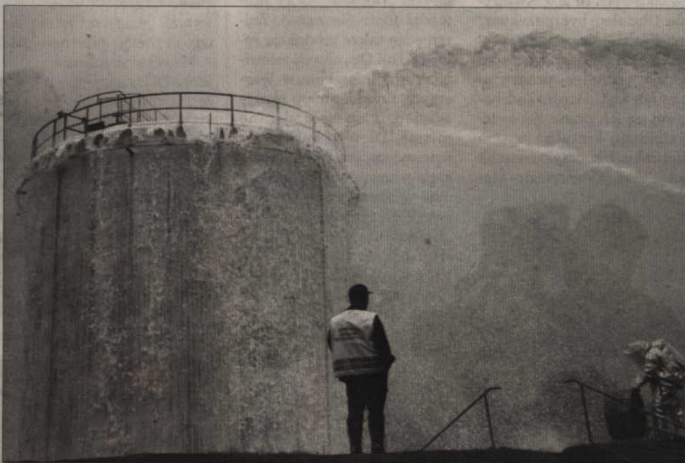
Aby ugasić „pożar”, trzeba było zużyć hektolitry wody i piany.