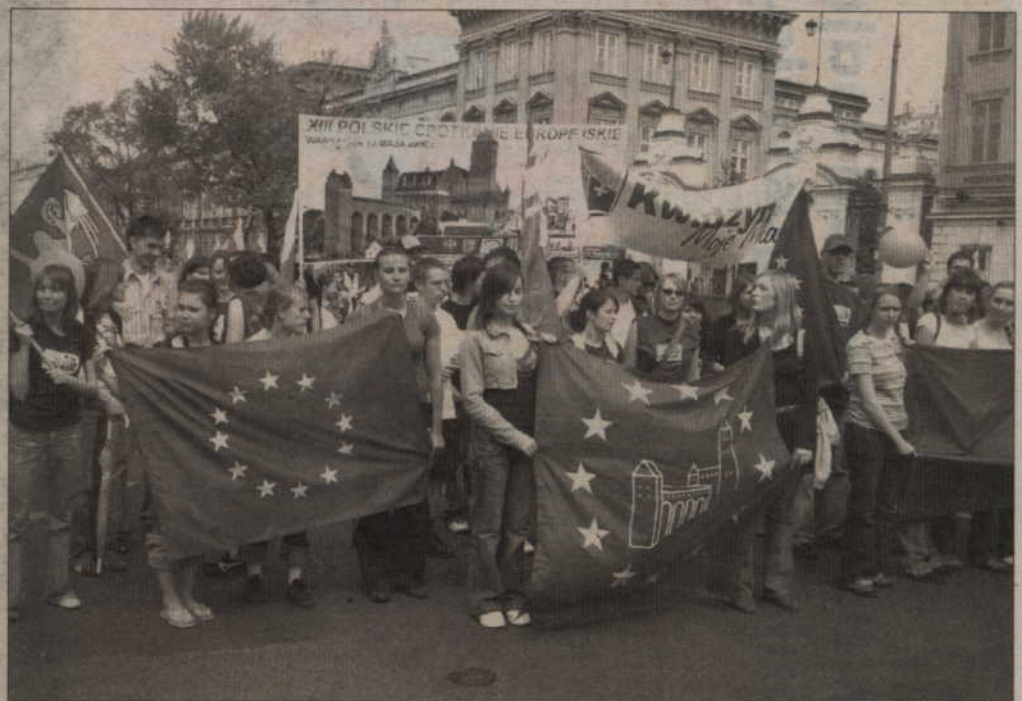
Ponad 60 młodych ludzi z powiatu kwidzyńskiego wzięło udział w Paradzie Schumana w Warszawie.

Ponad 60 młodych ludzi z powiatu kwidzyńskiego wzięło udział w Paradzie Schumana w Warszawie. Hasłem tegorocznego spotkania młodzieży z krajów europejskich było „Każy inny, wszyscy równi”. Głównym celem było szerzenie postaw równości wśród młodych ludzi, a także solidarności między partnerami Unii Europejskiej. Parada organizowana jest przez Polską Fundację im. Roberta Schumana w ramach Polskich Spotkań Europejskich. Wyjazd młodzieży sfinansowały samorządy Kwidzyna oraz powiatu kwidzyńskiego. W imprezie wzięła udział młodzież z Europejskiego Centrum Młodzieży i Wolontariatu oraz Klubów Europejskich, działających przy I i II Liceum