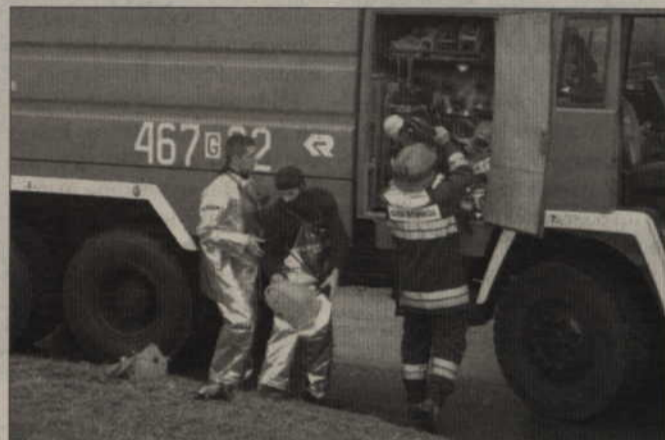
Strażacy rozpakowują sprzęt niezbędny do akcji ratowniczej.

nia służb ratowniczych. W tym roku przeprowadzono je pod kryptonimem „Papiernik 2006”. Rok temu dobywały się na terenie zakładu energetycznego. Zorganizował je burmistrz Kwidzyna, starosta oraz prezes IP. Ćwiczeniom przyglądali się wódcy, przedstawiciele wielu instytucji, firm, policjanci, a także radni. Dziś przedstawiamy fotograficzną kronikę tej efektownej akcji. (fox)