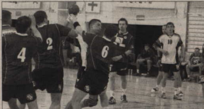
Mecz ze Śląskiem zadecyduje o V miejscu w ks. mężczyzn.