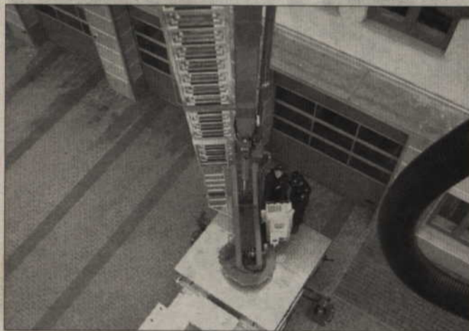
Nasz reporter miał okazję wnieść się na hydraulicznym podnośniku na wysokość 25 metrów.