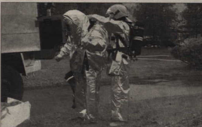
Gaszący pożar strażacy musieli założyć specjalne stroje – chroniące przed wysoką temperaturą.