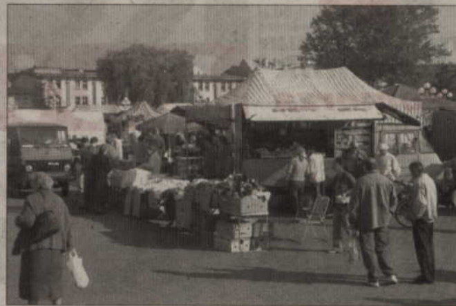
Gdy na dworze robi się ciepło, kieszonkowcy stają się bardzo aktywni. Zwykle działają w zatłoczonych miejscach, m.in. na miejskich targowiskach.