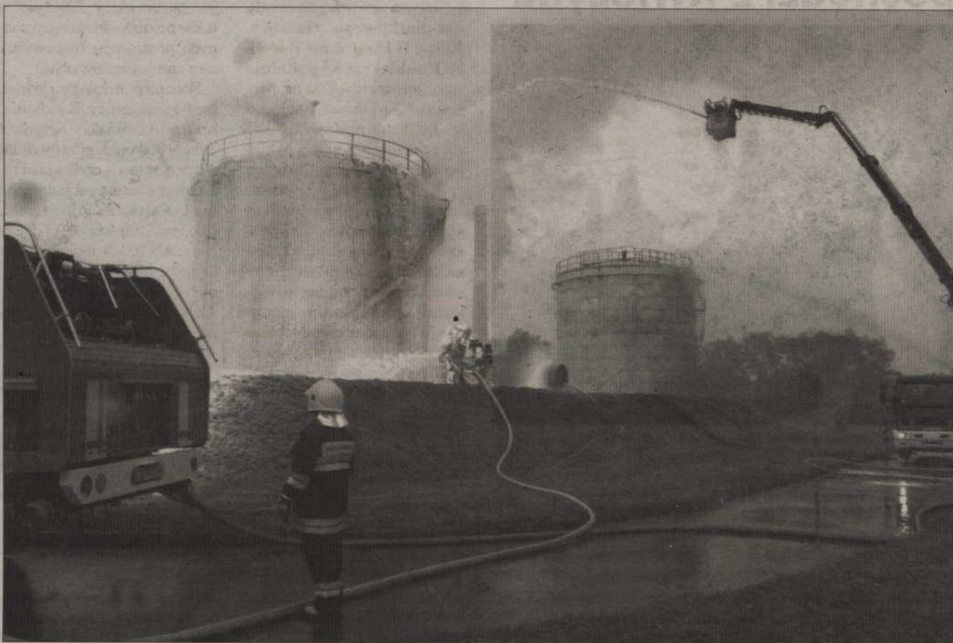
Widok na miejsce akcji – tak wyglądały „płonące” zbiorniki z paliwem.