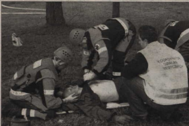
Natychmiast udzielono im pomocy medycznej.