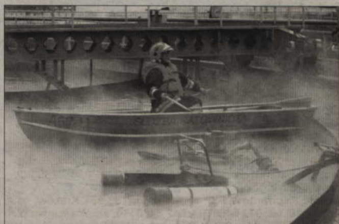
Ubrani w specjalne ochronne stroje usuwali z tafli wody paliwo, które wyciekło z uszkodzonego zbiornika.