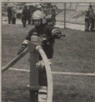
Natychmiast uruchomiono dopływ wody, by móc ugasić pożar.