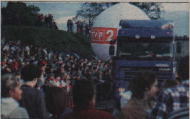
Wszyscy żywiołowo kibicowali kierowcom, którzy brali udział w wykonaniu trudnego zadania.