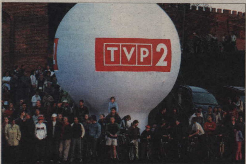
Pracę ekipy telewizyjnej przyszło obejrzyć wielu kwidzyńskim.