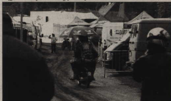
Natomiast ci, którzy musieli zejść z trasy wcześniej, chronili się przed padającym deszczem. Jak widać parasol jest niezbędny także dla motocyklistów.