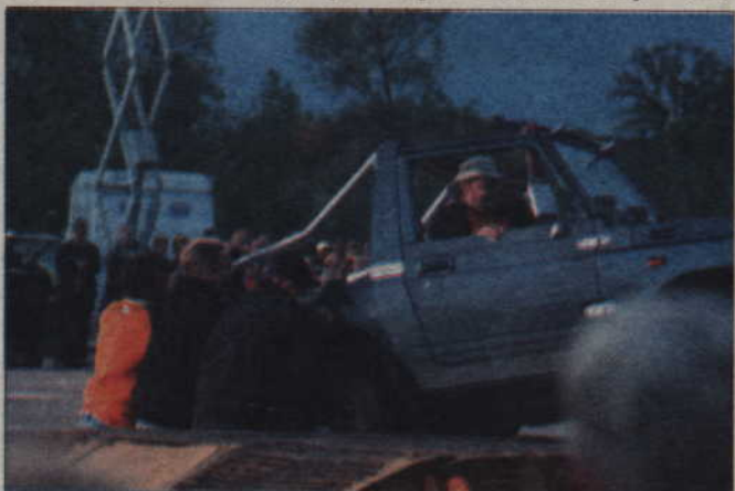
Podczas wykonywania zadania był jeden groźny moment – tył samochodu terenowego spadł z lawety. Na szczęście pomogli członkowie ekipy telewizyjnej.