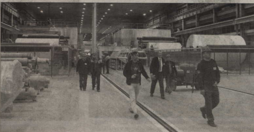
Obserwatorzy ćwiczeń mieli okazję zwiedzić hale produkcyjne International Paper.