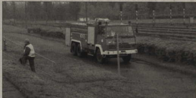
Na sygnał o pożarze paliwa w ogromnych zbiornikach do akcji wyszli strażacy.