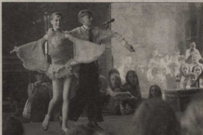
Na koniec na scenie zaprezentowali się również tancerze kwidzyńskiego klubu Progress oraz zaproszeni goście.