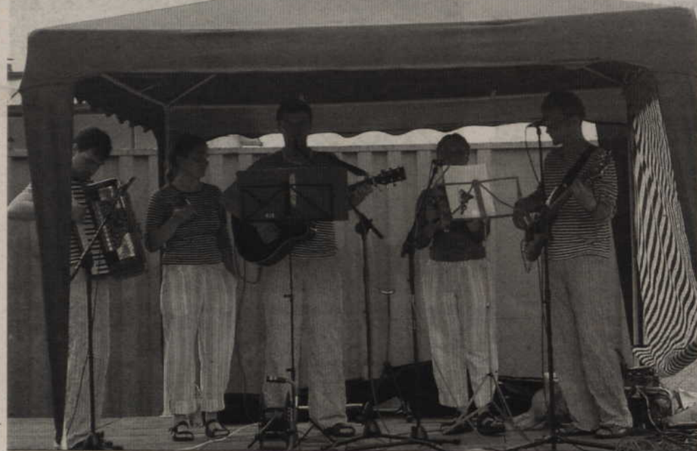
Na scenie wystąpił zespół Cztery Wanty, który dla zgromadzonej publiczności zaśpiewał szanty.

Jeszcze w XVIII wieku mieszkańcy Korzeniewa żyli z połowu ryb. Rybackie łodzie docierały do Morza Bałtyckiego. W ubiegłym roku postanowiono przypomnieć związki sołectwa z morzem i zorganizowano Dni Morza, imprezę otwartą dla wszystkich. Kolejne morskie święto w Korzeniewie odbyło się w miniony weekend.