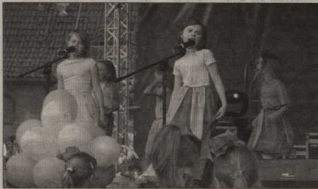
Niedziela rozpoczęła się Festiwalem Piosenki Dziecięcej...