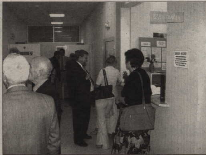
W powiecie kwidzyńskim jest 45 poradni specjalistycznych. W większości z nich na wizytę u lekarza trzeba czekać wiele tygodni.

-I tak przyjmowanych jest więcej osób, niż zaplanowano. Poradnia zamierza ubiegać się o zwiększenie limitu określonego w kontrakcie z Narodowym Funduszem Zdrowia. Około trzech miesięcy czeka się na wizytę w poradniach okuli-