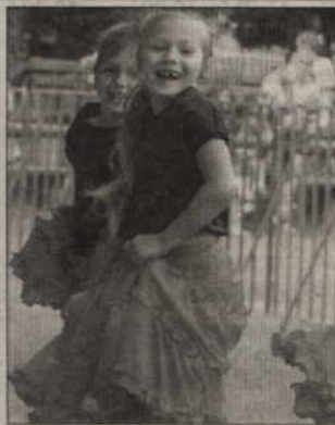
... a piosenki porwały do tańca.