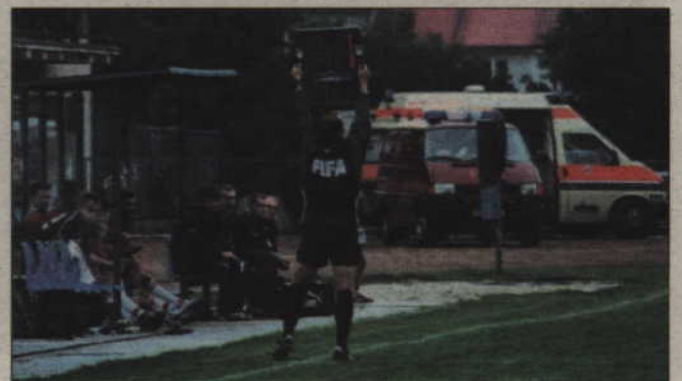
Sędzia techniczny wskazuje, o ile minut sędzia przedłużył pierwszą połowę meczu.