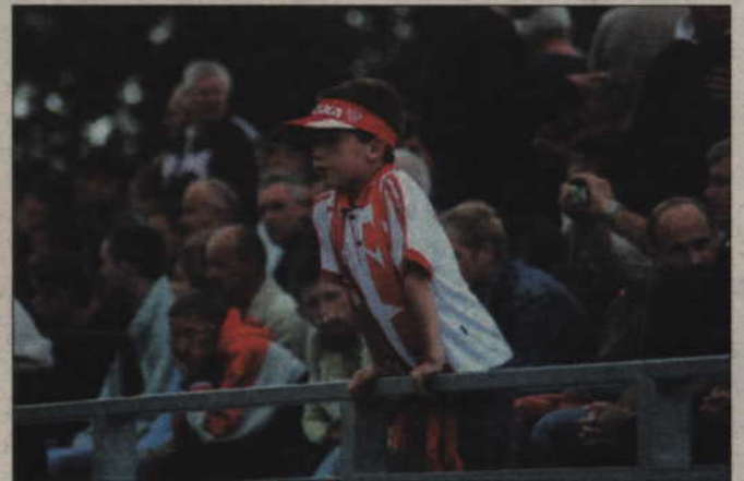
Trybuny kwidzyńskiego stadionu wypełniła spora grupa kibiców. Spotkanie Polska-Norwegia było swoistą inauguracją przed rozpoczęciem III-ligowych bojów kwidzyńskiego Rodła.