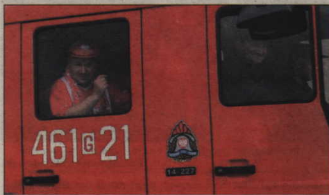
Prawdziwych kibiców widać było na każdym kroku. Nawet w wozie Państwowej Straży Pożarnej.