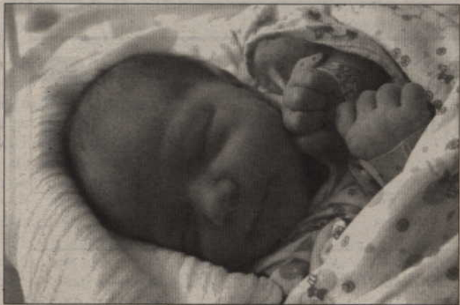
Córka Zbigniewy i Tomasza Śliwińskich z Bronisławowa, przyszła na świat 8 sierpnia o godz. 10.50 (waga: 3,35 kg, długość: 54 cm).