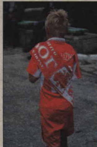
Każdy szanujący się kibic posiadał koszulkę lub szalik. Niektórzy przyszli na mecz ubrani niemal od stóp do głów w barwy biało-czerwone.