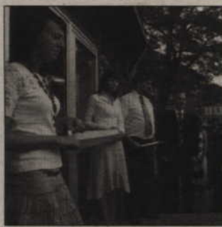
Nowe biuro kwidzyńskiego Prawa i Sprawiedliwości mieści się przy ul. Targowej.

Punkty Obsługi Wyborców to miejsca informacji i pomocy obywatelom w sprawach związanych z funkcjonowaniem instytucji państwowych i samorządowych. Punkty mają na celu wspieranie inicjatywy