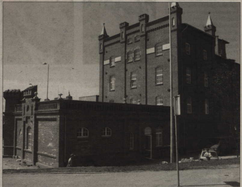
Zabytkowy młyn przy ul. Kościuszki to udany przykład adaptacji budynku historycznego do celów handlowych.