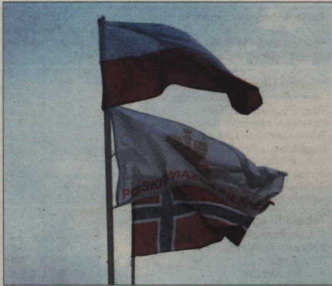
Nad kwidzyńskim stadionem załopotały flagi Polski i Norwegii.