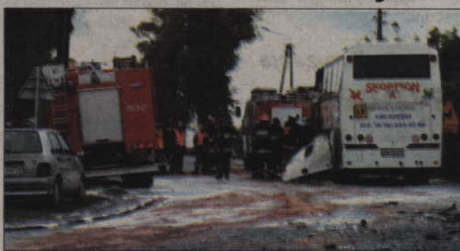
W wypadku autokaru w Gardeji zginęła jedna osoba, a kilkanaście zostało ciężko rannych.

wista, bo kilkanaście osób odniosło obrażenia trwające powyżej 7 dni (złamania kończyn), sprawę musi zbadać bie-