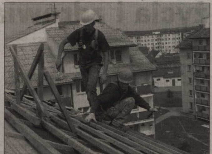
Rada powiatu kwidzyńskiego podjęła uchwałę, która umożliwi dofinansowanie 80 proc. kosztów składowania materiałów budowlanych zawierających azbest.

-Jest to ok. 2 ton eternitu. Całkowity koszt składowania będzie wówczas wynosił ok. 525 zł, w tym ok. 400 zł to