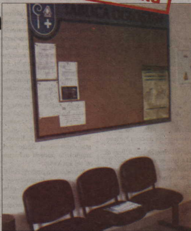
62-letni mężczyzna oblał się benzyną i groził, że się podpali przed gabinetem burmistrza. Teraz grozi mu do 8 lat więzienia za narażenie ludzi na niebezpieczeństwo.