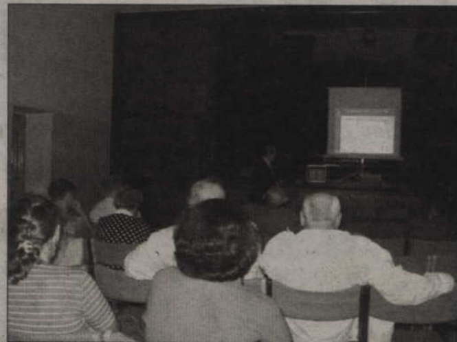
Mimo dużego zainteresowania sprawą pociągów zatrzymujących się w Prabutach, niewiele osób przyszło na zebranie dotyczące zmian w rozkładzie jazdy, jakie będą obowiązywać od grudnia.

Zebrani proponowali, które pociągi mają być utrzymane, np.: ok. godz. 17 czy o 18. Zastanawiali się także nad Szybką Ko-