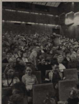
Jeśli remont teatru nie rozpocznie się w tym roku, przypadnie dotacja z ministerstwa kultury. Wszystko wskazuje jednak na to, że sprawa zakończy się pomyślnie.

ponad 5 mln zł. Na modernizację teatru zaplanowano w budżecie miasta ok. 3 mln zł, w tym 750 tys. zł to dotacja z ministerstwa kultury. 2 mln zł w formie darowizny przekaże International Paper. Budynek teatru oddano do użytku na początku lat 80. Od tego czasu nie był remontowany. Modernizacja ma poprawić funkcjonalność obiektu i bezpieczeństwo widzów. Fotele zostaną rozmieszczone w taki sposób, aby w razie zagrożenia widowie mogli bezpiecznie opuścić salę. Nie zmieni się liczba miejsc na widowni - obecnie spektakle lub filmy może oglądać 358 osób. (ad)