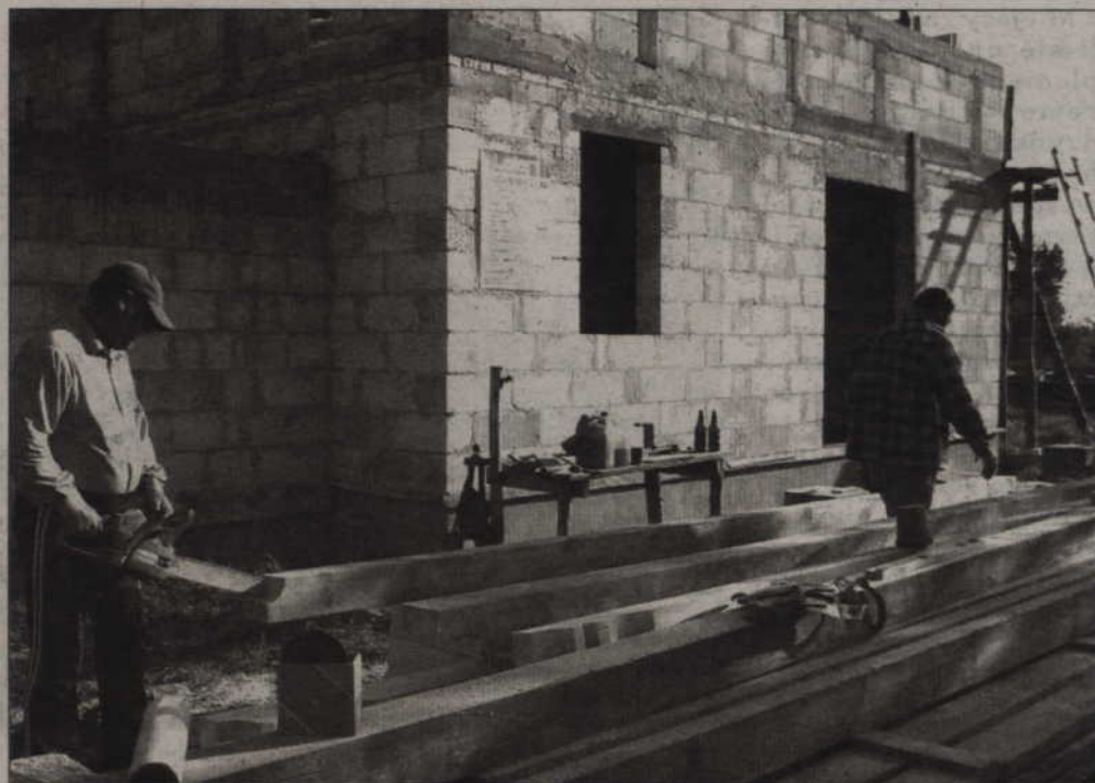
Nieporozumienia między właścicielką drogi a gminą sprawiły, że działki na ul. Spokojnej nie są uzbrojone, mimo iż już do czterech domów mieszkańcy chcą się wprowadzać.

- Inni właściciele działek i drogi zgodzili się, aby przez ich teren przeprowadzić wodociąg. W związku z tym rozpocznie-