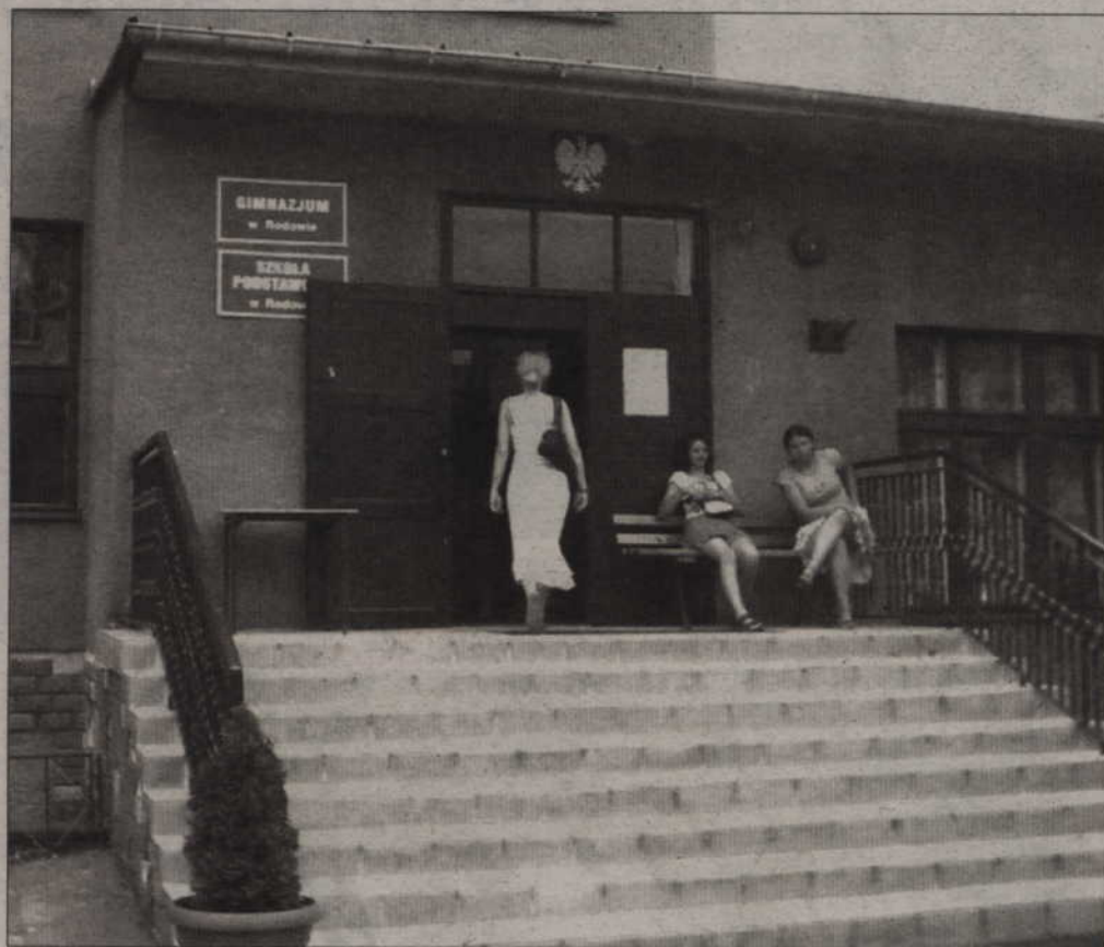
W wyniku zmian w Karcie Nauczyciela, pięciu nauczycielom pracującym w szkołach na terenie gminy Prabuty wypowiedziano warunki pracy z powodu braku odpowiedniego wykształcenia.