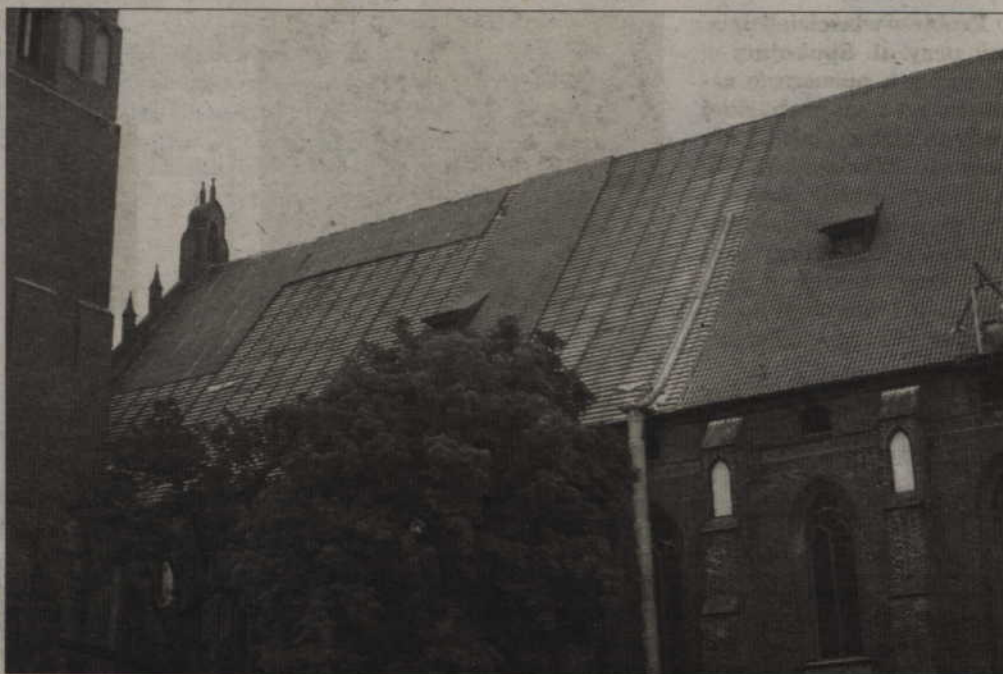
Trwa remont dachu na kwidzyńskiej katedrze. Wymiana pokrycia dachu była niezbędna - był w tak złym stanie, że zagrażało to zgromadzonym w środku cennym pamiątkom.