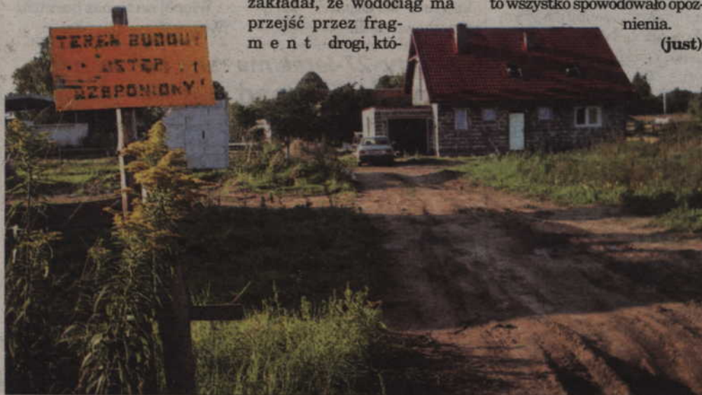
Na ul. Spokojnej powstają domy. Właściciele czterech z nich chcą się już wprowadzać, ale, jak się okazuje, nie ma tam ani wody, ani kanalizacji czy też światła.