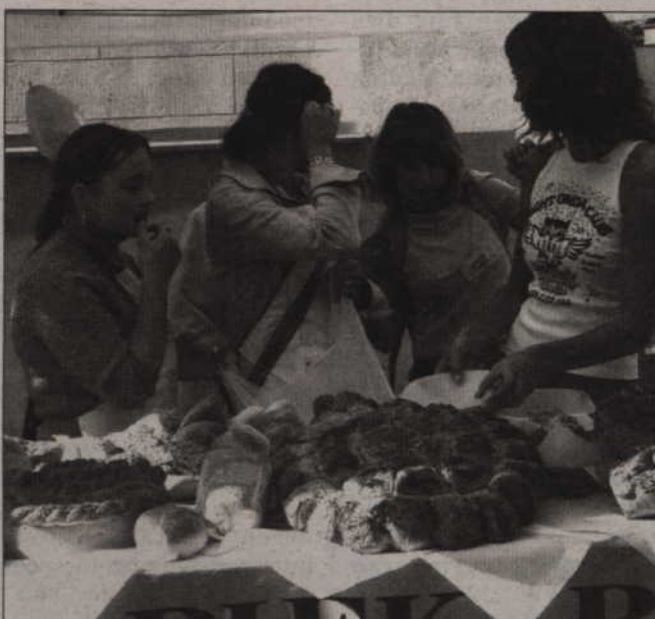
W sobotę na deptaku będzie można skosztować oryginalnych wypieków kwidzyńskich piekarzy.

– Taka wyprawka składa się z plecaka, zeszytów, ołówków,