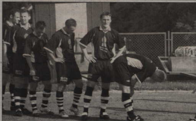
Piłkarze Rodła przegrali kolejne spotkanie ligowe. Kotwica wykorzystała wszystkie słabe punkty kwidzyńskiej drużyny.

Kotwica Kołobrzeg – Rodło Kwidzyn 3:0 (1:0) Rodło: Żuk – Świokło, Paweł Pagieta, Godlewski, Piotr Pagieta, Duszyński (75' Sontowski), Jędrzejewski, Alfred (46' Pekrun), Wilk (70' Jaworski), Sulej, Kobus.