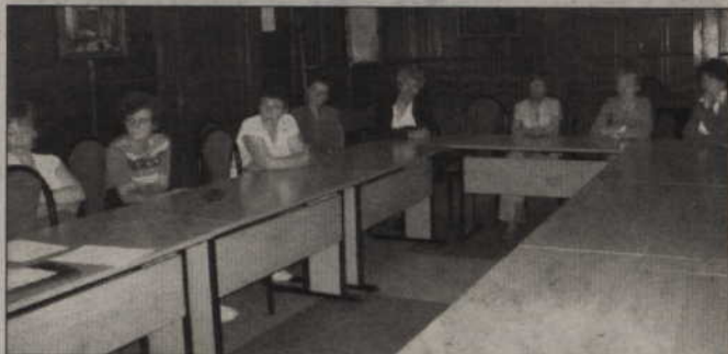
Zabrakło trzech osób, by podjąć formalne kroki do założenia stowarzyszenia na rzecz osób niepełnosprawnych. Zainteresowani jednak nie poddają się. Kolejne spotkanie odbędzie się we czwartek.