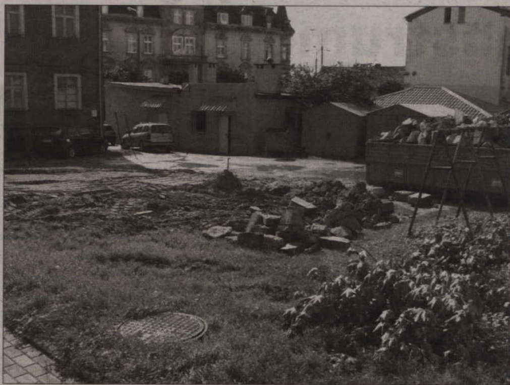
Resztki rozebranego baraczkę przy ul. 15 Sierpnia szpecą centrum miasta. Straż Miejska prowadzi postępowanie wobec właściciela posesji.

-Ten budynek należał do spółdzielni ogrodniczo – pszczelarskiej i to ona ma obowiązek zadbać o uprzątnię-