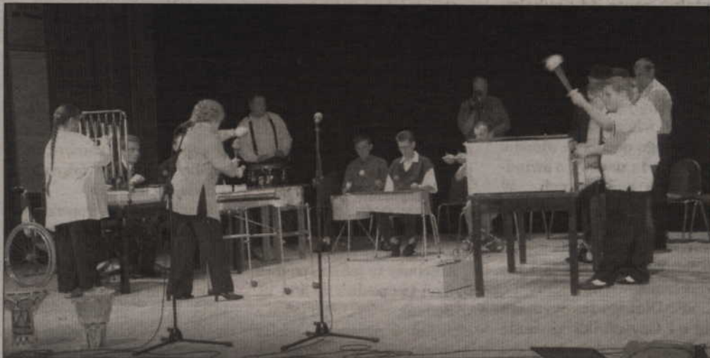
Gliniane instrumenty, na których grają uczestnicy tczewskiego Warsztatu Terapii Zajęciowej, zostały wykonane z gliny.

Warsztat Terapii Zajęciowej przy Kole Polskiego Stowarzyszenia na rzecz Osób z Upośledzeniem Umysłowym w Tczewie powstał w w1993 roku. Początkowo tułali się po różnych obiektach, wkrótce jednak samorząd Tczewa w 1994 roku użyczył im budynek. WTZ miał go użytkować przez 15 lat. W tym roku nieruchomości stała się własnością warsztatu. Wszystko za sprawą uchwały rady Miasta Tczewa, która zastosowała bonifikatę, umożliwiającą zakup budynku za niewielką kwotę.