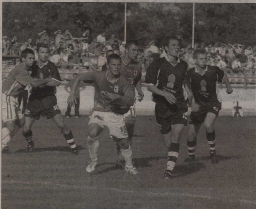
Zawodnicy Rodła nie zdołali tym razem zdobyć bramki, choć nie brakowało sytuacji podbramkowych. Remis zadowolił jednak obydwa zespoły.

Pilkarze kwidzyńskiego Rodła grając na własnym boisku bezbramkowo zremisowali w trudnym spotkaniu z Mieszkiem Gniezno. Choć okazji nie brakowało, to żadna z drużyn nie zdołała przechylić szali zwycięstwa na swoją stronę. Podział punktów wyraźnie ucieszył zawodników i trenerów obydwu drużyn.