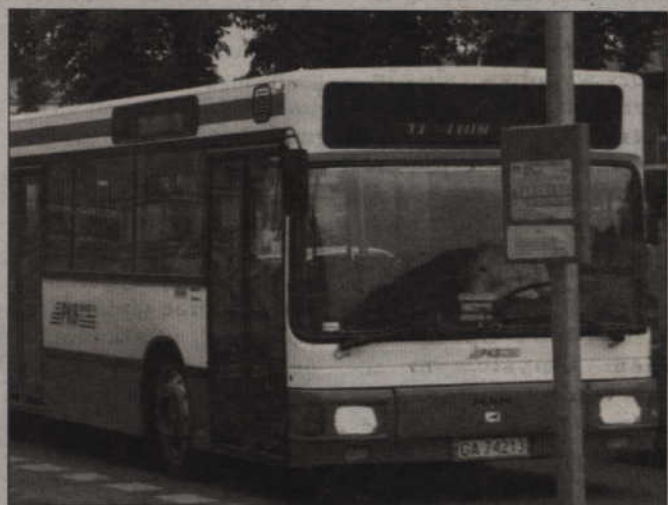
- Próbowałam dostać się do miasta autobusem nr 11. Niestety linia miejska, która powinna być dostępna dla wszystkich, okazała się niedostępna dla mnie - matki z dziećmi w wózku – napisała do nas Czytelniczka.

Autobusy te jeżdżą, po dwa na linii 11 i po dwa na linii 12. - Jednak w tej chwili jeden z nich jest w naprawie. Jeżdżą więc trzy, a gdy wszystkie są w trasie, to ten uszkodzony musieliśmy zastąpić normalnym