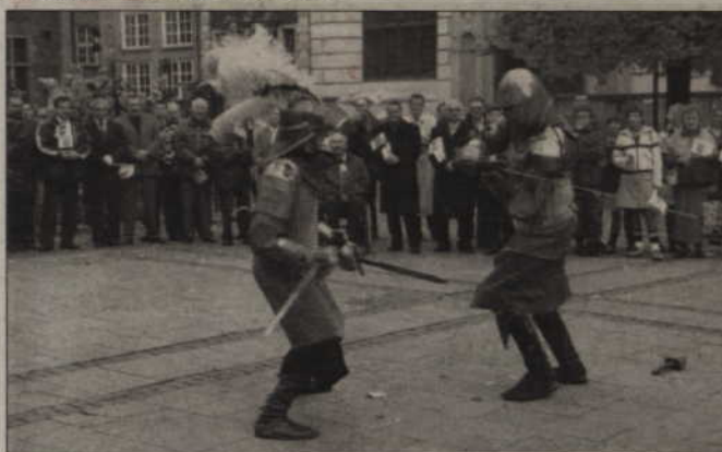
Pokaz walk w wykonaniu Bractwa Rycerskiego ze Szumu.