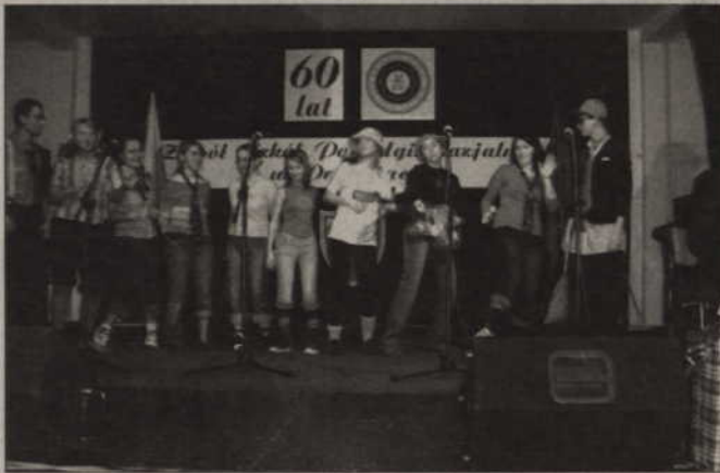
W trakcie występów artystycznych przedstawiono historię szkoły...