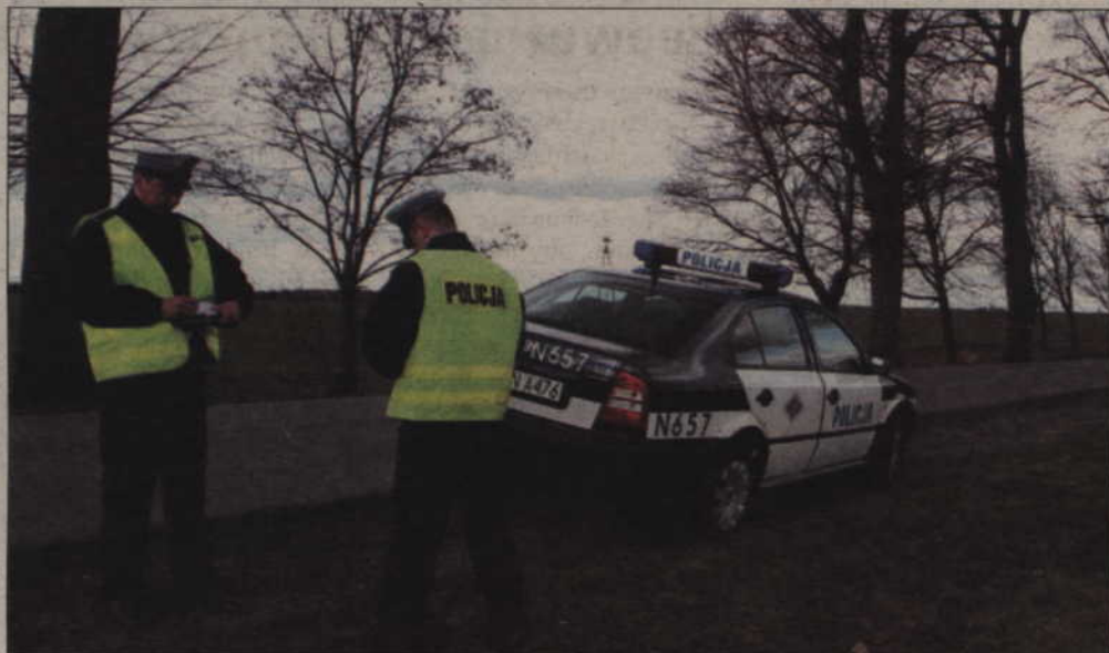
Kolejny tragiczny wypadek na drodze krajowej nr 55. Zginął 25-letni mężczyzna, który kierował osobowym volkswagenem. Zawinił kierowca ciężarówki – nie zauważył wyprzedzającego go samochodu.

-W tym wypadku nie uczestniczył żaden inny pojazd. Sytuację widział przechodzień, który powiadomił pogotowie. Sekcja zwłok ma wykazać, co było przyczyną śmierci tego