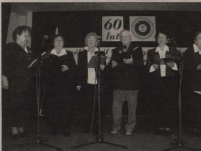
Zaśpiewał także lokalny zespół składający się z emerytowanych nauczycieli.