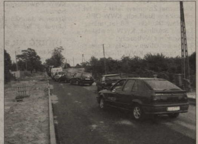
Prace bardzo utrudniały podróżowanie kierowcom, którzy przejeżdżali tą trasą. Powstawały kilometrowe korki. Teraz jednak należą one już do przeszłości.