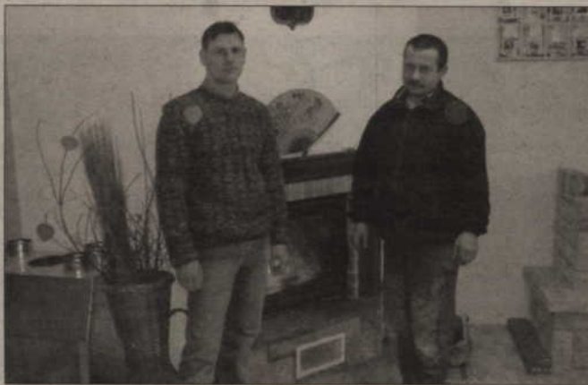
W sklepie firmy Vento - dla klientów „Kuriera Kwidzyńskiego” specjalne rabaty.

Pracownicy zaprojektują kominek, instalacje grzewcze, a także je wykonają. Ułatwią wybór najodpowiedniejszego typu kominka tak, aby klient był zadowolony z estetyki i jakości. W salonie kominkowym w Kwidzynie można obejrzeć wiele tzw. wkładów do kominków. Coś dla siebie mogą znaleźć też wymagający klienci. Jak twier-