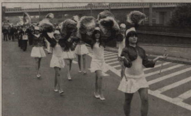
Barwny, powiślański korowód prowadziły marzoretki.