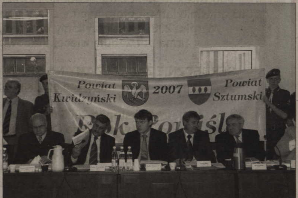
Radni sejmiku działali pod prawdziwą presją mieszkańców Powiśla.