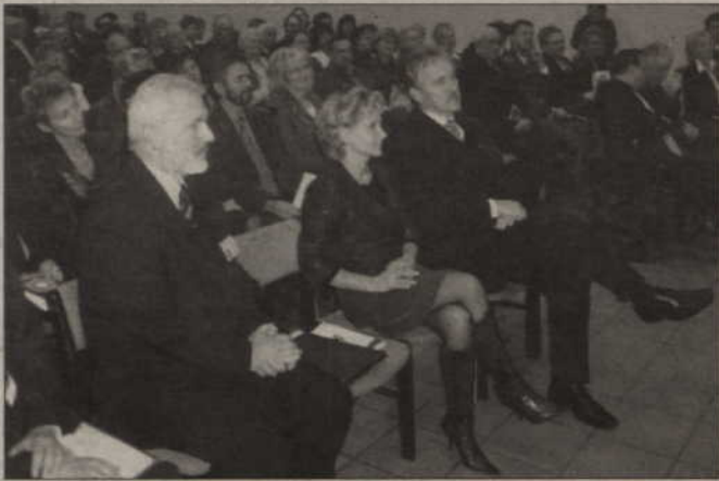
Zespół Szkół Ponadgimnazjalnych w Prabutach istnieje już 60 lat. Z okazji swojego jubileuszu absolwenci, uczniowie, grono pedagogiczne oraz goście spotkali się w Miejsko-Gminnym Ośrodku Kultury...