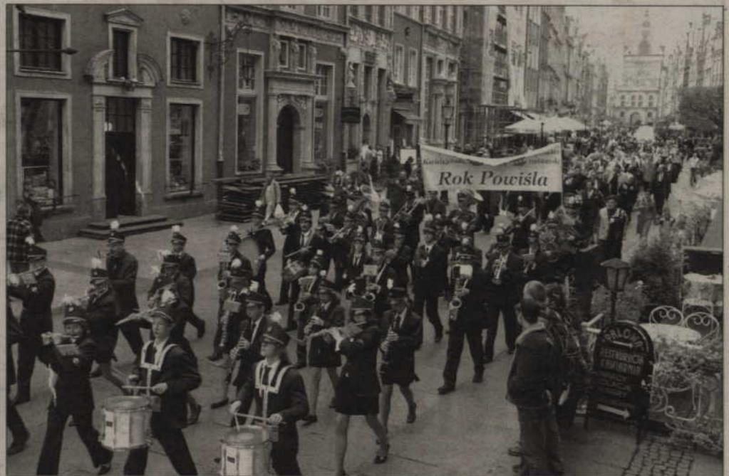
Powiśle zajęło niemal całe gdańskie Stare Miasto.