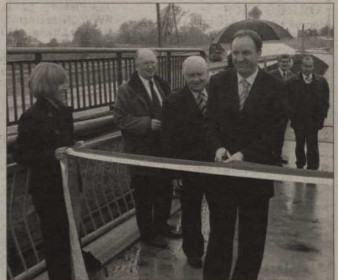
Modernizacja odcinka drogi wojewódzkiej nr 521 na ul. Rypińskiej wreszcie dobiegła końca. Zniknęły znaki informujące o robotach, a drogę uroczystie otwarto.

Cała inwestycja kosztowała ok. 4 500 000 zł. W