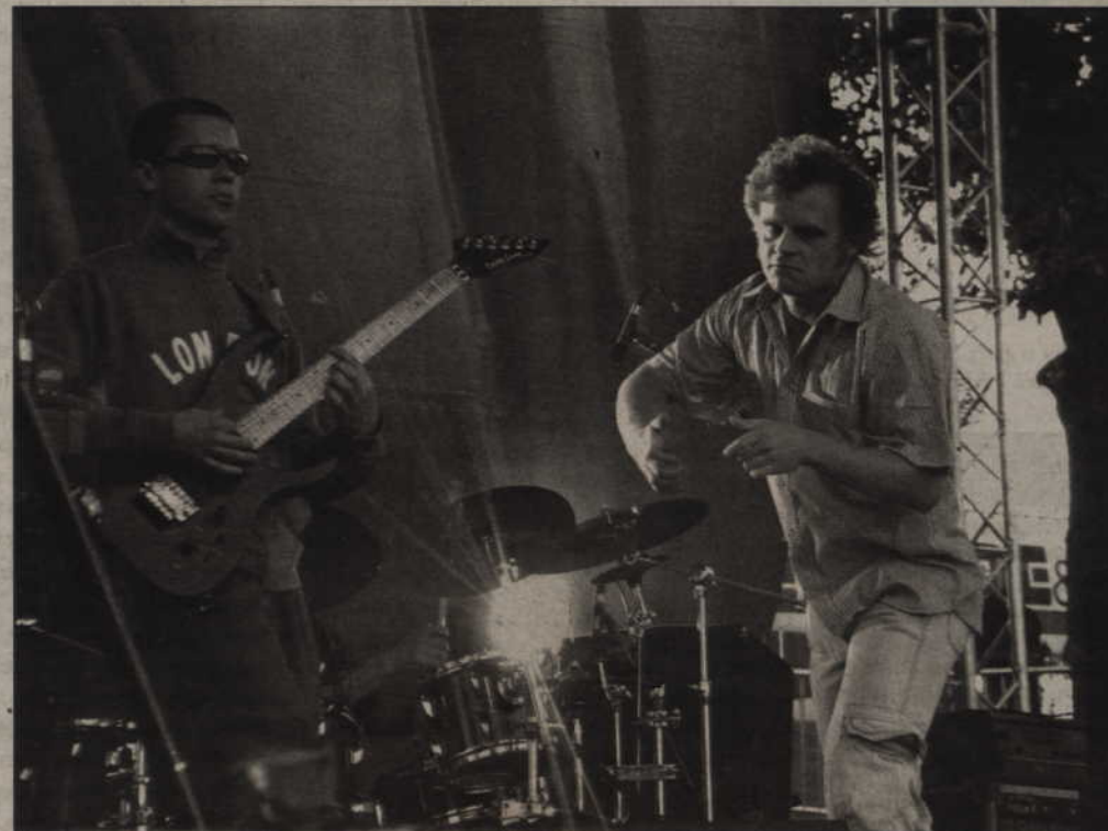
Jednym z „wychowanków” kwidzyńskiego festiwalu jest Piotr Rogucki, znany dziś jako lider zespołu Coma. Na zdjęciu: podczas występu podczas ubiegłorocznych Dni Kwidzyna.

Pierwszego dnia festiwalu (piątek 24 listopada) odbędą się konkursowe przesłuchania, a także jubileuszowy koncert, na którym wystąpią wykonawcy, nagrodzeni w poprzednich latach. W sobotę - dalszy ciąg przesłuchań wykonawców walczących o nagrody. W niedzielę natomiast, na zakończenie, odbędzie się koncert laureatów. Najpierw będą mieli okazję wysłuchać go mieszkańcy Prabut, potem występ zostanie powtórzony w Kwidzynie. (ad)