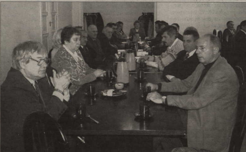
Radni gminy Kwidzyn spotkali się po raz ostatni. W ciągu czterech lat kadencji podjęli 271 uchwał, dotyczących głównie finansów i gospodarki.