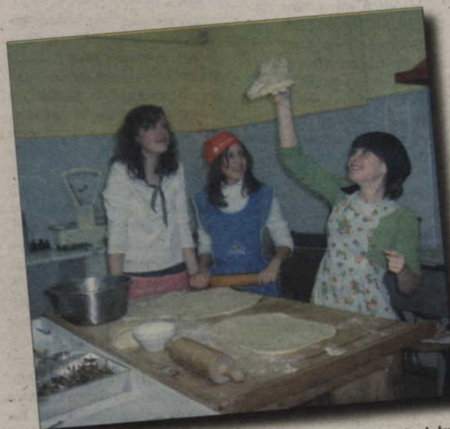
Uczniowie Społecznego Gimnazjum przygotowują kalendarz na nowy rok szkolny z tekstami, przepisami kulinarnymi i zdjęciami.