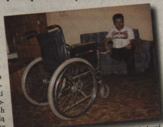
Pieniądze są, ale brakuje fachowców, którzy chcieliby zbudować podjazdy dla niepełnosprawnych.

- Nie spodziewaliśmy się, sytuacja będzie aż tak zła. Rok 2006 był pierwszym rokiem, w którym bardzo trudno było znaleźć fachowca, który zbudowałby podjazd lub podjął się przebudowy łazienki dla osoby niepełnosprawnej. Spodziewam się, że w tym roku również może być z tym problem - mówi