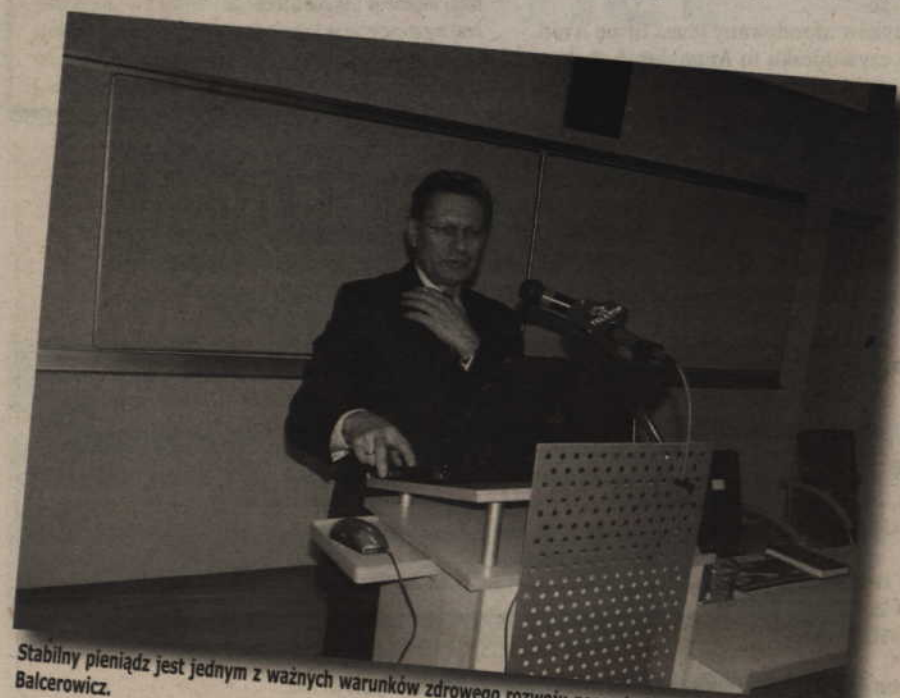
Stabilny pieniądz jest jednym z ważnych warunków zdrowego rozwoju gospodarki - twierdzi prof. Leszek Balcerowicz.