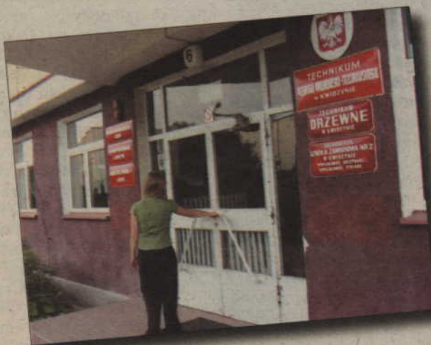
Ponad dwóch milionów złotych potrzeba do dalszej rozbudowy oraz na zakup wyposażenia Centrum Kształcenia Praktycznego i Centrum Kształcenia Ustawicznego. Centra powstały przy Zespole Szkół Ponadgimnazjalnych nr 4 przy ul. Ogrodowej w Kwidzynie.

Pieniądze na likwidowanie barier architektonicznych i w komunikowaniu się, zakup sprzętu rehabilitacyjnego oraz środków ortopedycznych pochodzą z Państwowego Funduszu Rehabilitacji Osób Niepełnosprawnych. W roku 2006 powiat kwidziński otrzymał z PFRON ponad 2,2 mln zł. Z pieniędzy na likwidację barier architektonicznych skorzystało ok. 70 osób. (jk)