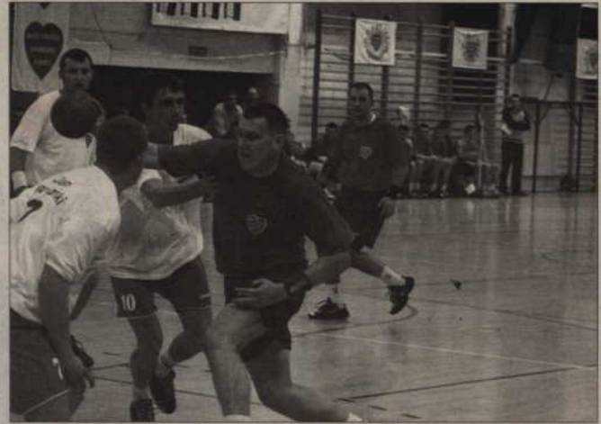
Choć mecz miał cel charytatywny, to na boisku nie brakowało walki.