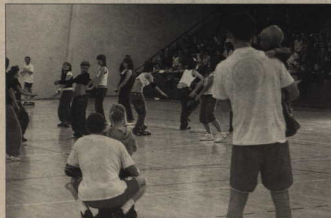
Ostatnim akcentem wieczoru był pokaz tańca Transformacji i zespołu Cheers Basket.