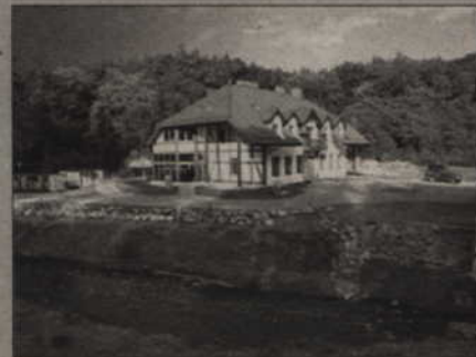
Ośrodek mieści się w starym, wyremontowanym przez Fundację młynie, położonym w urokliwym zakątku gminy Kwidzyn.