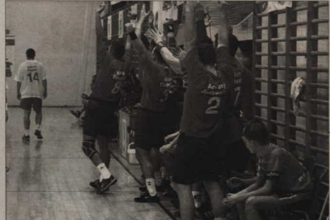
Lawka Handballu żywiołowo reagowała na bramki zdobywane przez swój zespół.