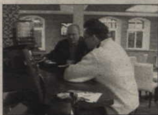
Dla Czytelników „Kuriera” przygotowaliśmy kilka zaproszeń na cappuccino do Cafe Kopernik.