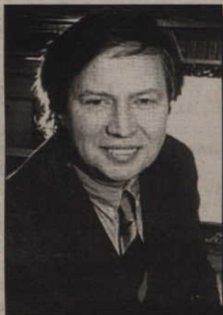
19 stycznia na kwidzińskim zamku odbędzie się koncert poświęcony twórczości Marka Grechuty. artyści warszawskich teatrów: Rampa, Syrena, Teatru Na w Woli.

Będzie można wysłuchać tekstów Marka Grechuty oraz utworów wybitnych poetów (m.in.: Adama Mickiewicza, Stanisława Ignacego Witkiewicza,