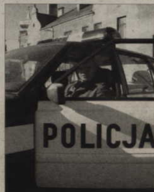
Dzięki informacjom od mieszkańców, policji udało się odnaleźć wielu przestępców.