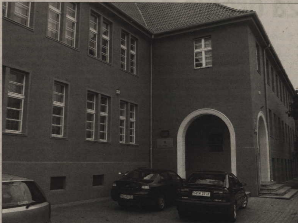
Ponad 600 tys. zł ma kosztować remont historycznej sali Rodła Zespołu Szkół Ogólnokształcących nr 1 w Kwidzynie.

„Wyposażona w kilkadziesiąt rzędów krzesel-foteli posiadała boazerię ze specjalnie dobranej gatunków drzewa, a ściana nad nią była obita ozdobnym aksamitem o złocistożółtej barwie. Podłogę pokrywała jasna klepka parkietowa, natomiast częściowo rzeźbiony sufit zdobiły dobrane według słojów deski ułożone w geometryczne zharmonizowane figur. W tyle sali znajdował się balkon z czterema rzędami krzesel, dotyczący kabiny operatora filmowego. Dostęp do kabiny, zgodnie z obowiązującymi przepisami bezpieczeństwa przeciwpożarowego, umożliwiły specjalne schody metalowe umieszczone po zewnętrznej stronie sali. W przewidywaniu organizowania przez szkołę przedstawień teatralnych, Sala Rodła dysponowała sceną wyposażoną w zapadnie, kulisy pluszowe kotary, rampy oświet-