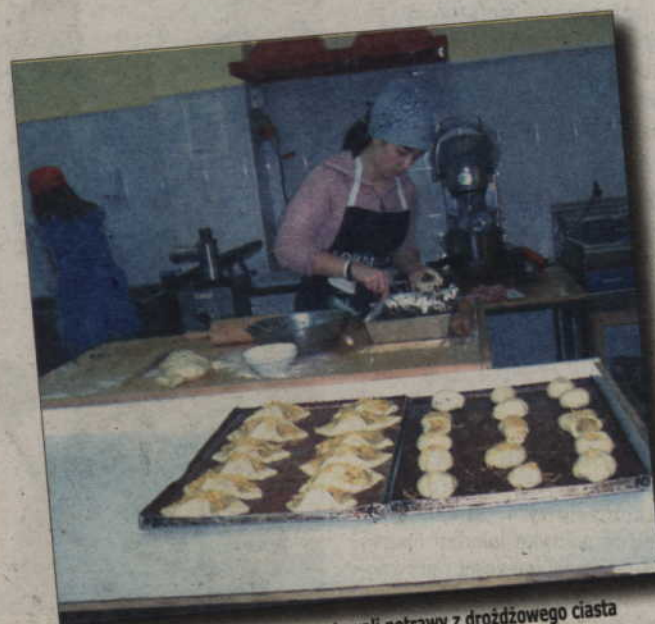
Gimnazjaliści własnoręcznie przygotowali potrawy z drożdżowego ciasta