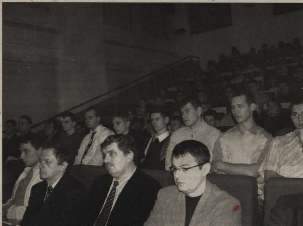
Wykładu prof. Leszka Balcerowicza przyszli posłuchać nie tylko studenci i młodzież z kwidzyńskich szkół, ale także samorządowcy.

„Polska na tle liderów systemowych” to temat wykładu, który prof. Leszek Balcerowicz przygotował dla studentów Wyższej Szkoły Zarządzania oraz gości, którzy przyszli posłuchać prezesa Narodowego Banku Polskiego.