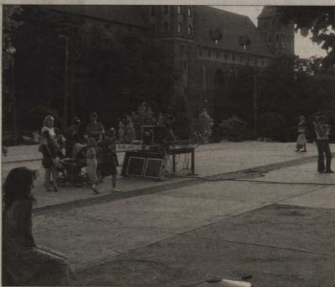
Na placu Jana Pawła II ma powstać stała scena, by mogły się tam odbywać letnie koncerty.