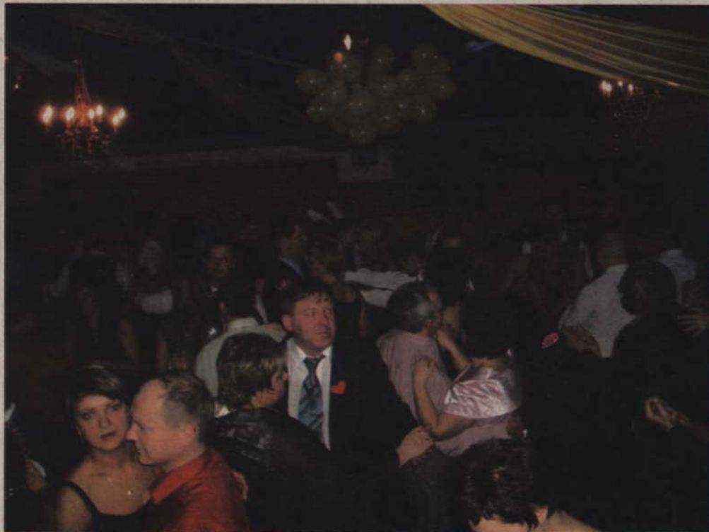
Kwidzianie, także Czytelnicy „Kuriera”, którzy wygrali biletu wstępu w naszym konkursie, bawili się na balu sylwestrowym w Centrum Konferencyjno - Bankietowym. Teraz mają szansę zdobyć wejściówkę na karnawałową zabawę.

Kilku Czytelników „Kuriera Kwidzińskiego” miało okazję bawić się na balu sylwestrowym w Centrum Konferencyjno - Bankietowym przy ul. 11 Listopada. - bilety wstępu wygrali w konkursie, jaki przeprowadziliśmy w naszej gazecie.