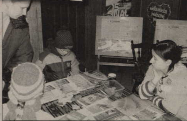
Na specjalnym stoisku można było kupić orkiestrowe gadżety.