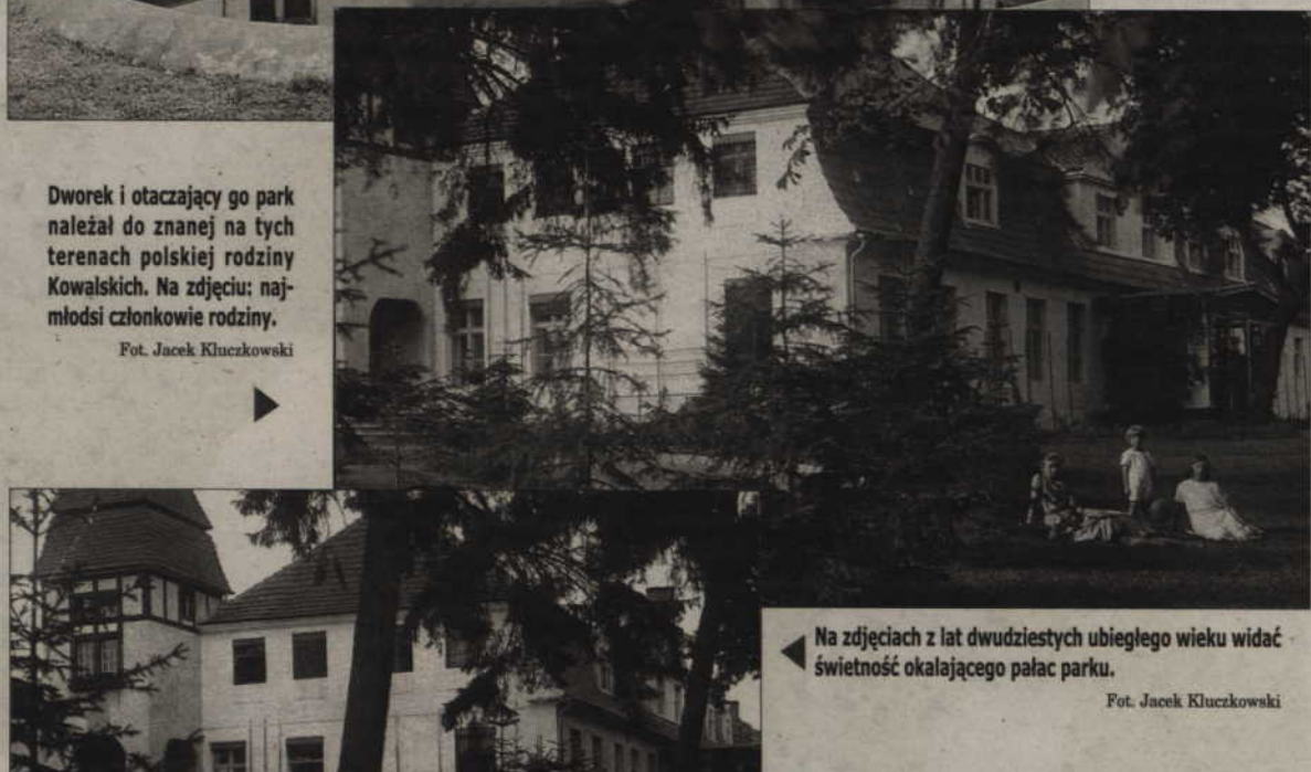
Na zdjęciach z lat dwudziestych ubiegłego wieku widać świetność okalającego pałac parku.