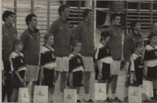
Dla juniorów z Danii mecz w Kwidzynie był drugim z zaplanowanych trzech spotkań z reprezentacją Polski. Rozpoczęto od hymnu gości.