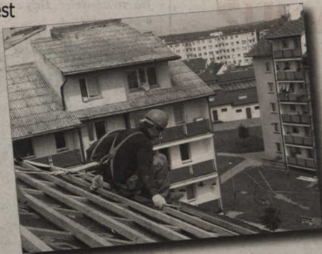
Najwięcej eternitu do utylizacji zgłosiła obecnie Spółdzielnia Mieszkaniowa „Pomezania”.

- Przyjmowaliśmy eternit w depozyt do czasu zakończenia budowy kwatery. Przyjęliśmy