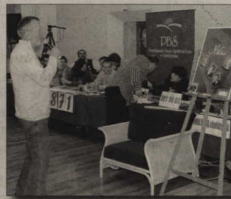
Burmistrza szczególnie zainteresował plakat ze zdjęciami i autografami aktorów serialu „M jak Miłość”.