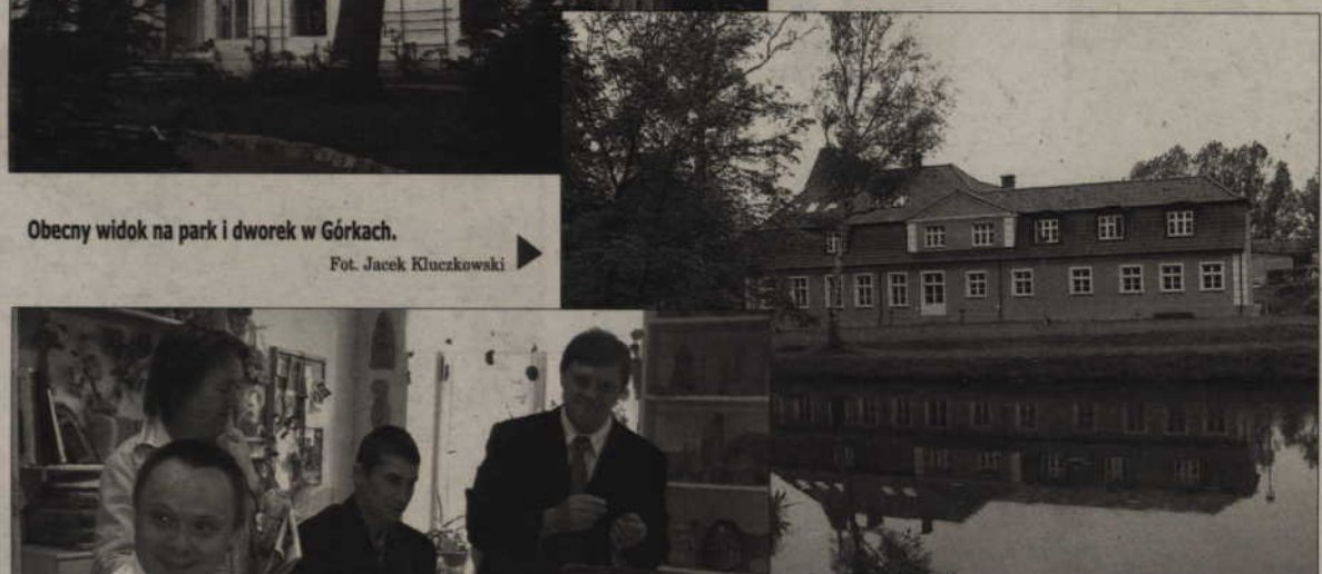
Od niedawna na terenie posiadłości mieści się Centrum Rehabilitacji Osób Niepełnosprawnych, które prowadzi Fundacja „Misericordia”.