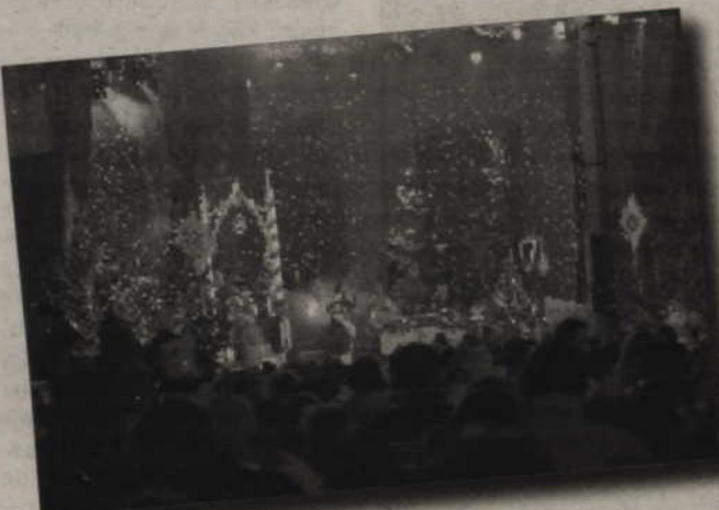
Po modernizacji Placu Jana Pawła II scena będzie ustawiona tak, aby w tle było widać zamek. Podobnie jako to było podczas programu Telewizji Polskiej „I Ty możesz zostać świętym Mikołajem”.

Samorząd miasta chce także rozbudować infrastrukturę