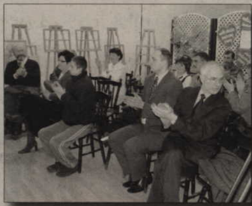
Licytowano przez telefon, ale także bezpośrednio na sali. Na zdjęciu: m.in. przedstawiciele telewizji Vectra.