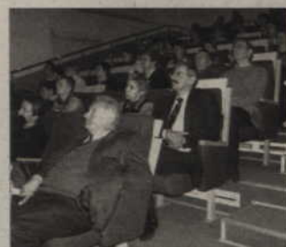
Dzisiaj o godz. 17.30 odbędzie się kolejny wykład dla mieszkańców w ramach Klubu Małej Ojczyzny Kwidzyńskiej.