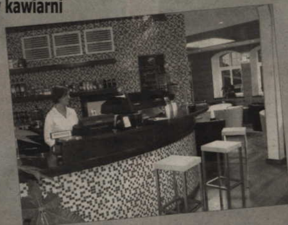
Dla Czytelników „Kurier” przygotowaliśmy kilka zaproszeń na cappuccino do Cafe Kopernik.