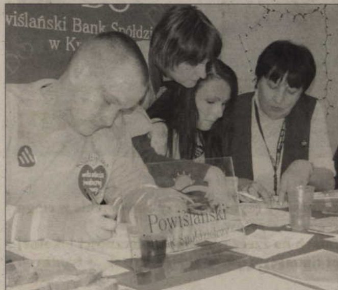
Przez cały dzień wpłacane pieniądze liczyli skrupulatnie pracownicy Powiślańskiego Banku Spółdzielczego.