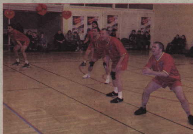
Atrakcją dnia w Gimnazjum nr 3 był mecz pomiędzy pracownikami starostwa i Urzędu Miejskiego w Kwidzynie - więcej na sportowych stronach „Kuriera”.