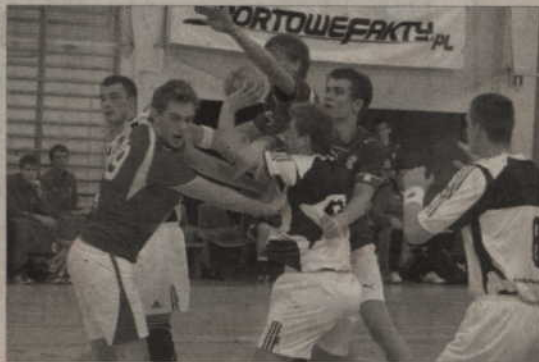
Na boisku jednak wcale nie było tak łatwo. Jak widać na zdjęciu Duńczycy postawili twarde warunki gry i niełatwo było przedrzeć się zawodnikom do pozycji rzutowej.