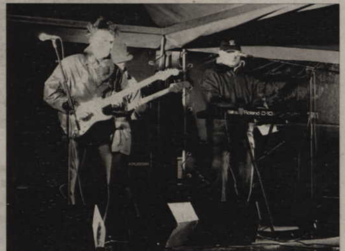
Mimo porywistego wiatru, na scenie ustawionej przed teatrem występowały kwidzyńskie zespoły młodzieżowe.