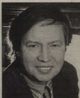
19 stycznia na kwidzyńskim zamku odbędzie się koncert poświęcony twórczości Marka Grechuty.