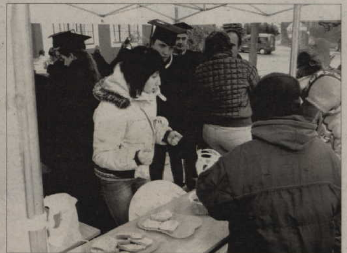
Kwidzyńscy studenci przez cały dzień grali z Wielką Orkiestrą. Przed teatrem ustawili „Namiot Zmarzlaka”, gdzie można było napić się kawy, herbaty, gorącego barszczu, skosztować upieczonych przez studentów ciastek - owsiaków, a także chleba ze smalcem i kiszonym ogórkiem.