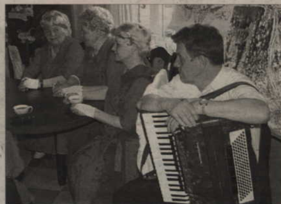
W najbliższy piątek odbędzie się kolejne spotkanie ze znanymi w mieście osobami, na które zaprasza zespół „Powiślanki”.

Zespół Powiślanki takie wieczory organizuje cyklicznie. Panie przeprowadzają wywiady z zaproszonymi gośćmi, zadając im także te pytania, które wcześniej otrzymały od mieszkańców Kwidzyna. Do