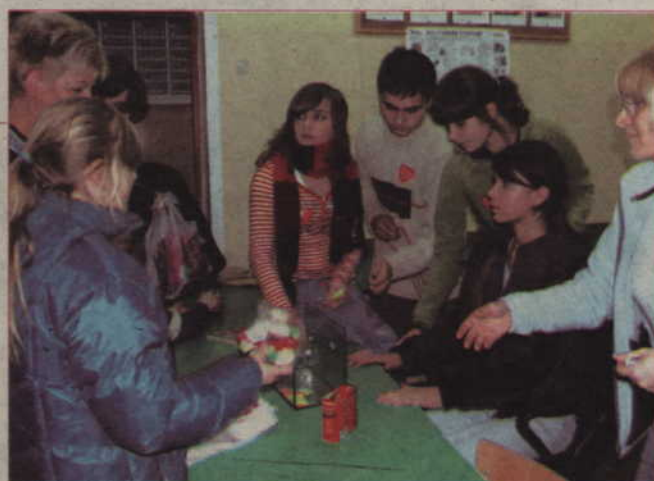
Każdy los, który przygotowano na loterię, wygrał.