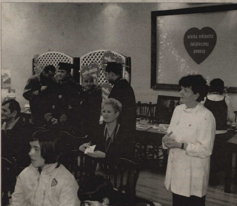
Na licytację wystawiono indeks WSZ, umożliwiający darmowe studiowanie przez cały rok.