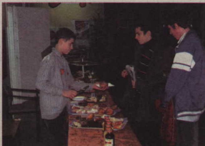
W Gimnazjum nr 3 uruchomiono sklepik, w którym można było kupić ciasta i inne słodycze.