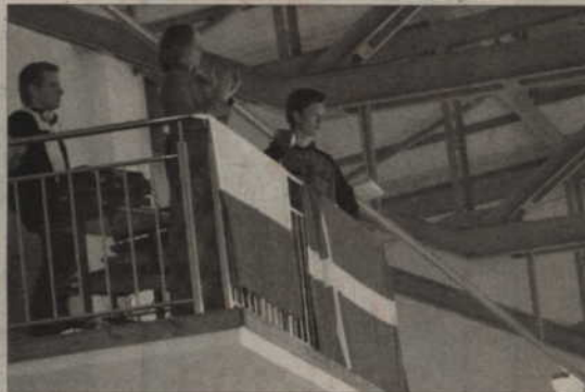
Nie zabrakło oczywiście flag obu państw.