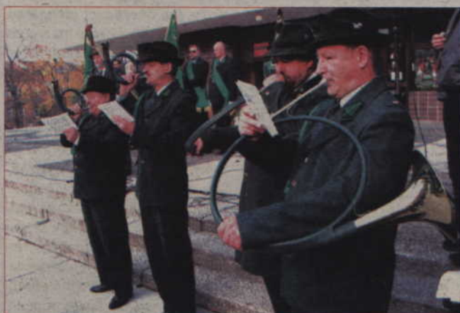
Gra na rogach to tradycja wszelkich myśliwskich uroczystości. Na zdjęciu: obchody Hubertusa w Kwidzynie.

Rzeczywiście, myśliwym nie jest łatwo zostać. Przede wszystkim trzeba bardzo chcieć, niezbyt wytrwali nie wytrzymają bowiem dwulet-