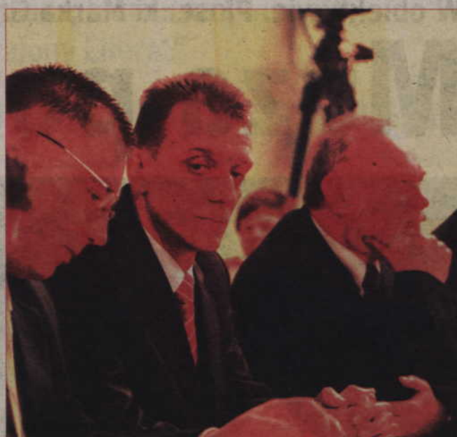
W najbliższy czwartek o godz. 16.15 rozpocznie się posiedzenie kwidzińskich radnych.