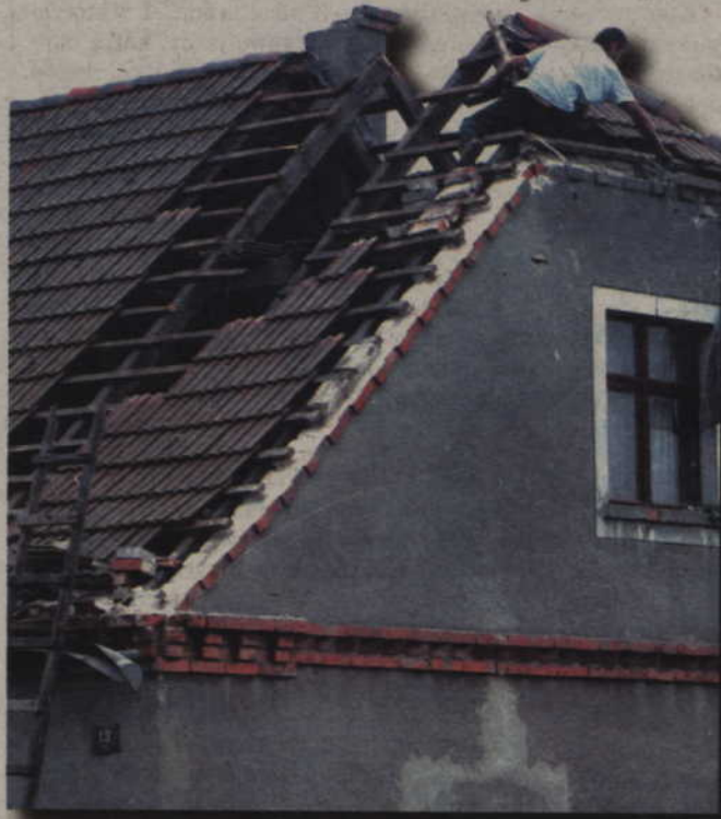
Ostatnia wichura zerwała dach stodoły w Kaniczkach i powaliła drzewo w Liczu. Dużo więcej szkód spowodował porywisty wiatr latem ubiegłego roku – np. w Liczu wyrwał z korzeniami drzewo, które runęło na dom (na zdjęciu).