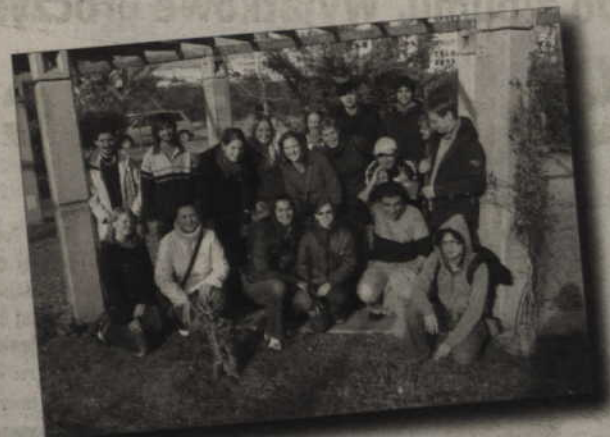
Wspólne zdjęcie uczestników wymiany młodzieży w Akdeniz University.

wiemy jeszcze, kiedy będziemy tam jechać. Musimy porozmawiać z koordynatorem. Poprosimy go, żeby sprawdził, czym dostaniemy się do Mugla. Podobno podróż zajmie ok. 5 godzin. Sporo kasy idzie na dojazd do szkoły 1,15 lira. Obiady jemy w szkole. 2,5 lira za 1 obiad lub też można sobie wykupić na tydzień i płacić się 10 lirów. Obiady są niczego sobie. Wszystkie dni mamy nawet dobrze zorganizowane. W szkole siedzimy dłużej niż w szkole w Kwidzynie. Zajęcia są od 9:30 do 12:30. Później mamy lunch time. Po lunch'u mamy kolejne zajęcia. Na tych zajęciach czujemy się jak na lekcji angielskiego. Philip ciągle się wypytuje, co robiliśmy, czego się nauczyliśmy i takie tam. Dziewczyny mają mały problem z angielskim. Nie rozmawiają między sobą po angielsku. Jeśli następnym razem ktoś będzie chciał jechać, to sugeruję jednak zrobić mały test z angielskiego. Może nie pisemny, ale taki z konwersacji. Nie o to chodzi, żeby mówić super gramatycznie, tylko żeby w ogóle rozmawiać. Tutaj i tak każdy łapie, o co komu chodzi. Do hotelu wracamy najczęściej, jak już jest