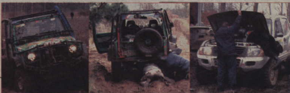
Trasa wyścigu biegła po nieużytkach byłego poligonu wojskowego w podkwidzińskich lasach. Czasem jednak trasa okazywała się zbyt trudna i samochód wymagał szybkich napraw.