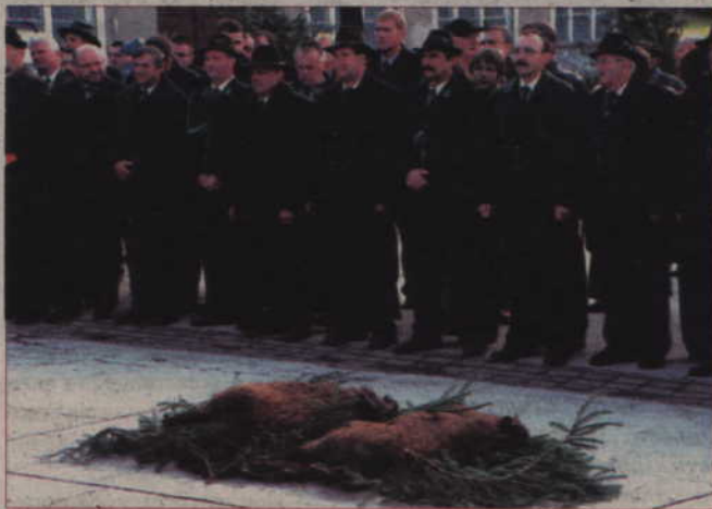
Myśliwi twierdzą, że polowanie nie jest najważniejszą częścią myśliwskiej tradycji. Jednak jest z nią nierozdzielnie związane. Na zdjęciu: tzw. pokot, czyli prezentacja ustrzelonej zwierzyzny podczas kwidzińskiego Hubertusa.

-Myśliwi z innych krajów Europy zazdroszczą nam tego, że w Polsce jesteśmy tak dobrze zorganizowani, jest związek łowiecki, że mamy