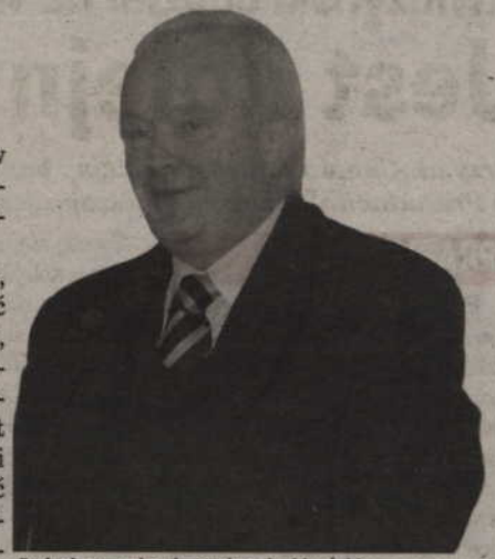
Podróż po gminach powiatu kwidzyńskiego rozpocznie od Sadlinek - zapowiada starosta Jerzy Godzik.

Starosta dodaje, że nie chce rozbudzić wielkich nadziei, związanych z pomocą finansową powiatu, gdyż budżet jest dość skromny i nie zdoła zaspokoić wszystkich oczekiwań gminnych samorządów. (jk)