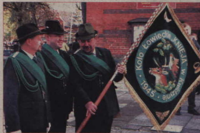
W Kwidzynie są cztery koła łowieckie, każde z nich zrzesza ok. 50 osób. Mają sztandary i typowe dla siebie zwyczaje. Na zdjęciu: członkowie koła „Knieja”.

Co roku myśliwi organizują tradycyjne imprezy z okazji Dnia Świętego Huberta, patrona myśliwych. Święto Hubertusa, połączone z polowaniem, mszą i biesiadą myśliwską, odbywa się jesienią. Bardzo atrakcyjne są również festiwale muzyki myśliwskiej. W ubiegłym roku taką presti-