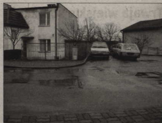
Tak, jeszcze niedawno wyglądało miejsce na końcu ślepej ulicy Sucharskiego – zastawione było niesprawnymi autami. Dzięki interwencji mieszkańców i pracowników magistratu, właściciele pojazdów usunęli je.

„Już rozwiązaliśmy tę sytuację. Właściciele usunęli auta. Rzeczywiście przez dłuższy czas dwa niesprawne pojazdy stały na końcu ślepej ulicy Sucharskiego. Widziałem to i rozmawiałam pod koniec ubiegłego roku z ich właścicielami. Najpierw próbowałem załatwić sprawę polubownie, „po ludzku” – jak widać nie poskutkowało. 19 grudnia ubiegłego roku wysłałem więc do tych panów pismo nakazujące usunięcie aut – tym samym rozpocząłem postępowanie administracyjne. Niestety w tym roku samochody na-