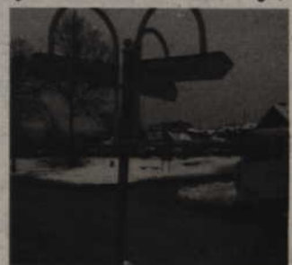
Drugi odcinek małej obwodnicy ma przebiegać ulicą Sportową. Nadal jednak nie wiadomo, kiedy jej nawierzchnia zostanie wyremontowana.