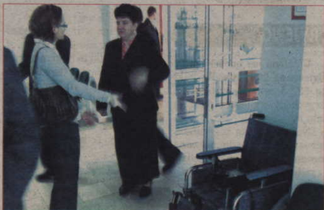
Kwidzyński oddział Banku Spółdzielczego w Prabutach otwarto w miniony piątek. Placówka wyposażona jest w wózek inwalidzki, by ułatwić niepełnosprawnym korzystanie z jej usług.