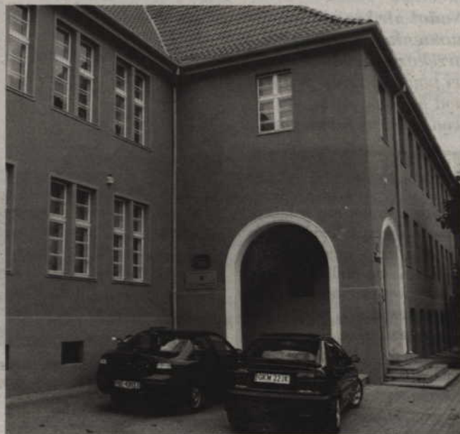
Zabytkowa sala w Liceum Ogólnokształcącym nr 1 nie była odnawiana przez ponad 30 lat. W ubiegłym roku zakończono remont elewacji budynku.