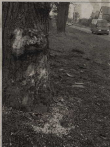
Miejsce wypadku drogowego przy ul. Hallera, w którym zginął 37-letni mężczyzna.

Do kolejnego wypadku doszło w okolicy Bądek, niedaleko wysypiska śmieci. Przewożący złom samochód ciężarowy stoczył się na pole i przewrócił na bok. Kierowca za zakrętem stracił panowanie nad kierownicą, ponieważ na drodze było ślisko, leżał topniejący śnieg. Dużym problemem okazało się ustawianie ciężarówki, ponieważ wezwany na pomoc dźwig także