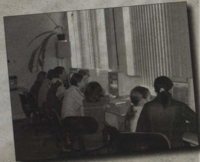
Podczas zajęć ferijnych w wandowskim gimnazjum najbardziej obleganym miejscem była sala komputerowa.