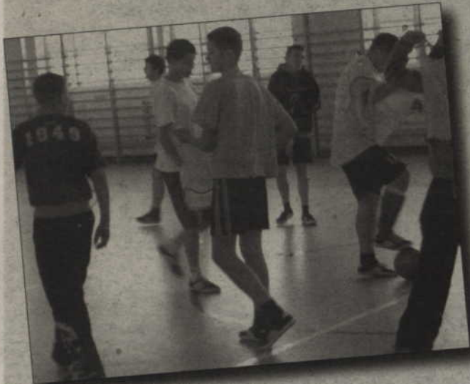
Gimnazjaliści bardzo chętnie brali udział także w rozgrywkach sportowych.

Zajęcia sportowe w sali gimnastycznej i nieograniczony dostęp do internetu – to najbardziej przypadło do gustu gimnazjalistom z Wandowa, którzy spędzali zimowe ferie w szkole.