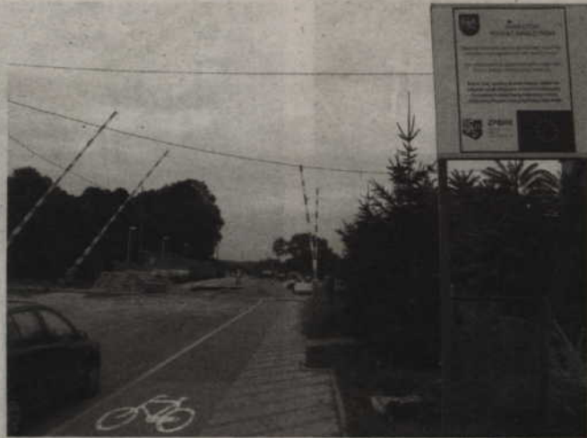
Do tej pory udało się wybudować pierwszy odcinek małej obwodnicy, umożliwiający dojazd ulicą Sportową i Żwirową do ul. Południowej

- Potrzebujemy ok. 3 tys. m kw. Właściciel chce, abyśmy kupili całego gospodarstwa, wraz z zabudowaniami. Oczy-