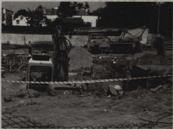
Towarzystwo Budownictwa Społecznego rozpoczęło budowę 74 mieszkań przy ul. Sokolej. Nowe lokale zostaną oddane do użytku w przyszłym roku. Na zdjęciu: budowa oddanego do użytku w ubiegłym roku bloku TBS przy ul. Łużyckiej.

Hufiec daje możliwości kontynuowania nauki i zdobycia zawodu. W jego szeregach jest wielu uczniów gimnazjów, którzy z różnych przyczyn nie kontynuowali nauki. Początki OHP sięgają lat 30. W 1932 roku tworzone były w Polsce Ochotnicze Drużyny Pracy. Cztery lata później, na mocy dekretu prezydenta Ignacego Mościckiego, utworzono Junackie Hufce Pracy, które podobnie jak dzisiaj dawały zatrudnienie i możliwość nauki.