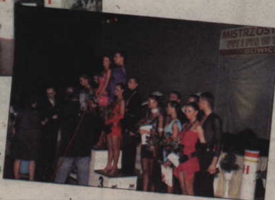
Moment dekoracji par, które zwyciężyły w kategorii dorosłych. Całe zawody transmitowała telewizja Polsat Sport.