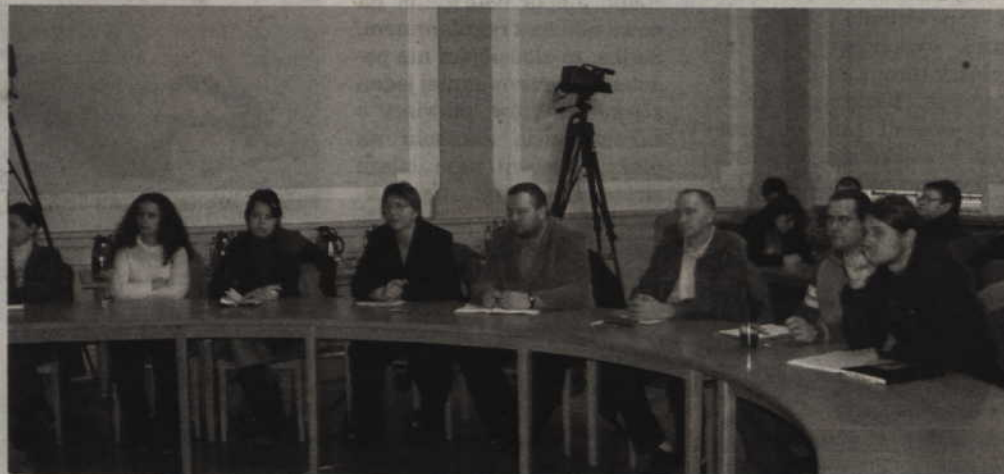
W konferencji wzięli udział m.in. inni samorządowcy, przedstawiciele organizacji pozarządowych, szefowie instytucji i placówek działających w powiecie.