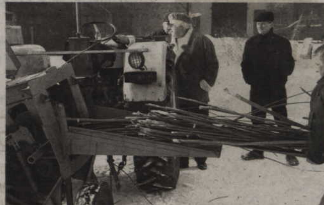
Wiklina jest już stosowana jako opał, ale jedynie w niewielkiej kotłowni w Barcicach, również w gminie Ryjewo

- Modernizacja całego systemu ogrzewania oraz budowa ekologicznej kotłowni miałyby być początkowo wykonana przez nas, ale pojawił się pomysł budowy elektrociepłowni. Była także grupa osób, która zainteresowała się tym przedsięwzięciem. Budowa nie doszła do skutku. Obecnie jed-