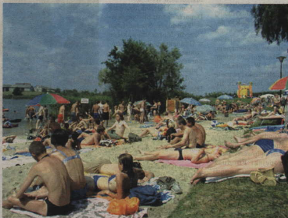
Plaża nad jeziorem Kamień w Gardei jest jednym z niewielu strzeżonych kąpielisk w powiecie kwidzyńskim.