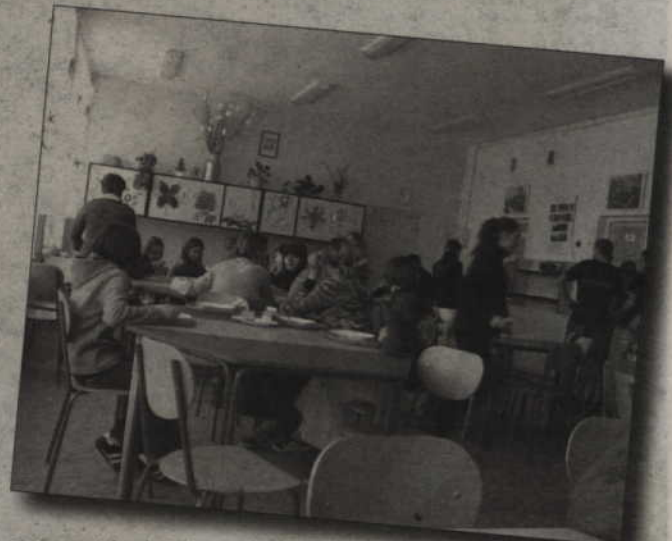
Podczas zajęć w świetlicy uczniowie oglądali filmy na dvd i przygotowywali walentynkowe ozdoby.