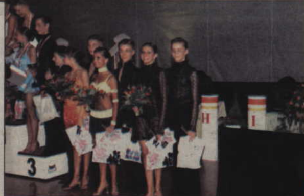
W Mistrzostwach Polski w Gliwicach startowało 65 par dorosłych i 82 pary w kategorii młodzieżowej.