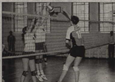
W sobotę Kwidzyńskie Centrum Sportu i Rekreacji zaprasza na turniej minisiatkówki.