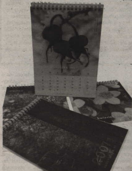
Kalendarz na biurko, który wydało Stowarzyszenie „Eko – Inicjatywa”, to nagroda w naszym konkursie.