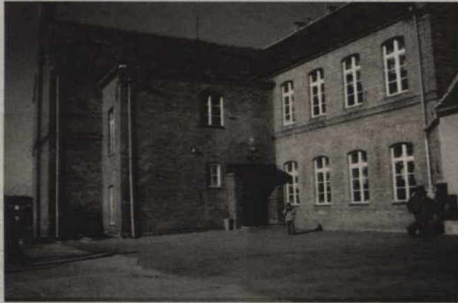
Jeśli kwidzyński samorząd porozumie się z władzami Ochotniczego Hufca Pracy, budynek po Szkole Podstawowej nr 3 przy ul. Malborskiej stanie się siedzibą OHP.

Władze Kwidzyna będą rozmawiać z Ochotniczym Hufcem Pracy na temat budynku przy ulicy Malborskiej. Obiekt był siedzibą Szkoły Podstawowej nr 3. Z powodu niżu demograficznego samorząd zlikwidował tę szkołę. OHP nie ma własnych pomieszczeń. Korzysta z budynku należącego do powiatu kwidzyńskiego i szuka nowej siedziby. Rozmowy na ten temat już prowadzono.