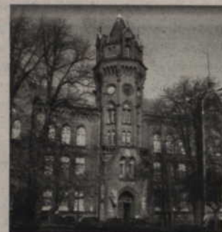
Eternit, pokrywający dach budynku pokoszarowego przy ul. Grudziądzkiej, zostanie usunięty. Zastąpiony zostanie nieszkodliwym euronitem.

Samorząd powiatu zaplanował na remont 600 tys. zł. Inwestorem będzie samorząd