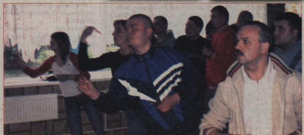
W tegorocznych Mistrzostwach Kwidzyna wystartowało 69 uczestników.