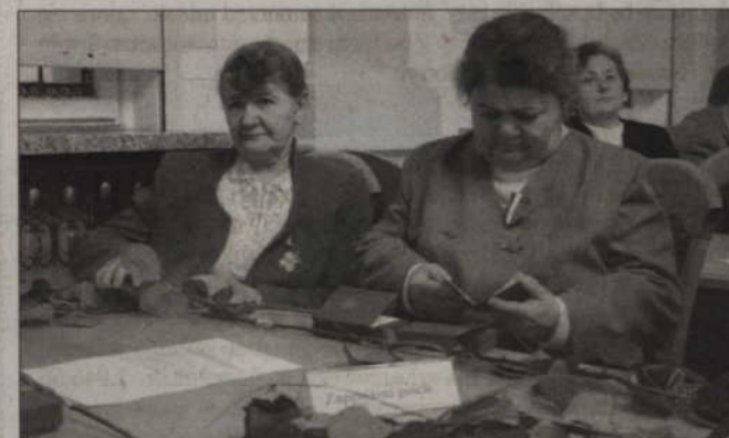
Członkowie kwidzyńskiego koła Związku Sybiraków byli gośćmi radnych.