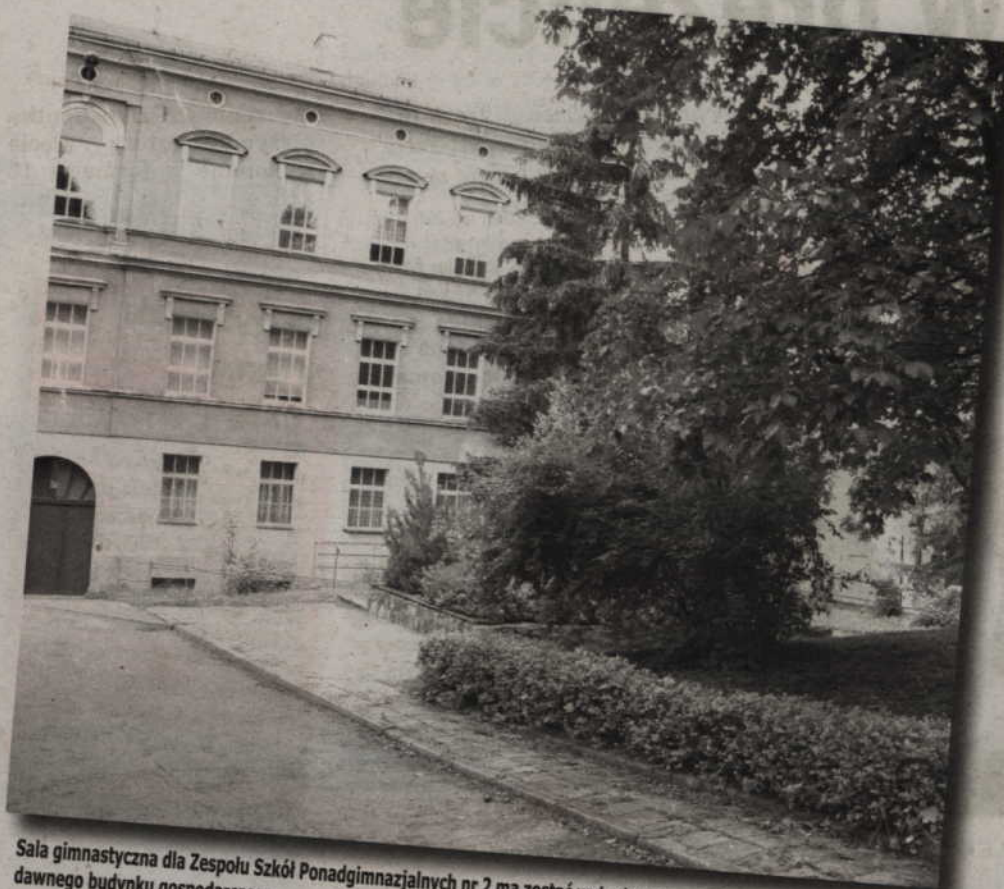
Sala gimnastyczna dla Zespołu Szkół Ponadgimnazjalnych nr 2 ma zostać wybudowana na historycznych fundamentach dawnego budynku gospodarczego.

Sala gimnastyczna ma zostać wybudowana na historycznych fundamentach dawnego budynku gospodarczego. Linia zabudowy widoczna jest do dnia dzisiejszego. Zachowały się bowiem fundamenty dawnego budynku gospodarczego. Elewacja została odtworzona zgodnie z pierwotnym wyglądem. Sala gimnastyczna nie będzie prawdopodobnie pełnowymiarowa. Według władz powiatu spełni jednak swój najważniejszy cel, jakim będzie prowadzenie w niej lekcji wychowania fizycznego. (jk)