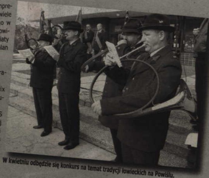
W kwietniu odbędzie się konkurs na temat tradycji łowieckich na Powiślu.

27. Powiślańska Licealiada (ZS Sztum), a także Powiślański Turniej Szachowy (Sztum) i Powiślański Turniej Szkół Ponadgimnazjalnych (Kwidzyn) i Powiślańska Gimnazjada (Kwidzyn).