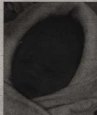
Oskar - syn Angeliki Kruszyńskiej i Łukasza Jarosza z Kwidzyna, przyszedł na świat 1 marca o godz. 19.20 (waga: 3,25 kg, długość: 53 cm).