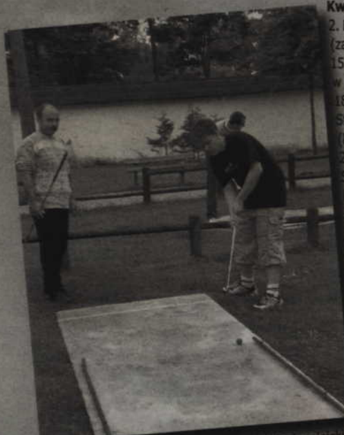
W ramach obchodów Roku Powiśla na stadionie miejskim w Kwidzynie odbywać się będą zawody w konkurencjach rekreacyjnych.