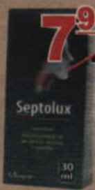
Septolux 30 ml.