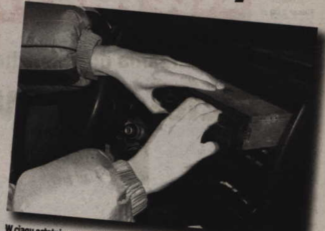
W ciągu ostatniego tygodnia złodzieje okradli kilkanaście samochodów, stojących na kwidzyńskich ulicach.

Radioodtwórzacze, głośniki, lusterka, a także całe samochody giną z kwidzyńskich parkingów. Są również złodzieje, którzy „pożyczają” auto na parę godzin i porzucają je zniszczone gdzieś na uboczu. Ulubioną marką tych dowcipni-siów jest fiat 126 p.