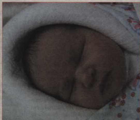
Córka Elżbiety i Romana Pławnych z Białek, przyszedł na świat 18 marca o godz. 6.50 (waga: 3,75 kg, długość: 59 cm).