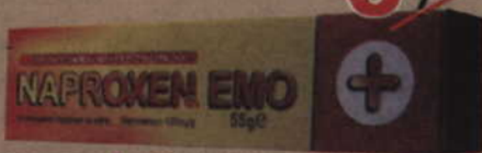
Naproxen Emo*, żel, 10%, 55 g.