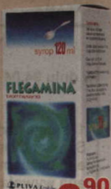
Flegamina* syrop, 120 ml.