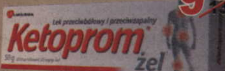
Ketoprom*, żel, 50 g.