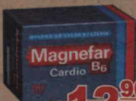
Magnefar Cardio B6 60 tabl.