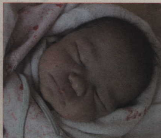
Córka Magdaleny i Bartłomieja Ponikowskich z Prabut, przyszedł na świat 17 marca o godz. 7.30 (waga: 3,6 kg, długość: 56 cm).