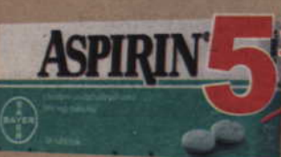
Aspirin*, 10 tabl.