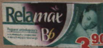
Relamax B6*, 30 tabl.