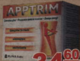
Apptrim* 60 kaps.