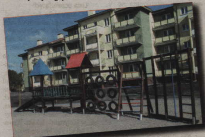
Zarządcy placów zabaw mają obowiązek dbać o stan techniczny huśtawek zjeżdżalni i innych urządzeń.

Nadzór budowlany już teraz zaleca dokonanie przeglądów tego typu obiektów celu uniknięcia zagrożenia bezpieczeństwa przede wszystkim małych dzieci, zanim na placu zabaw pojawią się inspektorzy. (jk)