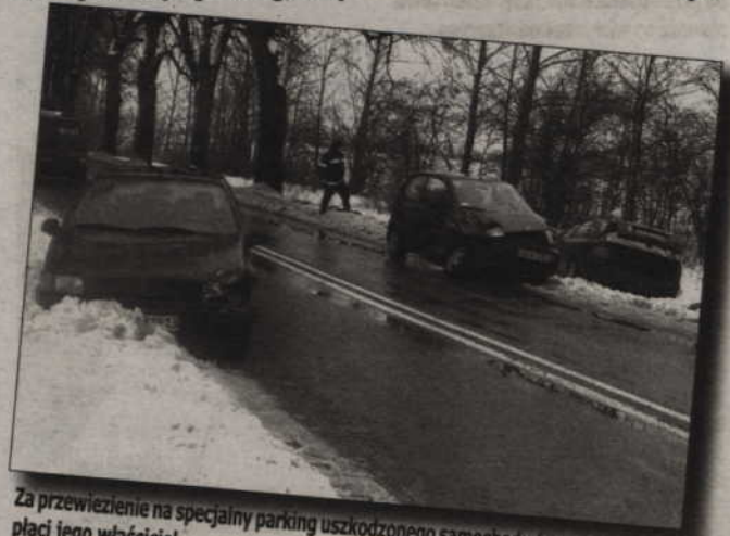
Za przewiezienie na specjalny parking uszkodzonego samochodu (np. po wypadku) płaci jego właściciel.

Na usunięcie pojazdu płaci właściciel. Tylko w przypadku, gdy nie można ustalić właściciela samochodu, koszty ponosi powiat. (jk)