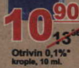
Otrivin 0,1%* krople, 10 ml.