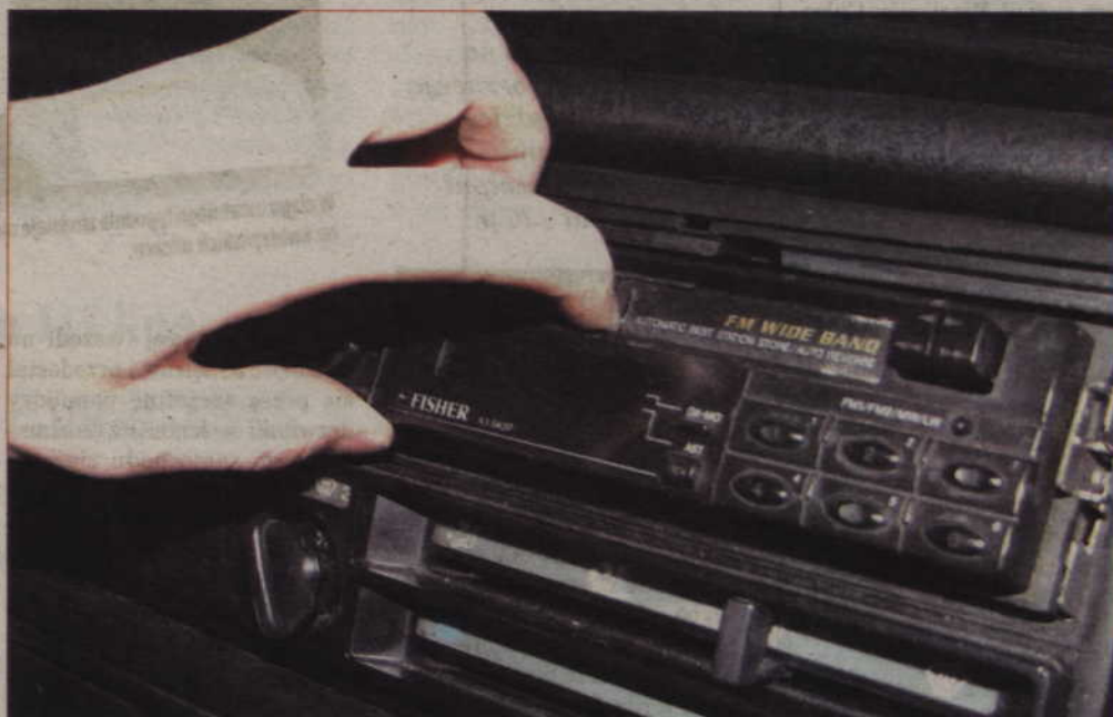
Złodziejowi wystarczy kilka minut, by wybić szybę w samochodzie i wyjąć panel radiowy. Zanim ktoś zainteresuje się wyjąłym alarmem, włamywacz jest już daleko.

Mnożą się też w Kwidzynie kradzieże samochodów. W ostatnich dniach zginęły dwa – z