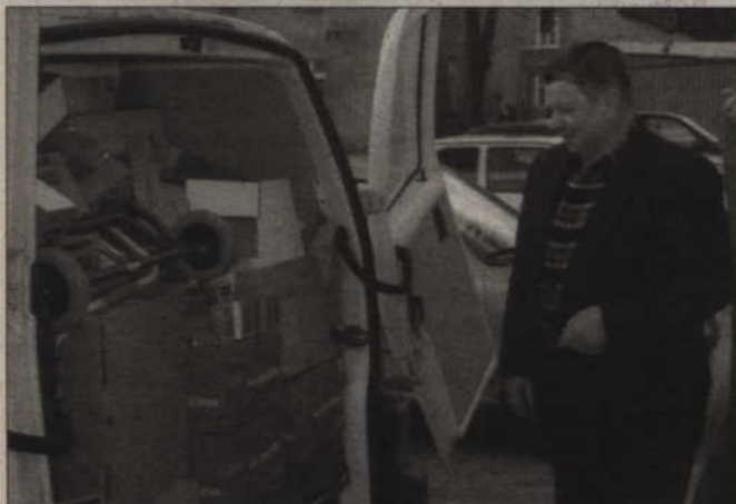
Istniejąca w Kwidzynie stacja socjalna, prowadzona przez fundację joannitów, działa m.in. dzięki sprzętowi, podarowanemu przez niemieckich sponsorów.

Fundacja joannitów od ponad czterech lat prowadzi stację socjalną. Pomocą objęci są obłożnie chorzy, osoby niepełnosprawne oraz mieszkańcy, których nie stać na zakup leków. Pomoc udzielana jest nieodpłatnie. Stacja to wspólne przedsięwzięcie samorządu Kwidzyna, zakonu Joannitów oraz Stowarzyszenia Mniejszości Niemieckiej. Stacja prowadzi wypożyczalnię sprzętu rehabilitacyjnego oraz aptekę. Pozyskuje również różne dary dla placówek, które pomagają między innymi chorym mieszkańcom powiatu. (jk)