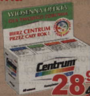
Centrum z luteiną* 60 tabl.