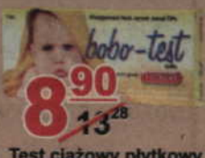
Test ciążowy płytkowy