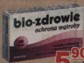
Bio-zdrowie ochrona wątroby* 20 kaps.