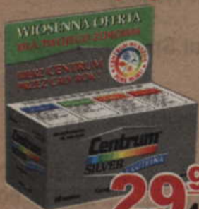
Centrum Silver z luteiną*, 60 tabl.