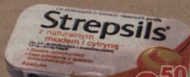
Strepsils* 8 pastylek