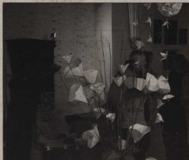
Największe dzieła origami można oglądać a salach Muzeum Zamkowego w Kwidzynie.