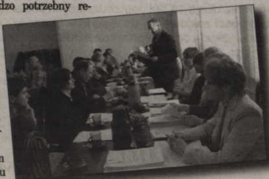
Radni gminy Kwidzyn debatowali nad tegorocznym budżetem.