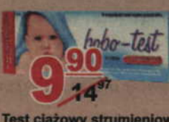
Test ciążowy strumieniowy