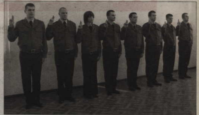
Po odbyciu służby kandydackiej w policji, można rozpocząć pracę w tym zawodzie. Na zdjęciu: uroczystość zaprzysiężenia nowo przyjętych do służby funkcjonariuszy kwidzyńskiej policji.

Podania o przyjęcie do służby w policji należy składać w sekcji ds. doboru Komendy Wojewódzkiej Policji w Gdańsku, ul. Okopowa 15 lub w sekcji kadr w najbliższej komendzie miejskiej lub powiatowej. Trzeba dostarczyć komplet dokumentów: podanie o przyjęcie do służby kandydackiej adresowane do komendanta stołecznego policji (służba w Warszawie) lub ko-