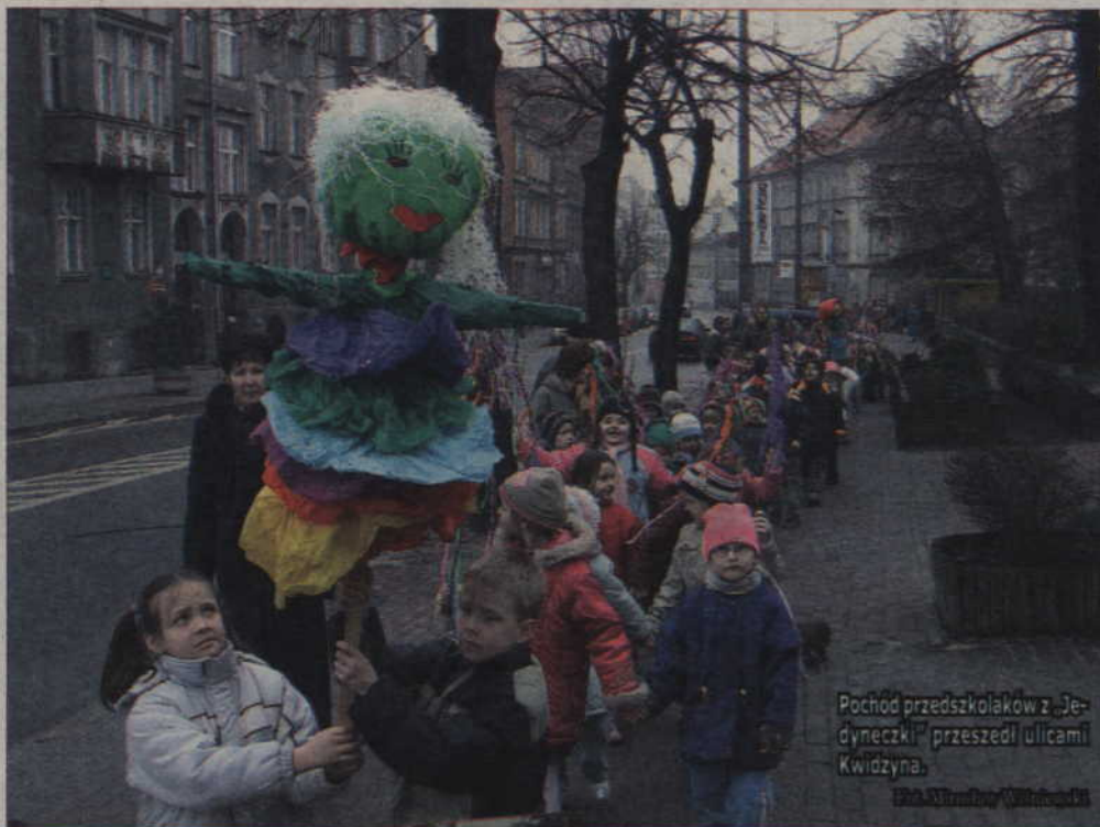
Pochód przedszkolaków z „Jedyneczki” przeszedł ulicami Kwidzyna.