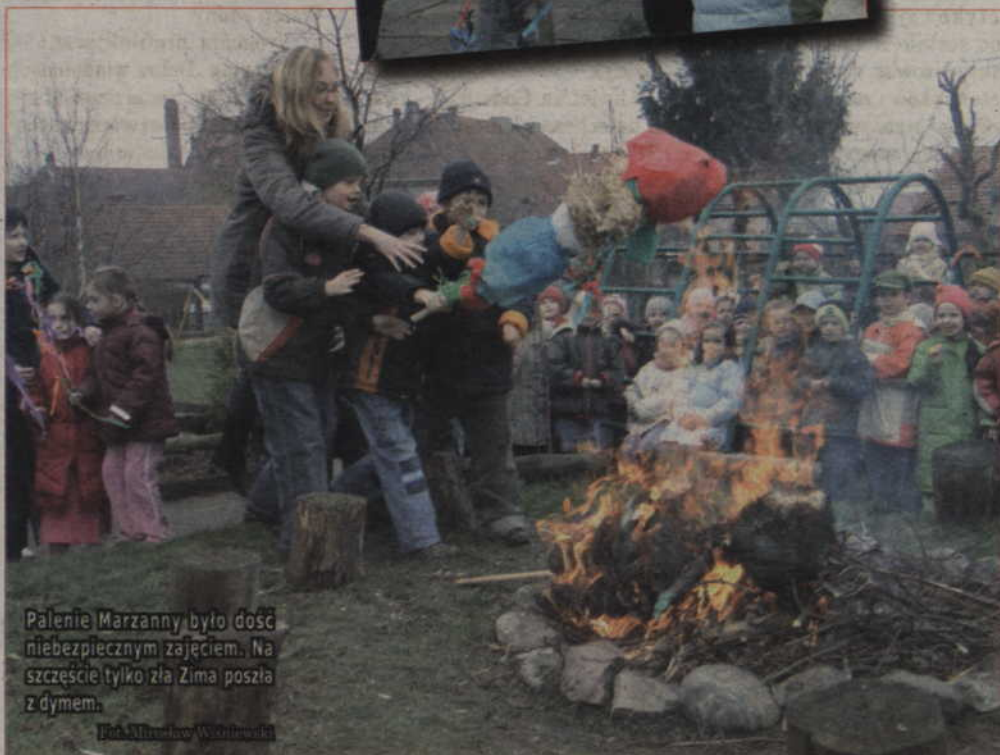
Palenie Marzanny było dość niebezpiecznym zajęciem. Na szczęście tylko zła Zima poszła z dymem.