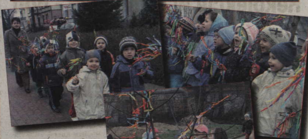
Piękny zielony gaik przywołuje wiosnę.