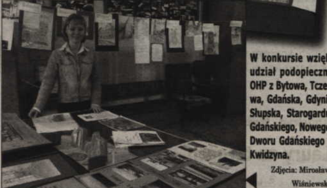
W konkursie wzięli udział podopieczni OHP z Bytowa, Tczewa, Gdańska, Gdyni, Słupska, Starogardu Gdańskiego, Nowego Dworu Gdańskiego i Kwidzyna.