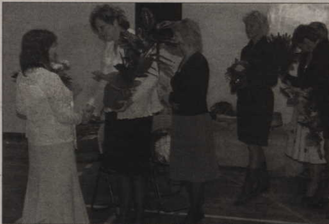
Dyrektorzy innych kwidzyńskich szkół składali „Szóstce” odświętne życzenia.

Szkoła Podstawowa nr 6, jedyna integracyjna szkoła w mieście, obchodziła jubileusz 45-lecia.