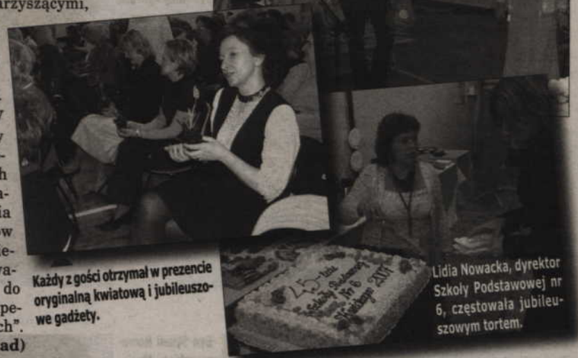
Każdy z gości otrzymał w prezencie oryginalną kwiatową i jubileuszowe gadżety.