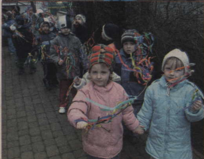
Pochód z zielonym gaikiem - przywitanie wiosny.