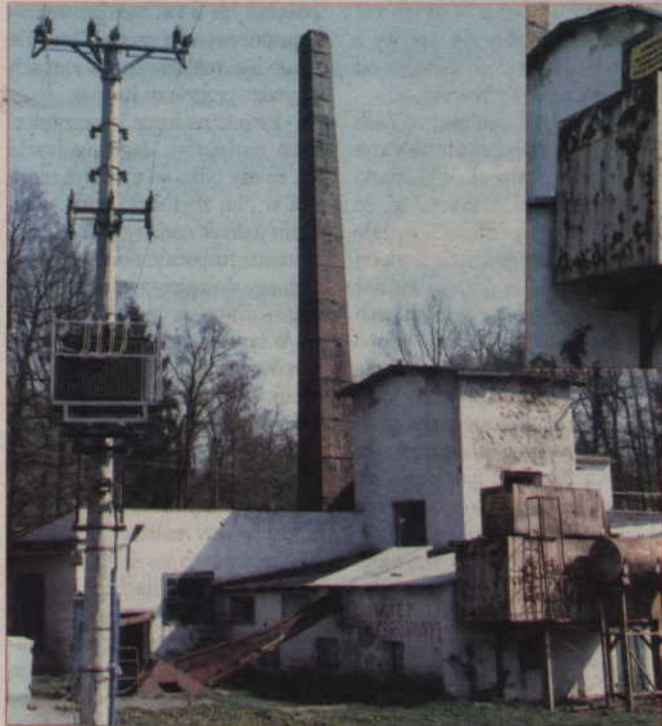
Ostrzegawcze tablice nie zabezpieczają obiektu przed wandalami.