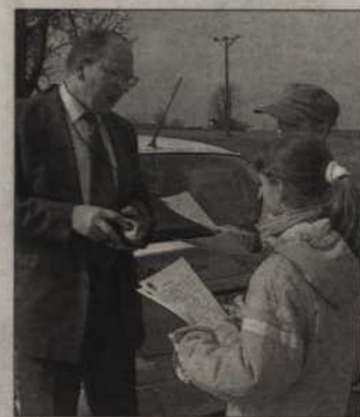
Dzieci wręczały kierowcom list, przypominający o tym, że nie można wsiadać za kierownicę po pijanemu.