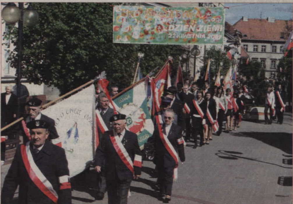
Wszyscy uczestnicy przemaszerowali deptakiem pod pomnik Józefa Piłsudskiego.