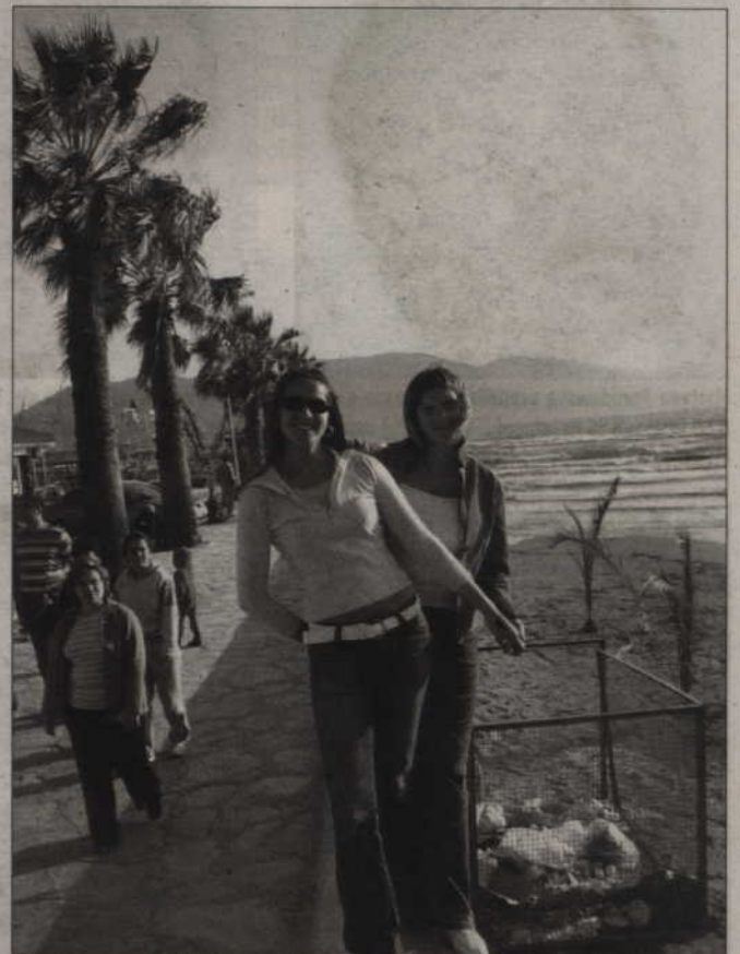
Kwidzyńskie studentki od kilku miesięcy uczą się i odpoczywają w Turcji.