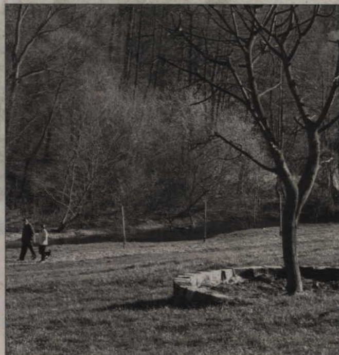
Zdaniem radnych gminy Kwidzyn, źle przeprowadzono prace, które miały usunąć zbędny muł z Liwy. Na zdjęciu: Widok na rzekę od strony Kwidzyna.