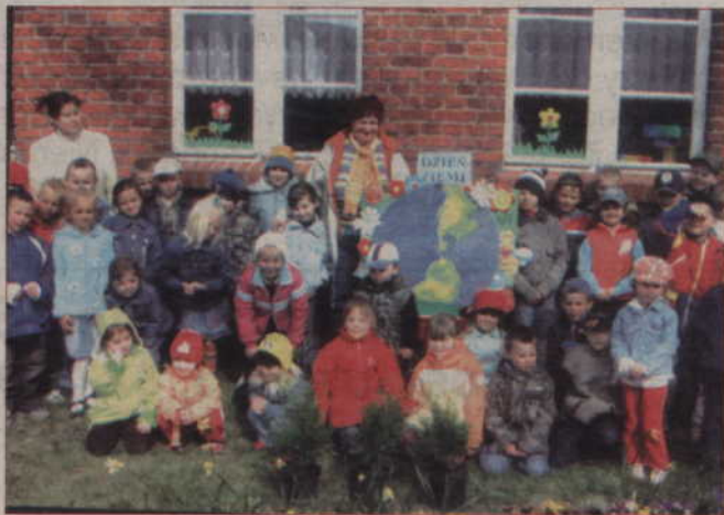
Nauczycielki pomogły im sadząc iglaki.