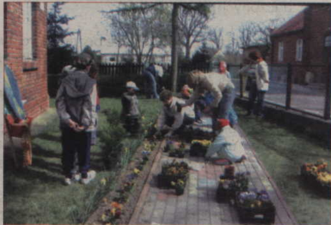
Dzieci posadzili bratki na rabacie przed budynkiem przedszkola.