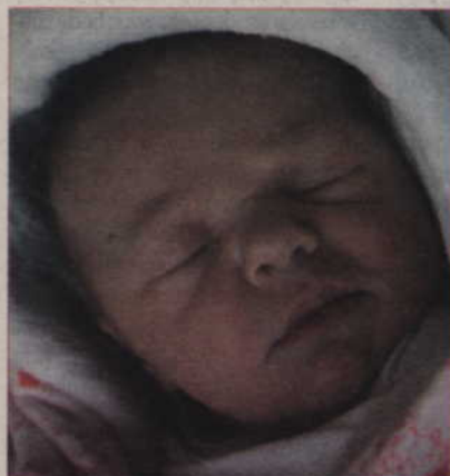
Córka Beaty i Mariusza Radziwiłłów z Otlówka, przyszła na świat 5 maja o godz. 17.45 (waga: 3,4 kg, długość: 54 cm).