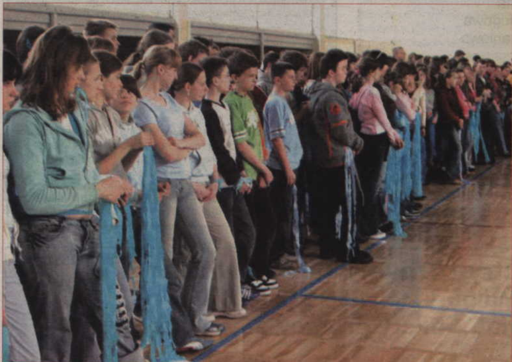
Gimnazjaliści mieli przy sobie błękitne wstążki i inne elementy – ten kolor jest symbolem tolerancji.