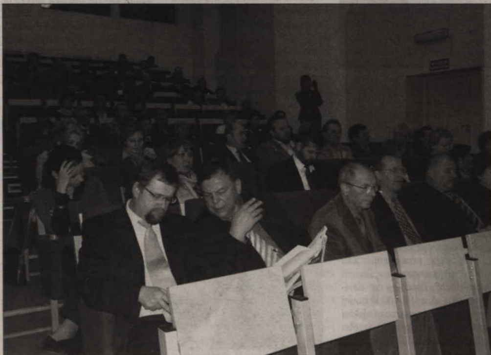
Możliwości finansowania przedsięwzięć na obszarach wiejskich w latach 2007-2013 to temat konferencji, która odbyła się w Kwidzynie.