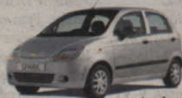
upusty do 4 500 zł