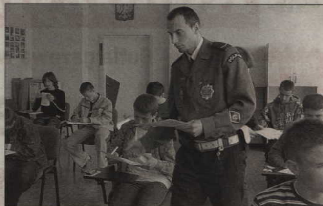
Uczniowie rozwiązywali test z przepisów ruchu drogowego. Jak się okazało, poradzili sobie z tym wspaniale.

W Gimnazjum nr 3 i w Szkole Podstawowej nr 5 w odbył się powiatowy etap konkursu „Bezpieczni w Ruchu Drogowym”. Policjanci kwidzyńskiej drogówki wspólnie z nauczycielami przeprowadzili test wielokrotnego wyboru z zakresu ruchu drogowego, a następnie uczniowie wzięli udział w sprawdzianie praktycznym.