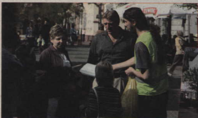
Kwidzianie przyszli na deptak, by wziąć udział w happeningu pod hasłem „Namów do segregacji odpadów”.