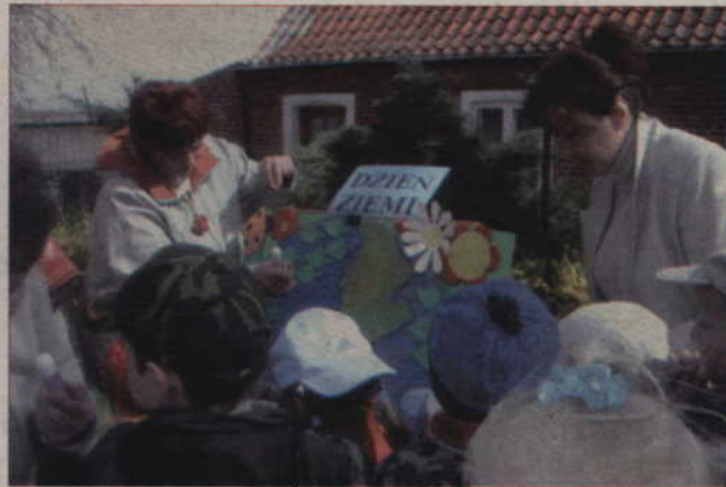
Przedszkolaki z Rakowca uczyły Światowy Dzień Ziemi.