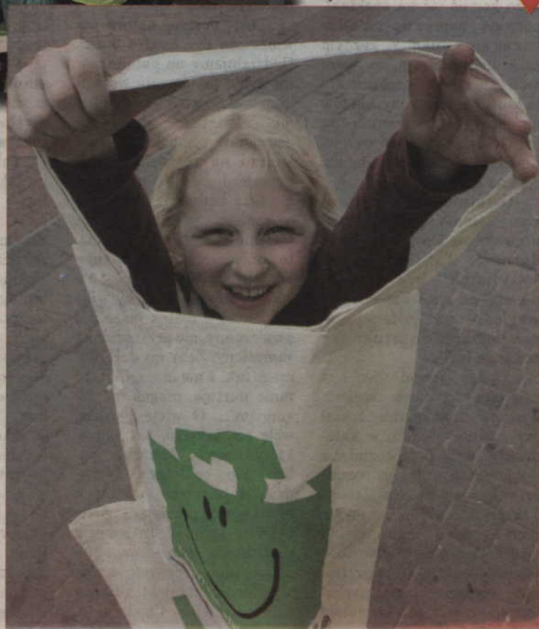
Najmłodszy mieszkańcy Kwidzyna namawiali przechodniów do segregacji odpadów. Pojemniki ustawiono na deptaku.