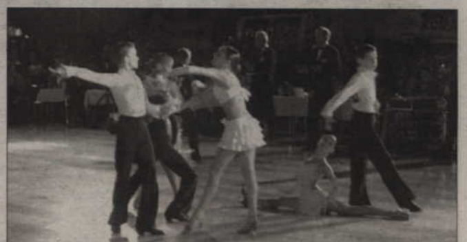
26 maja w hali Kwidzyńskiego Centrum Sportu i Rekreacji przy ul. 11 Listopada odbędzie się Kwidzyński Festiwal Tańca. Imprezę organizują Kwidzyński Klub Tańca „Progress” i Kwidzyńskie Centrum Kultury.