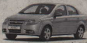
upusty do 7 000 zł

Odwiedź jeden z salonów Chevroleta i wybierz samochód, który idealnie wpasuje się w linię Twoich potrzeb. Czeka na Ciebie rodzinne Lacetti z atrakcyjnymi upustami i ekonomiczne Aveo. A może wolisz miejskiego Sparka? Bogate wyposażenie naszych modeli zapewni Ci prawdziwy komfort jazdy. Nie wahaj się. Dołącz do rodziny Chevroleta! Chevrolet - Marka General Motors.