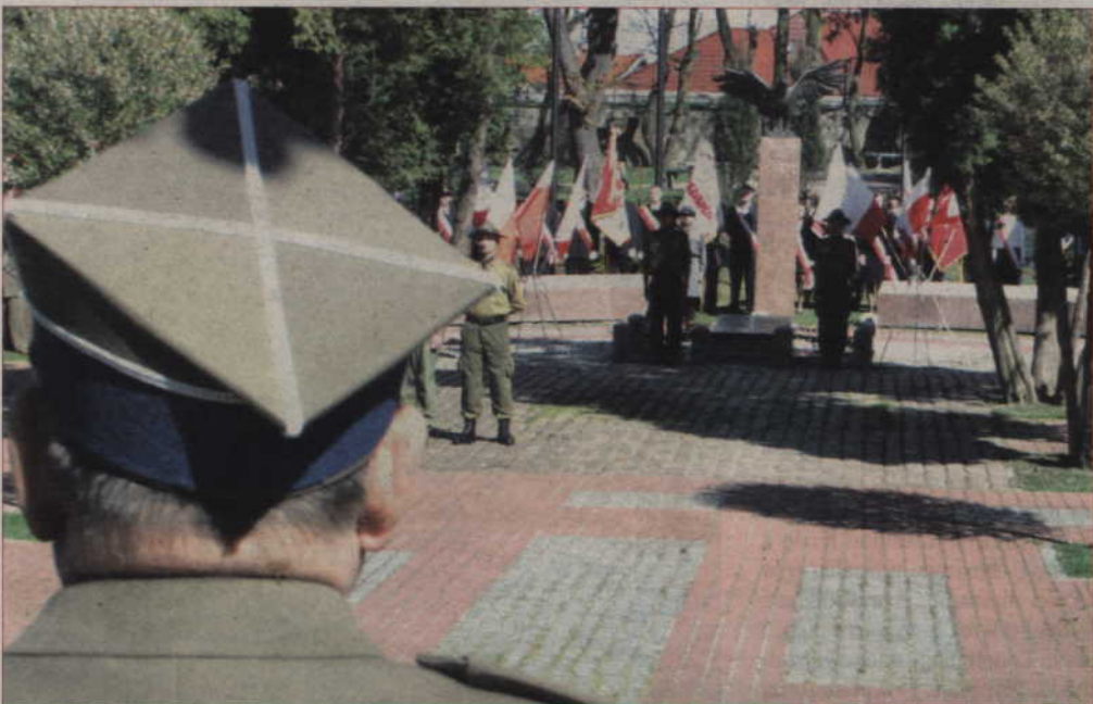
Kwiaty i wieńce złożyła młodzież i przedstawiciele organizacji kombatanckich.