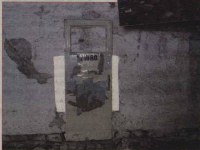
Zabytkowy budynek niszczeje, bo jego administrator, Agencja Nieruchomości Rolnych, nie zajmuje się nim.