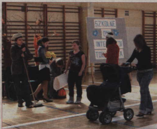
Scena ze spektaklu „Tolerancja”, który przygotował szkolny zespół teatralny.