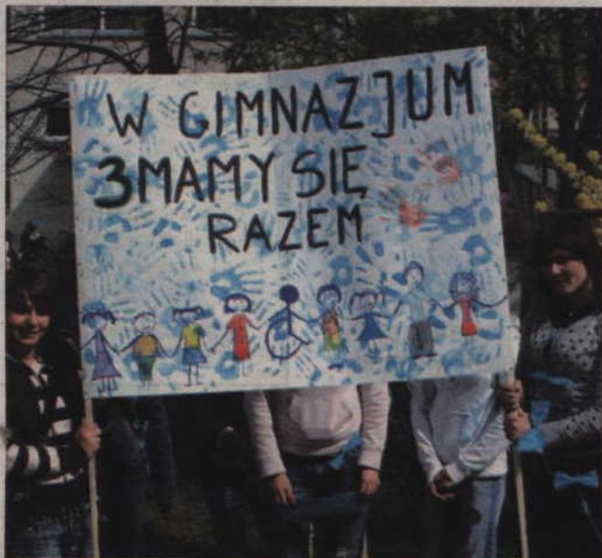
Uczniowie przygotowali okazjonalne plakaty.