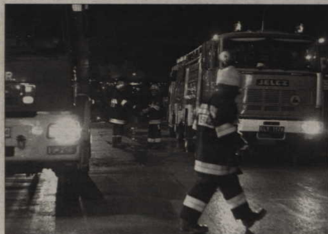
Strażacy szybko ugasili pożar, dzięki temu ogień nie rozprzestrzenił się na sąsiedni budynek.

tylko, na łóżku, ciało 60-latka. W oględzinach zwłok wziął udział prokurator, potem przewieziono je do sekcji w kwidzyńskim szpitalu.