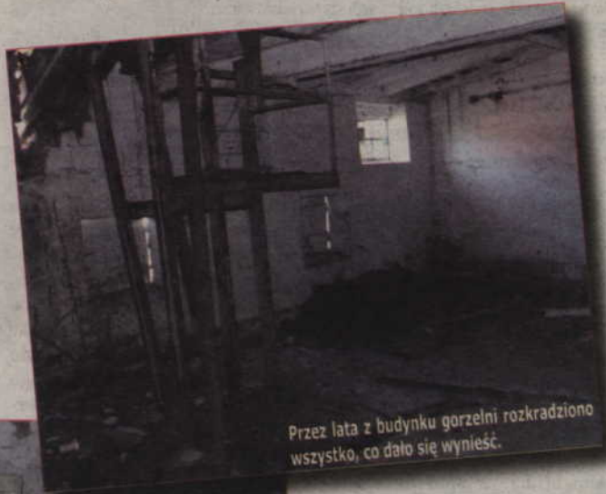
Przez lata z budynku gorzelnii rozkradziono wszystko, co dało się wynieść.

- To jest opieszałość i brak gospodarności Agencji Nieruchomości Rolnej, a nie zarządu powiatu. Możemy udokumentować, ile razy samorząd prosił o przekazanie nie tylko tej, ale innych nie-