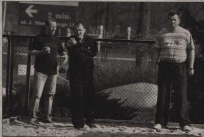
Przez cały rok odbywają się w powiatach kwidzyńskim i sztumskim imprezy w ramach Roku Powiśla. W maju m.in. rozegrane zostaną turnieje rekreacyjne na kwidzyńskim stadionie.