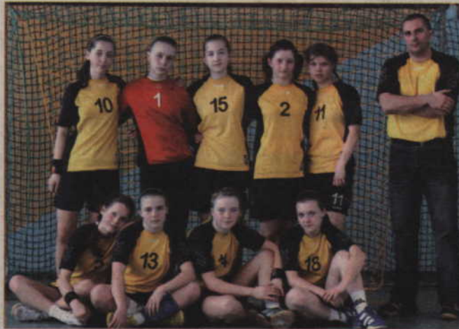
Zespół Bellatora czeka teraz wyjazd na turniej półfinałowy do Szczecina.

W ostatnim meczu, Bellator zmierzył się z Gościbią Sułkowie. Mecz rozpoczął się bardzo dobrze, bowiem Ryjewo prowadziło 9:4.