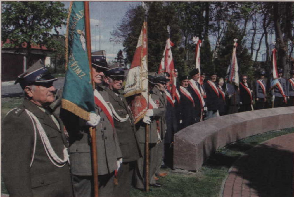
Uroczystości z okazji 216 rocznicy uchwalenia Konstytucji 3 Maja rozpoczęły się na Skwerze Kombatantów.