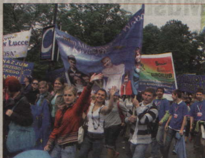
Kwidzińscy licealiści przeszli ulicami Warszawy w Paradzie Schumana.

Kwidzyn - Warszawa. Licealiści na Paradzie Schumana