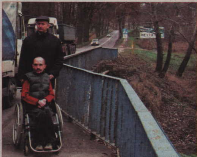
Brak chodnika przy bardzo ruchliwej drodze zagraża bezpieczeństwu przechodzących tamtędy osób, m.in. niepełnosprawnych, którzy uczestniczą w zajęciach w centrum rehabilitacji w Górkach.