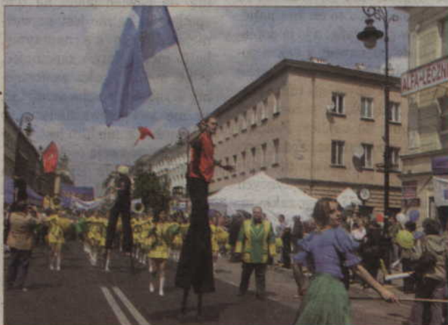
Trasa przemarszu wiodła z Placu Bankowego na Nowy Świat.