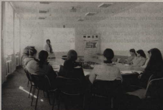
Litewscy studenci na wykładzie z ochrony środowiska.

jak Wyższa Szkoła Zarządzania w Kwidzynie, dwa wydziały: zarządzania i nauk o zdrowiu. Litewscy studenci wysłuchali prowadzonych przez K. Strzałę-Osuch trzech trzygodzinnych wykładów na temat ekonomii ochrony środowiska i instrumentów ekonomicznych, stosowanych w ochronie środowiska na świecie i w Polsce. Zasadą jest, że wykłady muszą być prowadzone w jednym