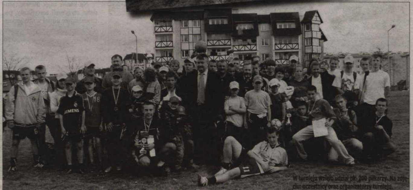
W turnieju wzięło udział ok. 200 piłkarzy. Na zdjęciu uczestnicy oraz organizatorzy turnieju.