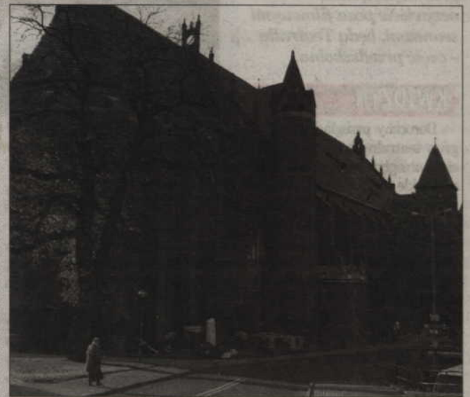
Pośród sakralnych zabytków w powiecie kwidzyńskim najwięcej nakładów wymaga konserwacja kwidzyńskiej katedry. Trzeba m.in. osuszyć mury świątyni

Kwidzyńska katedra została zbudowana w latach 1310-1360. Niedawno zakończył się remont dachu. Zabytek wymaga stałej konserwacji. (jk)