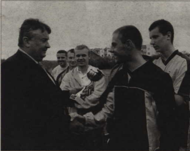
Puchar Prezesa „Renawy” dla reprezentacji B&K Solidarność, najlepszej drużyny piłkarskiego turnieju

Prawie 200 piłkarzy wzięło udział w turnieju piłkarskim, zorganizowanym przez Powszechną Spółdzielnię Mieszkaniową „Renawa” w Kwidzynie. Zawody rozegrano na boisku przy ul. Chrobrego na Osiedlu Piastowskim.