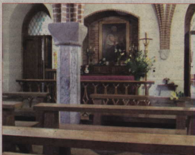
Kwidzyńscy samorządowcy zastanawiają się, jak we wniosku o unijne dotacje połączyć planowane inwestycje w strefie obok katedry, by mieć szansę na dofinansowanie.

Sprawę utrudnia także fakt, że wnioski o dofinansowanie z unijnej puli można składać dopiero powyżej określonej kwoty – tak więc oddzielne projekty na renowację poszczególnych zabytków nie wchodzi w grę. Samorządowcy zastanawiali się, jak połączyć planowane w powiecie inwestycje, dotyczące