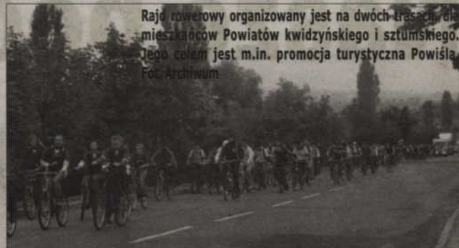
Rajd rowerowy organizowany jest na dwóch trasach dla mieszkańców Powiatów kwidzyńskiego i sztumskiego. Jego celem jest m.in. promocja turystyczna Powiśla.