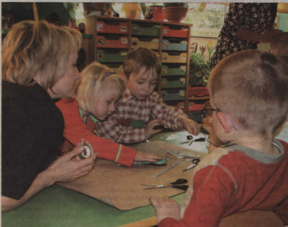
Największą radość sprawiło dzieciom budowanie modelu ciała człowieka. Jak widać, przydawały się także baloniki czy słomki do napoi.