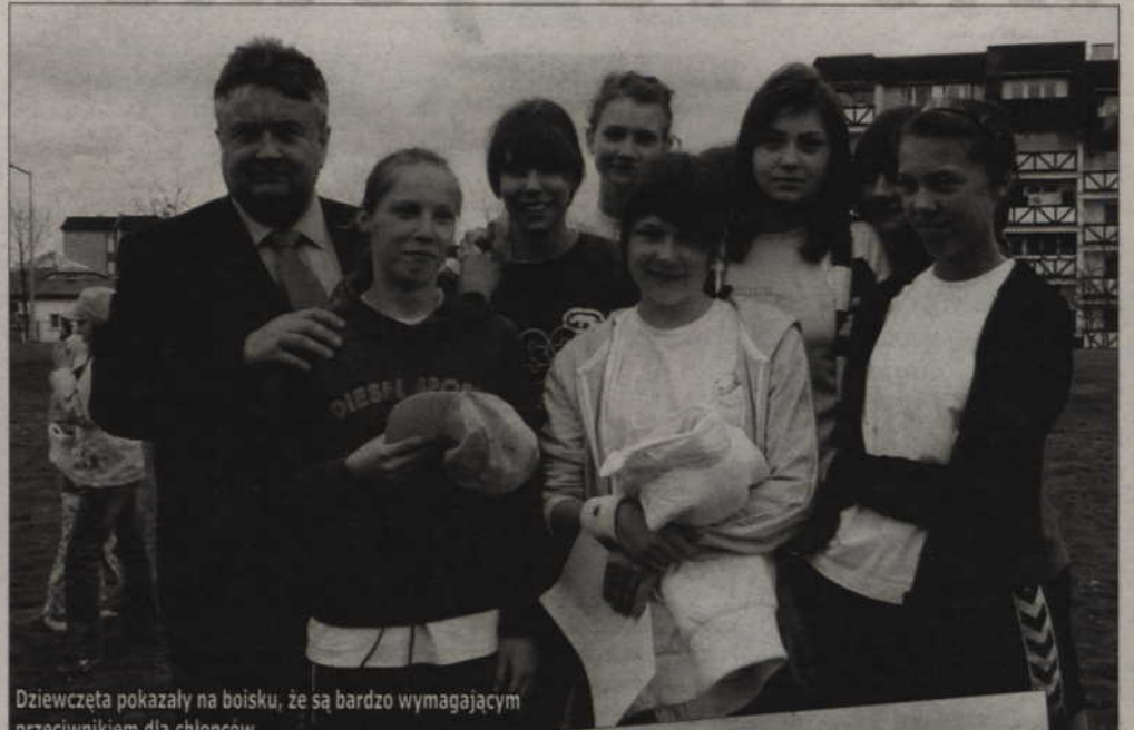
Dziewczeta pokazały na boisku, że są bardzo wymagającym przeciwnikiem dla chłopców