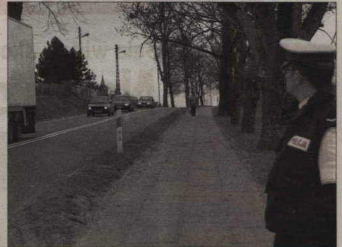
700 zł - tyle łapówki chciał wręczyć policjantom kierowca, którego zatrzymano, gdy po pijanemu jechał volkswagenem.

Kwota była spora - 700 zł, ale i wina kierowcy volkswagena passata ogromna - miał 1,78 promila alkoholu w wydychanym powietrzu. Funkcjonariusze odmówili i zatrzymali 37-latkę. Został osadzony w Pomieszczeniu dla Osób Zatrzymanych w Komendzie Powiatowej Policji w Kwidzynie. Banknoty, które kierowca chciał dać policjantom, zabezpieczono z pomocą policyjnego technika kryminalistyki. Kierujący „wpadł” podczas rutynowej kon-