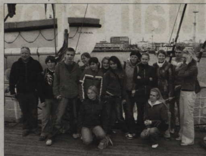
Wspólne zdjęcie uczniów z Grodna i Kwidzyna podczas wyprawy do Gdyni.