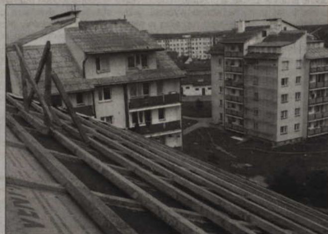
Samorząd gminy Kwidzyn chce zutylizować 10 tys. m kw. azbestowych dachów.