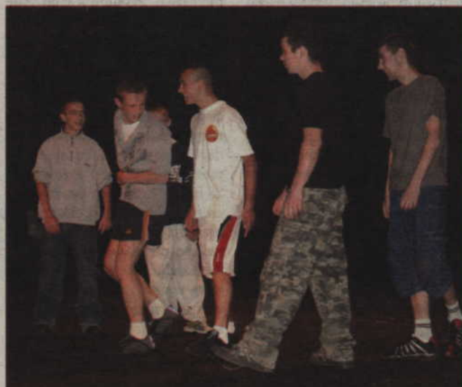
Młodzieżowy Ośrodek Wychowawczy w Kamienicy Elbląskiej przygotowuje spektakl teatralny „Życie jest tylko jedno” poruszający problemy młodzieży związane z przemocą

Bardzo widowiskowy spektakl przygotował gospodarz imprezy, czyli Młodzieżowy Ośrodek Wychowawczy im. Janusza Korczaka w Kwidzynie. „Pan Tadeusz - krótka historia pewnej miłości” ukazał w nowym świetle