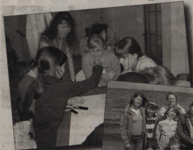
Młodzi ekolodzy ze Szkoły Podstawowej nr 4 wzięli udział w konferencji w Gdańsku. Spotkanie zakończył wspólny spacer po plaży.