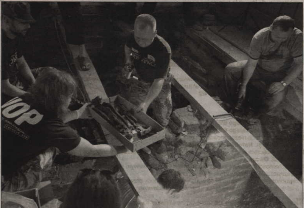
Jeśli badania potwierdzą hipotezę, to odkrycie stanie się światową sensacją - nigdzie indziej nie odnaleziono żadnych grobów wielkich mistrzów zakonu krzyżackiego.