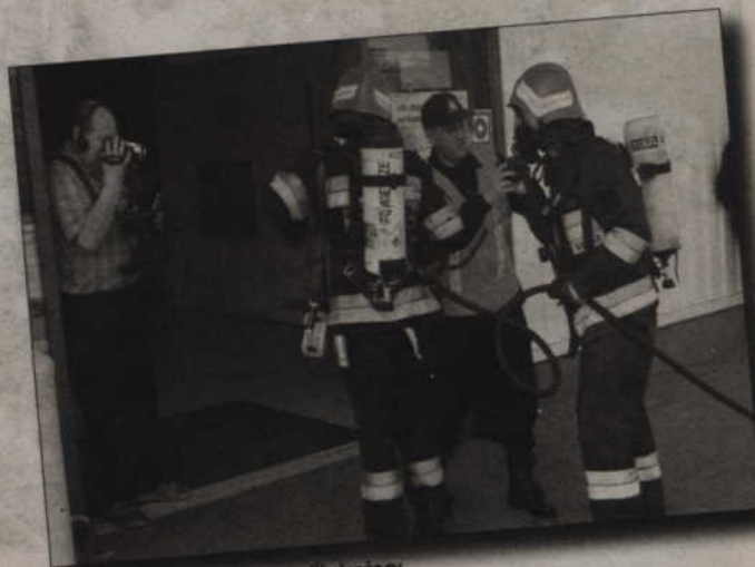
Natychmiast do akcji przystąpili strażacy.