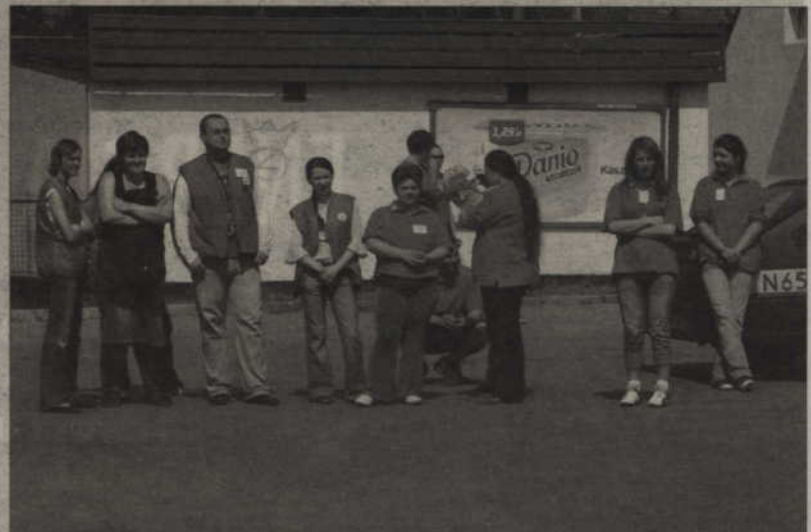
Pracownicy sklepu przyglądali się wszystkiemu z daleka.