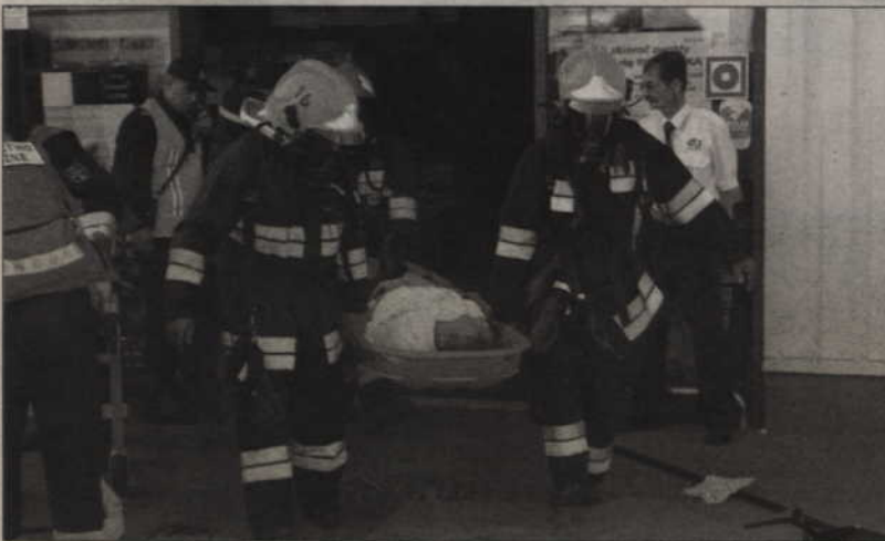
Kolejni ranni trafiają w ręce ratowników.