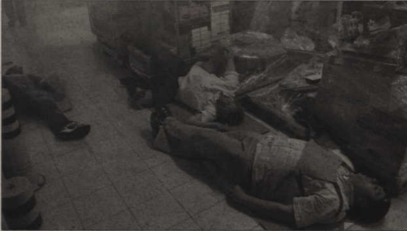
Po wybuchu gazu na zapleczu marketu rannych zostało kilkanaście osób.