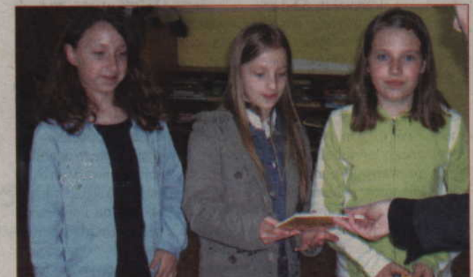
Reprezentacja biblioteki w Rakowcu wzięła udział w konkursie czytelniczym