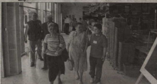
Pracownicy sklepu pomagali wyjść ze sklepu zaskoczonym klientom.