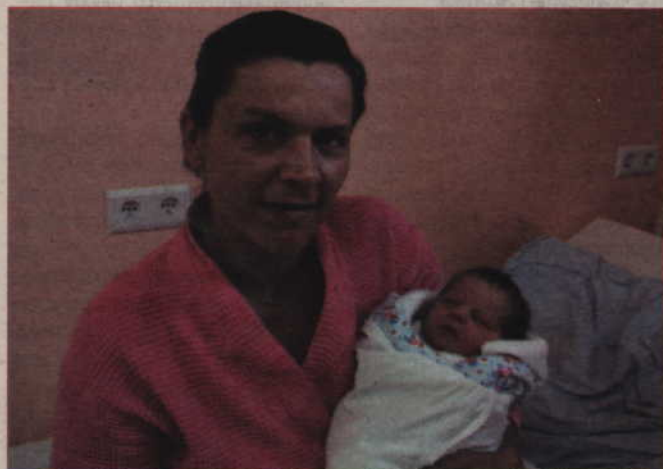
Syn Edyty i Kazimierza Jędrzejewskich z Nowej Wioski, przyszedł na świat 26 maja o godz. 22.50 (waga: 3,1 kg, długość: 53 cm).