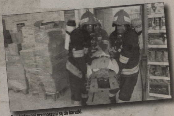
Poszkodowani przenoszeni są do karetki.