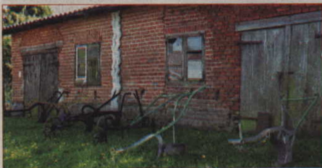
Dawny sprzęt rolniczy, którego wystawę można zobaczyć w Rodowie, dostarczyli mieszkańcy wsi