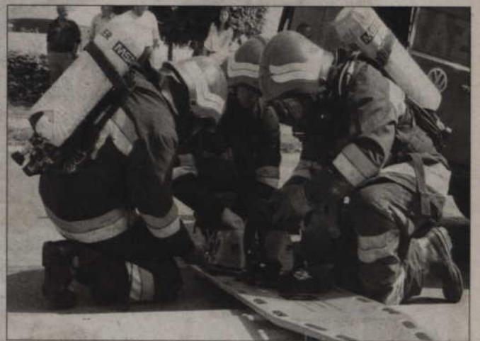
Dla rannych przygotowano nosze.