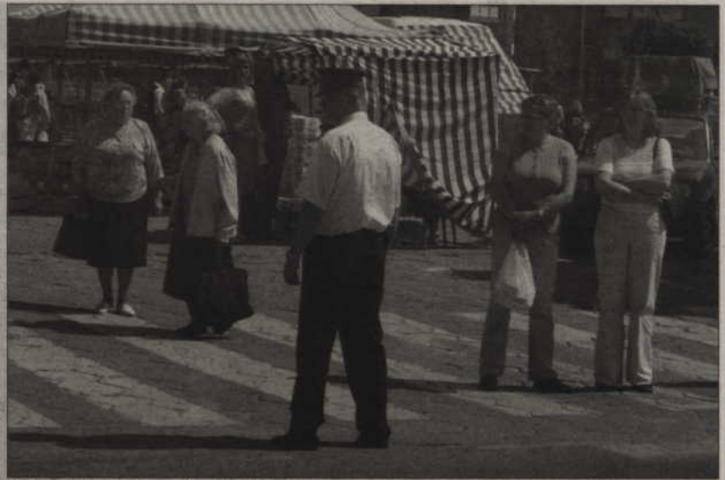
Policjanci pilnowali porządku i dbali o bezpieczeństwo akcji.