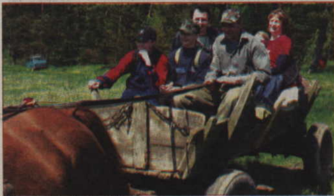
Wielką atrakcją dla wszystkich okazała się przejażdżka wozem drabiniastym