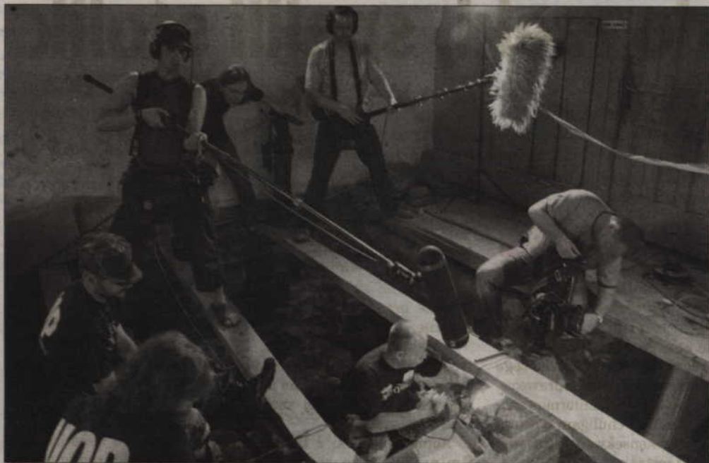
Badania archeologiczne i wizyta antropologa w kwidzyńskiej katedrze zainteresowały ogólnopolskie media. Prace naukowców rejestrowały kamery m.in. telewizji publicznej, a także rozgłośnie radiowe.

Więcej na temat badań archeologicznych w kwidzyńskiej katedrze w kolejnych wydaniach