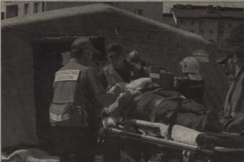
Umieszczano ich w specjalnym medycznym namiocie.