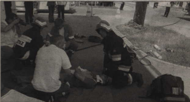
Ratownicy udzielali pomocy zaraz po opuszczeniu budynku sklepu.