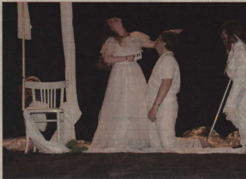
„Niegorsi” z Warsztatu Terapii Zajęciowej w Górkach, prowadzonego przez kwidzińską Fundację „Misericordia” ze spektaklem „Wyjątkowa Matka” zdobyli nagrodę publiczności