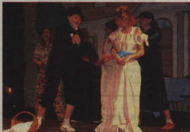
Bardzo widowiskowy spektakl przygotował gospodarz imprezy, czyli Młodzieżowy Ośrodek Wychowawczy im. Janusza Korczaka w Kwidzynie. „Pan Tadeusz - krótka historia pewnej miłości” ukazał w nowym świetle dzieło Adama Mickiewicza