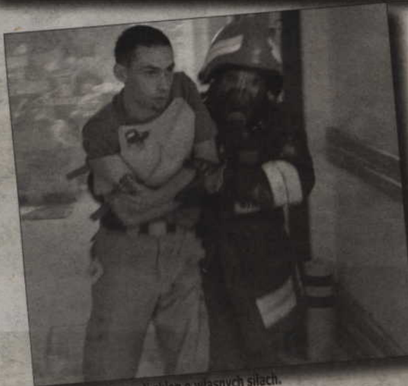
Lżej ranni opuszczali sklep w własnych siłach.