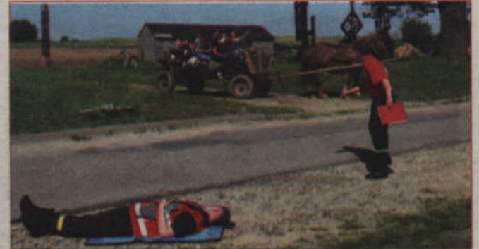
Uczestnicy zawodów udzielali pomocy rannemu w zainscenizowanym wypadku

Organizatorzy dziękują wszystkim którzy pomogli w przygotowaniach, a szczególnie