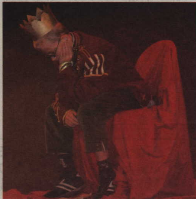
„W poszukiwaniu szczęścia” to spektakl przygotowany przez Ośrodek Szkolno-Wychowawczy w Barcicach (gmina Ryjewo). Nawet bycie królem nie daje szczęścia