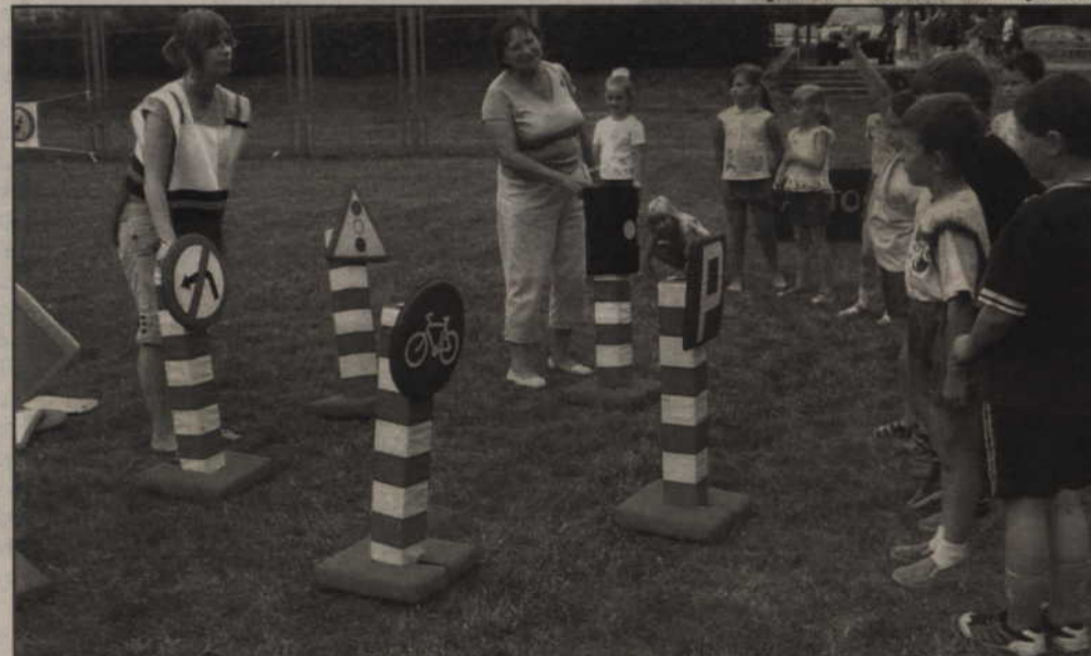
Przyszli uczniowie klas pierwszych musieli wykazać się także wiedzą teoretyczną.

Program, który jest realizowany w kilkunastu miastach w województwie pomorskim, zaleca Ministerstwo Edukacji Narodowej. Jest on popierany przez Pomorską Radę Bezpieczeństwa Ruchu Drogowego, Pomorskiego Kuratora Oświaty oraz Komendę Wojewódzka Policji w Gdańsku.