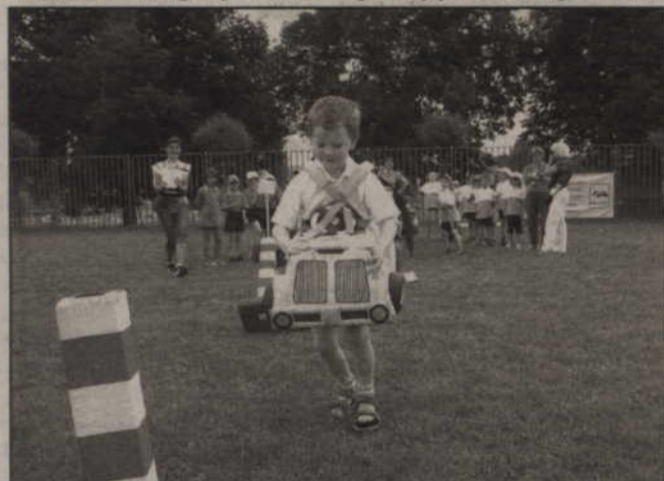
Dzieci, korzystając ze znaków drogowych oraz samochodów-zabawek, wykonanych z kolorowych, bezpiecznych materiałów, poznają znaki drogowe i zasady poruszania się po ulicach.

samochodów-zabawek, wykonanych z kolorowych, bezpiecznych materiałów, poznają znaki drogowe oraz