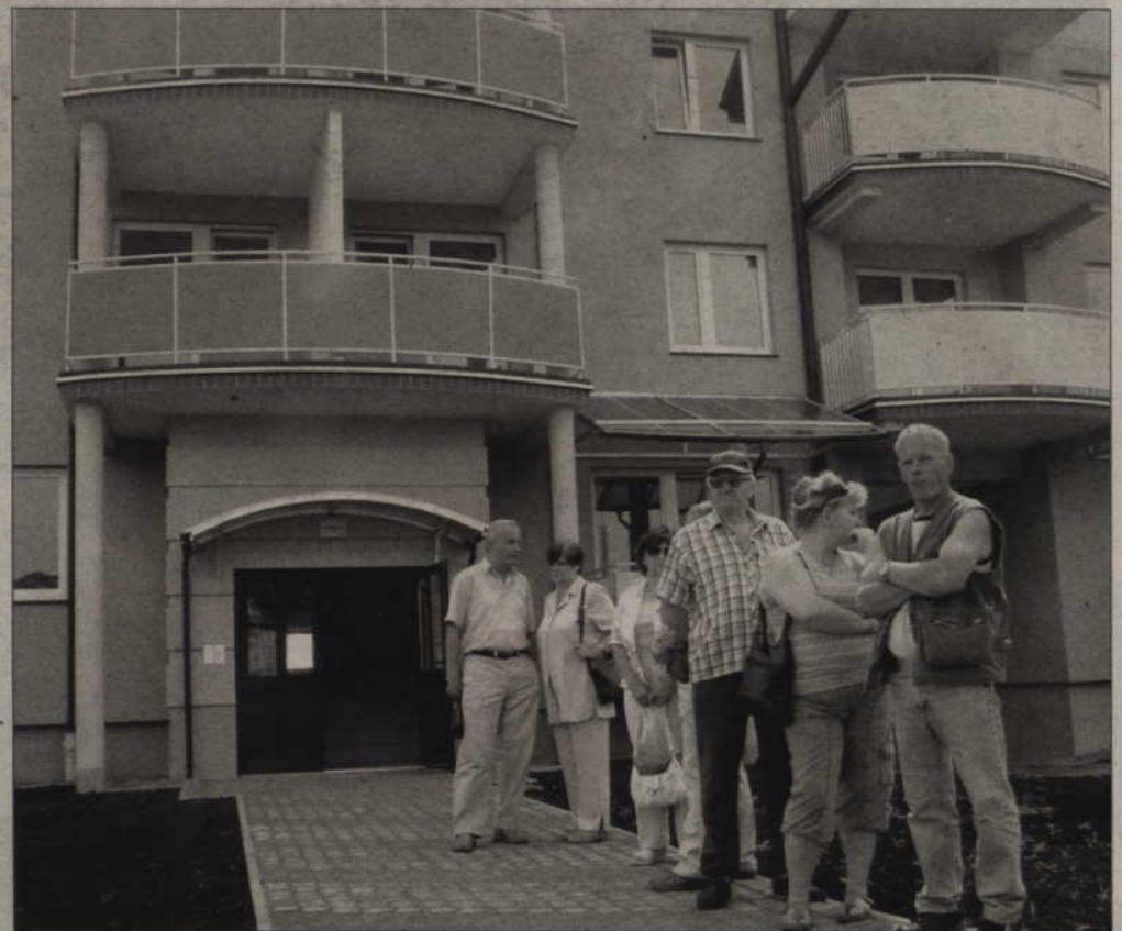
W nowym budynku Renawy przy ul. Chrobrego zamieszkało 68 rodzin.

-Ceny w budownictwie bardzo wzrosły. Wielu rezygnuje, jednak Renawa zamierza kontynuować budowę mieszkań. Gratulacje należą się też wykonawcom, gdyż udało się doprowadzić do końca budowę za cenę, która wynikała z przetargu. Będziemy nadal pomagać spółdzielni przekazując uzbrojone tereny. Przy budynku, który powstał, wybudowaliśmy pierwszy odcinek ulicy Lokietka. W sąsiedztwie