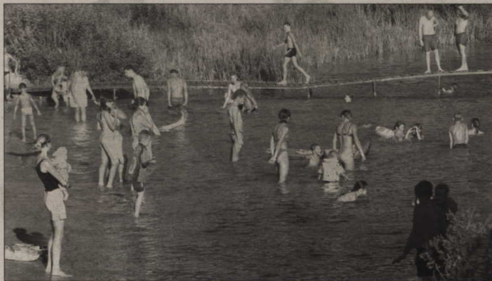
Turyści odpoczywający nad jeziorami w powiecie kwidzyńskim spierają się o to, czy motorówki i inne głośnie wodne pojazdy mogą tam pływać bez ograniczeń. Wielu letnikom przeszkadza hałas.