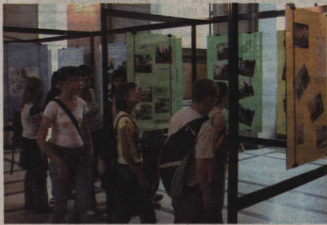
Uczniowie na wystawie podsumowującej dotychczasowe działania z zainteresowaniem śledzili poczynania innych grup