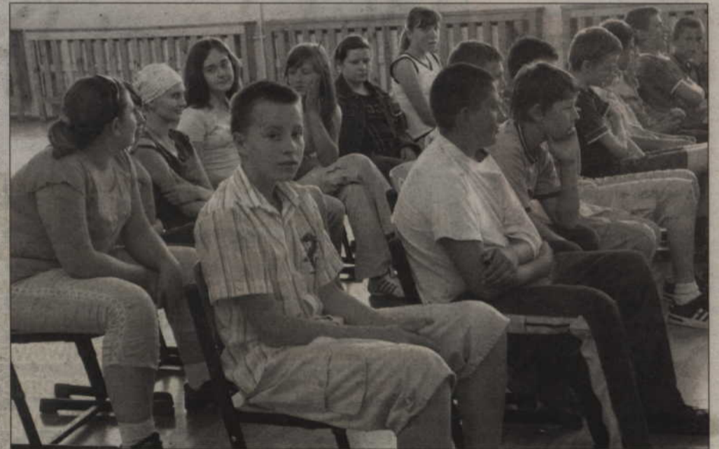
Uczniowie Szkoły Podstawowej w Korzeniewie słuchają prelekcji policjantów.

mogą skończyć się tragedią. Dlatego apelujemy do wszystkich dorosłych, aby wpajali swoim pociechom, jak ważne jest zachowanie ostrożności podczas letniego wypoczynku. (ad)