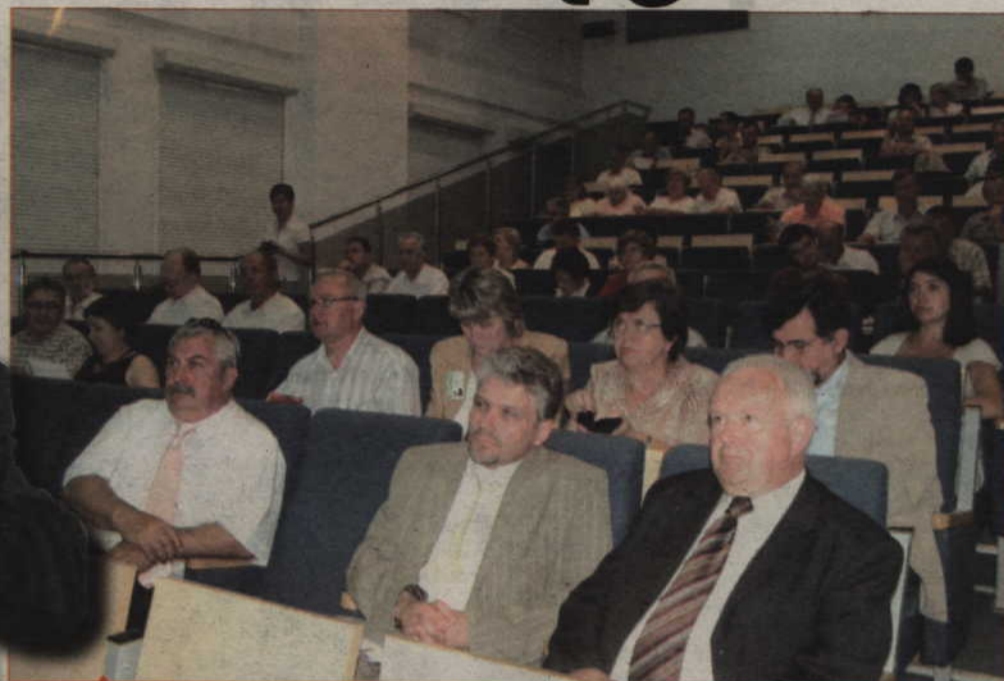
Nad wykorzystaniem energii słonecznej i geotermalnej zastanawiali się samorządowcy i naukowcy. Konferencję zorganizowało Towarzystwo Rozwoju Powiatu Kwidzyńskiego.

Utworzenie Bałtyckiego Klastru Ekoenergetycznego to wspólna inicjatywa marszałków województw pomorskiego i warmińsko-mazurskiego, Politechniki Gdańskiej, Uniwersytetu Warmińsko-Mazurskiego, Politechniki Koszalińskiej, Instytutu Maszyn Przepływowych PAN w Gdańsku, a także firm i stowarzyszeń z obu województw. Efektem działań BKEE ma być między innymi wzrost wykorzystania źródeł odnawialnych, zwłaszcza biomasy w Polsce północnej, rozwój technologii odzysku biomasy z odpadów komunalnych i przemysłowych, zmniejszenie obciążenia środowiska zanieczyszczeniami biologicznymi na terenach wiejskich. (jk)