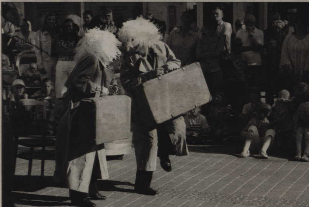
W sobotnie popołudnie warto wybrać się na deptak przy ul. Piłsudskiego. Odbywać się tam będzie festiwal teatrów ulicznych.