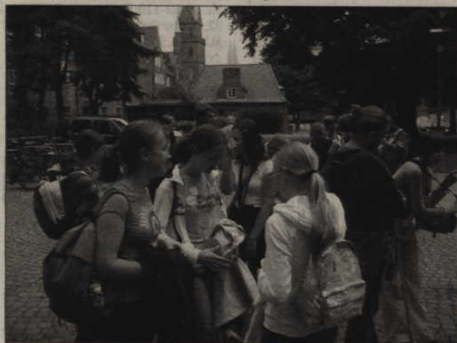
Grupa uczniów z SP 10 w Tczewie przed katedrą w Lubecie.