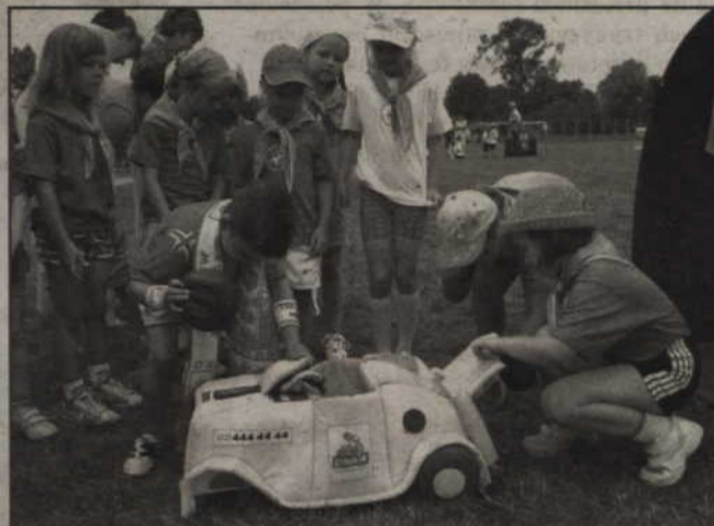
Na zakończenie przedszkolaki otrzymały swoje pierwsze prawo jazdy - na autochodzik.

- Autoriada to sprawdzenie wiedzy najstarszych dzieci, które od września rozpoczną naukę w pierwszych klasach szkół podstawowych. Wiedza przekazywana jest w formie zabawy, dlatego wszystko odbywa się bez specjalnego wysiłku. Sposób ten doskonale się sprawdza, gdyż dzieci mogą pochwalić się znajomością znaków drogowych i zasad poruszania się po drogach. Udało się to szczególnie w Kwidzynie, ponieważ tu program realizują wszystkie przedszkola. Nauczyciele