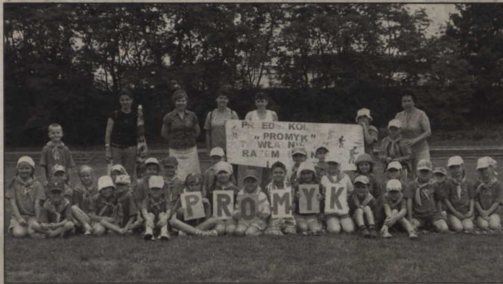
Dzieci ze wszystkich kwidzyńskich przedszkoli wzięły udział w „Autoriadiu”. Na zdjęciu dzieci z Przedszkola „Promyk”.