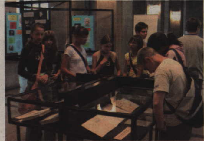
Duże zainteresowanie wzbudziła gablota ukazująca życie i twórczość patrona projektu