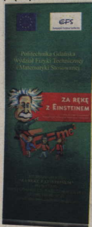
Emblematy projektu ustawiono w wielu miejscach uczelni

Po otwarciu wystawy w hallu Politechniki Gdańskiej uczestnicy projektu „Za rękę z Einsteinem” rozeszli się po salach dydaktycznych, by wziąć udział w ćwiczeniach praktycznych. Młodzież była tak zafrapowana, że trudno ją było nakłonić do oderwania się od sprzętu i podzielenia z nami wrażeniami.