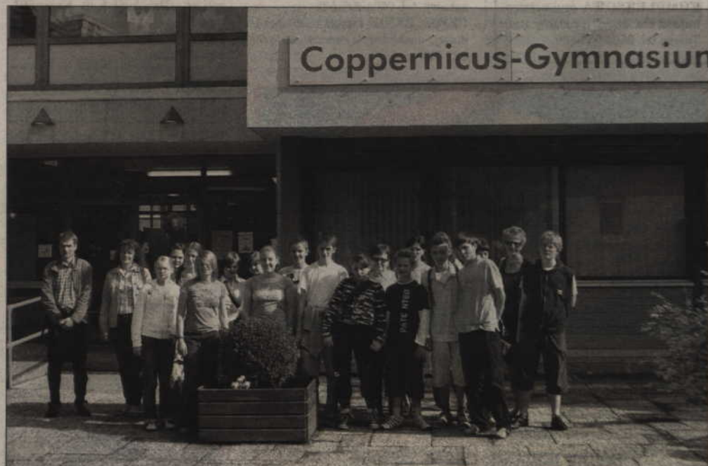
Tczewscy uczniowie przed głównym wejściem do gimnazjum w Norderstedt.

Po śniadaniu w szkolnej kawiarence dzieci udały się do parku wodnego. Potem zwiedziły Norderstedt i spotkały się z panią burmistrz w ratuszu (zjadły tam obiad ufundowany przez miasto). W stacji telewizyjnej nadającej lokalny program uczniowie obejrzyli montażownię, reżyserkę i studio nagrań.