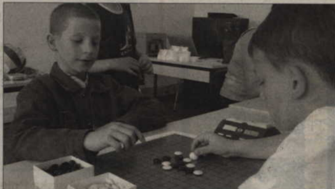
W turnieju wzięło udział 20 osób.

W planach Stowarzyszenia jest organizacja kilku turniejów regionalnych, a także imprezy wyższej rangi: Mistrzostw Polski lub Mistrzostwa Europy. (fox)