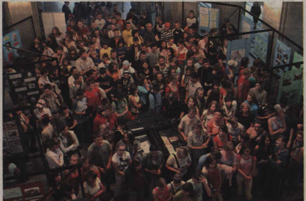
Uroczyste otwarcie „Letniej szkoły fizyki i matematyki” oraz towarzyszącej jej wystawy dedykowanej projektowi „Za rękę z Einsteinem” odbyło się w poniedziałek, 25 czerwca 2007 o godz. 12.00 w hollu Gmachu Głównego Politechniki Gdańskiej.

O tym, co uczniowie w szkole i poza szkołą – pod kierunkiem swoich nauczycieli i kadry Politechniki Gdańskiej – w ramach projektu już przeprowadzili informuje wystawa otwarta w poniedziałek, 25 czerwca w hallu Politechniki Gdańskiej. Dzien-