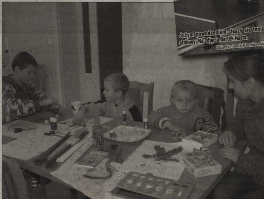
W każdą sobotę od 10 do 15 dzieci i młodzież z sołectwa Górki mogą brać udział w zajęciach przygotowanych przez Gminny Ośrodek Kultury. Gry i zabawy czekają na nich w zabytkowym pałacu.

Zajęcia będą odbywały się w każdą sobotę od 10 do 15. (jk)