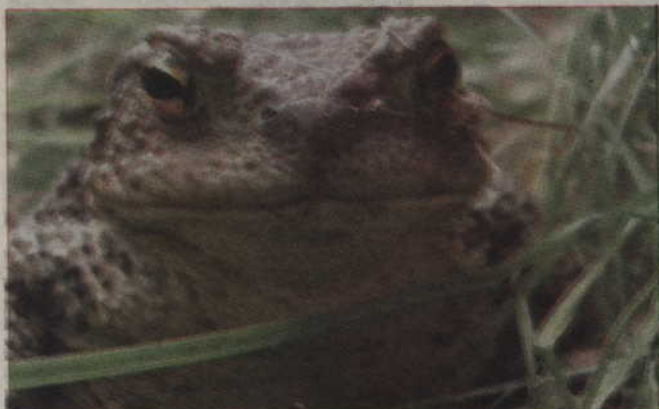
Zdjęcia Klaudii Jabłońskiej ze Szkoły Podstawowej nr 6 zajęły II miejsce w konkursie.

Rozstrzygnięto fotograficzny konkurs „Najciekawsze zdjęcie z wakacyjnych podróży”. Już po raz piąty zorganizowała go dla dzieci Filia Środowiskowa nr 3 Biblioteki Miejsko - Pedagogicznej.