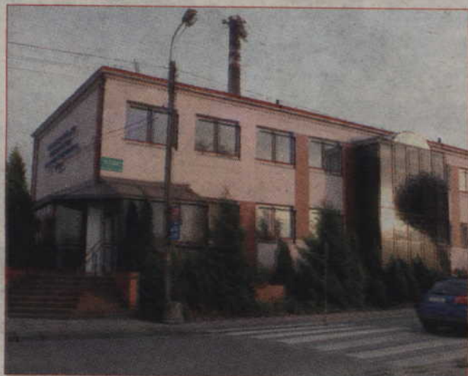
Już wszystkie wydziały starostwa przeniosły się do biurowca Warmińskich Zakładów Przetwórstwa Owocowo - Warzywnego przy ul. Toruńskiej.