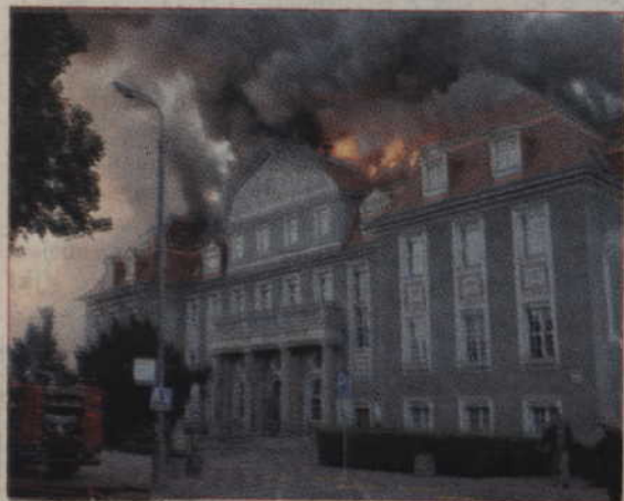
Mimo że od pożaru siedziby Urzędu Miejskiego i Starostwa Powiatowego upłynął miesiąc, oficjalnie nadal nieznana jest przyczyna pożaru. Nie oszacowano też dokładnie strat.