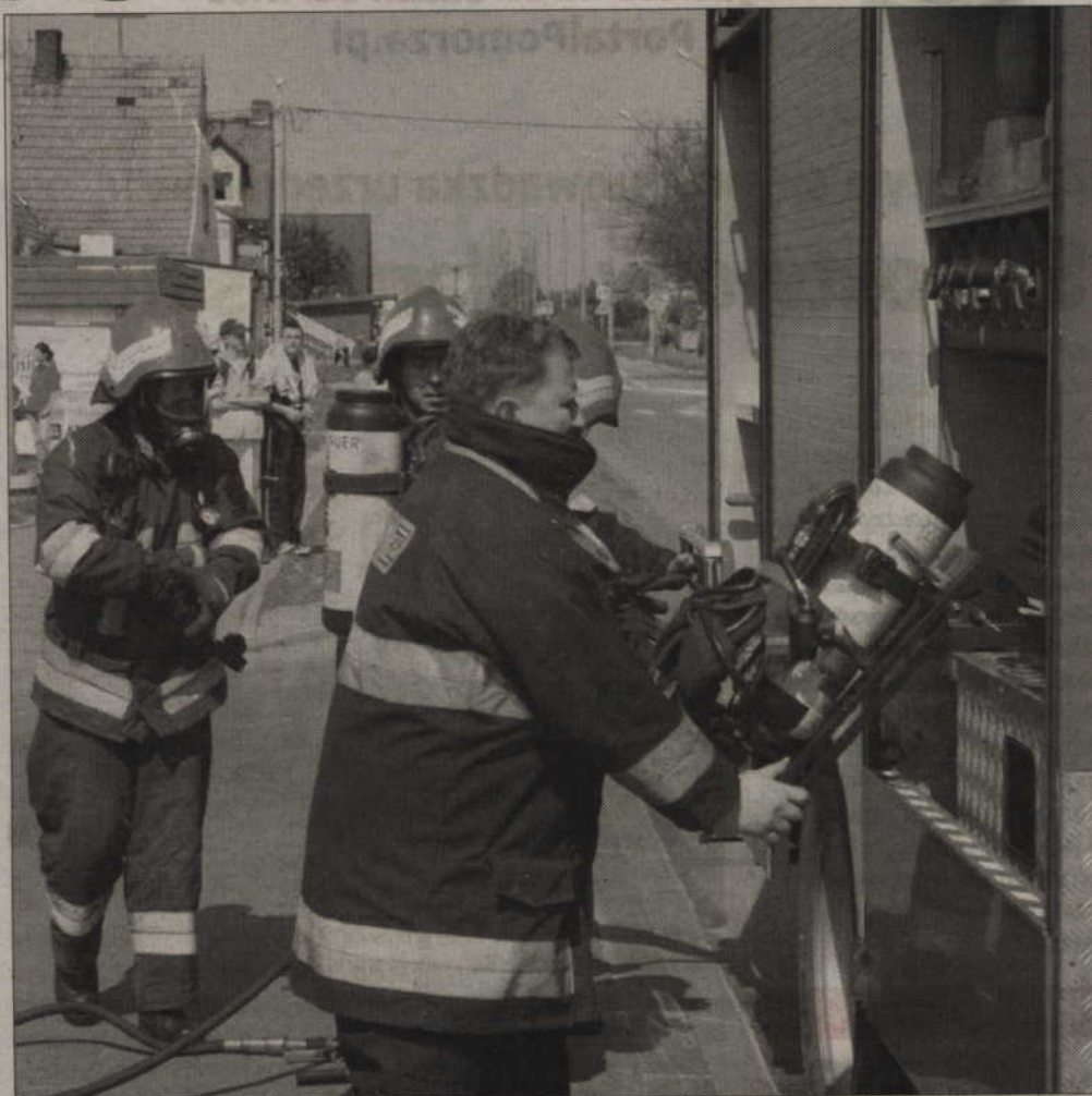
Strażacy coraz częściej wyjeżdżają do pożarów, które wybuchają w osiedlowych śmietnikach.

Skrzydła drzwi, stanowiących wyjście na drogę ewakuacyjną, nie mogą, po ich całkowitym otwarciu, zmniejszać wymaganej szerokości drogi ewakuacyjnej. (jk)