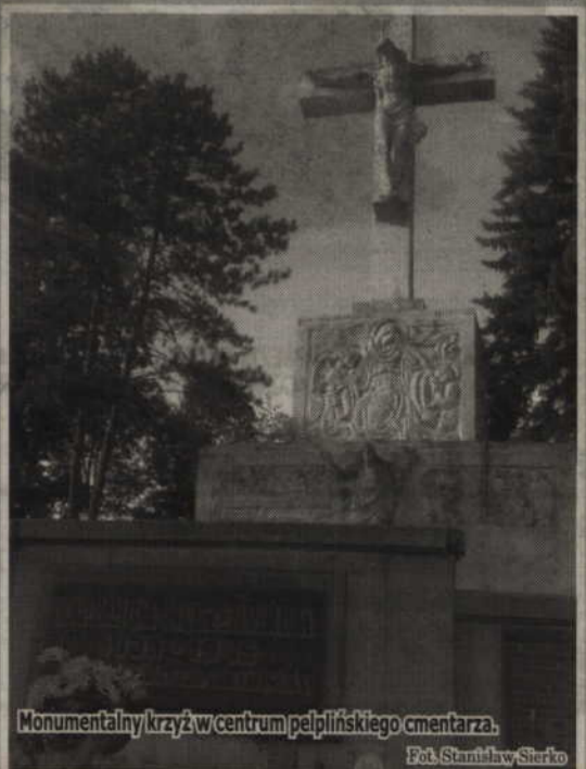
Monumentalny krzyż w centrum pielpińskiego cmentarza.