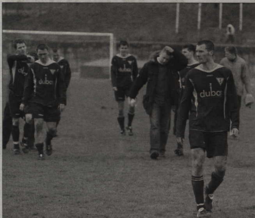
Po meczu z Kotwicą piłkarze Rodła schodzili z boiska jako pokonani.