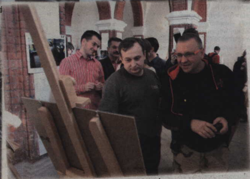
Jurek Owsiak ogląda wystawę dokumentującą kwidzyński finał WOŚP.