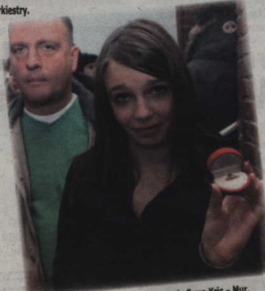
Jedno z serduszek Orkiestry wylicytowała firma Kris - Mur.