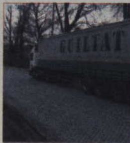
Usunięta z ulicy Sportowej kostka brukowa ma ozdobić plac Jana Pawła II przed teatrem.

Wizyta samorządowców w Warszawie nastraja opty-