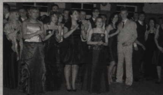
Jeśli organizator studniówki uzna, że jeden z uczniów jest pod wpływem alkoholu, powinien wezwać policjantów, którzy mogliby zbadać stan jego trzeźwości. Wicedyrektor I LO tego nie zrobił i wyprosił chłopaka ze szkoły. Dlatego został ukarany.