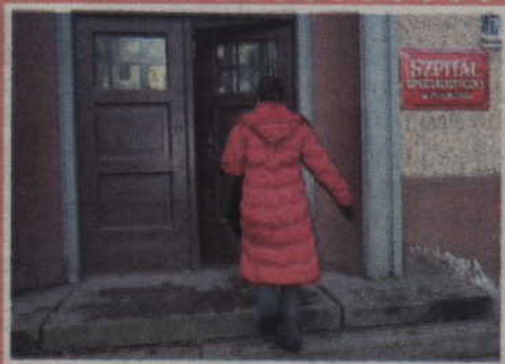
W najbliższym czasie prabucki szpital czeka likwidacja oddziałów i zwolnienia pracowników.

Zatrudnienie ma być zredukowane o 132 etaty, tylko niewielka część zwolnionych osób znajdzie pracę w kwidzyńskim szpitalu, pozostali dostaną odprawy. (ad)