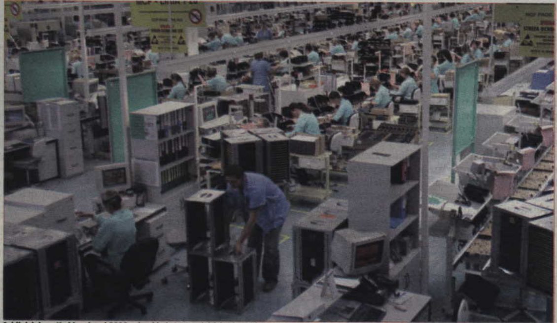
Jabil działa w Kwidzynie od 2002 roku, kiedy to przejął fabrykę od koncernu Philips.

Jabil jest trzecią największą firmą elektroniczną w Polsce i największym przedsiębiorstwem w województwie pomorskim, zatrudnia ok. 5000 pracowników, wytwarza 16 milionów płyt bazowych i ponad 3 miliony odbiorników telewizyjnych rocznie. Posiada trzy fabryki o łącznej powierzchni 64 000 m kw. w Pomorskiej Specjalnej Strefie Ekonomicznej. (ad)