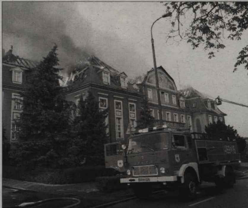
Remont zniszczonego w pożarze budynku Urzędu Miejskiego potrwa kilka miesięcy.

Trwa odbudowa budynku Urzędu Miasta, który został zniszczony we wrześniowym pożarze. Obecnie naprawiany jest dach, kolejny etap to modernizacja wnętrza budynku.