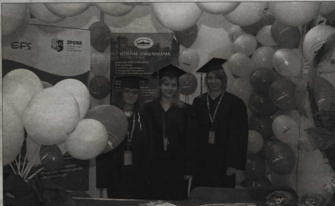
Stoisko Wyższej Szkoły Zarządzania w Kwidzynie oceniono wysoko. WSZ zajęła II miejsce Na targach Akademii 2008 w Gdańsku.

Targi AKADEMIA to miejsce, gdzie kandydaci na studia mogą poznać i porównać oferty edukacyjne kilkudziesięciu szkół wyższych: państwowych i prywatnych. Wśród 91 wystawców były również szkoły pomaturalne i językowe, organizatorzy kursów przygotowawczych i studiów za gra-