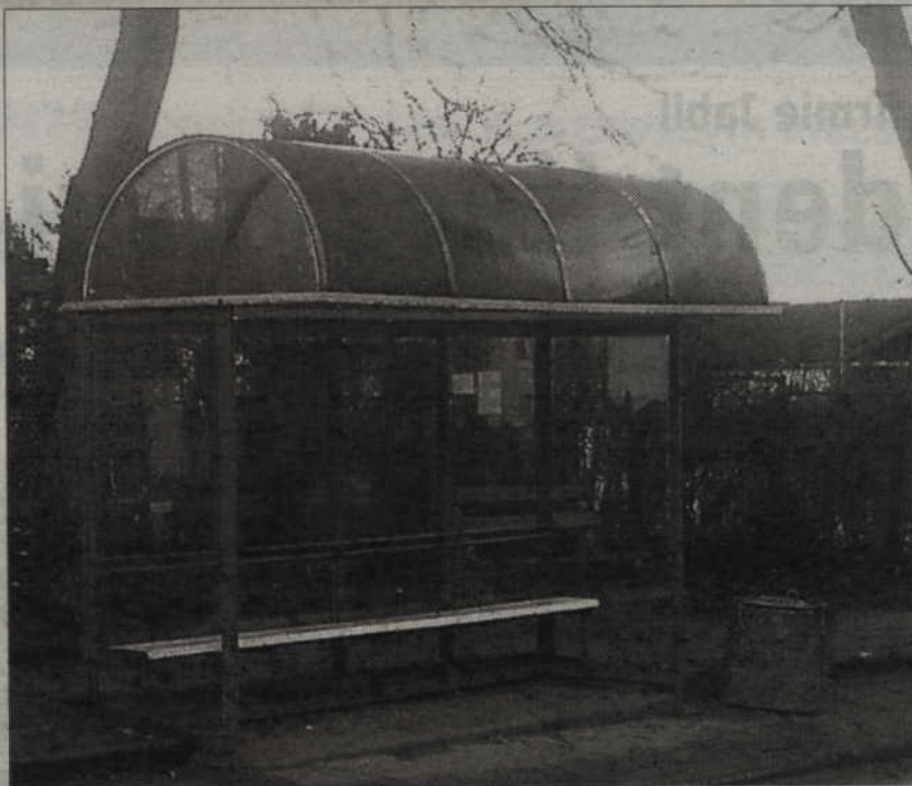
Wandale niszczą przystanki w wielu miejscowościach powiatu kwidzyńskiego.

Z inicjatywy samorządu gminy w lutym dzielnicowi z Komendy Powiatowej Policji w Kwidzynie spotykali się z mieszkańcami. Spotkania odbywały się w ra-