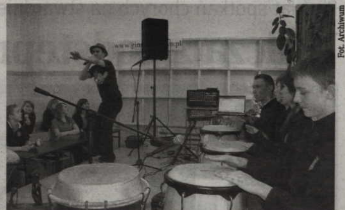
Warsztaty muzyczne w Gimnazjum nr 1 w Kwidzynie.

„Ta oferta edukacyjna była strzałem w dziesiątkę, ponieważ prócz wiedzy, umiejętności i satysfakcji, przyniosła ona jego młodym uczestnikom dobrą zabawę oraz uśmiech i radość ze wspólnie spędzonego czasu. Warto kontynuować w przyszłości to przedsięwzięcie, tak żeby dotrzeć również do innych szkół na terenie miasta i gminy Kwidzyn.