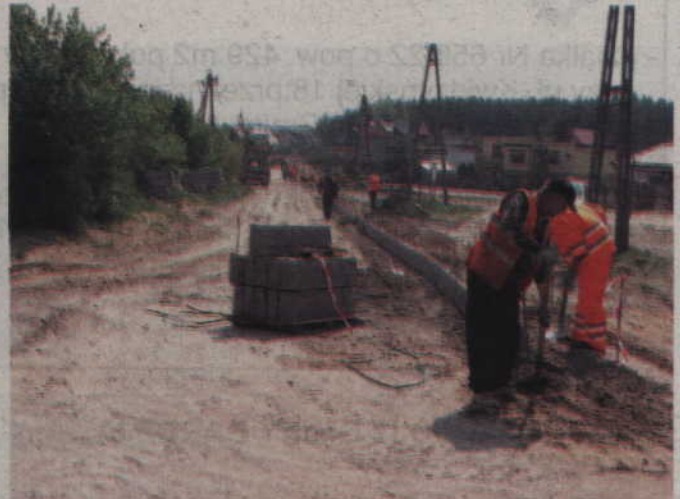
Inwestycja kosztować będzie ok. 3 500 000 zł.