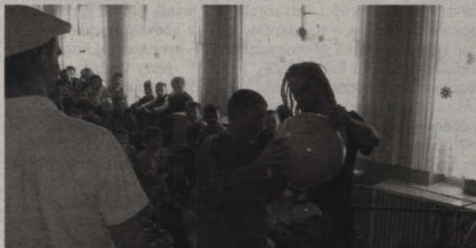
„Muzyka Świata” w Rakowcu.