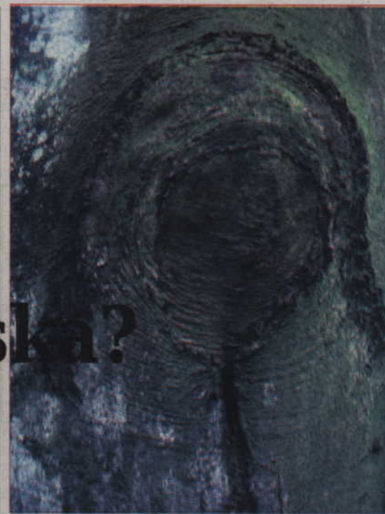
Drzewo w Balewie z ukształtowanym wizerunkiem.

Dojazd z Dzierzgonia: droga na Mikołajki Pom. Za Tywęzami (przed Balewem) skręć w lewo - droga na Cieszymowo (dalej - jak wyżej).