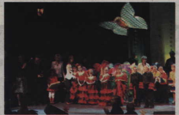
Przedzkolaki zajęły drugie miejsce, otrzymały też specjalną nagrodę burmistrza Prabut za udany debiut sceniczny.