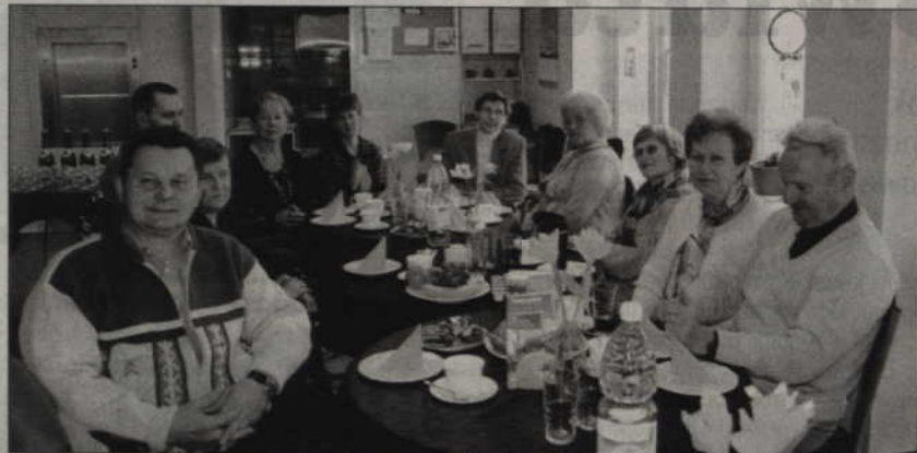
Chory na SM spotkali się, aby świętować piąte urodziny kwidzyńskiego koła Polskiego Towarzystwa Stwardnienia Rozsianego.

Spotkali się pięć lat temu. Uznali, że sami niewiele zdziałają, tym bardziej, że wróg jakiego muszą stawić czoła jest wyjątkowo podstępny i okrutny.