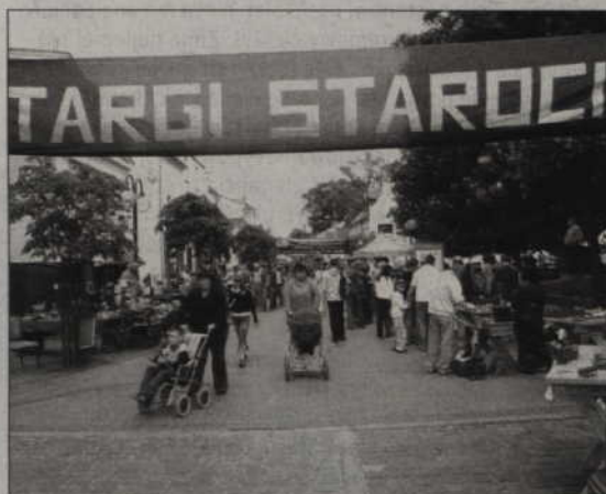
Targi Staroci odbywają się w Kwidzynie od 10 lat.

Od poniedziałku w kwidzyńskim teatrze czynna jest wystawa fotograficzna „Cmentarz na Roszie” au-