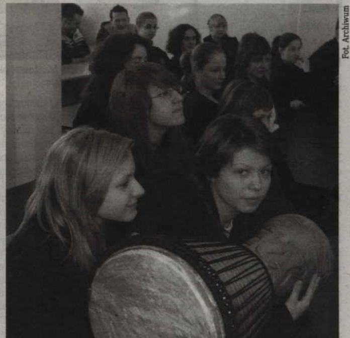
Opr. (ad) Uczennice Gimnazjum nr 1 z jednym z egzotycznych instrumentów.