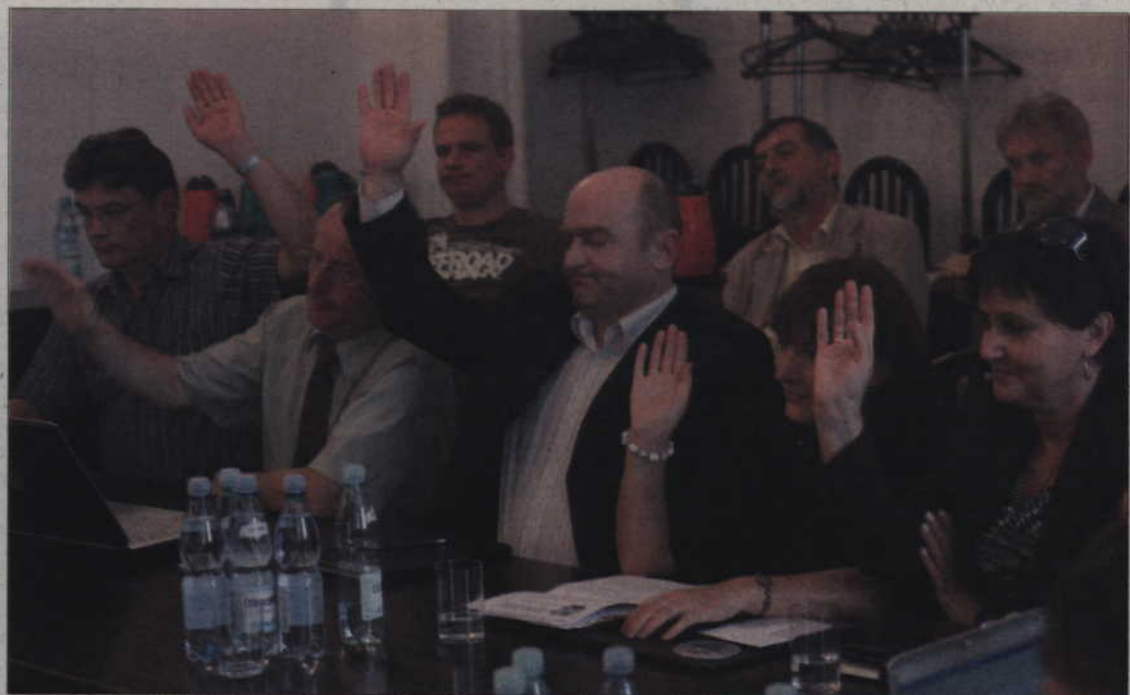
Rada powiatu udzieliła absolutorium staroście.