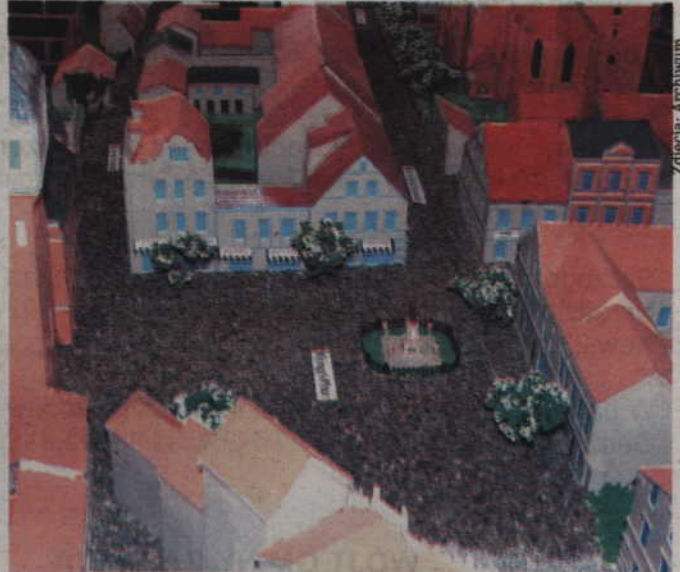
Makieta przedwojennych Prabut powstała na podstawie szkiców, map, fotografii i obrazów z lat 1935-1936.