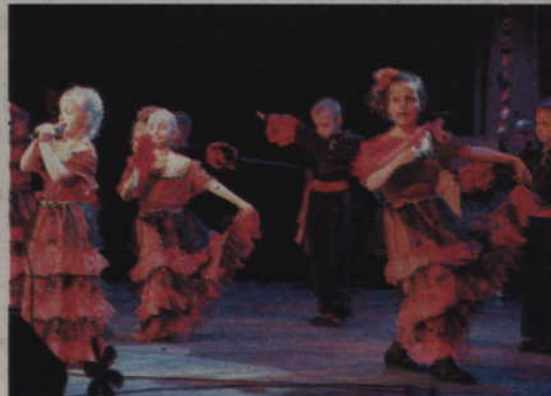
Dzieci z Przedszkola „Bratek - Jedynka” na scenie kwidzyńskiego teatru.