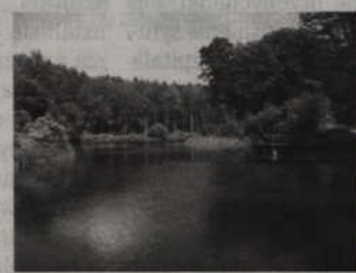
Kilka lat temu ktoś wylał do rzeki chemiczne środki ochrony roślin. Zginęły setki ryb i żyjące nad Liwą bobry.