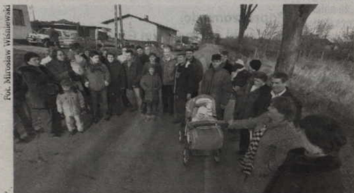
Mieszkańcy Kamionki grozili, że zablokują drogę, jeśli jej nawierzchnia nie zostanie naprawiona.

- ul. Chopina 26 lub telefonicznie - 645 75 40.