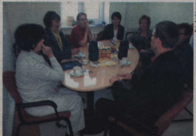
Z okazji Międzynarodowego Dnia Pielęgniarki burmistrz Prabut zaprosił na spotkanie pracownice medyczne Szpitala Specjalistycznego w Prabutach oraz NZOZ Medicus. Były życzenie, podziękowania i miła pogawędka.