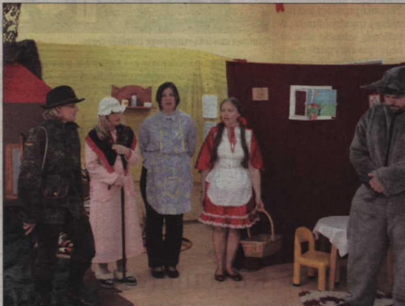
Rodzice przedszkolaków z Rakowca wcielili się w postacie z bajki „Czerwony Kapturek”.