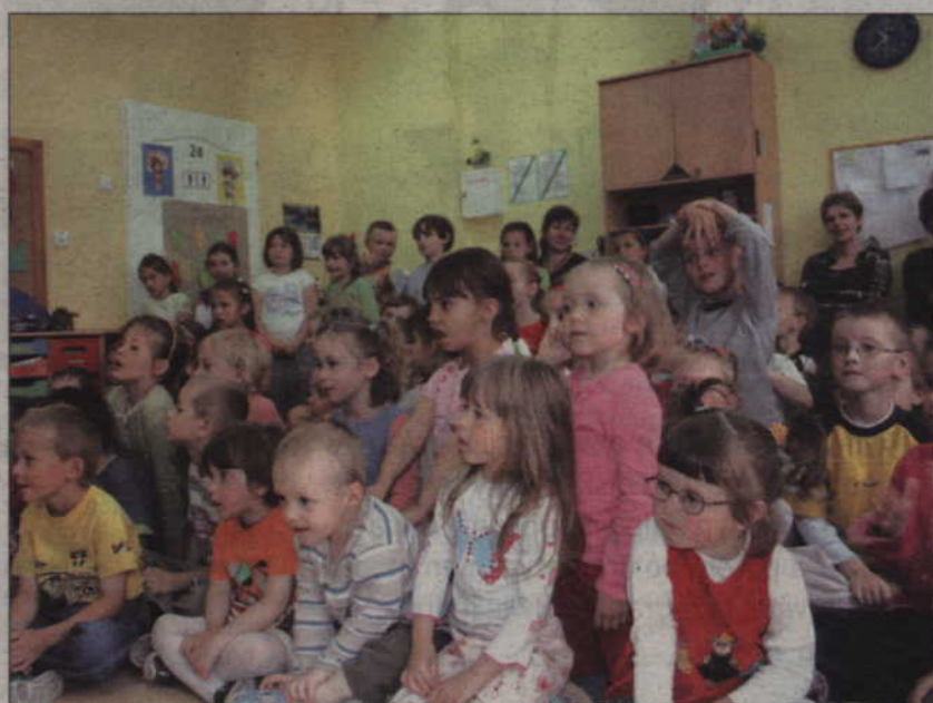
Zgromadzone na widowni dzieci z fascynacją wpatrywały się w występujących na scenie rodziców.