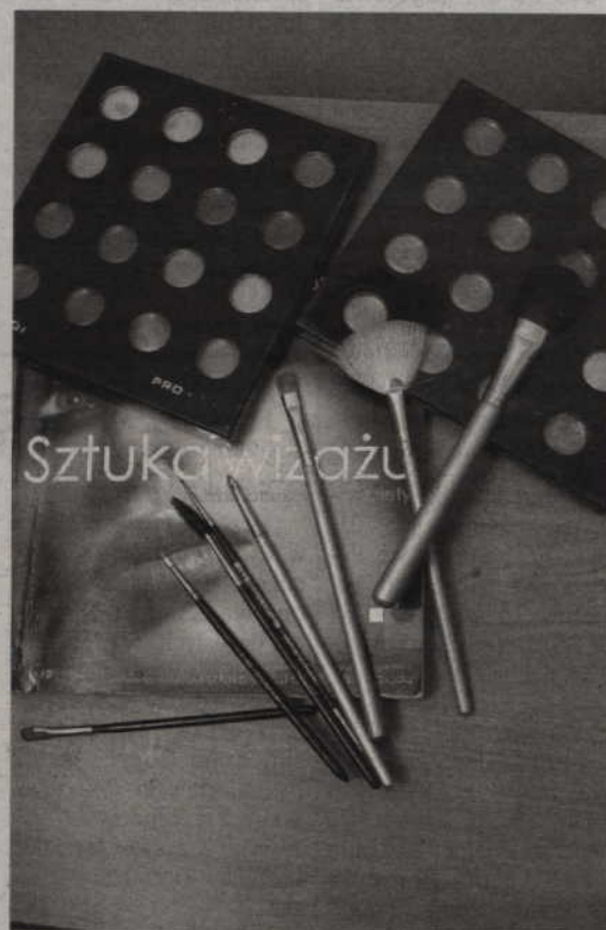
Najlepsze kolory cieni do powiek dla pani Zimy to: szary, grafitowy, fioletowy, turkus.

Makijaż powinien podkreślać wyrazistość tego typu kolorystycznego. Najlepsze kolory cieni do powiek to: szary, grafitowy, fioletowy, turkus. Zdecydowanie odradzam natomiast używanie cieni w odcieniach brązu. Pomadki niech również będą wyraziste, najlepiej w odcieniu czerwieni, maliny, a nawet fioleto.