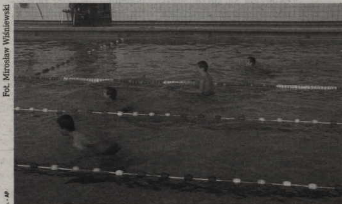
Na pływalni konieczna jest przede wszystkim wymiana wentylacji.