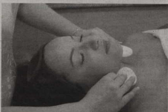
Nalozona na ciało płynna czekolada daje skórze prawdziwy zastrzyk energii.