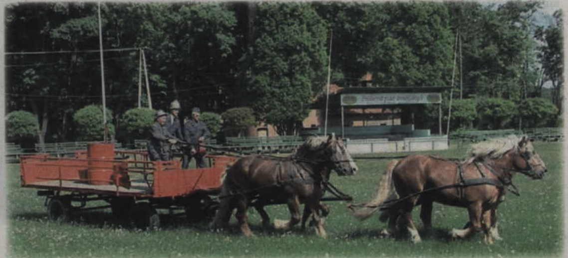
Pracownicy użyli wszystkich swoich umiejętności, aby okiełznać mocno wystraszonego konia.

szkołach oraz budynkach użyteczności publicznej, w których przebywa dużo osób. Były już ćwiczenia w dużym domu handlowym, a także w szkołach. Myślę, że wrócimy ponownie do szkół. Uczniowie także muszą wyrobić w sobie pewne nawyki dotyczące ewakuacji w razie pożaru - twierdzi Andrzej Krzysztofiak.