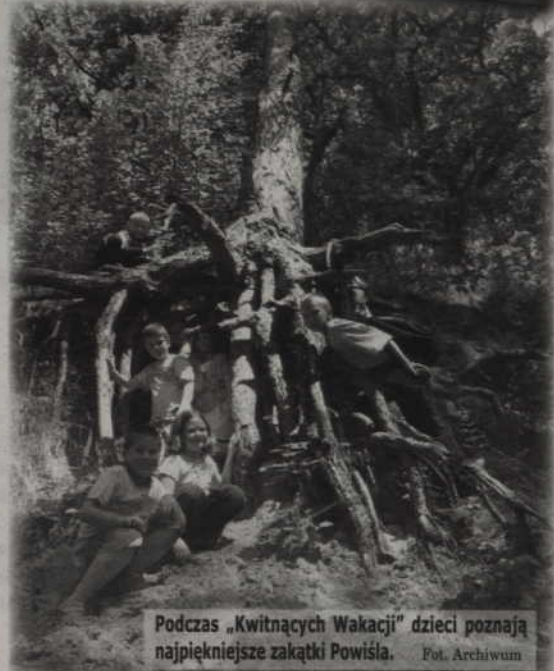
Podczas „Kwitających Wakacji” dzieci poznają najpiękniejsze zakątki Powiśla.