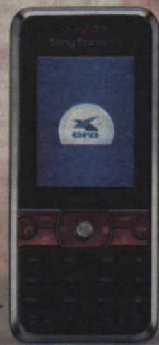
Sony Ericsson K660i

*opłata zgodna z cennikiem operatora sieci, z której wykonywane jest połączenie