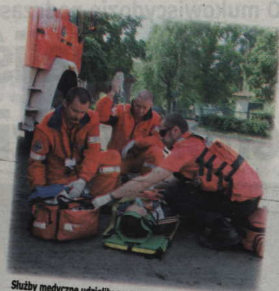
Slużby medyczne udzieliły pomocy poszkodowanym.