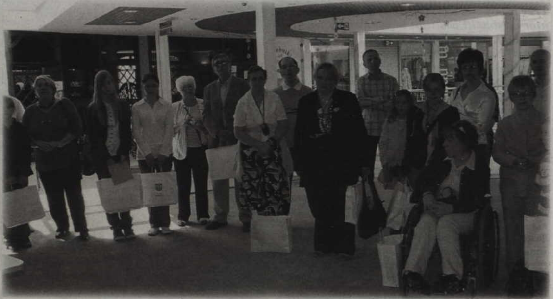
Prace, które znalazły się w albumie „Powiat oczami mieszkańców”, można oglądać w Galerii Handlowej „Kopernik”.