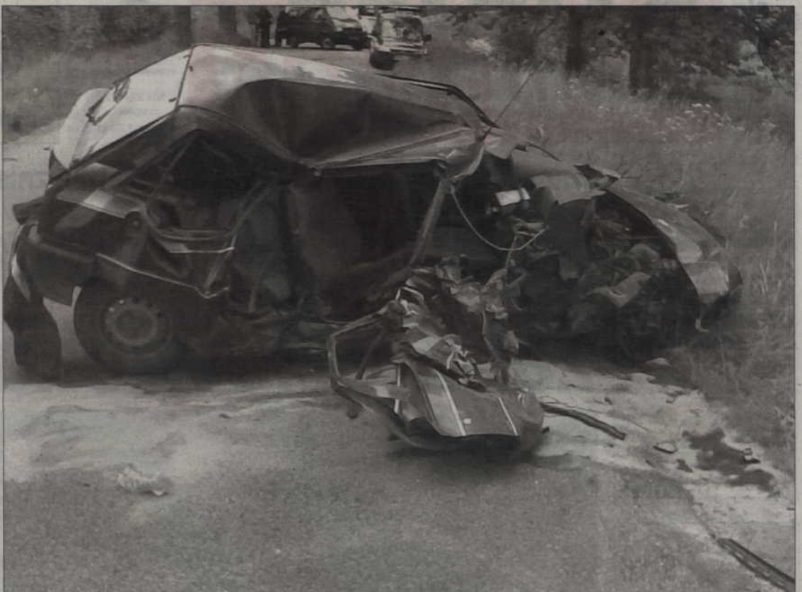
Citroen, w którym zginął 22-letni pasażer, został kompletnie zniszczony.