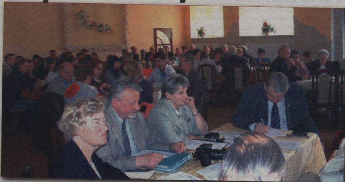
Wybrane zagadnienia z dziejów Dolnego Powiśla były tematem seminarium historycznego. Impreza została zorganizowana przez organizację Landsmannschaft Westpreussen Munster.

- Wpisuje się ono doskonale w 15-lecie przyjaźni z miastem Celle. Po wojnie wielu mieszkańców Kwidzyna znalazło tam swój drugi dom. Seminarium to też okazja do podziękowania Towarzystwu Kulturalne-