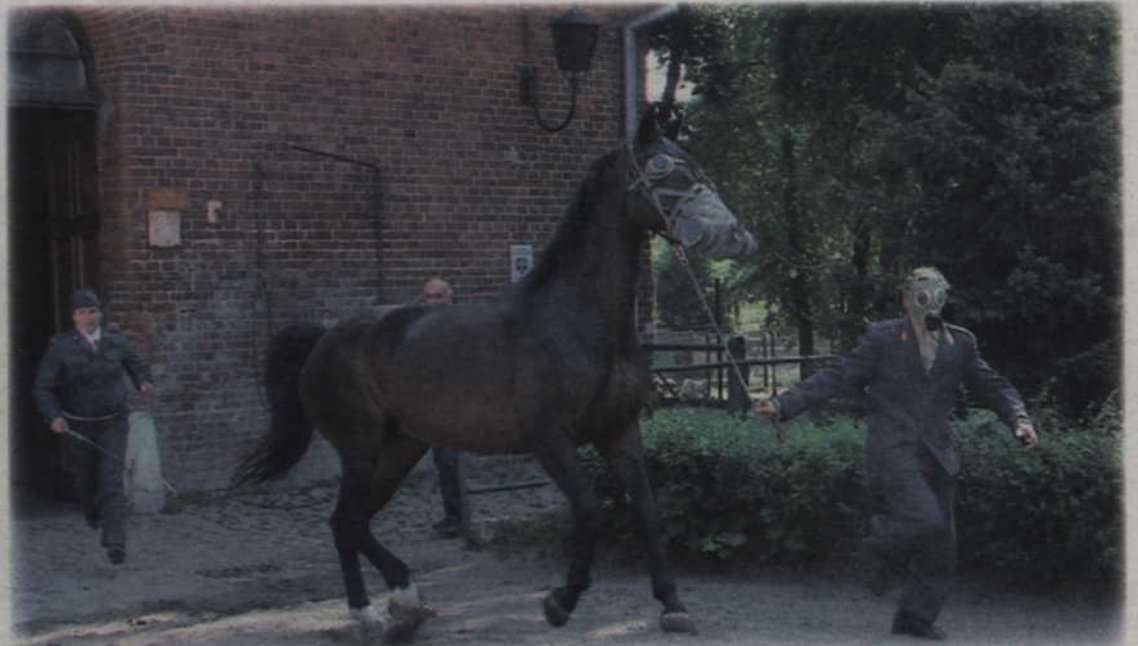
Wszystkie zwierzęta zostały wyprowadzone z budynku zanim rozprzestrzenił się w nim ogień.

- Uważam, że powinno być jak najwięcej ćwiczeń w