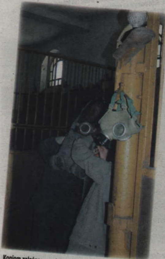
Koniom założono specjalne maski przeciwdymne.

Kolejne ćwiczenia wszystkich służb ratowniczych miasta oraz obrony cywilnej za rok. (jk)