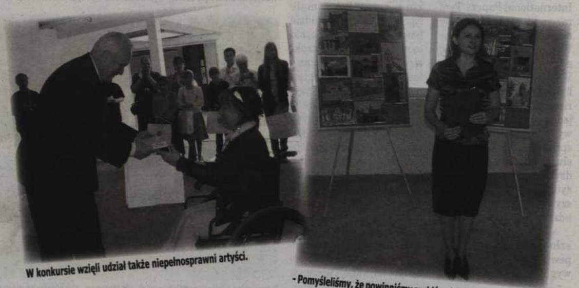
W konkursie wzięli udział także niepełnosprawni artyści.