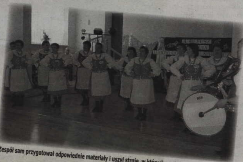
Zespół sam przygotował odpowiednie materiały i uszył stroje, w których występuje.