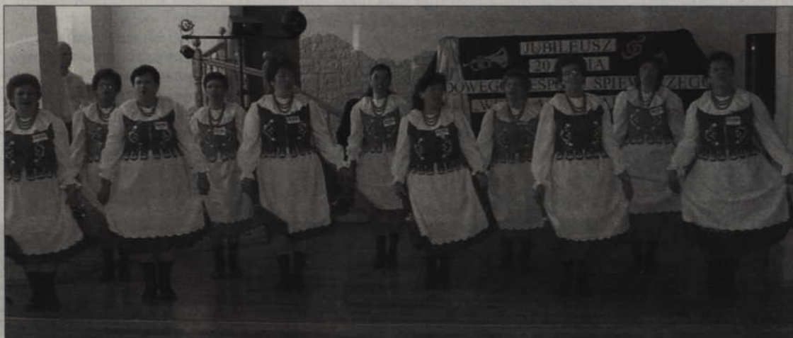
Ludowy Zespół Śpiewaczy „Wesoła Gromadka” z Tychnów, obchodził swoje 20 urodziny.

- Wszystkie życzenia, które otrzymałyśmy od tak wielu ludzi, to zachęta do dalszej pracy. Cieszymy się, że są osoby, które nas słuchają. Daje nam to siłę do tego, aby nadal śpiewać.