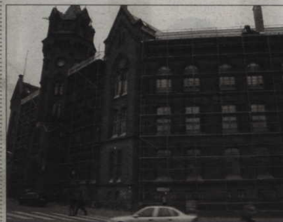
Niedawno odnowiony wygląd zyskał jeden z piękniejszych budynków w mieście - pokoszarowy obiekt przy ul. Grudziądzkiej.