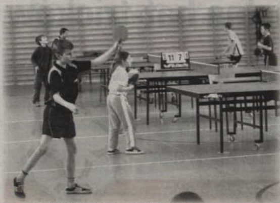
Czwarty turniej eliminacyjny XII Grand Prix Kwidzyna zostanie rozegrany 29 i 30 maja 2008.

Mogą pokrzyżować drogi faworytom Turniej dla uczniów podstawówek i gimnazjów