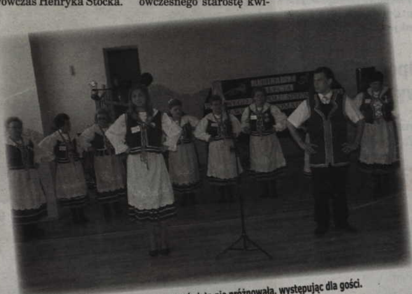
Wesoła Gromadka nawet podczas swojego święta nie próżnowała, występując dla gości.