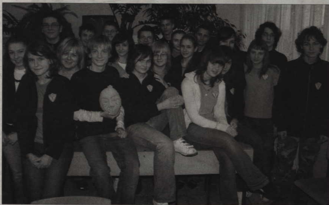
Uczniowie wszystkich kwidzyńskich gimnazjów będą zbierać pieniądze dla dzieci. Na zdjęciu uczniowie Gimnazjum nr 2.

Wolontariusze z trzech kwidzyńskich gimnazjów będą zbierać pieniądze dla dzieci chorych na mukowiscydozę. Zbiórka pieniędzy odbędzie się podczas Dni Kwidzyna. Mukowiscydoza to najczęściej występująca choroba genetyczna. Nie ma na nią lekarstwa. Organizm chorej osoby wydziela nadmiernie gęsty śluz, który zalega głównie w płucach i przewodach trzustkowych powodując ich uszkodzenie.