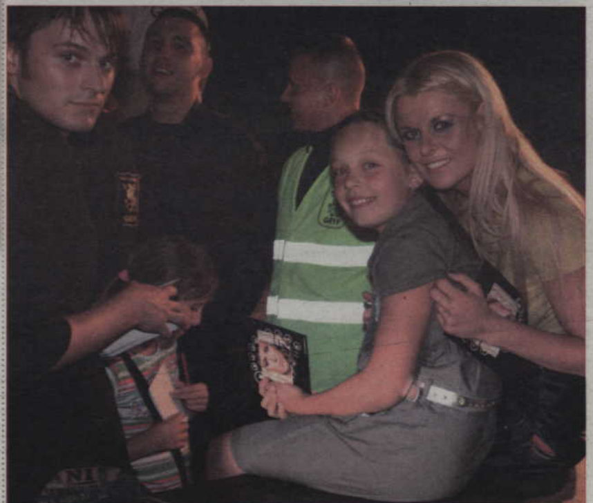
Mandaryna podczas ubiegłorocznego występu w Korzeniewie.

14 czerwca o godz. 20.00 na placu Jana Pawła II przed teatrem wystąpi Mandaryna. Koncert ma uświetnić odbywające się w tym czasie w Kwidzynie Mistrzostwa Świata Enduro. Mandaryna koncertowała na kwidzińskiej imprezie w ubiegłym roku - była gwiazdą festynu „Cud nad Wisłą” w Korzeniewie 15 sierpnia. Jej występ zgromadził tłumy fanów, szczególnie tych najmłodszych, którzy mogli spotkać się ze swoją ulubienicą i otrzymać jej autograf. (ad)