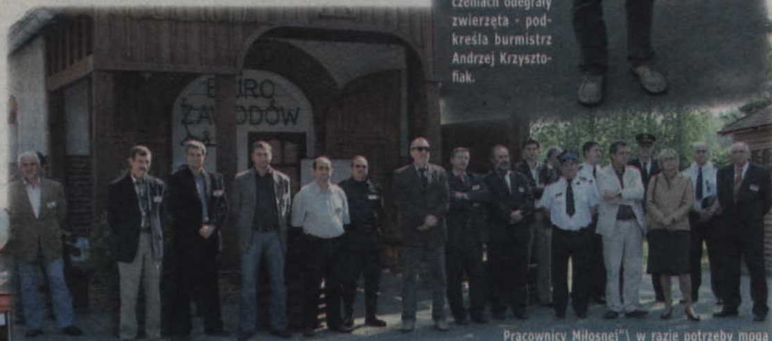
Pracownicy Miłosnej w razie potrzeby mogą wspomóc straż pożarną.