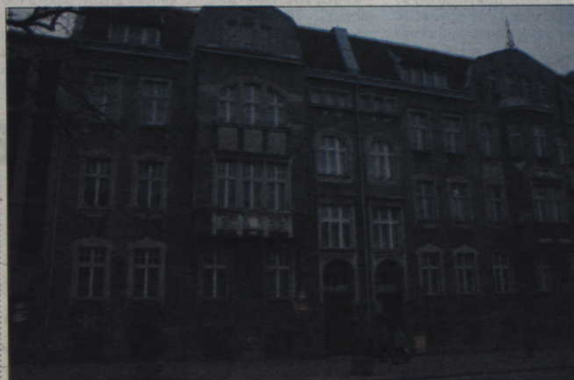
W nowych budynkach zamieszkają dzieci, które do tej pory przebywały w Domu Dziecka przy ul. Braterstwa Narodów w Kwidzynie.

Rozwiązania powiatu kwidzińskiego dotyczące opieki nad dziećmi, niechcianymi, osieroconymi lub takimi, które z różnych powodów nie mogą przebywać w rodzinie zostały uznane za wzorcowe przez Towarzystwo „Nasz Dom”. Organizacja zajmuje się między innymi prowadzeniem rodzinnych domów dziecka w Polsce oraz doradza w reformowaniu istniejących placówek opiekuńczo-wychowawczych, działając na rzecz rozwoju rodzinnych form wychowania dzieci. (jk)