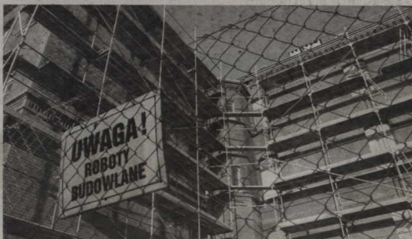
Wkrótce rozpocznie się adaptacja pomieszczeń nowej siedziby starostwa w pokoszarowym budynku przy ul. Kościuszki.