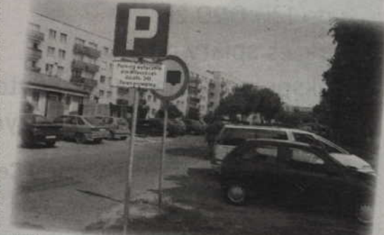
Tablica zakazująca wjazdu wkrótce zniknie - zapowiada Irena Zalewska, inżynier miasta. Ten parking przy szpitalu jest już ogólnodostępny.