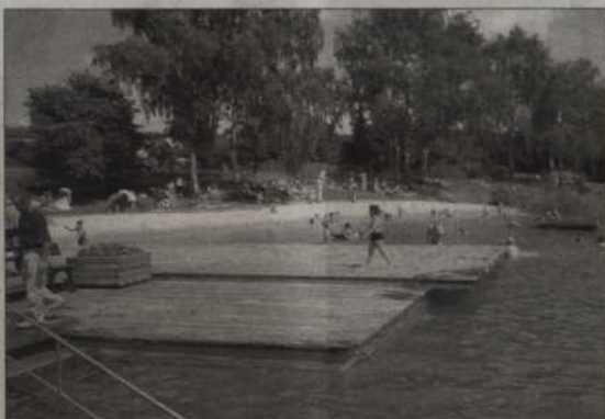
Z pomostów korzystają małe dzieci, dlatego urządzenia te muszą być bezpieczne - przypomina Wiesław Gałkowski, powiatowy inspektor budowlany.

Inspektorzy jeszcze przed rozpoczęciem wakacji sprawdzą wszystkie tego typu obiekty w powiecie kwidzińskim. (jk)