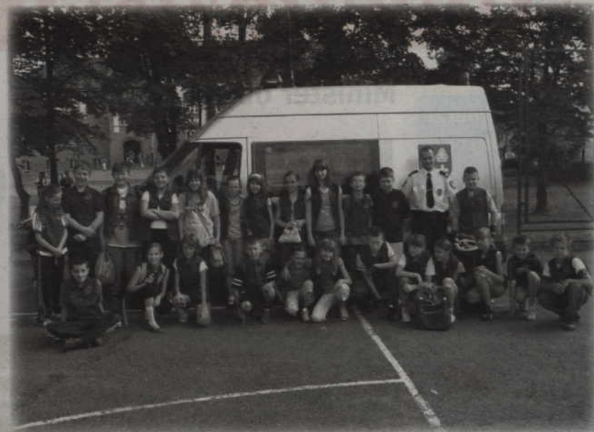
Wszyscy uczniowie klasy kl. IVa Szkoły Podstawowej nr 2 w Kwidzynie pomyślnie zdali egzaminy i otrzymają kartę rowerową.

- Egzaminy przeprowadziliśmy wspólnie ze szkołami podstawowymi nr 2, 5 i 6. Uczniowie dobrze przygotowani byli w tym roku do egzaminów. Poradzili sobie także z egzaminem praktycznym, czyli jazdą na rowerze. Egzaminy na kartę rowerową nie zdawali tylko uczniowie klas czwartych, ale również młodzież klas piątych i szóstych, która z różnych powodów nie podeszła do egzaminu w poprzednich