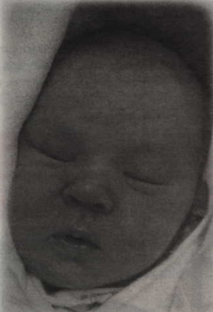
Córka Anny i Macieja Kaźmierskich z Kwidzyna przyszedł na świat 7 czerwca o godz. 6.20 (waga: 3,2 kg, długość: 54 cm).