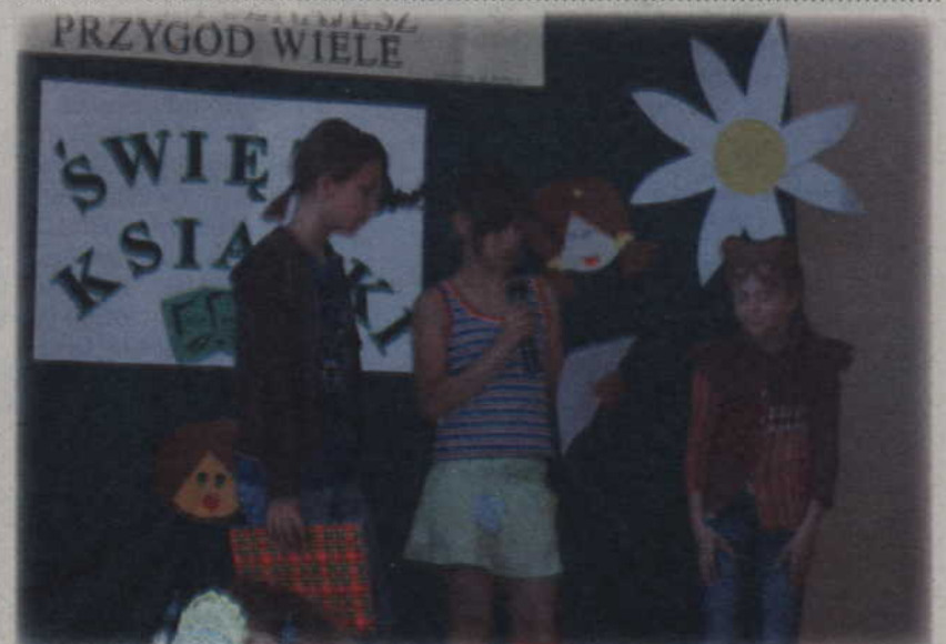
W programie imprezy znalazło się przedstawienie przygotowane przez uczniów Szkoły Podstawowej w Janowie „Sąd nad książką”. Książka wygrała proces.

- Na konkurs wpłynęło 26 wierszy. Wyróżniono 8 autorów prac, którzy otrzymali nagrody. Pozostali uczestnicy konkursu otrzymali nagrody pocieszenia. Na zakończenie zwycięzcy konkursu odczytali na głos swoje utwory - podsumowuje konkurs