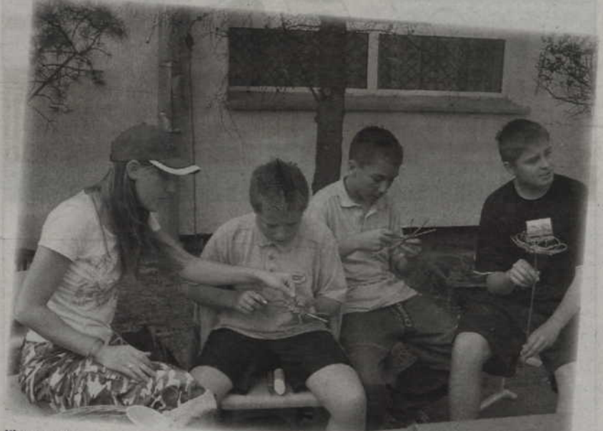
Niepełnosprawni uczestnicy Warsztatu Terapii Zajęciowej w Górkach pokazywali uczniom, jak tworzyć różne rzeczy z wikliny.

Podczas Dni Kwidzyna, od 20 do 22 czerwca, uczniowie Gimnazjum nr 3 będą zbierali pieniądze na pomoc dzieciom chorym na mukowiscydozę. To choroba genetyczna na którą nie mam lekarstwa. Objawia się przede wszystkim przewlekłymi dolegliwościami oskrzelowo - płucnymi oraz niewydolnością trzustki. Przyczyną choroby jest zmutowany gen CFTR, który powoduje, że organizm chorej osoby wydziela nadmiernie gęsty śluz, który zalega głównie w płucach i przewodach trzustkowych powodując ich uszkodzenia. W Polsce żyje ok. 1200 osób chorych na mukowiscydozę, w tym ok. 300 dorosłych. Objawy mukowiscydozy nie są charakterystyczne i dlatego bardzo często zdarza się, że lekarze stawiają błędną diagnozę i dziecko jest leczone np. na astmę, celiakię, alergię pokarmową, przewlekłe zapalenie oskrzeli. Tymczasem wczesne rozpoznanie i rozpoczęcie prawidłowego leczenia decyduje o długości i jakości życia chorego.