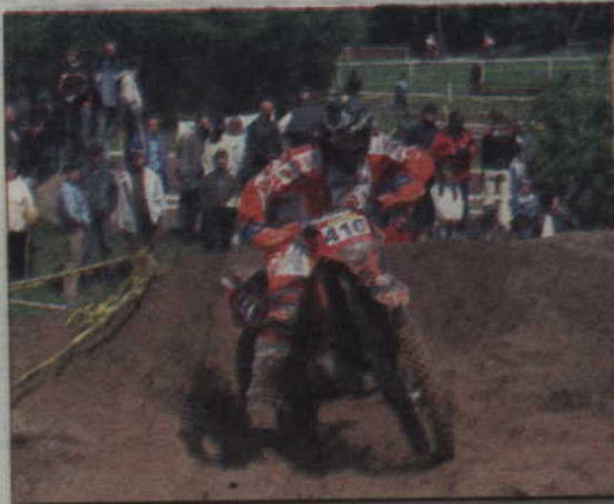
Dwa lata temu kwidzińska Miłosna gościła uczestników Mistrzostw Europy.

Zawodnicy startować będą dwójkami co minutę, z dwuminutową przerwą między poszczególnymi klasami. Do przejechania mają cztery okrążenia po ok. 60 dm. Na trasie pętli