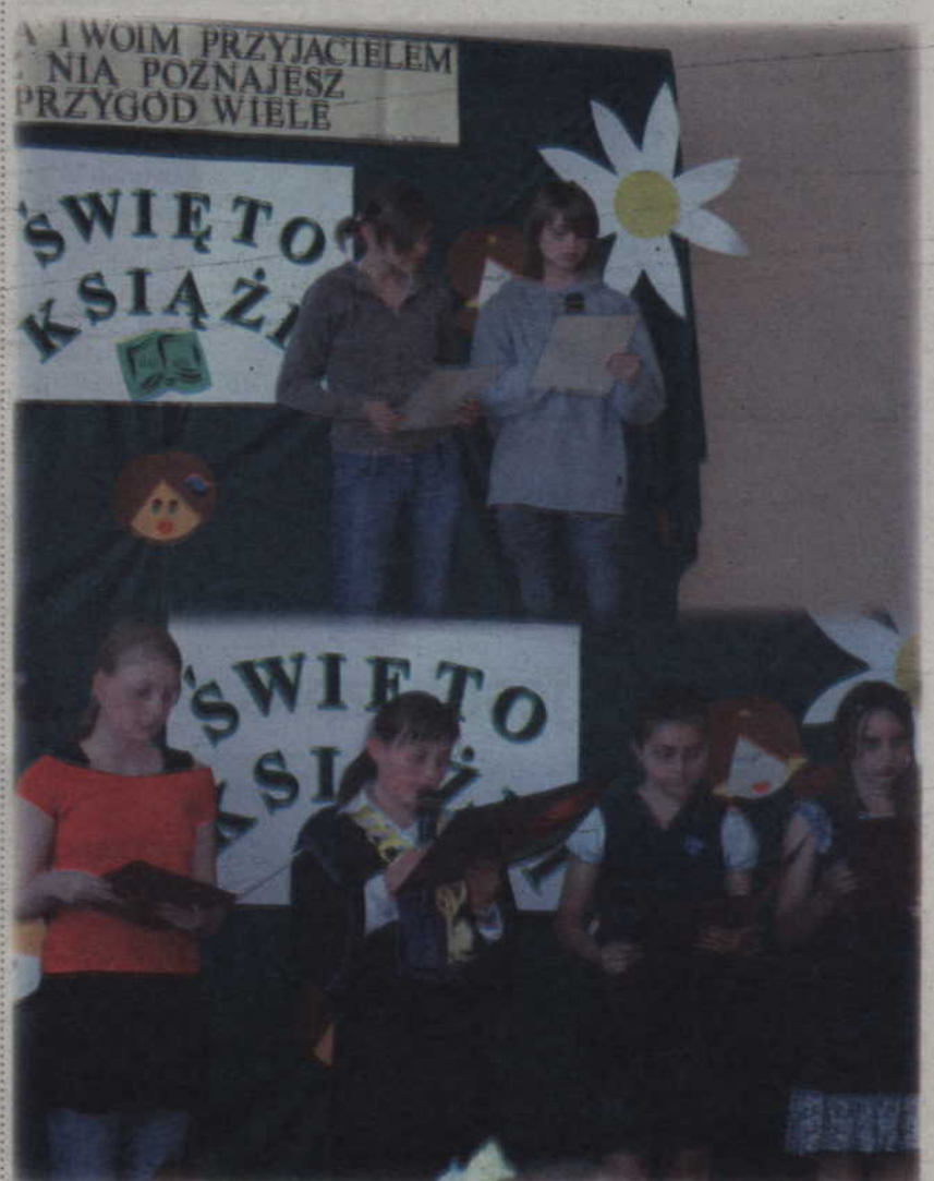
W Szkole Podstawowej w Janowie odbyło się „Święto Książki”. Impreza zachęcała uczniów do czytania.