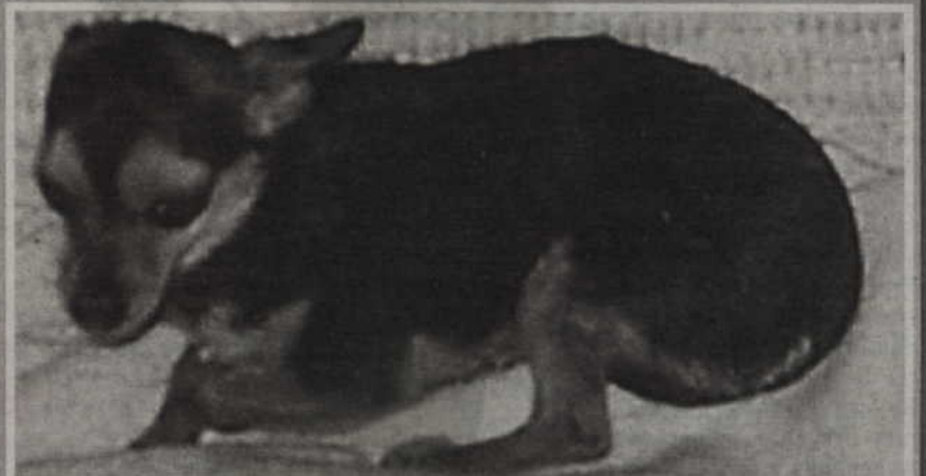
Nelly zaginęła 4 czerwca. Jest chora, dlatego jej właścicielka bardzo się o nią niepokoi. O pomoc prosi Czytelników „Kuriera”.