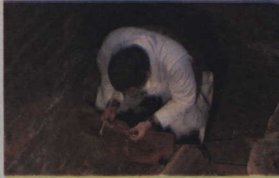
Akcja powieści rozpoczyna się, gdy w kwidzińskiej katedrze archeolodzy znajdują szkielety wielkich mistrzów krzyżackich.