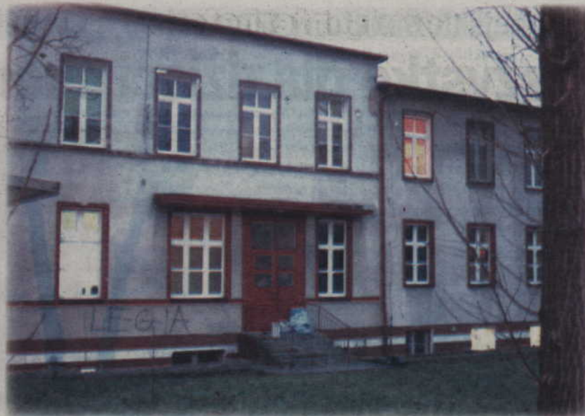
Zarząd powiatu kwidzyńskiego uzyskał zgodę rady na zbycie udziałów w spółce „Zdrowie”. Spółka zarządza kwidzyńskim szpitalem.

- Dwa miesiące temu została przygotowana koncepcja, która mówi co trzeba zrobić w szpitalu, żeby spełnić standardy, które wymaga minister zdrowia, a które powinny być wdrożone do 2012 roku. Do tego czasu muszą być także spełnione wymogi BHP oraz przeciwpożarowe. Kwota, którą trzeba zainwestować to 35-40 mln zł.