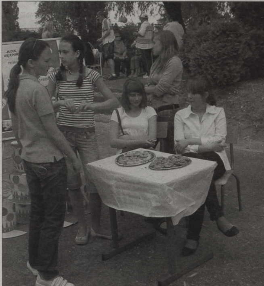
Dochód ze sprzedaży uczniowskich wypieków zostanie przeznaczony na pomoc dzieciom chorym na mukowiscydozę.