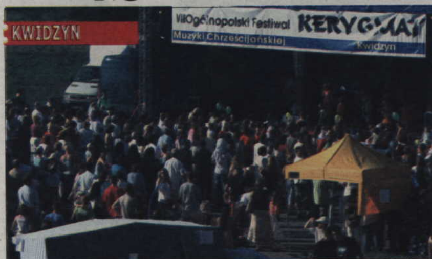
Do tej pory festiwal odbywał się na plenerowej scenie. W tym roku koncerty odbędą się w kościele pw. Świętej Trójcy, a także w warsztatach terapii zajęciowej w Górkach.