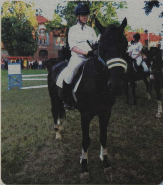
Spółka Tereny Rekreacyjne-Wypoczynkowe „Miłosna” organizuje wakacyjne kursy nauki jazdy konnej dla dzieci i młodzieży.

Spółka Tereny Rekreacyjne-Wypoczynkowe „Miłosna” organizuje wakacyjne kursy nauki jazdy konnej dla dzieci i młodzieży. Warunki uczestnictwa: wiek min. 10 lat, brak przeciwwskazań lekarskich do jazdy konnej (zaświadczenie lekarskie).