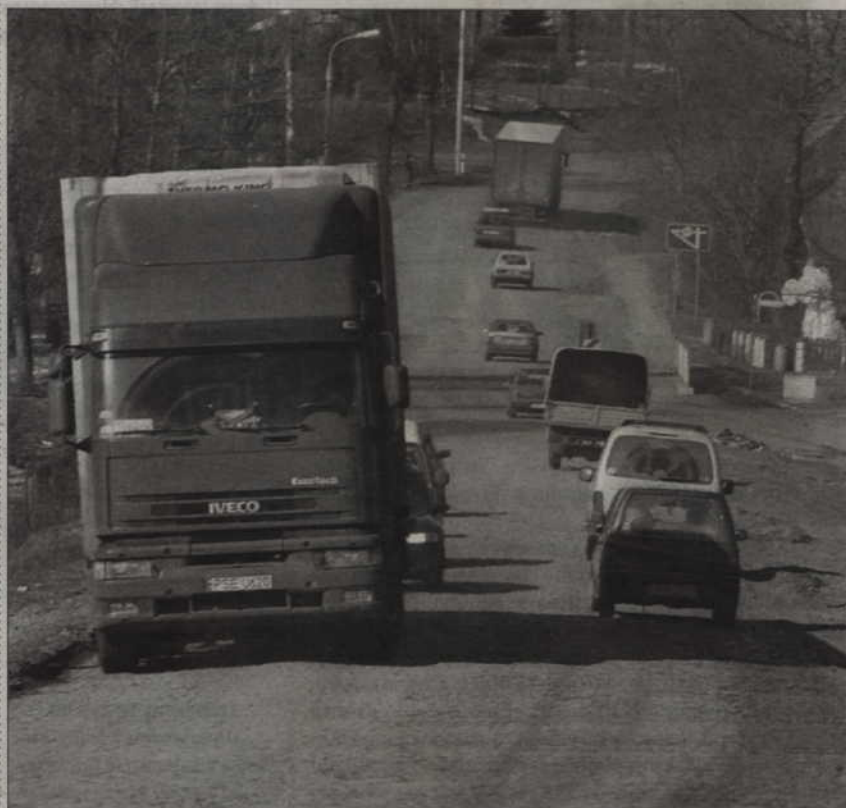
Mała obwodnica ma połączyć drogi Kwidzyn-Grudziądz i Kwidzyn-Prąbuty. Dzięki temu ciężarówki będą omijać centrum miasta.