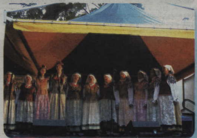
Kwidzyńskie Centrum Kultury zapowiada różnego rodzaju imprezy, które zostaną zorganizowane w lipcu i sierpniu. Na 26 lipca zaplanowano III Ogólnopolskie Spotkania Kapel i Zespołów Ludowych „Folklor i Biesiada”.

- 16 sierpnia odbędzie się duża impreza. Po raz kolejną przyjedzie do nas RMF