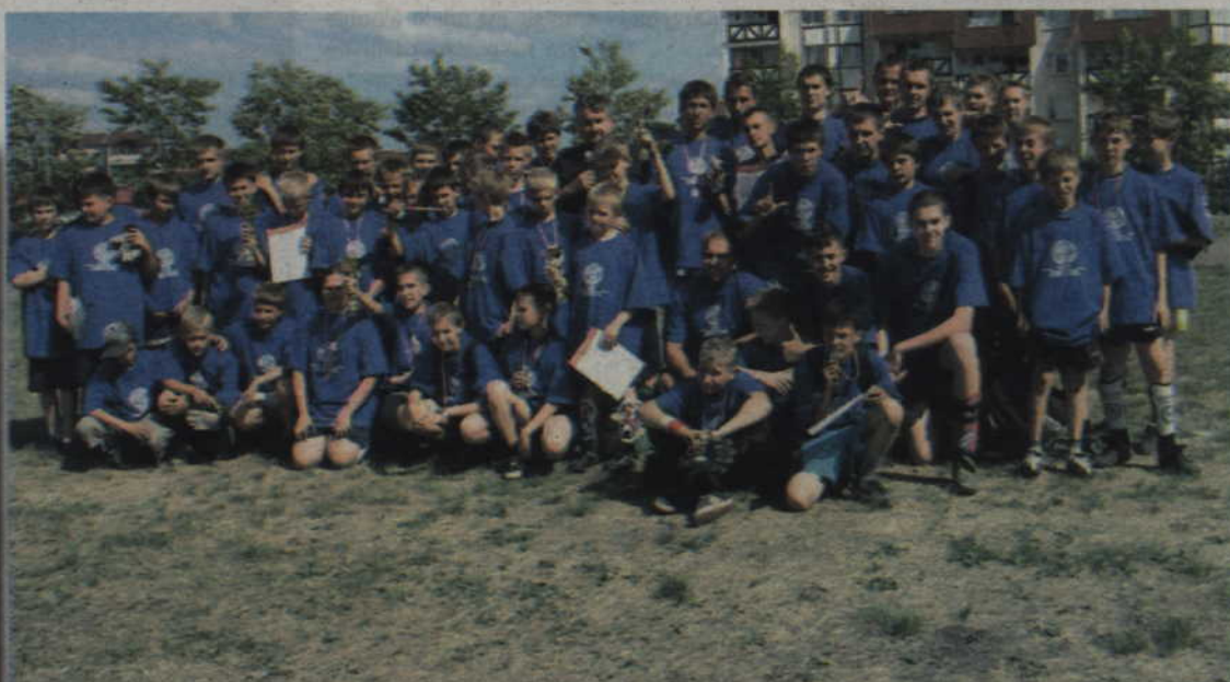
Uczestnicy i organizatorzy jesiennego turnieju piłkarskiego o Puchar Prezesa „Renawy”.