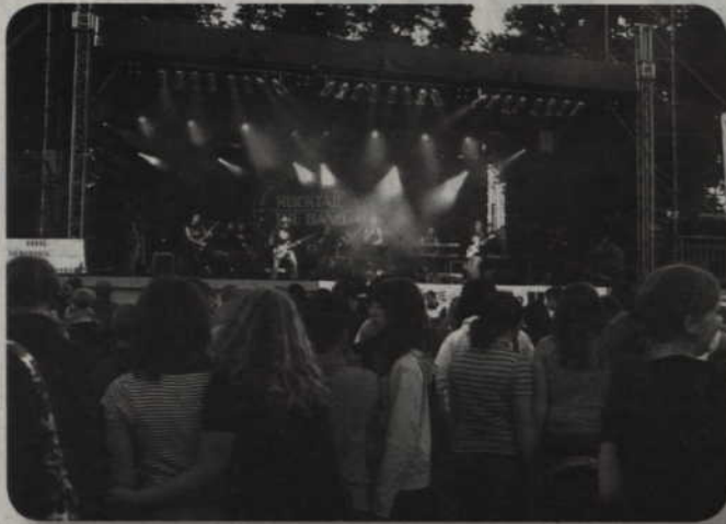
Zapraszamy na imprezy przygotowane przez Kwidzyńskie Centrum Kultury.