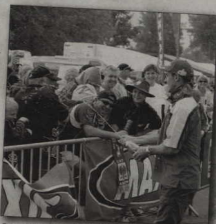
Po wręczeniu nagród nie obyło się bez tradycyjnego polewania szampanem.