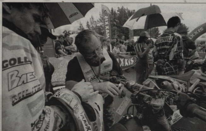
Przed wjazdem na park maszyn każdy motocykl musiał zostać dokładnie sprawdzony.