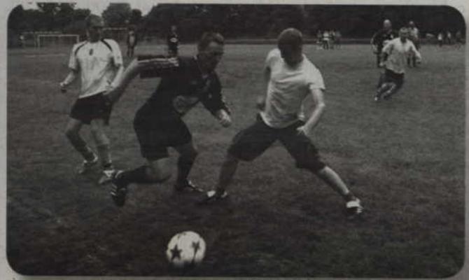
Ogólnopolski Turniej „Piątek” Piłkarskich (dorośli, boisko górne) rozpocznie się o godz. 10.00.