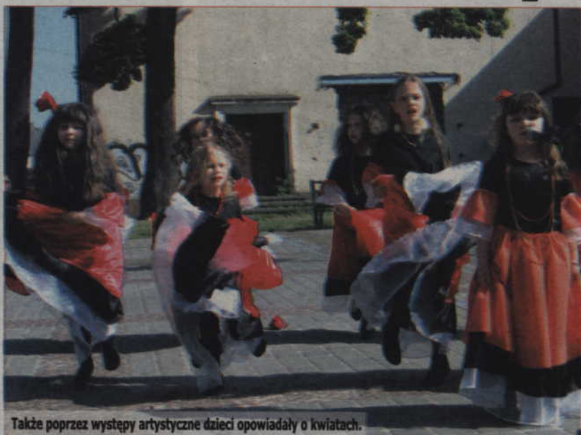
Także poprzez występy artystyczne dzieci opowiadały o kwiatach.