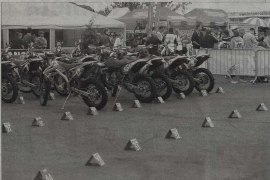
Finowie nie zrezygnowali z udziału w zawodach enduro. Wystartowali na zapasowych motocyklach.