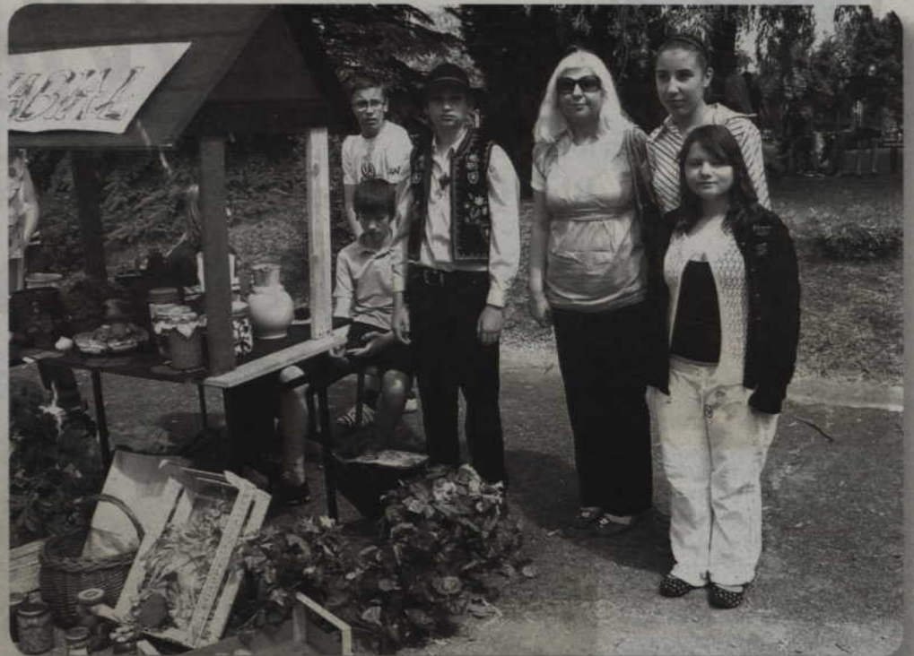
Pieniądze będą zbierali wolontariusze z Gimnazjum nr 3 w Kwidzynie, którzy zainaugurowali akcję charytatywną dwa tygodnie temu w szkole.

Dni Kwidzyna to przede wszystkim dobra zabawa, ale każdego roku towarzyszy im ważny cel, którym jest pomoc innym. W tym roku uwaga skierowana będzie na dzieci chorujące na mukowiscydozę. Pieniądze będą zbierali wolontariusze z Gimnazjum nr 3 w Kwidzynie.