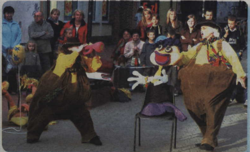
Kwidzyńskie Centrum Kultury zapowiada różnego rodzaju imprezy w lipcu i sierpniu. 5 lipca odbędzie się już po raz ósmy Festiwal Teatrów Ulicznych. Na zdjęciu: Teatr Nikoli z Krakowa.