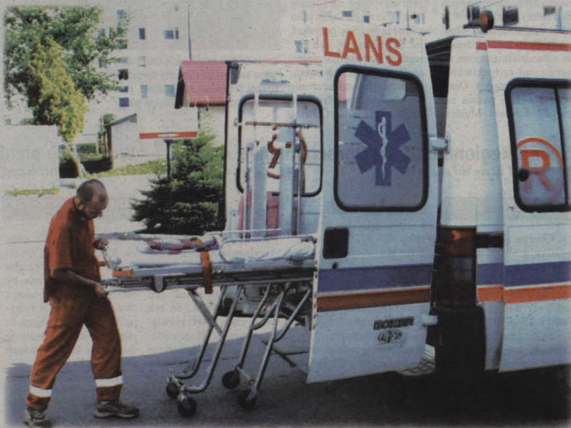
Lekarze rozpoznali objawy sepsy po kilku godzinach pobytu chorej w kwidzińskim szpitalu, gdzie przywieziono ją karetką ok. 4.00 w nocy. Na oddział specjalistycznego szpitala w Elblągu została przetransportowana helikopterem ok. godz. 15.00.

– Zaraz po zdiagnozowaniu sepsy i pobraniu materiału do badań, przewieziono chorą wezwanym przez nas helikopterem do szpitala w Elblągu. Tamtejsza specjalistyczna placówka ma bowiem możliwości (sprzęt i leki) to leczenia osób chorych na sepsę. Szpitale powiatowe, w tym również i kwidziński, nie mają umowy z Narodowym Funduszem Zdrowia na tego typu usługi, otrzymują ją ośrodki o charakterze wojewódzkim. Najbliższy Kwidzynom oddział intensywnej opieki medycznej tego typu znajduje się w Elblągu. (ad)