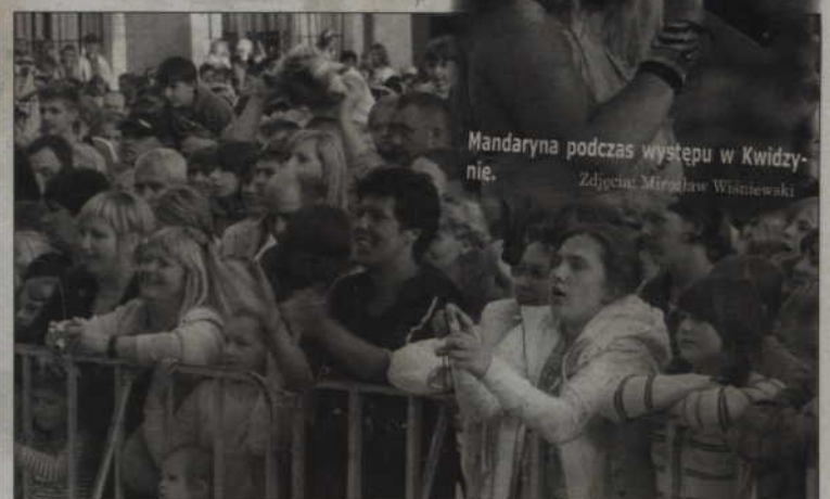
Koncert odbył się na placu Jana Pawła II przed teatrem.