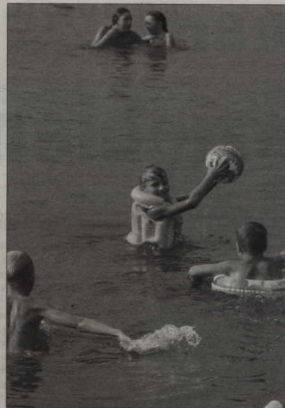
W tym roku niektóre jeziora w powiecie kwidzińskim będą szczególnie ciche. Wszystko za sprawą podjętej w ubiegłym roku kontrowersyjnej uchwały rady powiatu o zakazie używania tam spalinowych łodzi i skuterów.