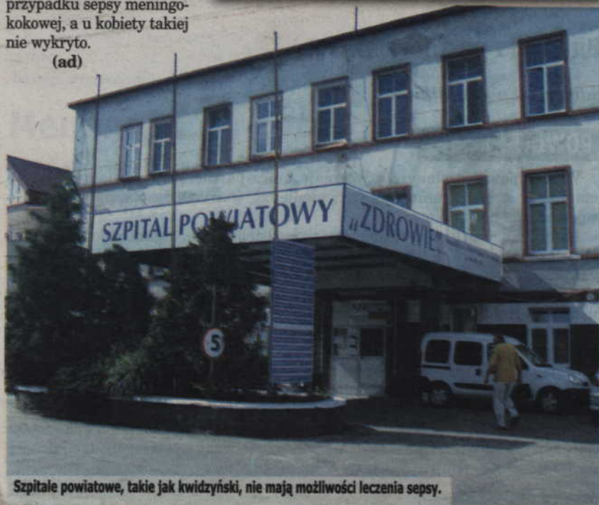
Szpital powiatowy, takie jak kwidziński, nie mają możliwości leczenia sepsy.