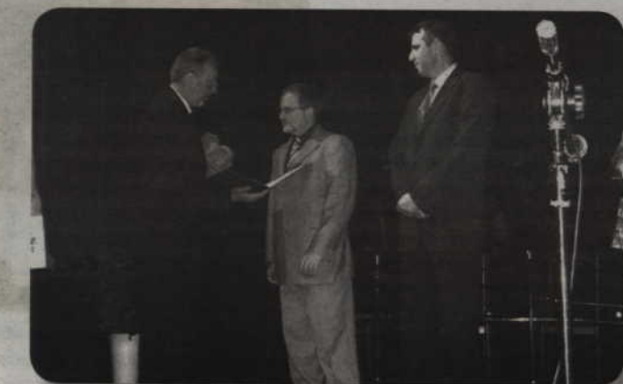
Honorowe nagrody za szczególne osiągnięcia na rzecz miasta wręczone zostaną w najbliższy piątek o godz. 16.30 w Teatrze Miejskim.