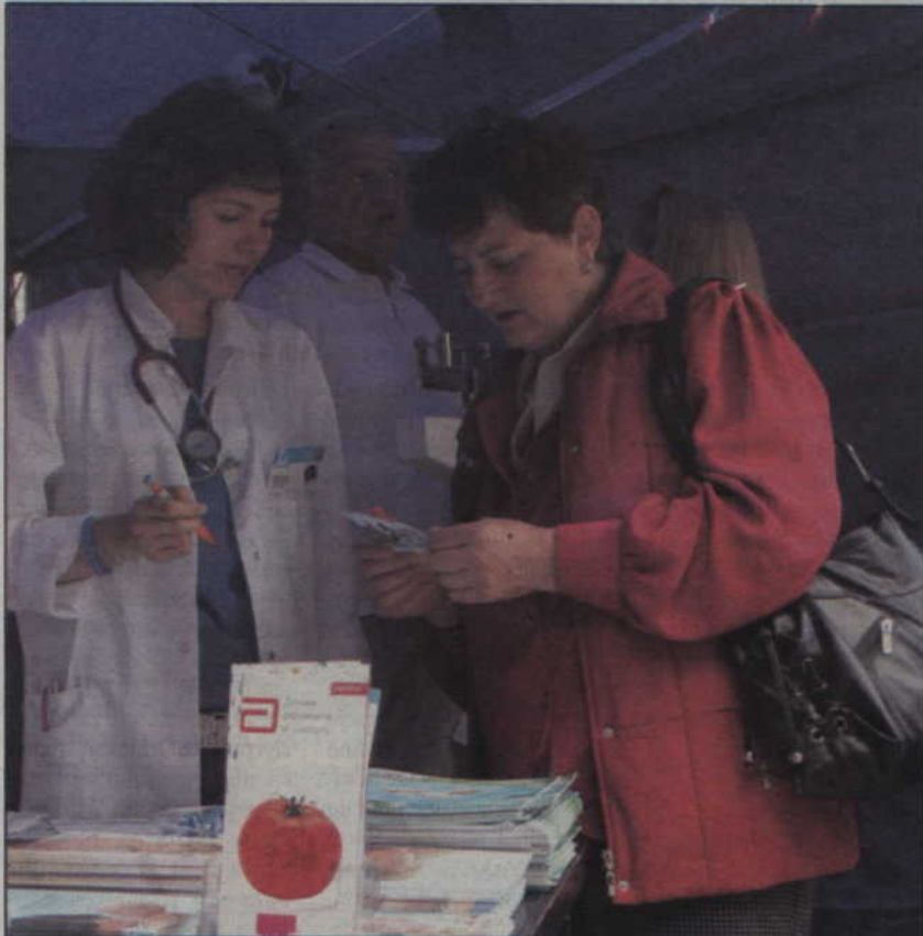
Każdy mógł również skorzystać z bezpłatnej porady lekarskiej.