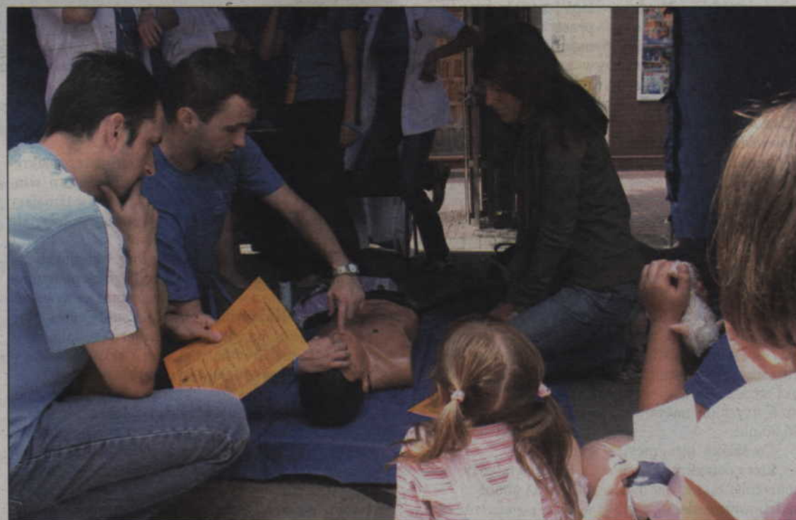
W jednym z przygotowanych namiotów można było nauczyć się udzielania pierwszej pomocy.