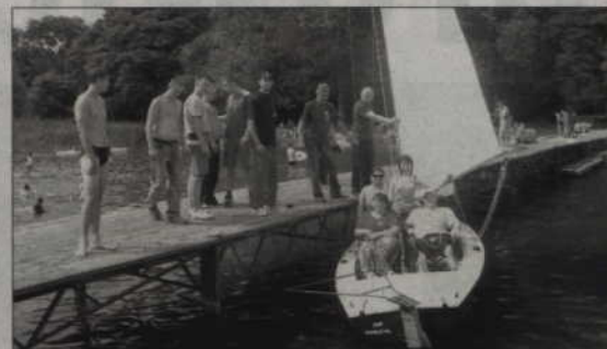
Pieniądze z dotacji, które przekazało powiatowi miasto Kwidzyn pozwolą między innymi na organizację żeglarskich imprez dla niepełnosprawnych, takich jak ta, która odbyła się w ubiegłym roku w Orkuszu.