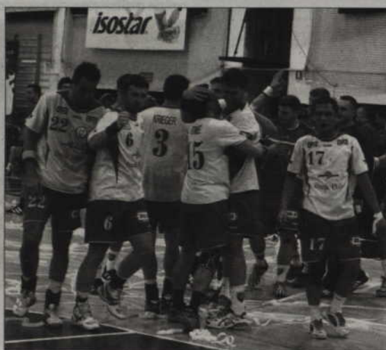
Powiślański Bank Spółdzielczy w Kwidzynie wspiera m.in. zespół ekstraklasy piłki ręcznej mężczyzn - MMTS Kwidzyn.