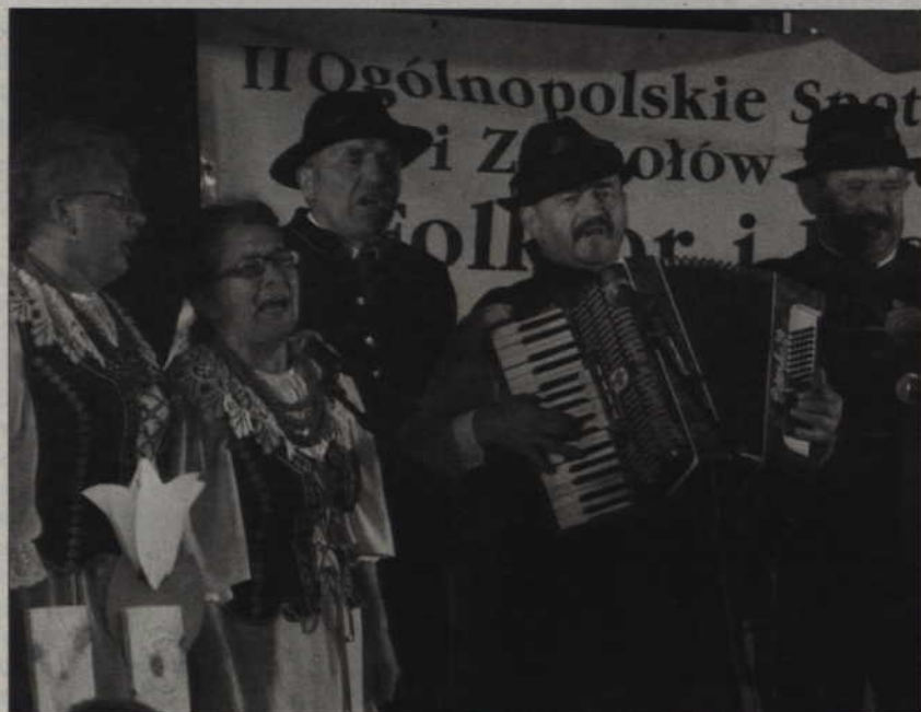
W tegorocznym przeglądzie wystąpi 25 zespołów ludowych.

9.30 – przemarsz korowodu (od Teatru do placu przy ul. Piłsudskiego) 10.00 – oficjalne otwarcie 10.10 – 18.45 – prezentacje i konkursy