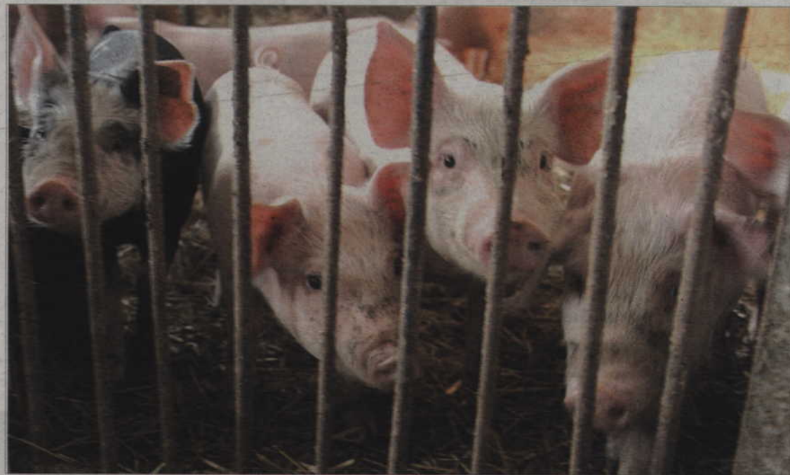
Do przebadania jest ponad tysiąc stad trzody chlewnej w powiecie kwidzińskim.

Powiatowy Inspektorat Weterynarii w Kwidzynie rozpoczął program zwalczania choroby Aujeszky'ego. To program całkowicie finansowany z budżetu państwa, a do przebadania jest ponad tysiąc stad w powiecie kwidzińskim. Co najważniejsze - gospodarstwa nie objęte programem zwalczania tej choroby, nie będą mogły wprowadzać świń do dalszego obrotu.