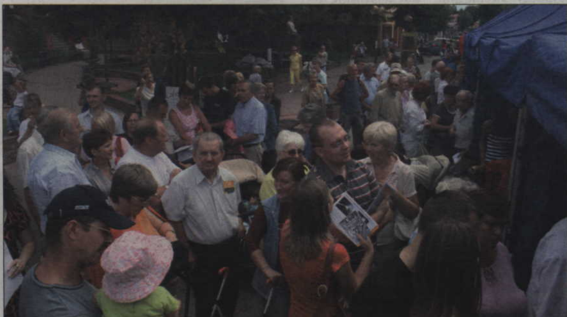
Stanowiska studentów Akademii Medycznej w Gdańsku były oblegane przez mieszkańców Kwidzyna.