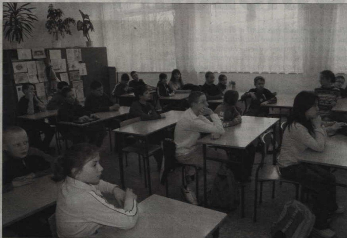
Szkoły Podstawowe osiągnęły najlepszy wynik w województwie pomorskim, wyprzedzając Gdynię, Sopot, Gdańsk i Słupsk. W szkołach podstawowych badanych było pięć kompetencji: czytanie, pisanie, rozumienie, korzystanie z informacji oraz wykorzystywanie wiedzy w praktyce. Na zdjęciu uczniowie kwidzińskiej „czwórki”.

Przez ostatnie trzy lata obserwowaliśmy dobry trend wskazujący, że