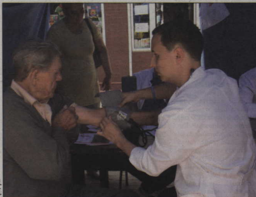
Mieszkańcy mogli bezpłatnie zmierzyć sobie ciśnienie.