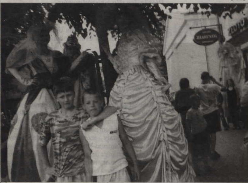
Czytelniczka „Kuriera” zrobiła to zdjęcie podczas odbywającego się niedawno w Kwidzynie festiwalu teatrów ulicznych.

Spełniamy zatem tą nietypową prośbę i czekamy na wizytę dwóch chłopców ze zdjęcia. Oprócz fotografii nasza Czytelniczka przygotowała dla nich słodką niespodziankę. Zapraszamy do redakcji od poniedziałku do piątku w godz. 9.00 – 14.00. (fox)