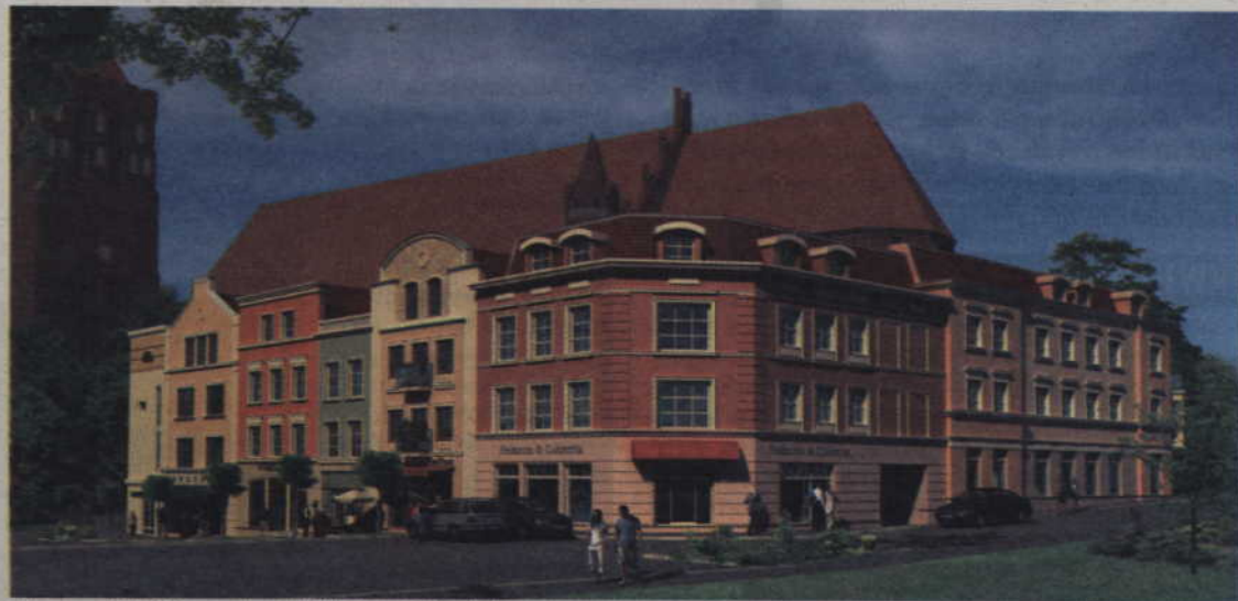
Tak ma wyglądać pierwszy kwartał odbudowanej Starówki.

Pozwolenie na budowę zostało wydane w maju ubiegłego roku. Projekt sfinansował inwestor. Parter kamienic, które powstaną na Starówce będzie wykorzystywane do działalności usługowej. Swoją siedzibę znajdą tam między innymi banki i sklepy. Kamienice mają różnić