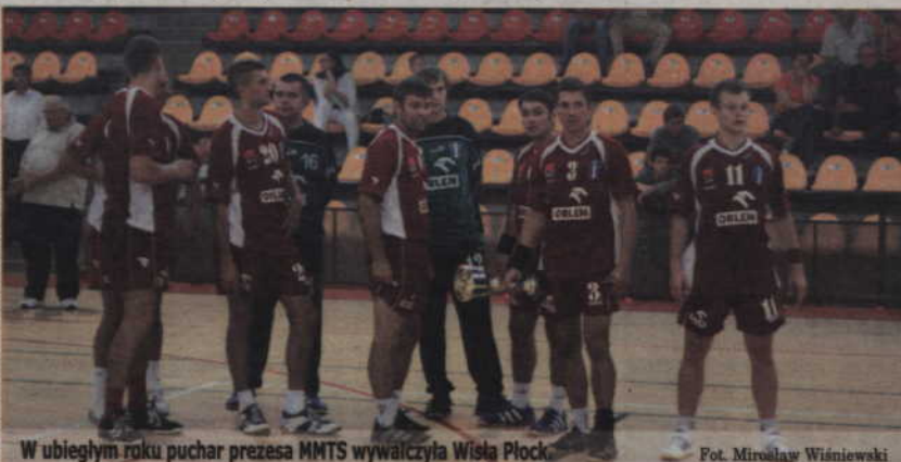
W ubiegłym roku puchar prezesa MMTS wywalczyła Wisła Płock. Fot. Mirosław Wiśniewski

Sobota, 2 sierpnia 10.00 AZS AWF Gorzów Wielkopolski - MMTS Kwidzyn 12.00 Wisła Płock - AZS AWFIS Gdańsk 16.00 AZS AWFIS Gdańsk - AZS AWF Gorzów Wlkp. 18.00 MMTS Kwidzyn - Wisła Płock