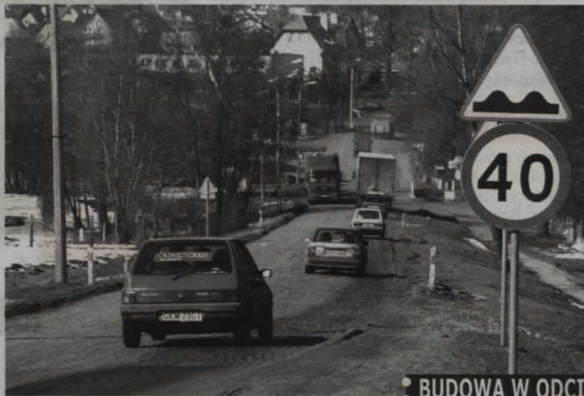
Mała obwodnica ma połączyć drogi Kwidzyn-Grudziądz i Kwidzyn-Prabuty.

tyka wszystkich inwestycji drogowych w kraju. Z informacji, które do nas docierają wynika, że poprawione prawa ma wejść w życie w czwartym kwartale bieżącego roku. Trwa oczekiwanie. Wiemy co będzie w tych przepisach. Niewiele będziemy musieli poprawić w złożonej dokumentacji. Marszałek województwa czeka na opublikowanie tych przepisów. Uważam, że zwróci się do podmiotów, które złożyły już projekty i przeszły pozytywnie, taka jak nasz, ocenę merytoryczną, o dostosowanie dokumentacji do znowelizowanych przepisów. Gdyby tego nie zrobił i rozstrzygnął konkurs, mogłoby dojść do sytuacji, że przyznane pieniądze trzeba by było zwrócić. Takie zagrożenie