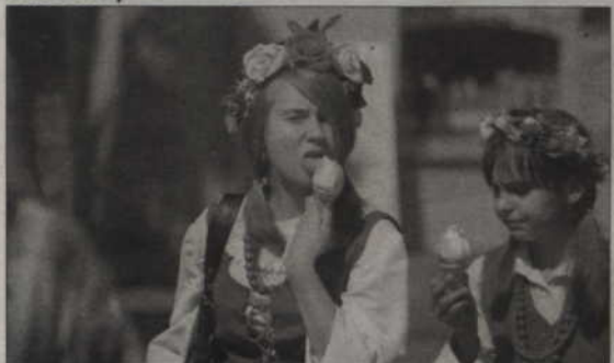
Do Kwidzyna przyjechało 25 zespołów z miast całej Polski.