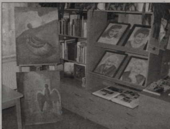
Obrazy Iwony Wiśniewskiej-Szkudlarskiej i Jerzego Wiśniewskich można oglądać w bibliotece przy ul. Piłsudskiego w Kwidzynie.