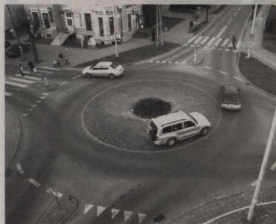
To chyba najmniejsze z możliwych rondo - duże samochody mają spore problemy z pokonaniem skrzyżowania Piłsudskiego i Chopina w centrum miasta.

ulicę Łużycką i Południową, mimo znaków drogowych, jako równorzędne. Budując rondo spowolniliśmy ruch na tym skrzyżowaniu. Pierwszy raz zastosowaliśmy mały