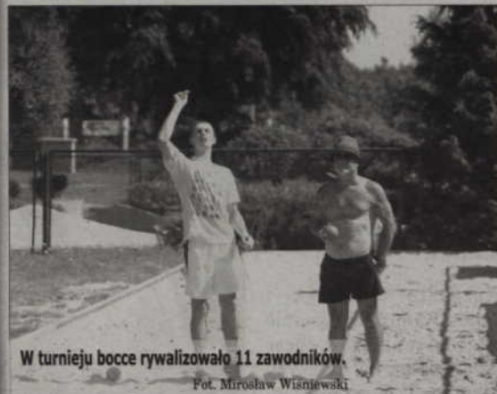
W turnieju bocce rywalizowało 11 zawodników.

Najmniej obleganym turniejem tym razem były zawody tenisa stołowego, gdzie przy betonowych stołach stanęło zaledwie 6 uczestników. Niewielu