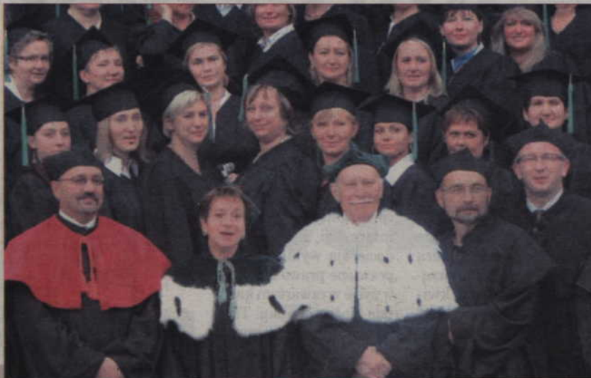
Tegoroczne absolventki pielęgniarstwa.

łęgniarstwa było 89 osób, które studiowały w ramach projektu pod nazwą „Kwidzyńska Akademia Kadr, czyli studia pomostowe dla pielęgniarek”, współfinansowanego ze środków Europejskiego Funduszu Społecznego oraz budżetu państwa w ramach Zintegrowanego Programu