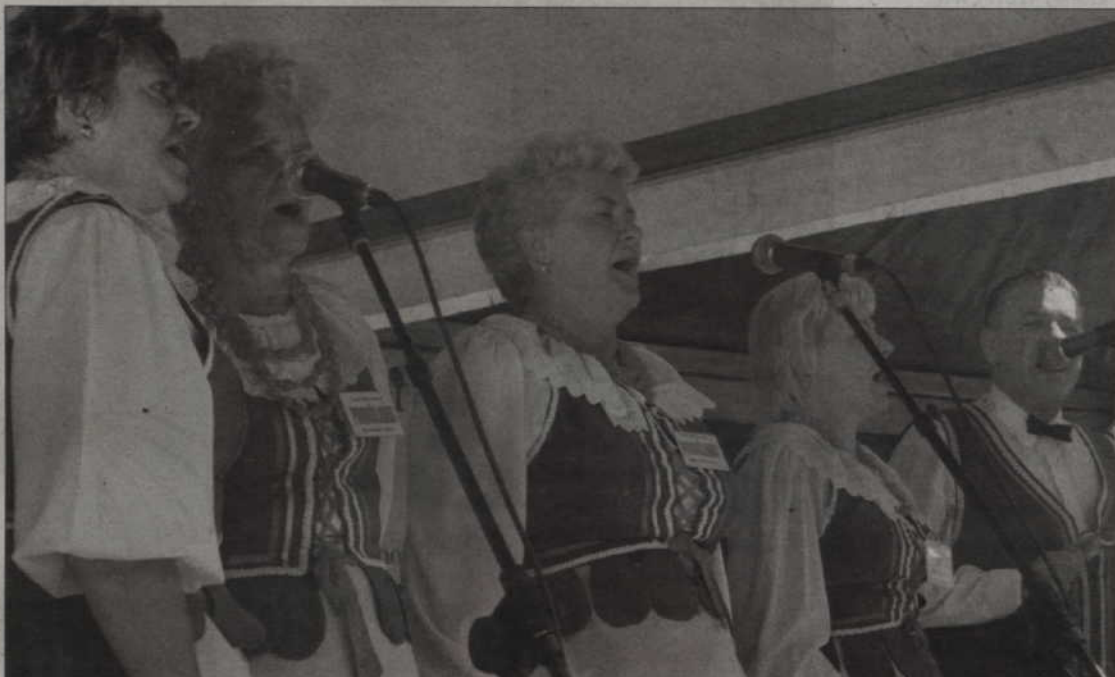
Zespół Powiślanki z Kwidzyna, organizatorzy festiwalu.