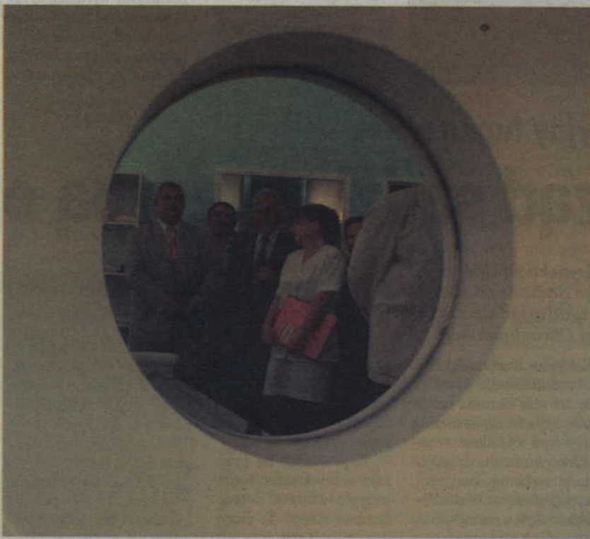
Pacjenci z Kwidzyna już drugi miesiąc są pozbawieni możliwości badania tomografem.

Wicestarosta nie ukrywa, że spółka zwróciła się do powiatu o pomoc finansową w sprawie zakupu lampy. Uważa