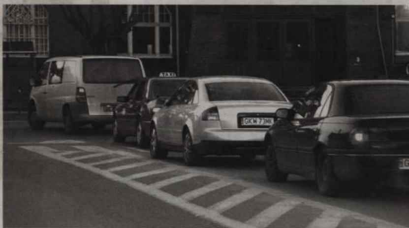
Kolejne rondo powstanie u zbiegu ulic Chopina i Kościuszki, przy dworcu kolejowym.