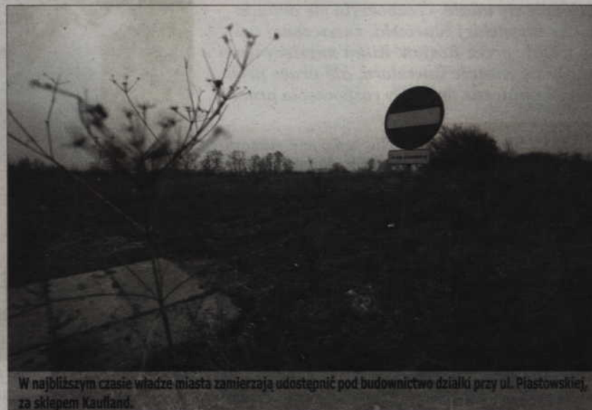
W najbliższym czasie władze miasta zamierzają udostępnić pod budownictwo działki przy ul. Piastowskiej, za sklepem Kaufland.