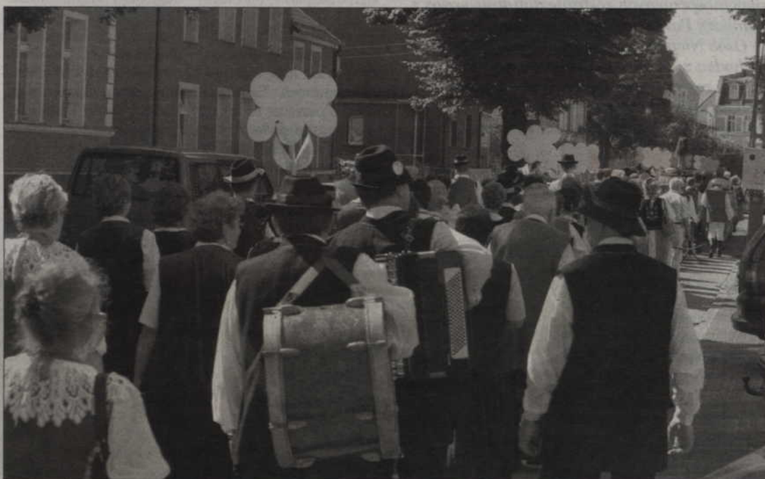
Kolorowy korowód przeszedł ulicami Kwidzyna.