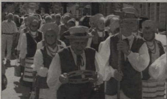
Muzycy maszerowali w ogromnym upale, co bardzo zmęczyło szczególnie starsze osoby.