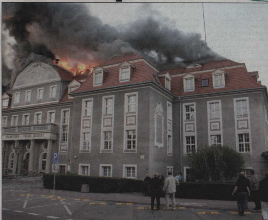
Prawdopodobnie w sierpniu rozpocznie się remont Urzędu Miejskiego w Kwidzynie. Budynek uciepiał w wyniku ubiegłorocznego pożaru.

Do wyremontowanego budynku mają przeprowadzić się niektóre z jednostek miasta, które pracowały w innych budynkach należących do samorządu. Pomieszczenia w wyremontowanym