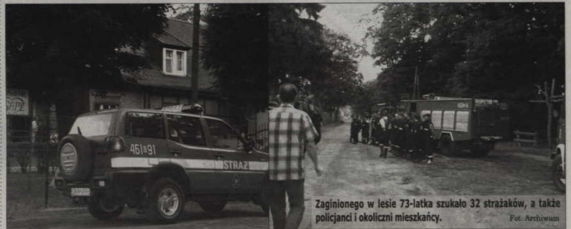
Zaginionego w lesie 73-latkę szukało 32 strażaków, a także policjanci i okoliczni mieszkańcy.