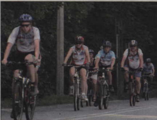
Gmina Kwidzyn zabiega o środki unijne na budowę ścieżek rowerowych z Marezy do Grabówka oraz z Korzeniewa do Janowa. Rowerzyści mogą obecnie korzystać ze ścieżki prowadzącej z Marezy do Korzeniewa.