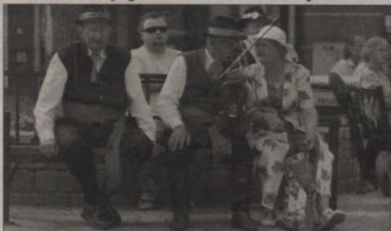
Przeгляд kapel ludowych odbył się na placu przy ul. Piłsudskiego.

W upalną sobotę kwidzińskim deptaku odbyło się III Ogólnopolskie Spotkanie Kapel i Zespołów Ludowych „Folklor i Biesiada”. Festiwal, na który zjechały grupy wykonujące muzykę folklorystyczną z całej Polski, zorganizował kwidziński zespół Powiślanki oraz Kwidzińskie Centrum Kultury. Na plenerowej scenie na placu przy deptaku wystąpiło 25 kapel. Bardzo widowiskowy okazał się przemarsz korowodu wszystkich uczestników przeglądu. Ubrani w ludowe stroje przeszli ulicami Kwidzyna.