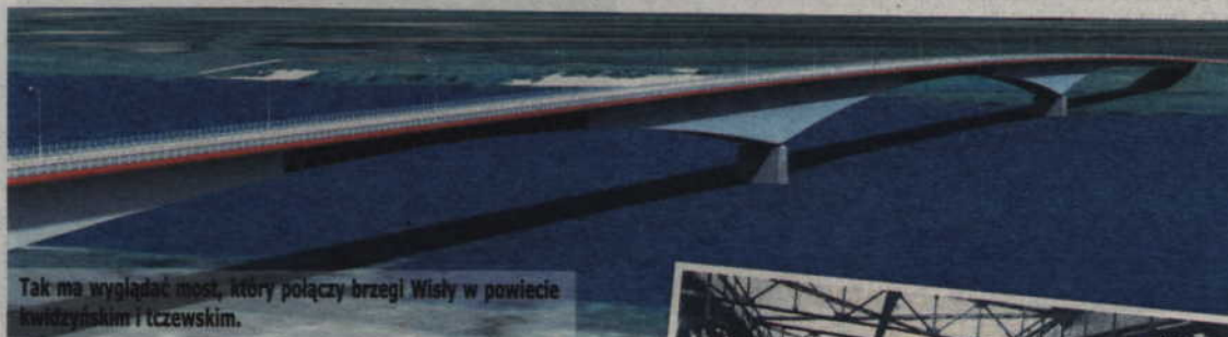
Tak ma wyglądać most, który połączy brzozi Wisły w powiecie kwidzyńskim i tczewskim.

Dzisiaj mija termin zgłaszania uwag dotyczących oddziaływania na środowisko mostu przez Wisłę, który ma powstać w okolicy Kwidzyna. Budowa po tej stronie rzeki planowana jest w Lipiankach (gm. Kwidzyn).