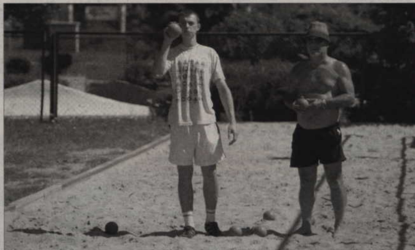
W każdej z dyscyplin, m.in. bocce, w turniejach finałowych weźmie udział czołowa ósemka rozgrywek.