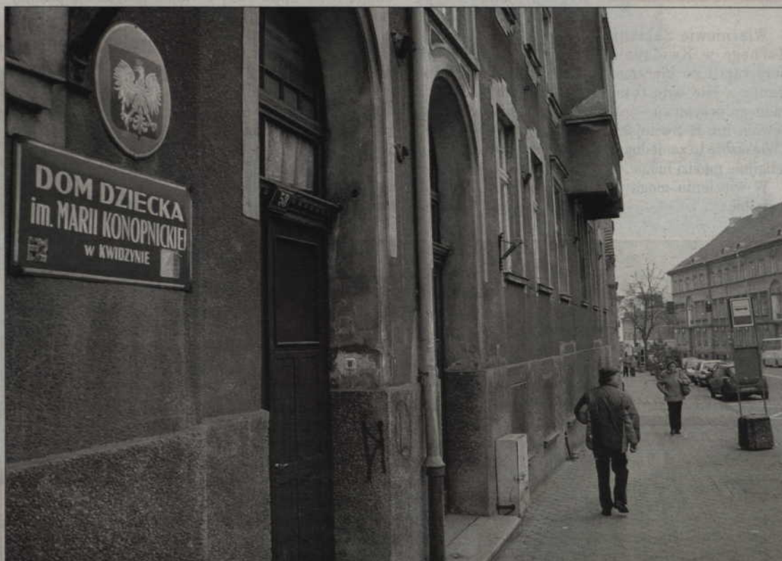
Dom Dziecka przy ul. Braterstwa Narodów niedługo przestanie istnieć.

W 2005 roku siedmioro dzieci z Domu Dziecka zamieszkało w budynku kupionym przez samorząd powiatu w Dankowie (gm. Kwidzyn). Pod koniec 2006 roku grupa dzieci wprowadziła się do budynku przy ul. Malborskiej, gdzie powstała tzw. grupa usamodzielnienia.