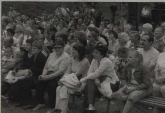
Jak co roku 15 lipca w Korzeniewie odbędzie się festyn „Cud nad Wisłą”.