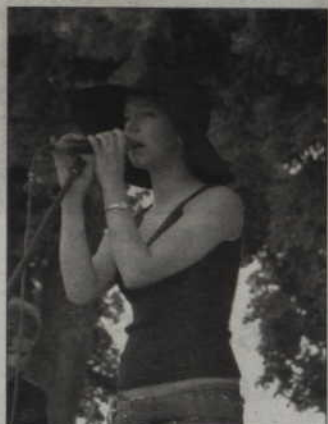
... i Monika Brodka.