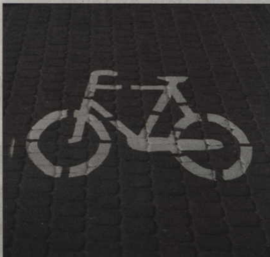
Trasa dla rowerzystów będzie prowadzić wzdłuż drogi krajowej nr 55.

powstać też kładka nad drogą wojewódzką, która prowadzi do Zielonej Szkoły - na wysokości stacji benzynowej. Jezdnia nie ma pobocza i jest niebezpieczna, dlatego będzie to dobre rozwiązanie. Budowa kładki została wpisana do programu