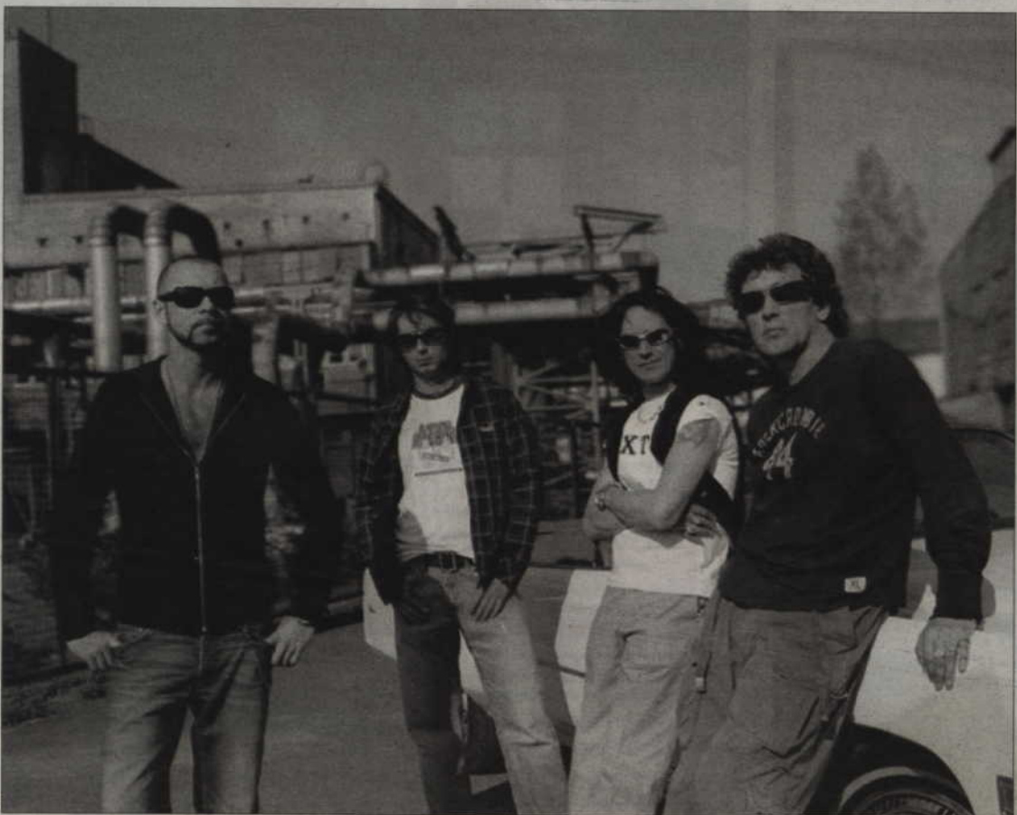
W najbliższą sobotę na kwidzyńskim stadionie wystąpi zespół Lady Pank...