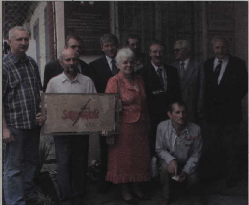
Rok temu, w 25 rocznicę pacyfikacji, do Kwidzyna przyjechało wielu byłych więźniów politycznych.

karnego ograniczały. Do tej pory nie ukarano winnych, nadal trwa proces kwidzyńskich funkcjonariuszy. (ad)