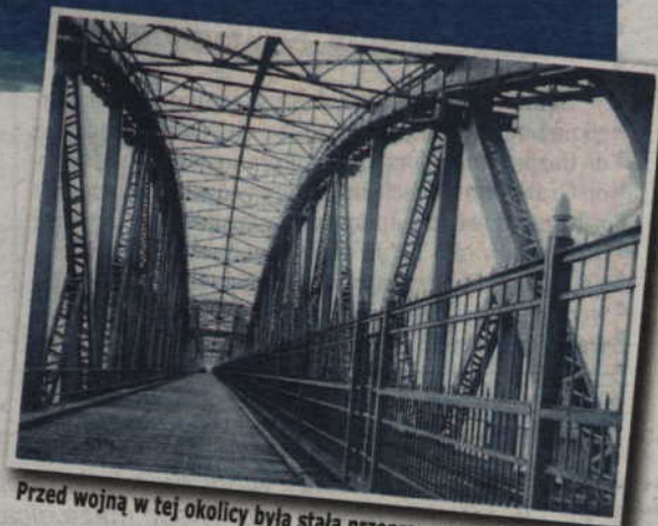
Przed wojną w tej okolicy była stała przeprawa przez Wisłę.

Na razie nic nie słychać o zapowiadanej już kilka razy przyjeździe do Kwidzyna Cezarego Grabarczyka, ministra infrastruktury. Przypomnijmy, że w czerwcu minister nie dotarł na konferencję, której głównym tematem miała być budowa mostu. Na cztery godziny przed rozpoczęciem spotkania samorząd miasta został poinformowany, że minister nie przyjeździe z powodów technicznych. Samolot, którym miał polecieć