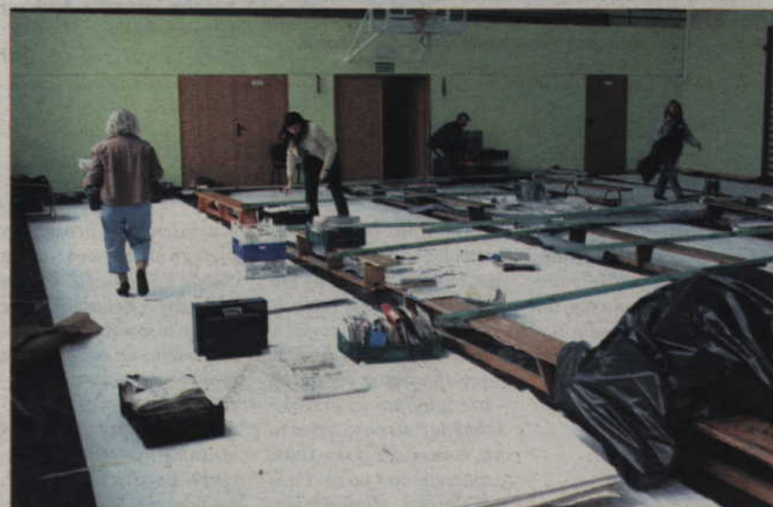
1,8 mln zł będzie kosztował remont Urzędu Miejskiego w Kwidzynie. Budynek został uszkodzony podczas ubiegłorocznego pożaru. Odtworzono już zniszczony dach budynku oraz poddasze. Przetarg na remont wnętrza oraz elewacji wygrała kwidzyńska firma Celbud.