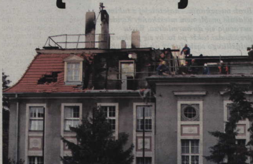
Tuż po pożarze ocalałe dokumenty suszono w pobliskiej Szkole Podstawowej nr 4.

ka tygodni podpisanie umowy z wykonawcą. Jednym z warunków ujętym w przetargu było rozliczenie inwestycji tzw. kosztorysem wykonawczym. Oznacza to, że kwota, którą zaplanowaliśmy na remont może się zmniejszyć. Może się bowiem okazać, że niektórych elementów lub fragmentów tynków nie będzie trzeba wymieniać i wówczas zapłacimy za remont mniej - wyjaśnia Andrzej Krzysztofiak, burmistrz Kwidzyna.