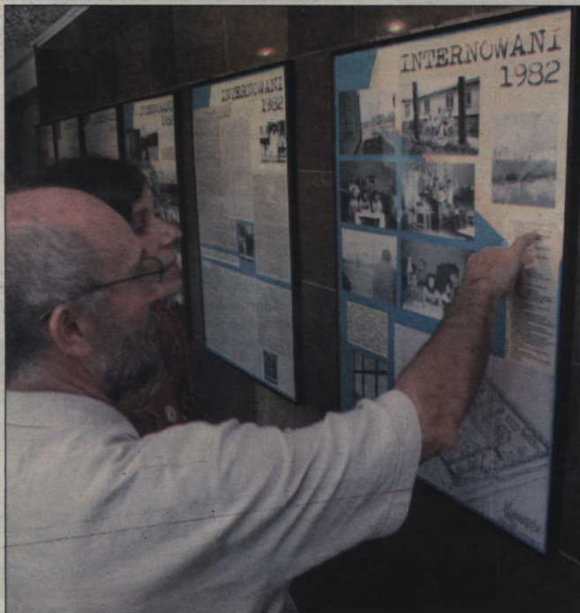
W foyer teatru zaprezentowano wystawę zdjęć, dokumentów i pamiątek z tamtych wydarzeń.

Telefon stacjonarny w sieci Era dostępny w całej Polsce!