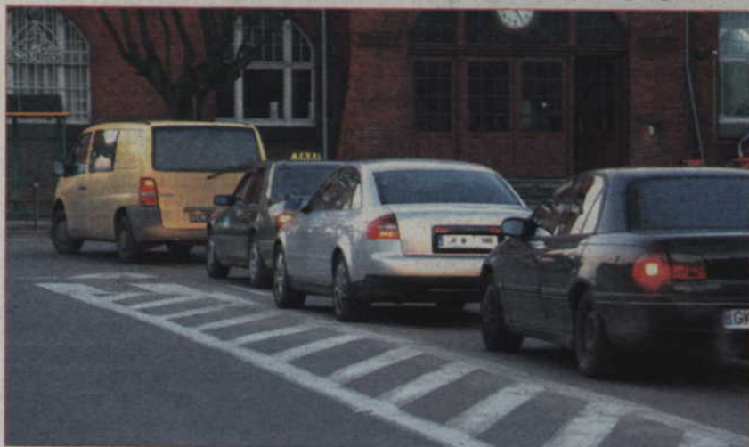
Oryginalna forma przestrzenna ozdobi rondo, które powstaje u zbiegu ulic Chopina i Kościuszki.