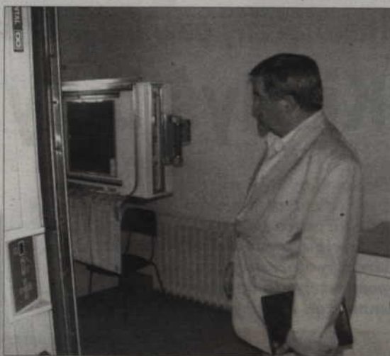
W profilaktycznych badaniach płuc mogą wziąć udział mieszkańcy gminy Kwidzyn.

Badania odbywać się będą od 1 września do 29 grudnia 2008 roku w kwidzińskim szpitalu. Rejestrować można się osobiście (w szpitalnej poradni gruźlicy i chorób płuc) od 1 września w godz. 9.00 – 14.00, tel. 645 83 90.