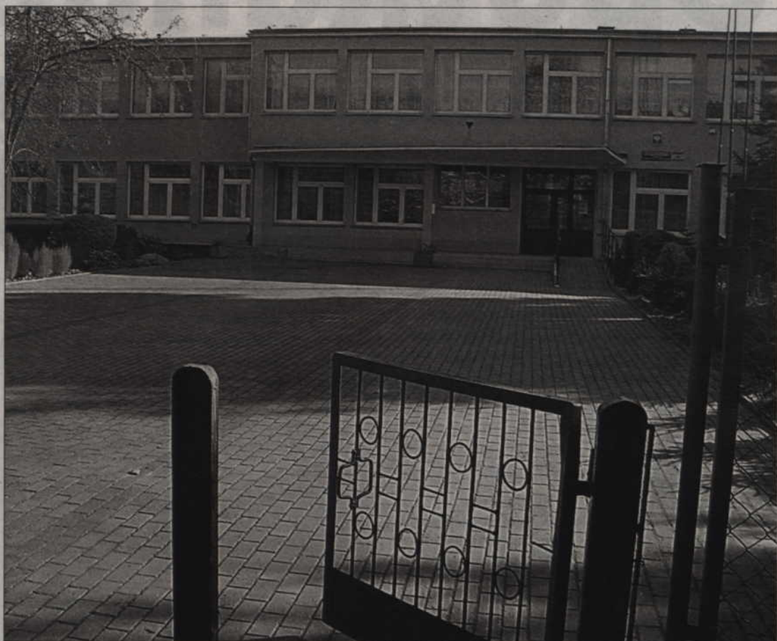
W Szkole Podstawowej nr 6 wyremontowano część posadzki i zabezpieczono klatkę schodową.

- W Szkole Podstawowej nr 4 wykonany został remont piłkochwyłów. Usta-