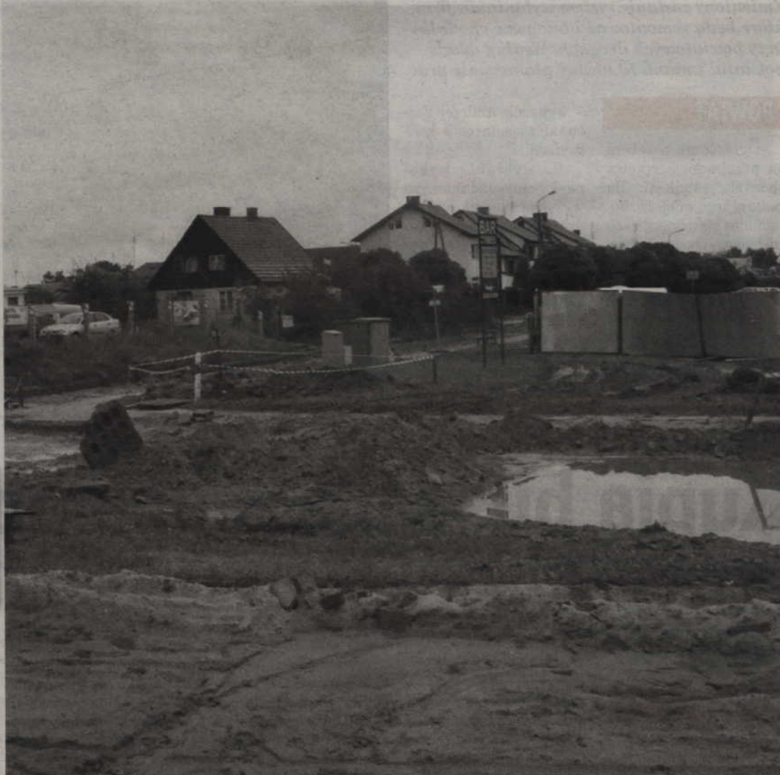
Ulica Sportowa, która ma stać się fragmentem obwodnicy wokół Kwidzyna, jest właśnie modernizowana.