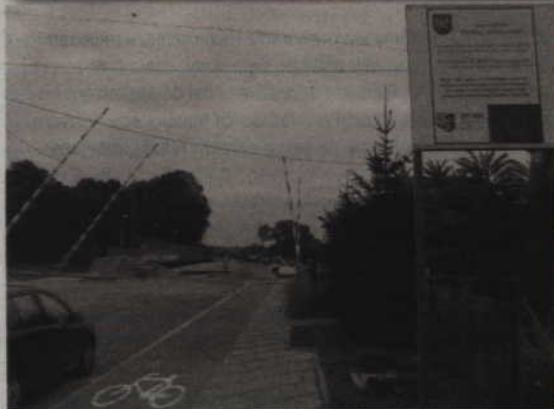
Pierwszy odcinek małej obwodnicy oddano do użytku pod koniec 2005 roku. Połączył wiaduktem ulice Żwirówą i Południową

Budowa obwodnicy może zostać dofinansowana w 75 proc. ze środków unijnych. Pozostała kwota ma pochodzić z budżetów miasta i powiatu. W budżetach obu samorządów zaplanowano w tym roku na budowę 2,5 mln zł. To środki własne, które potrzebne są przy ubieganiu się o pieniądze unijne.