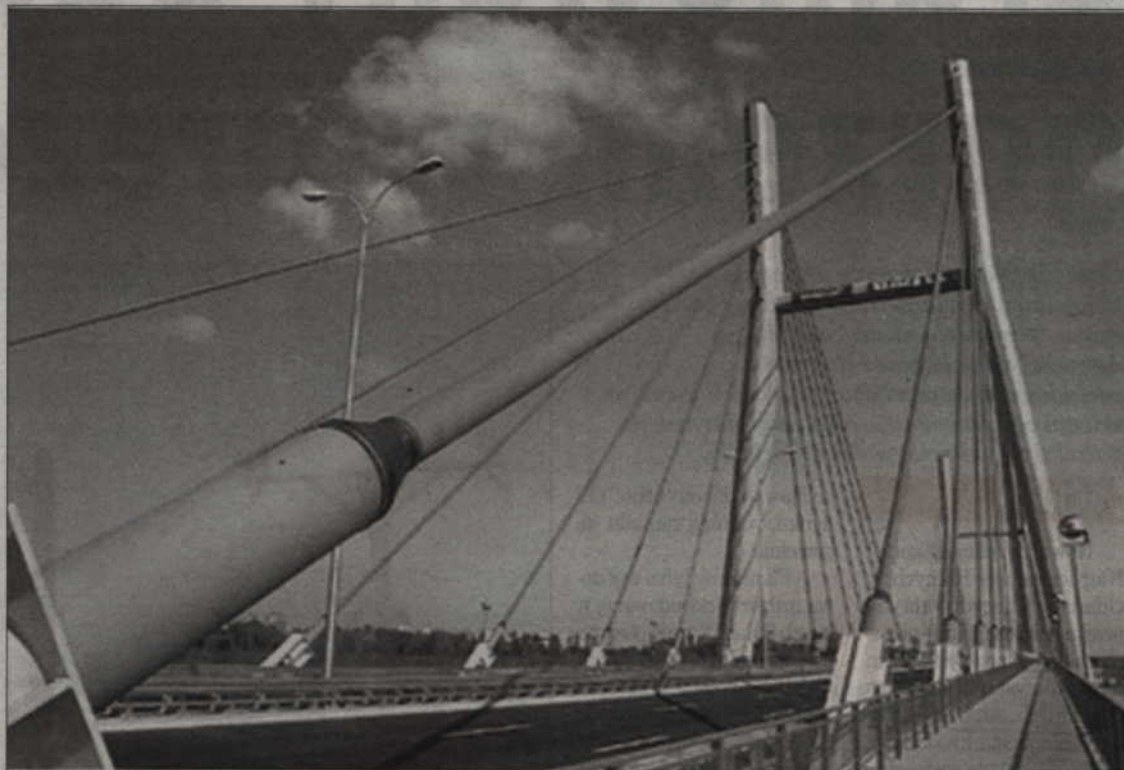
Zgodnie z nowym, trzecim już projektem mostu, ma on mieć tzw. pylony, czyli słupki ze specjalnymi linami. W ten sam sposób zbudowano już charakterystyczne mosty w Gdańsku i Warszawie.

dotychczasowych. Koszt inwestycji szacuje się na ok. 350 mln zł. Samorządowcy od lat podkreślają znaczenie budowy mostu dla całego regionu. Około 1500 samochodów ciężarowych dziennie opuszcza kwidzyńskie zakłady, kierując się w kierunku Malborka i Grudziądza. To wąska, bardzo kręta, droga, nieprzystosowana do przejazdu ciężkich pojazdów drogi. Połączenie z najbliższym, oddalonym o około 15 km, położonym po drugiej stronie Wisły węzłem autostrady A1 umożliwi dalszy rozwój przedsiębiorstw i przyniesie firmom znaczne oszczędności. Budowa mostu ma spowodować dodatkowy napływ efektu inwestycyjnego. Efektu między innymi spadek stopy bezrobocia w regionie oraz wzrost poziomu życia mieszkańców. Dzięki stałej przeprawie mostowej czas