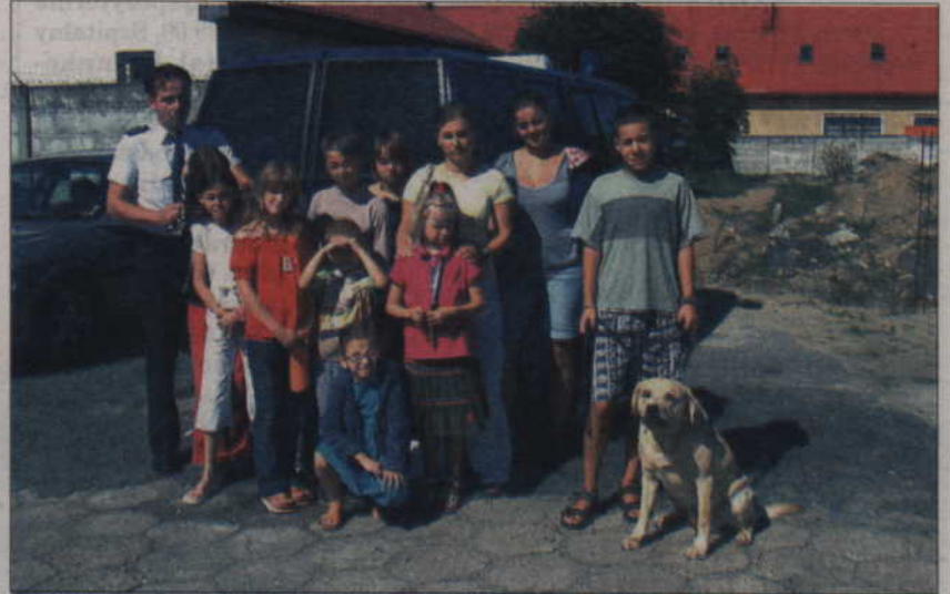
Dzieci podczas wizyty w Komendzie Powiatowej Policji w Kwidzynie.

Celem wizyty było poznanie specyfiki policyjnego zawodu. Dzieci na własne oczy zobaczyły, jak wygląda żmudna policyjna praca. Zapoznali się również z pracą dyżurnego, który zwykle jest pierwszą osobą, która