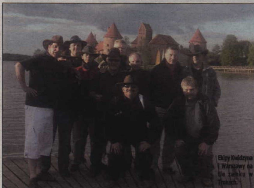
Ekipy Kwidzyna Warszawy na Ile zamku w Trokach.

Kwidzyńskie Stowarzyszenie Bocce i Bowlingu po raz trzeci gościli w Elektronai na międzynarodowym turnieju zorganizowanym przez Litewską Federację Bocce. Trójka okazała się szczęśliwa, bowiem kwidzynianie wywalczyli brązowy medal.