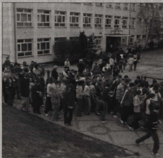
Uroczyste rozpoczęcie roku szkolnego, z udziałem miejskich władz, odbędzie się w tym roku w Gimnazjum nr 3.

W Gimnazjum nr 3 odbędzie uroczyste powitanie nowego roku szkolnego z udziałem władz samorządowych. Każdego roku do oficjalnego rozpoczęcia nauki wybierana jest inna placówka. Początek uroczystości zaplanowano na godz. 9.30.