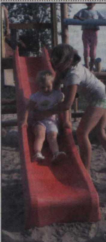
Dzieci z Rozpędzin mają plac zabaw.