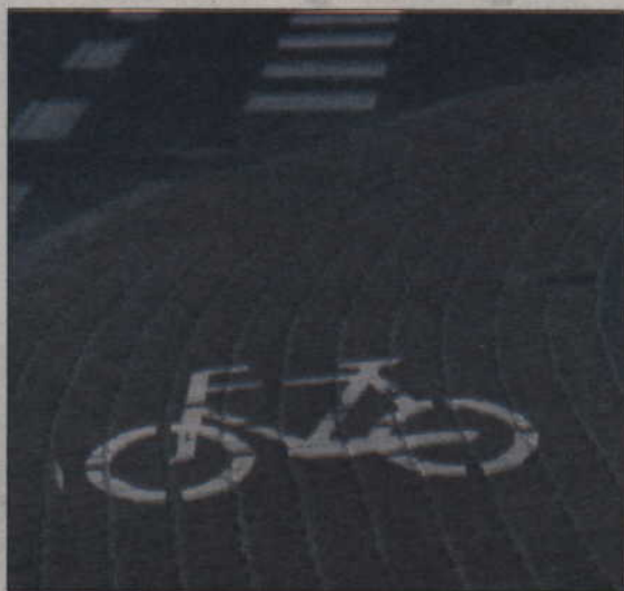
Budowa chodnika wzdłuż drogi z Licza do Bronna kosztować będzie 400 tys. zł.