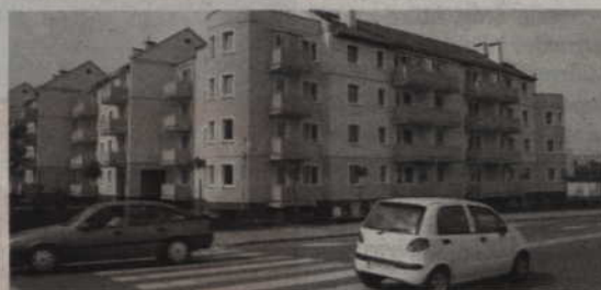
Część lokali komunalnych zwolniła się, bo ich dotychczasowi lokatorzy wybrali mieszkania w TBS.

także mieszkania dla osób z budynku przy ul. Warszawskiej 24. - Musieliśmy wyburzyć budynek z powodu jego bardzo złego stanu technicznego. Podczas wyburzania okazało się, że decyzja była słuszna. Znaleźliśmy lokale dla trzech rodzin, które tam mieszkały. Było to także miejsce spotkań osób, które grały w brydża sportowego, ale wzięło ich pod swoje skrzydła Kwidzyńskie Centrum Sportu i Rekreacji.