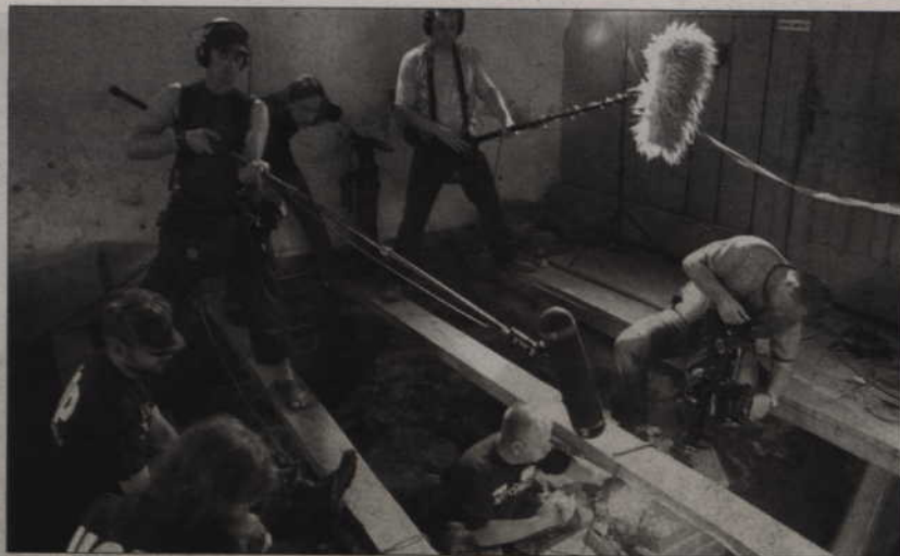
Zwiedzający będą mogli przez szybę oglądać kryptę oraz szkielety wielkich mistrzów. Na zdjęciu: pierwsze chwile po dokonaniu sensacyjnego odkrycia w prezbiterium katedry w ubiegłym roku.

Projekt konserwatorsko-wykonawczy wystawy ma być gotowy do końca września. Przewiduje on przesłonięcie krypty i szczątków szybą, przez którą będą mogli oglądać je zwiedzający. Badania naukowe potwierdziły, że jednym z trzech pochowanych tam mężczyzn na pewno był