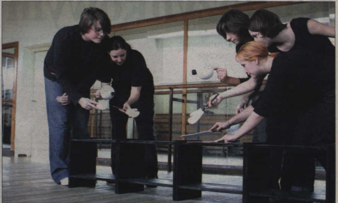
W tygodniowych warsztatach uczestniczyło pięcioro młodych ludzi. Efekty ich pracy będzie można zobaczyć na specjalnym pokazie podczas Festiwalu Miniatur Lalkowych „Animo”.

Przyszli sami z siebie, choć część z nich była już na wcześniejszych takich spotkaniach lub uczestniczyła w festiwalu Animo choćby siedząc na widowni. Nie chodziło nam wcale o zdobycie „narybku” do naszej Sceny. Zależało nam raczej na tym, aby przybliżyć innym język tej sztuki. Dzięki temu ci