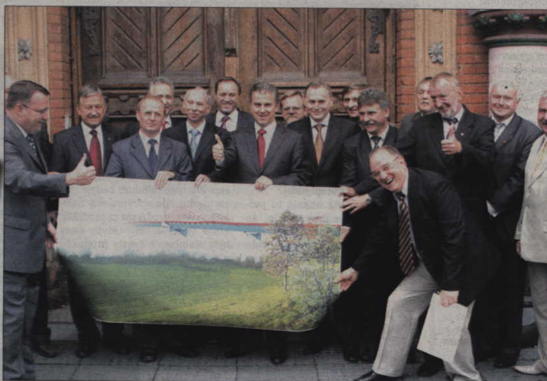
To czwarty już, ale podobno ostateczny projekt mostu przez Wisłę w okolicy Kwidzyna. Budowa ma rozpocząć się w przyszłym roku, a zakończyć w 2012.

KWIDZYN. 3 września zatwierdzono projekt, do końca roku architekci mają zrobić dokumentację, na początku przyszłego - przetarg na wykonawcę. Od tego momentu po 24 miesiącach most ma być gotowy. Obiecał to Cezary Grabarczyk, minister infrastruktury, który przyjechał do Kwidzyna wraz z generalnym dyrektorem Dróg Krajowych i