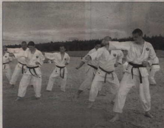
Młodzież i dorośli trenowali w nadmorskich Dębках.

Zapraszamy wszystkich chętnych na zajęcia: karate dzieci, karate młodzieży i dorosłych oraz samoobrony jiu-jitsu. Zajęcia odbywają się w sali gimnastycznej Szkoły Podstawowej nr 5, przy ul. Hallera 4 (środa - godz. 17-19 oraz sobota - godz. 9-11). Więcej informacji znajdą Państwo na stronie: http://www.karate.grudziadz.com.pl/kwidzyn