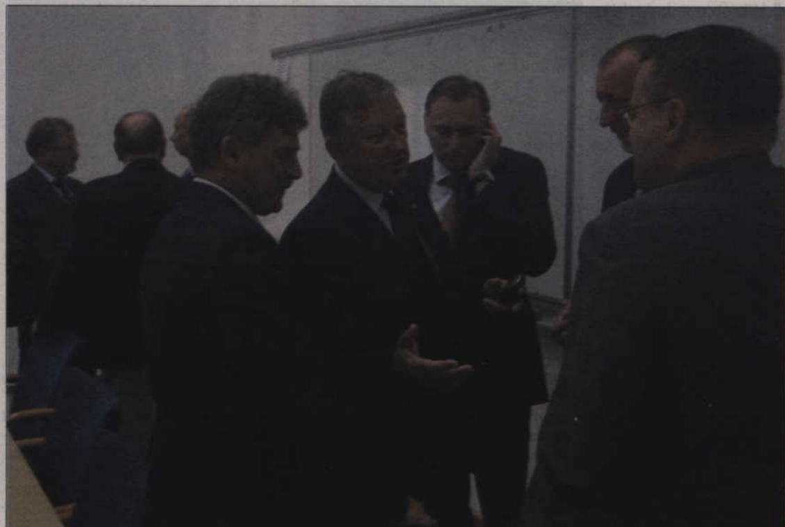
Samorządowcy cieszą się z obietnic ministerstwa, ale są sceptyczni. Gości z Warszawy wypytywali o wiele szczegółów budowy.

most służył mieszkańcom, ale także tym, którzy chcą w Kwidzynie robić interesy. Weryfikacja moich słów nastąpi po uchwaleniu budżetu przez sejm. Z mojej