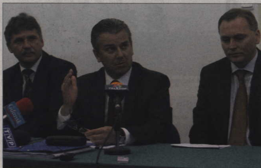
- Chcemy zagwarantować pełne finansowanie, aby w 2012 roku most służył mieszkańcom i tym, którzy chcą w Kwidzynie robić interesy - zapewniał Cezary Grabarczyk, minister infrastruktury.

Uczestnikom przedstawiono koncepcję budowy mostu. Wybrano projekt z pylonami, czyli słupami, na którym montowany jest system lin, podtrzymujących konstrukcję. Dzięki takiemu rozwiązaniu most ma być tańszy i ładniejszy. Poza tym jego budowa będzie trwała krócej. Według projektantów tego typu mosty, to obecnie światowy trend. Budowa ma potrwać 24 miesiące. Koszt budowy samego mostu to ok. 200 mln zł.