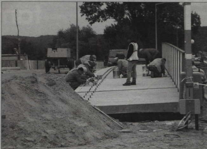
Drugi odcinek to modernizowana obecnie ulica sportowa - za 15 mln zł z funduszy GDDKiA. 18 mln zł od marszałka umożliwi wybudowanie całej obwodnicy.