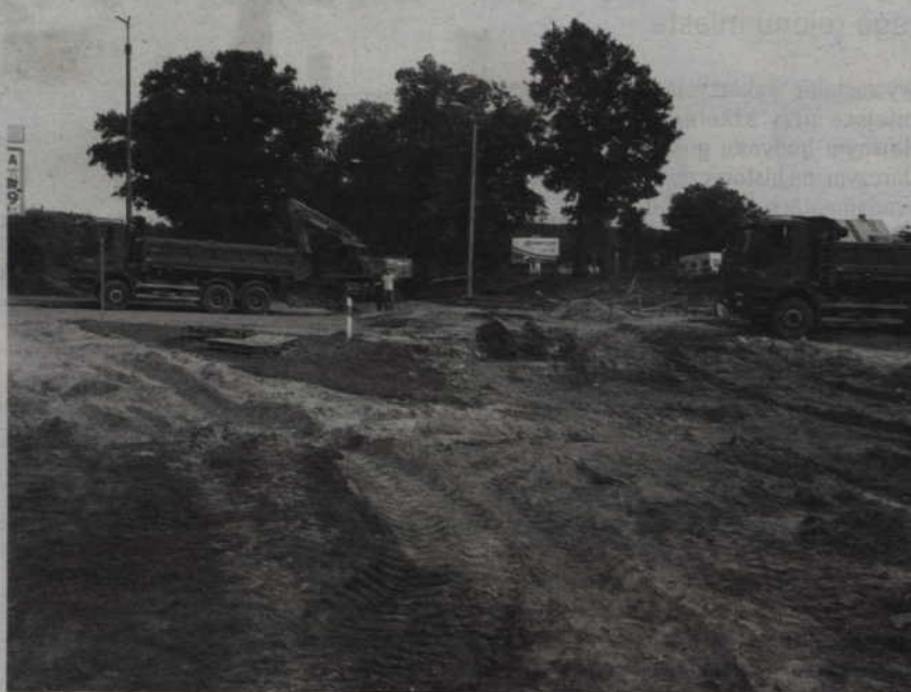
Pierwszy odcinek małej obwodnicy oddano do użytku w 2005 roku, to most na ulicy Południowej, który kosztował 5 mln zł.

- Takich pieniędzy na budowę dróg jeszcze nie otrzymaliśmy. Pozwolą one na sfinansowanie 75 proc. kosztów przedsięwzięcia. Przypomnę tylko, że to już kolejna kwota na budowę