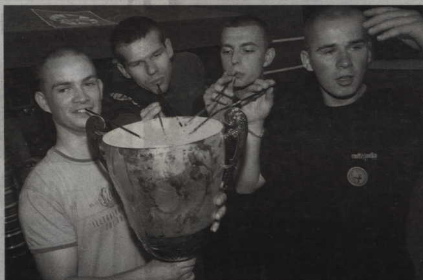
Urząd Miasta I triumfował w turnieju już po raz trzeci z rzędu. Na koniec zwycięzcy napili się mistrzowskiego koktajlu ze zwycięskiego pucharu.

W początkowej fazie rozgrywek zespoły podzielono na cztery grupy eliminacyjne. Tradycyjnie rozstawione zostały zespoły pierwszej osiemki poprzednich mistrzostw a reszta została do nich dołowywana. W grupie A znaleźli się: U.M.I., TKKF Tor-Pal, Multimedia, BE&K, Celle (Niemcy), Piastów. Do grupy B trafili: TKKF Celuloza, Solidarność IP, Zygi's II, Renawa III, Kaisia (Litwa), Olsztyn. Grupę C tworzyli: Renawa I, Solidarność Demi, Zygi's I, SM Pomezania, Chojnice, Elbląg. Natomiast w grupie