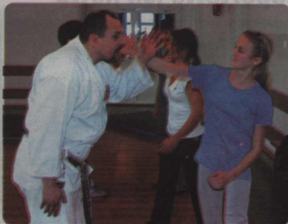
„Kobieta 5 kroków po bezpieczeństwo” to program, który uczy mieszkanki miasta jak nie stać się ofiarą przemy i w jaki sposób obronić się przed napastnikiem. Cykl szkoleń dla pań organizuje Stowarzyszenie Bezpieczny Kwidzyn. Zajęcia wspierane są przez Urząd Miejski w Kwidzynie.