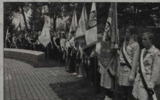
(ad) Uroczystości rocznicowe odbędą się na Skwerze Kombatantów.

Dzisiaj, 17 września, przypada kolejna rocznica napaści wojsk radzieckich na Polskę w 1945 roku. Z tej okazji na Skwerze Kombatantów przy ul. Warszawskiej odbędą się okolicznościowe uroczystości. Odsłonięta zostanie też pamiątkowa tablica, pod którą wmurowane zostaną urny z pól bitewnych.