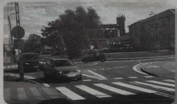
Poprawione zostanie rondo u zbiegu ulic Kopernika i Południowej. Wysepka zostanie wykonana z kamienia, aby widać było wyraźnie jego obrys.