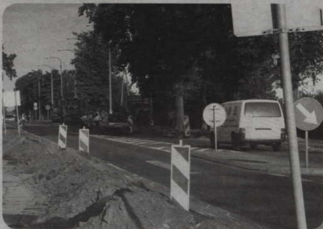
Rozpoczął się remont ul. Warszawskiej. Zmodernizowany zostanie odcinek od ronda do ul. Wąbrzeskiej.

Rozpoczął się remont ul. Warszawskiej. Zmodernizowany zostanie odcinek od ronda do ul. Wąbrzeskiej. To część drogi wojewódzkiej z Kwidzyna do Prabutu. Inwestorem jest Zarząd Dróg Wojewódzkich. Samorząd miasta wzdłuż modernizowanej ulicy wybuduje ścieżkę dla pieszych i rowerzystów