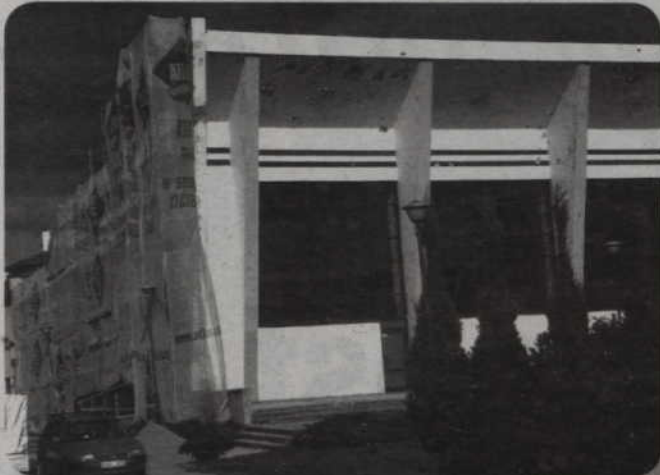
Do końca września ma trwać remont krytej pływalni. Docieplane są ściany budynku.

Do końca września powinien zakończyć się remont krytej pływalni. Docieplane są ściany budynku. Koszt prac wyniesie ok. 220 tys. zł.