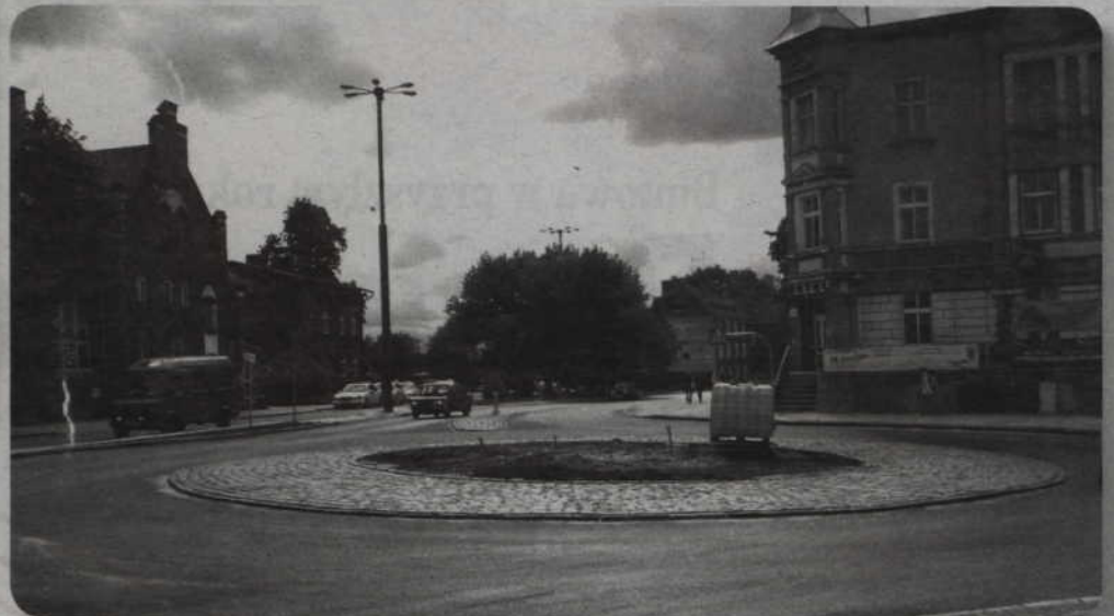
Dobiega końca budowa ronda u zbiegu ulic Chopina i Kościuszki. Trwają ostatnie prace wykończeniowe.

Dobiega końca budowa ronda u zbiegu ulic Chopina i Kościuszki. Trwają ostatnie prace porządkowe. Władze miasta myślą o budowie kolejnych rond, w tym na skrzyżowaniu ulic Batalionów Chłopskich i Górnej.