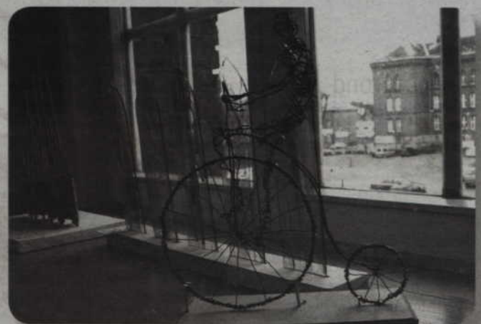
Rondo u zbiegu ulic Chopina i Kościuszki zostanie ozdobione przestrzenną rzeźbą.