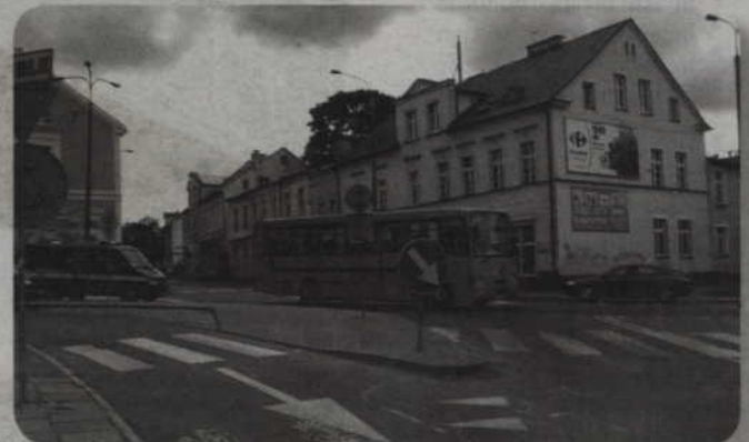
Władze miasta myślą o budowie kolejnych rond, w tym na skrzyżowaniu ulic Batalionów Chłopskich i Górnej. Rozpoczęła się faza projektowania. Przebudowane zostanie całe skrzyżowanie. Obecne rozwiązanie jest zbyt skomplikowane. Rondo poprawi bezpieczeństwo w tym rejonie miasta.