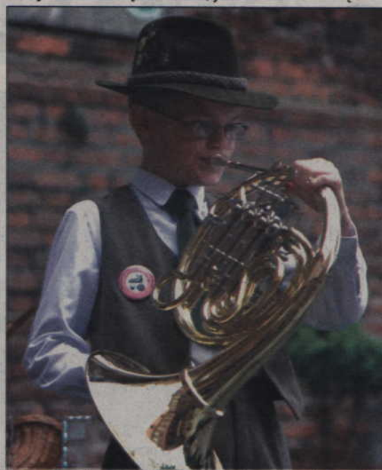
Powiat kwidzyński ma bogate tradycje myśliwskie, co roku odbywa się tu ogólnopolski festiwal łoświeckiej.

Myśliwi nauczą młodzież, jak dbać o zwierzęta