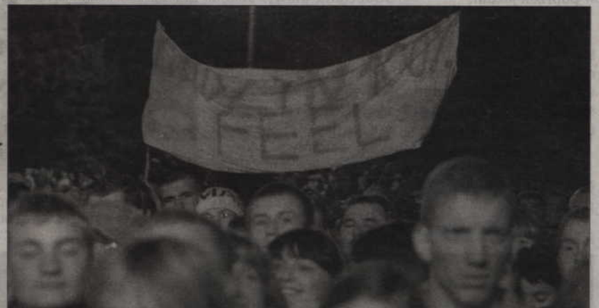
FEEL ma w Kwidzynie wielu fanów.