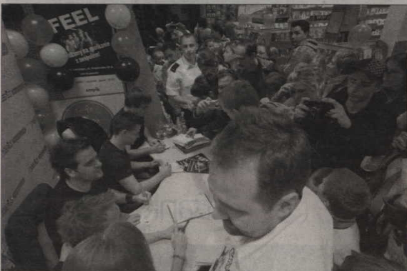
Kwidzyński salon EMPIK. W kolejce po autograf idola...