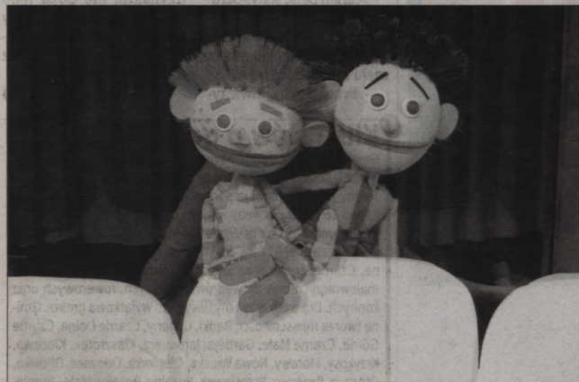
Fragment spektaklu w wykonaniu Grodzieńskiego Obwodowego Teatru Lalek.