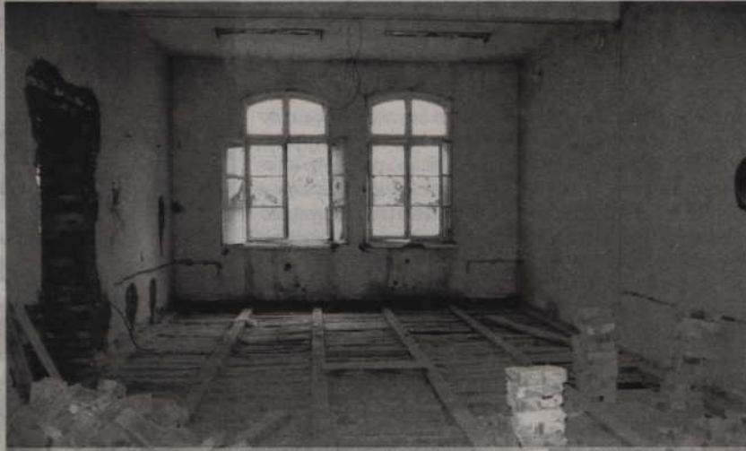
W przyszłym roku pokoszarowy budynek przy ul. Kościuszki będzie nową siedzibą starostwa. Pomieszczenia wymagają kapitalnego remontu.

- Trwają prace rozbiórkowe oraz instalacyjne. Powoli zaczyna się tworzyć kształt tego nowego wnętrza. Po wizycie na budowie stwierdziłem, że