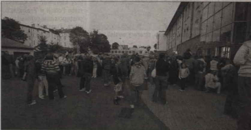
Fani zespołu FEEL przed wejściem do EMPIK-u.