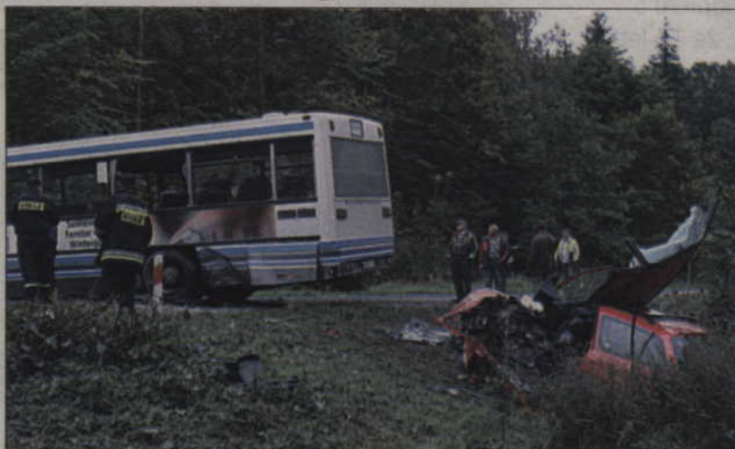
Kierowca autobusu wycieczkowego na tyle nieostrożnie wyprzedził inny pojazd, że spowodował wypadek, w którym rannych zostało pięć osób.

(ad) Aby wydobyć ze środka kierowcę forda mondeo, który wpadł do rowu, strażacy musieli wspomagać się specjalistycznym sprzętem.