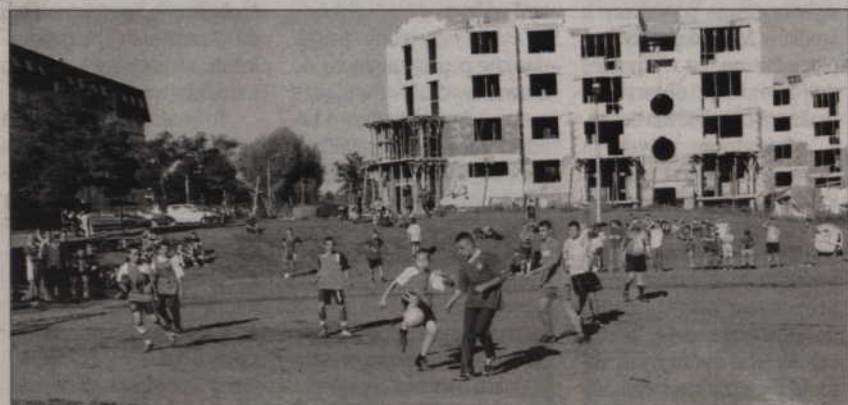
Dwa razy do roku boisko do piłki nożnej jest areną zmagania drużyn podwórkowych.

To już drugie boisko ze sztuczną murawą w Kwidzynie. Na początku maja otwarte zostało boisko przy ul. Topolowej. Zbudowano je w ramach akcji „Blisko boisko”. Samorząd miasta otrzymał na budowę pieniądze z Ministerstwa Sportu w kwocie 320 tys. zł oraz 100 tys. zł z Urzędu Marszałkowskiego. Pozostała kwota pochodziła z budżetu miasta.