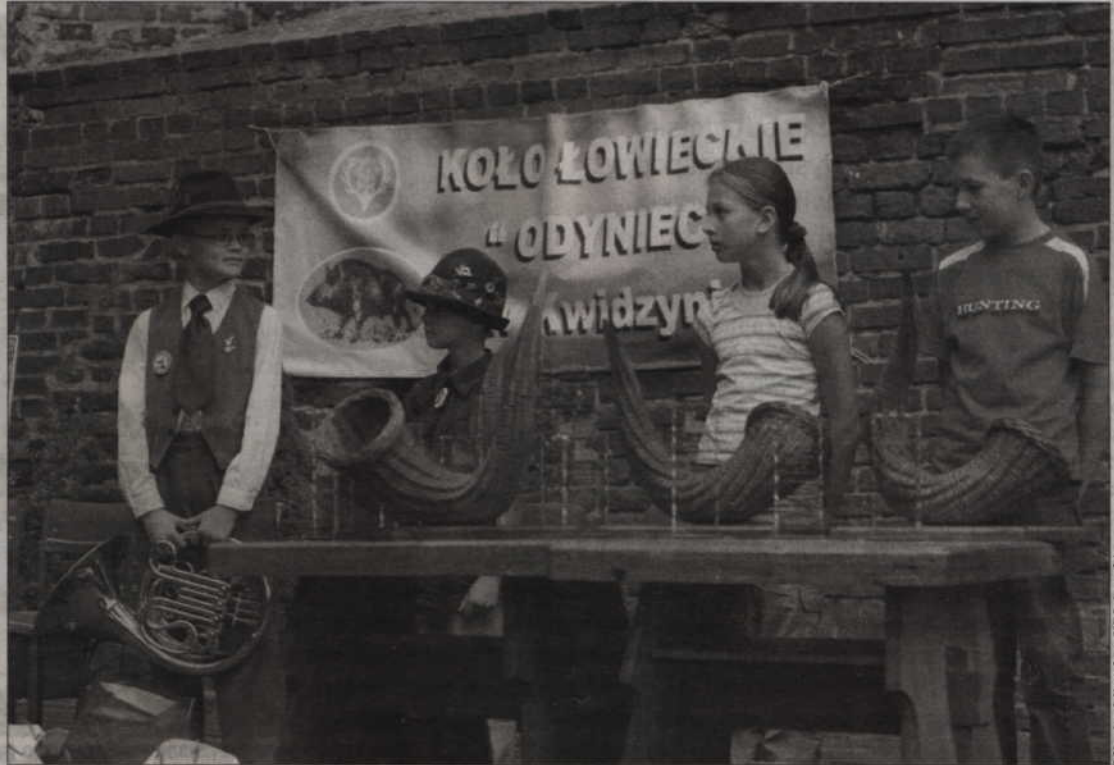
Laureaci przeglądu w najmłodszej kategorii wiekowej.