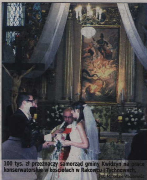
100 tys. zł przeznaczy samorząd gminy Kwidzyn na prace konserwatorskie w kościołach w Rakowcu i Tychnowach.

marcu bieżącego roku, o dotację z budżetu gminy mogą się ubiegać podmioty, które są właścicielami zabytków w złym stanie technicznym, których znaczenie kulturowe jest bardzo ważne. Dotacja może być udzielona do 50 proc. kosztów planowanych prac. W przypadku, gdy wnioskodawca otrzymuje inne środki publiczne, kwota dotacji nie może przekroczyć kosztów całego przedsięwzięcia. Historia obu kościołów, które otrzymały dotację sięga XIV wieku. (jk)