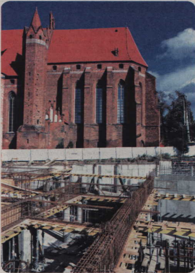
Pierwsze kamienice zostaną oddane do użytku w przyszłym roku.