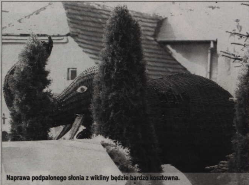
Naprawa podpalonego słonia z wikliny będzie bardzo kosztowna.

Pojazdem, czarnym volkswagenem golfem, kierował 45-letni mężczyzna. Na zakręcie stracił panowanie nad kierownicą, auto wypadło z drogi i uderzyło w drzewo. Wezwani na miejsce policjanci ustalili, że kierujący miał prawie 4 promile alkoholu w wydychanym powietrzu. Co ciekawe, to właśnie ten,