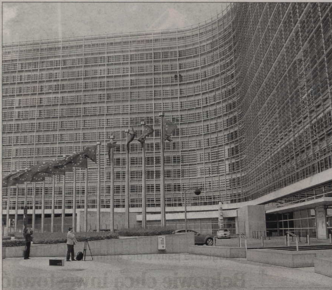
Gmachu Parlamentu Europejskiego nie sposób pomylić z innymi nowoczesnymi budynkami w centrum liczącej ponad milion mieszkańców Brukseli.

- Nie odmieniła ona represyjnego charakteru władzy. W dodatku rosyjska ofensywa w Gruzji, zasygnalizowała odnowienie ambicji imperialnych Rosji. Z pewnością zauważono to w Mińsku. Próba wykorzystania tej nowej sytuacji przez dyplomację Unii Europejskiej wydaje się zasadna, przy całej świadomości ryzyka dialogu z dyktatorem. Działo się to w porozumieniu z