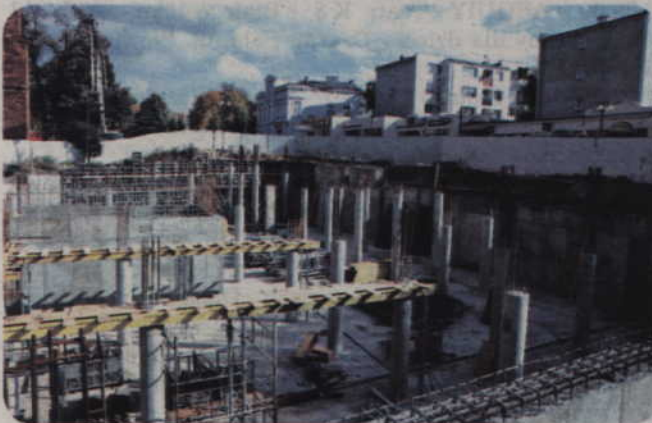
Budowę poprzedziły badania archeologiczne terenu.