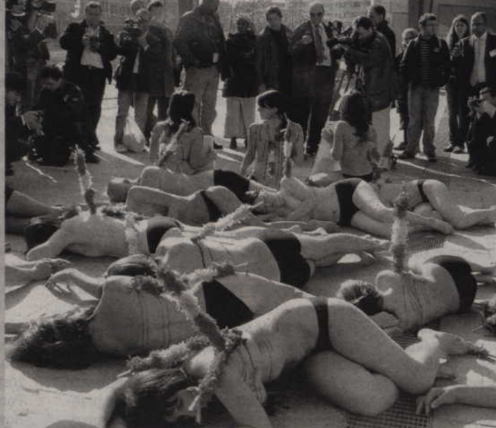
Aktywiści organizacji People for the Ethical Treatment of Animals (PETA) protestowali przeciwko walkom byków. Według PETA każdego roku na arenach ginie kilkadziesiąt tysięcy byków.

Wiele dzieje się także poza murami parlamentu. Mieszkańcy Unii Europejskiej często wyrażają przed gmachem parlamentu swoje niezadowolenie z podejmowanych decyzji lub z powodu ich braku. Przykładem obrońcy praw zwierząt, którzy protestowali przed Siedzibą Parlamentu Europejskiego. Aktywiści organizacji People for the Ethical Treatment of Animals (PETA) protestowali przeciwko walkom byków. Według PETA każdego roku na arenach ginie kilkadziesiąt tysięcy byków. Zwierzętom nie daje się żadnej szansy na przeżycie. PETA to międzynarodowa organizacja, która o prawa zwierząt walczy od 1980 roku. Zrzesza ponad 1,6 mln członków. Tak przynajmniej wynika z oficjalnych informacji organizacji. Organizacja prowadzi swoją walkę w pokojowy sposób, organizując różnego rodzaju protesty oraz pikety. PETA znana jest z akcji „Wolę być naga niż nosić futro”. People for the Ethical Treatment of Animals wspierają znane gwiazdy, w tym Pamela Anderson oraz polska modelka Joanna Krupa. Dzień wcześniej przed parlamentem protestowali ekolodzy żądając zdecydowanych działań na rzecz ochrony środowiska i ograniczenia emisji gazów cieplarnianych.