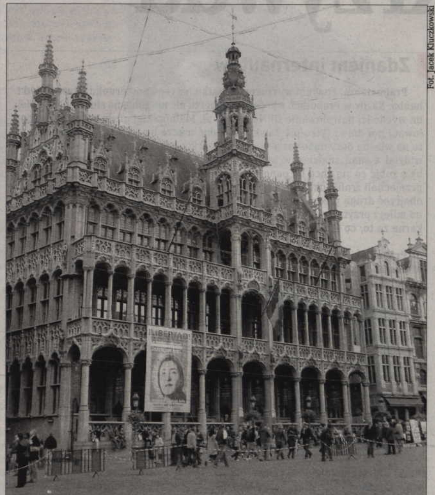
Gmachu Parlamentu Europejskiego nie sposób pomylić z innymi nowoczesnymi budynkami w centrum liczącej ponad milion mieszkańców Brukseli.

Wiceszef komisji budżetowej twierdzi, że największym problemem i