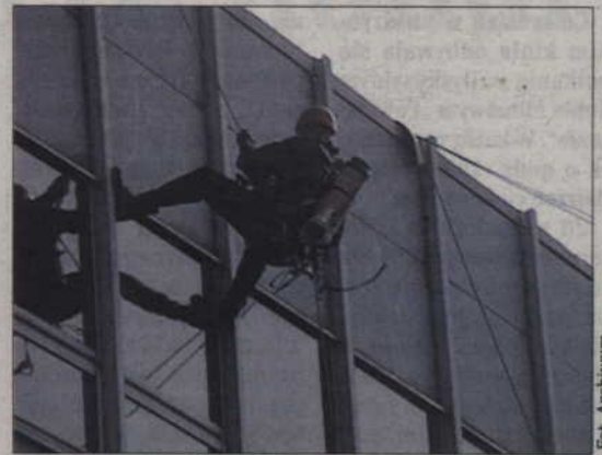
Ćwiczenia służb ratowniczych odbędą się na terenie International Paper.