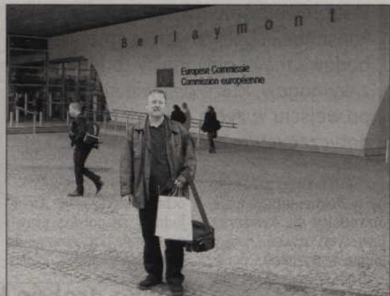
Nasz reporter przed siedzibą Komisji Europejskiej. To tutaj zarządza się wszystkimi unijnymi funduszami, które trafiały lub trafią także do powiatu kwidzińskiego.

nim organizowane. Wystawy, spotkania i seanse filmowe promujące kraje Unii Europejskiej oraz zwracające uwagę na ważne problemy społeczne. Wielojęzyczny gwar rozbrzmiewa na wszystkich korytarzach oraz w windach. Dominują języki angielski oraz francuski, którym mówi także większość mieszkańców Brukseli. Parlament Europejski to także duży dział prasowy. Dyrekcja do