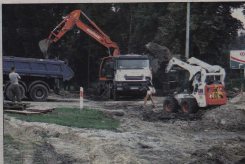
Obwodnica wokół Kwidzyna ma powstać do końca 2009 roku.