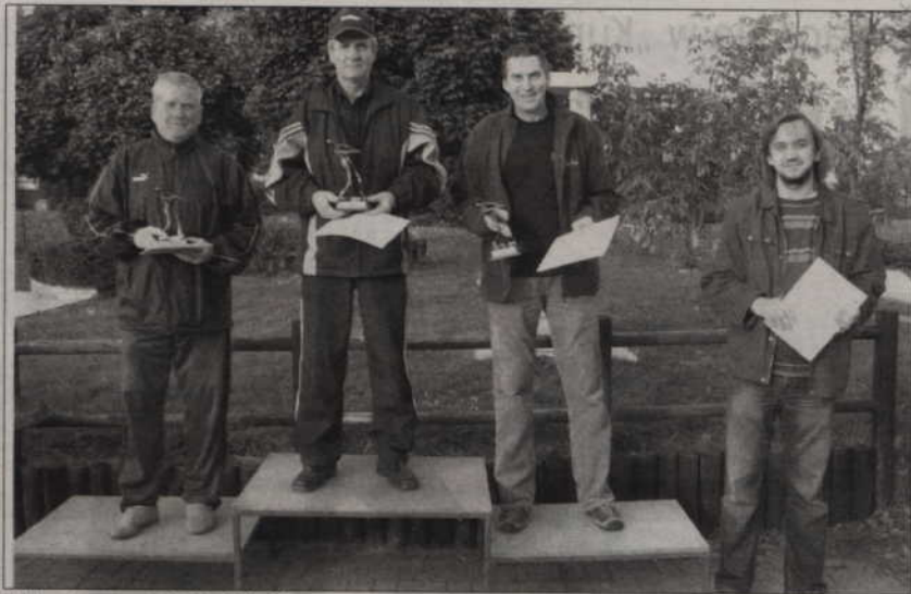
Najlepsi w rozgrywkach minigolfa.

Po zawodach wszyscy zawodnicy zostali zaproszeni na ognisko i pieczone ziemniaki, przygotowane przez organizatora roz- grywek.