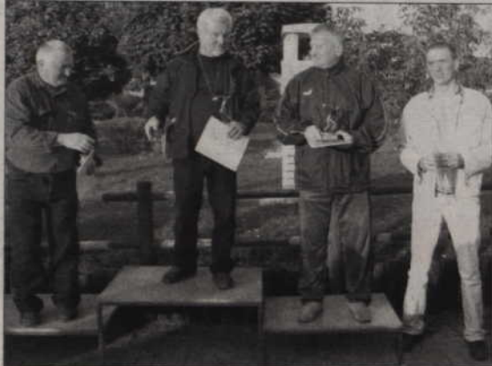
Zwycięzcy turnieju bocce