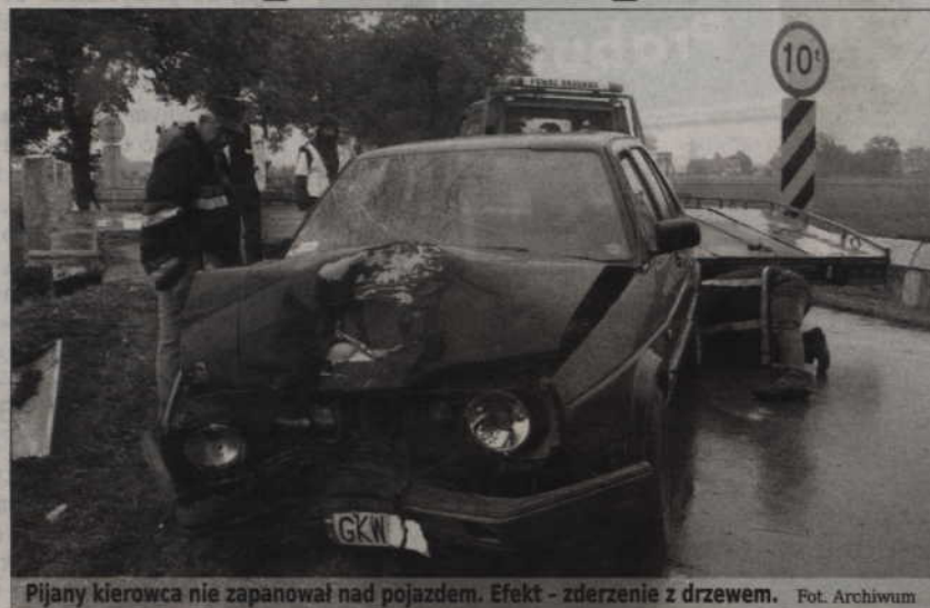
Pijany kierowca nie zapanował nad pojazdem. Efekt - zderzenie z drzewem.

który usiadł za kółko, był najbardziej niestrzeżony ze wszystkich podróżujących tym samochodem - dwaj pasażerowie mieli „zaledwie” 2,5 promila. Do wypadku doszło na