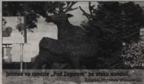
Jelonek na rondzie „Pod Zegarem” po ataku wandalów.

Wandale zniszczyli także wiklinowego jelonka na rondzie „Pod Zegarem”.