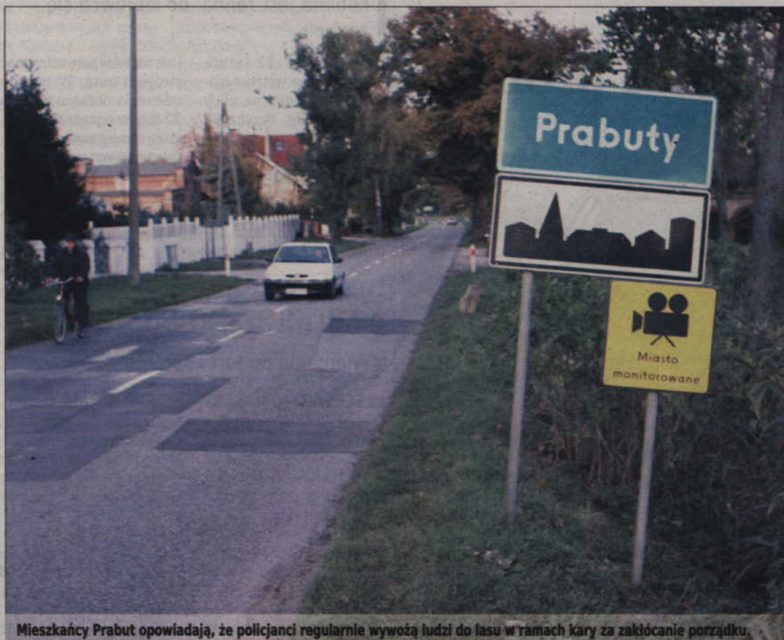
Mieszkańcy Prabut opowiadają, że policjanci regularnie wywożą ludzi do lasu w ramach kary za zakłócanie porządku.

Ta historia to tylko jeden z wielu wątków tej bulwersującej sprawy. Mieszkańcy Prabut twierdzą, że wywożą