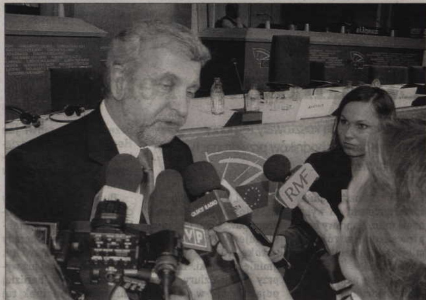
Aleksandar Milinkiewicz, jeden z liderów białoruskiej opozycji odpowiada na pytania dziennikarzy.