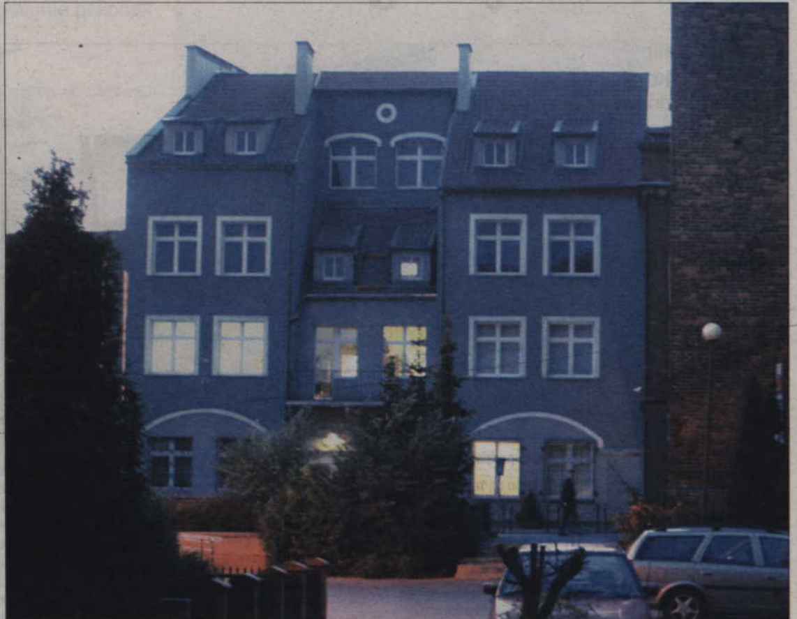
Za przekroczenie urupnień policjantom grozi do trzech lat więzienia.

Innym razem, w podobnej sytuacji, policjanci zawieźli Małgorzatę do lasu i tam zostawili. Było ciemno i kobieta błękała się przez dłuższy czas, aż trafiła do jakiegoś domu. Poprosiła o pomoc gospodarzy, którzy wezwali na ratunek... prabuckich