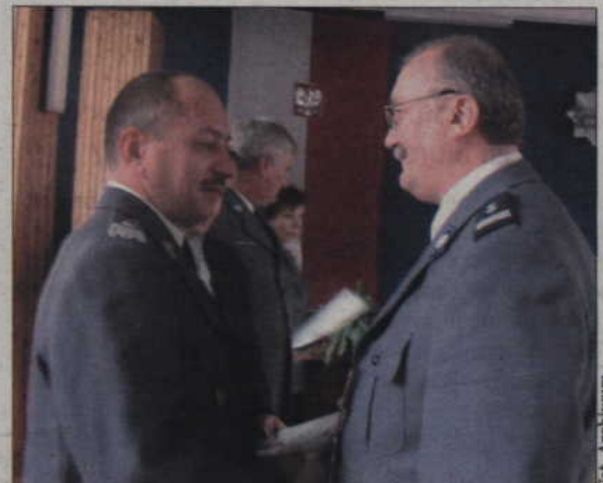
Komendant kwizdyńskiej policji otrzymał nagrodę za „pełną poświęceń pracę” od wojewódzkiego komendanta policji w Gdańsku Krzysztofa Starańczaka.