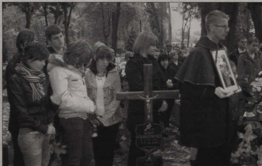
Przyjaciele ze szkoły mocno przeżyli śmierć koleżanki.

Przypomniał, że Jezus aby dotrzeć do swojej wyznaczonej godziny śmierci musiał odwiedzić Jero-