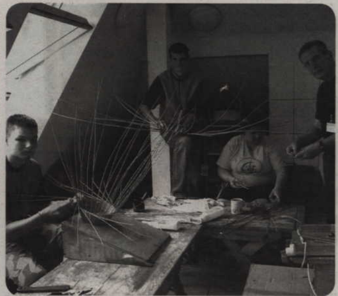
Warsztat Terapii Zajęciowej w Górkach chce, aby niepełnosprawni posiadli jak najwięcej umiejętności przydatnych w przyszłej pracy zawodowej. Na zdjęciu: zajęcia w pracowni wikliniarskiej.

Warsztat Terapii Zajęciowej w Górkach chce, aby niepełnosprawni posiadli jak najwięcej umiejętności przydatnych w przyszłej pracy zawodowej. W planach jest utworzenie pracowni stolarskiej.