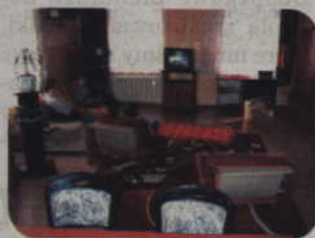
Przed świętami wychowankowie Domu Dziecka opuszczą budynek przy ul. Braterstwa Narodów w Kwidzynie.