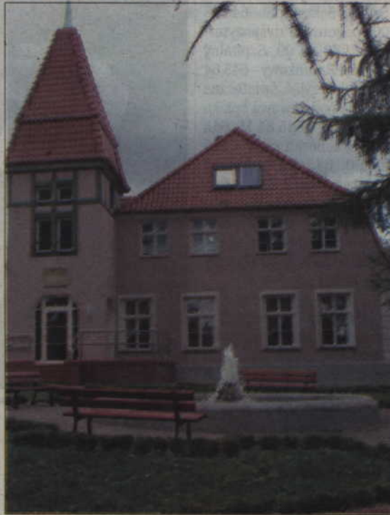
Siedziba Warsztatu Terapii Zajęciowej znajduje się w zabytkowym dworku w Górkach (gmina Kwidzyn).

Uroczystości 15-lecia WTZ odbyły się w klimacie lat 20. Organizatorzy przygotowali wiele niespodzianek dla gości, którzy odwiedzili pałac w podkwidzyńskich Górkach. (jk)