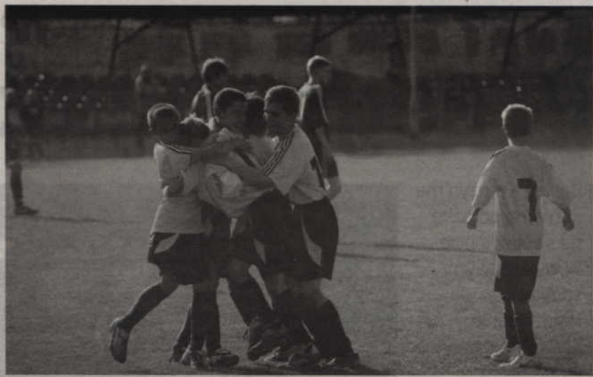
Tak piłkarze cieszą się ze zdobycia kolejnej bramki.