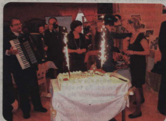
Na 15-lecie Warsztatu Terapii Zajęciowej w Górkach nie zabrakło urodzinowego tortu.