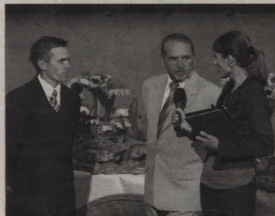
TVP Gdańsk gości w Kwidzynie najwyżej raz do roku, podczas nagrywania wakacyjnego programu plenerowego z różnych miast Pomorza. Tak było także podczas tegorocznego lata.