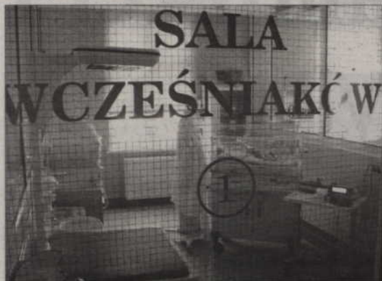
Sprawny agregat prądowłoczy jest w szpitalu niezbędny dla bezpieczeństwa pacjentów.

POWIAT. W kwidzyńskim szpitalu zostanie zamontowany nowy agregat prądowłoczy. Urządzenie musi posiadać każda tego typu placówka na wypadek, gdy zabraknie prądu. Wykonane zostaną także prace poprawiające zasilanie szpitala w energię elektryczną.