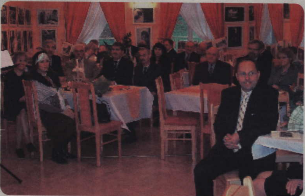
W uroczystości wzięły udział osoby, które od lat wspierają Warsztat Terapii Zajęciowej, przedstawiciele samorządów Gminy Kwidzyn, miasta Kwidzyna i powiatu kwidzyńskiego, rodzice niepełnosprawnych uczestników, a także przedstawiciele firm, które brały udział w renowacji dworku. Cała uroczystość została zorganizowana w klimacie lat 20-tych. Wówczas pałac przeżywał lata świetności.