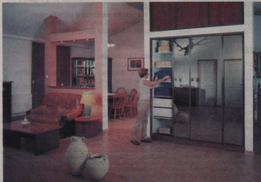
W tak zorganizowanej przestrzeni łatwiej o porządek.