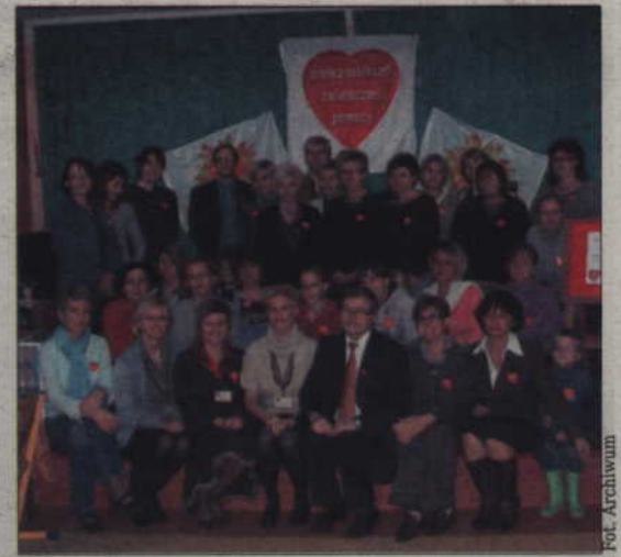
Kwidzyńscy działacze Wielkiej Orkiestry Świątecznej Pomocy.