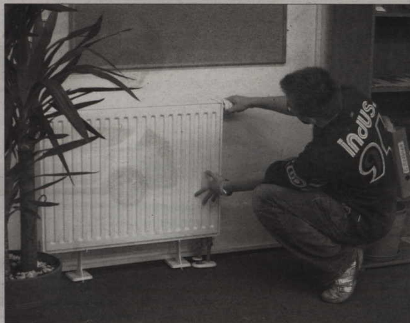
Najlepszym sposobem regulowania temperatury w pomieszczeniu jest używanie pokrętki przy kaloryferze. Dzięki temu zużywa się mniej ciepła.

Zacznij regulować temperaturę w swoim mieszkaniu czy biurze, ale nie... otwierając okno. Wystarczy, że ruszysz pokrętkiem kaloryfera. Jeśli wyjeżdżasz na dłużej, albo nawet na weekend, pokręć ogrzewanie do minimum. Ponowne