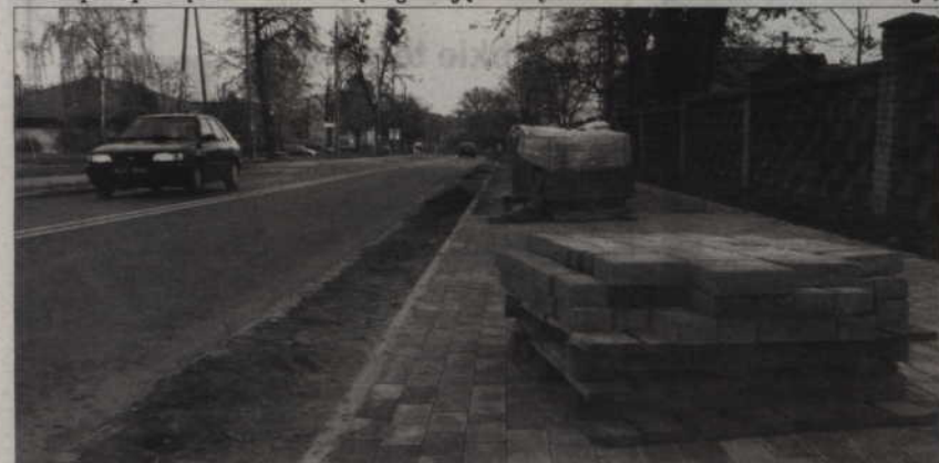
Budowa ścieżki dla pieszych i rowerzystów przy ul. Warszawskiej kosztować będzie ok. 600 tys. zł.