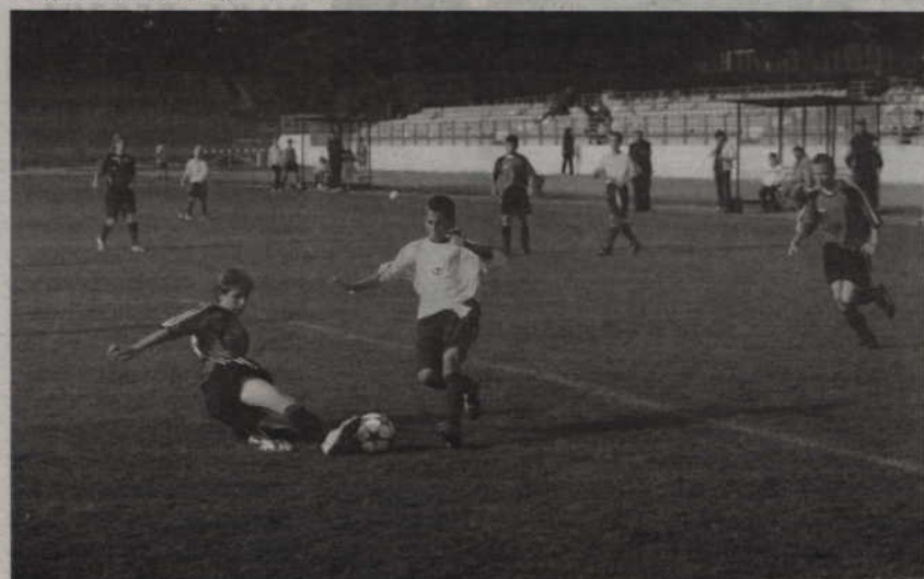
Rodło wygrało wszystkie mecze tracąc punkty zaledwie w zremisowanym meczu z Olimpią Sztum.