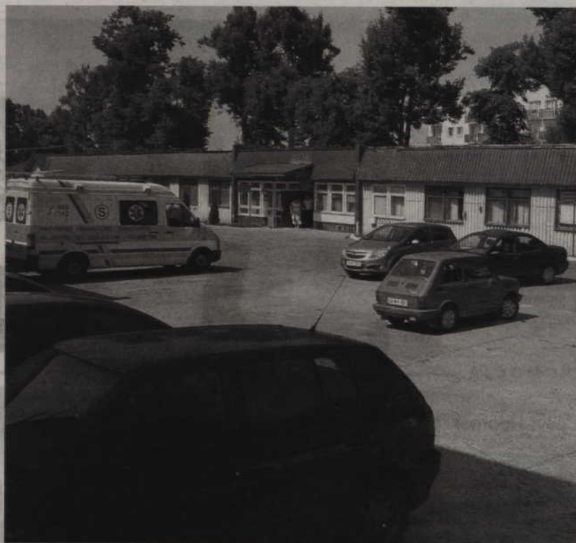
Samorząd powiatowy o 20 lat przedłużył umowę ze spółką „Zdrowie” na dzierżawę majątku szpitala.