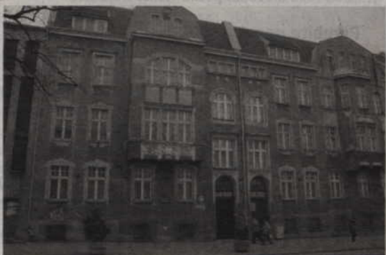
Przeprowadzka do nowych domów oznacza koniec funkcjonowania tradycyjnej formy opieki nad dziećmi, w budynku przy ul. Braterstwa Narodów Dom Dziecka przestanie istnieć.

Prawdopodobnie jeszcze przed świętami wychowankowie Domu Dziecka wprowadzą się do dwóch jednorodzinnych domów. Budowa pierwszego dobiega końca przy ul. Staszica w Kwidzynie, natomiast drugiego w Ryjewie. W każdym z nowych domów zamieszka 14 wychowanków. Koszt inwestycji to ok. 1,3 mln zł.