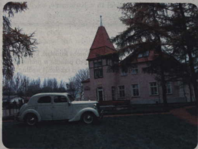
Siedziba WTZ znajduje się w zabytkowym pałacu w podkwidzyńskich Górkach.