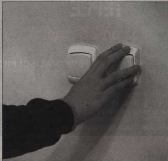
Chcesz płacić mniejsze rachunki za energię elektryczną? Włączaj w swoim mieszkaniu wszystko, co niepotrzebnie pożera prąd.

„Zjedzą” one znacznie mniej prądu niż te, które oznaczone są literą B lub kolejną, która oznacza wyższe zużycie energii, do G, czyli najwyższe. Dla przykładu energooszczędna lodówka klasy A, o pojemności 200 litrów zużywa od 0,8 do 1 kWh na dobę, zaś klasy G, o tej samej pojemności, nawet 3,3 kWh. To w przeliczeniu na koszty daje ok. 20 zł miesięcznie, zaś rocznie 250 zł. Pralka klasy A o pojemności bębna 5 kg zużywa ok. 1 kWh prądu na jedno pranie, pralka klasy G, przy tej samej pojemności - nawet 3 kWh itp. Innymi słowy na jednym praniu można zaoszczędzić ponad 70 groszy. Przy intensywnym praniu oszczędność sięga 200 zł rocznie. Można obliczyć, że wydatek na dobrej klasy urządzenie energooszczędne zwraca się zazwyczaj po kilku latach, a urządzenie starcza na około 20 lat.