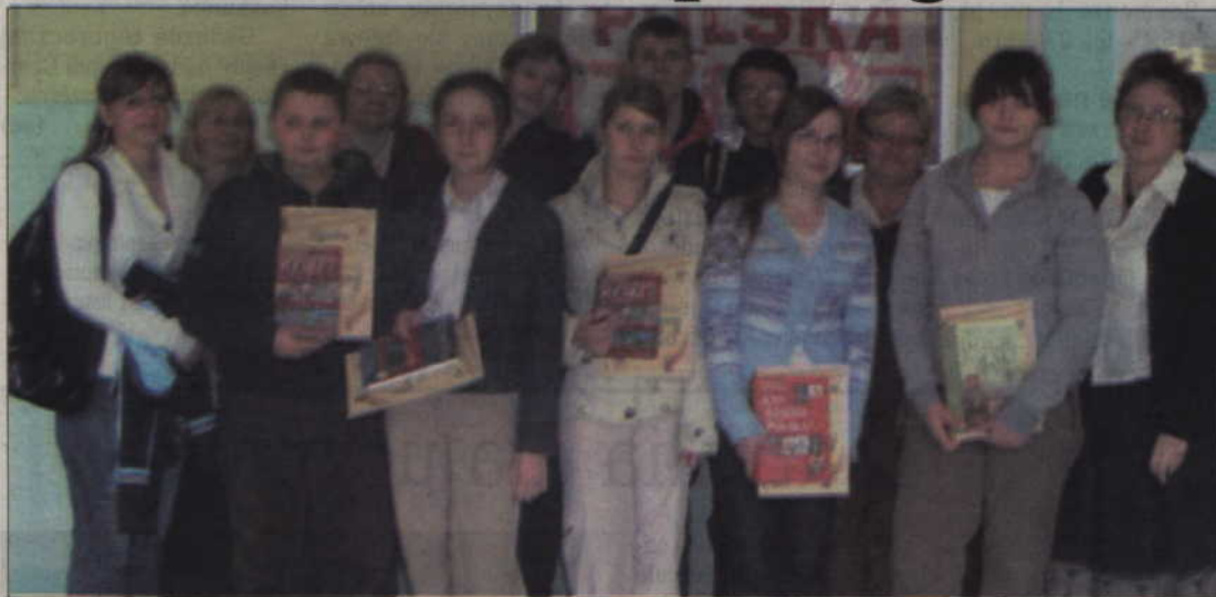
Laureaci konkursu historycznego.