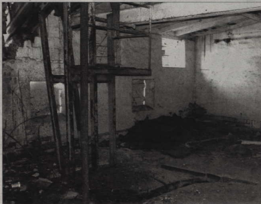
Zdewastowany budynek dawnej gorzelnii w Górkach zostanie rozebrany.

się w sąsiedztwie Centrum Rehabilitacji Osób Niepełnosprawnych, Towarzystwa Rozwoju Powiatu Kwidzyńskiego i tworzonych parku przemysłowo-technologicznego. Jeżeli konserwator zabytków wyrazi zgodę na rozbiórkę przybudówek gorzelnii, samorząd zamierza od razu przystąpić do prac rozbiórkowych. (jk)