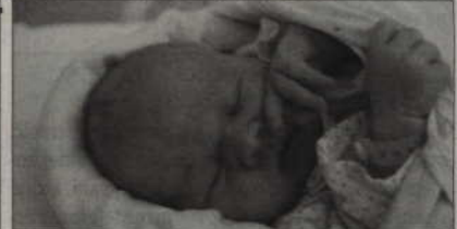
Syn Doroty i Sławomira Ossowskich z Kwidzyna przyszedł na świat 22 stycznia o godz. 23.40 (waga: 4,15 kg, długość: 56 cm).