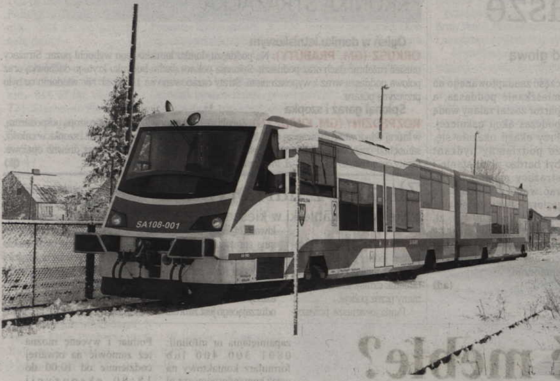
Na trasie Malbork - Grudziądz zaplanowano dziesięć kursów na dobę.