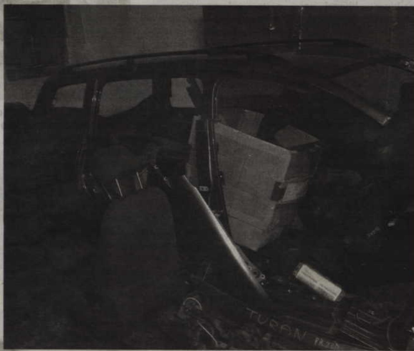
Dziuplę samochodową kwidzyńscy policjanci namierzyli i rozbili z pomocą funkcjonariuszy z Tczewa.