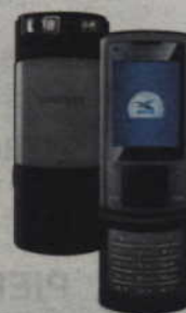
SAMSUNG U900 SOUL