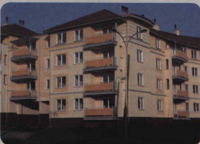
TBS wybudowało nowe mieszkania na osiedlu Piastowskim przy ulicach Krzywoustego 5 i Sokolej 15.