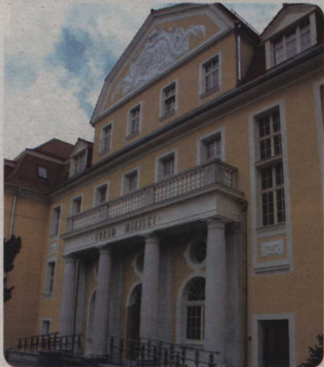
Samorząd miasta będzie wykorzystywał cały budynek na swoje potrzeby, gdyż Starostwo Powiatowe będzie mieściło się przy ul. Kościuszki.

Sama przeprowadzka zostanie przeprowadzona