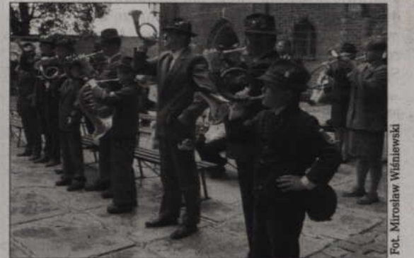
Przeгляд muzyki i kultury myśliwskiej odbywa się w Kwidzynie od wielu lat.

- Zamierzamy wspierać organizację tej ogólnopolskiej imprezy. To doskonała promocja dla naszego powiatu. Sprawa trochę się skomplikowała, gdyż to nowa organizacja, która została zarejestrowana po terminie składania wniosków. Jednak pieniądze, o które występujemy, mają być jedynie środkami własnymi, umożliwiającymi zdobycie pieniędzy z innych źródeł. Poza tym regulamin dopuszcza skła-