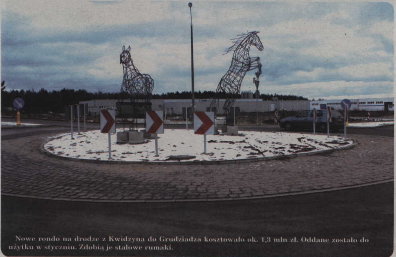
Nowe rondo na drodze z Kwidzyna do Grudziądza kosztowało ok. 1,3 mln zł. Oddane zostało do użytku w styczniu. Zdobią je stalowe rumaki.

Samorząd miasta zamierza w pierwszej kolejności realizować inwestycje, które otrzymają unijne wsparcie. Aby otrzymać pieniądze z Unii Europejskiej lub środki pochodzące z innych pozabudżetowych źródeł, miasto musi zapewnić sobie wkład własny. Ponieważ nie wiadomo, kiedy rozstrzygnięte zostaną unijne konkursy, ile i na co samorząd otrzyma pieniądze, plan tegorocznych inwestycji musi być nie tylko elastyczny, ale zawierać wiele alternatywnych rozwiązań.