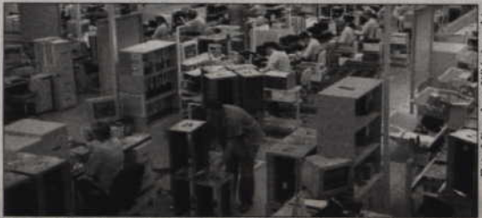
Trzej mężczyźni próbowali ukraść z jednej z kwizyńskich fabryk części do produkcji telewizorów. Ukrywali je na terenie zakładu w pudełkach po ręcznikach.