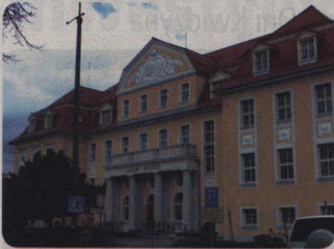
Do końca lutego potrwa remont gmachu Urzędu Miejskiego. W budynku przy ul. Warszawskiej trwają ostatnie prace wykończeniowe. Przeprowadzka rozpocznie się w kwietniu.

Do końca lutego zakończony zostanie remont gmachu Urzędu Miejskiego. W budynku przy ul. Warszawskiej trwają ostatnie prace wykończeniowe. Przeprowadzka rozpocznie się w kwietniu. Obiekt wymaga bowiem nie tylko wyposażenia, które będzie ustawiane po zakończeniu prac, ale gruntownego przewietrzenia.