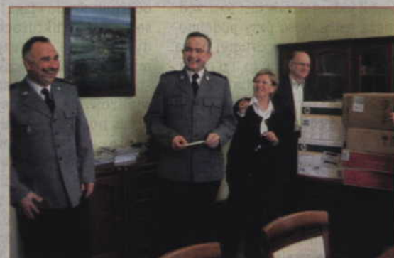
Nowe komputery bardzo się przydadzą, bo do tej pory 17 policjantów miało do dyspozycji tylko trzy zestawy.