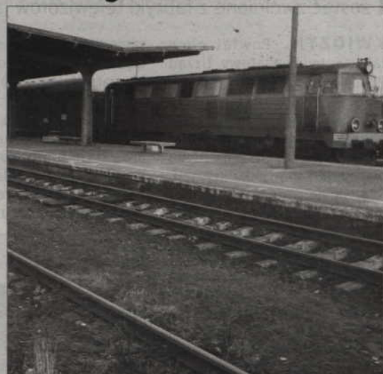
Od 2 marca na kwidzyński dworzec częściej przyjeżdżać będą pociągi, wznowione zostaną kursy szynobusów do Grudziądza.

Relacja z podróży pierwszym szynobusem do Grudziądza - za tydzień