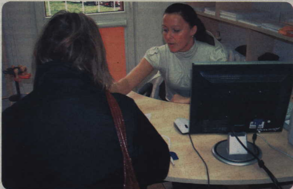
Osoby otrzymujące świadczenia rodzinne w okresie zasiłkowym 2008/2009, otrzymują decyzję zmieniającą o przedłużeniu okresu zasiłkowego. Należy je odbierać w Miejskim Ośrodku Pomocy Społecznej w Kwidzynie, w pokoju nr 8.

Zmieniły się okresy związane z wypłacaniem świadczeń rodzinnych. Nowy okres zasiłkowy będzie rozpoczynał się 1 listopada, a kończył 31 października roku następnego. Wnioski będą składać w terminach: od 1 września do 30 września (wypłata nastąpi do 30 listopada) oraz od 1 października do 30 listopada (wypłata nastąpi do 31 grudnia, z wyrównaniem za listopad).