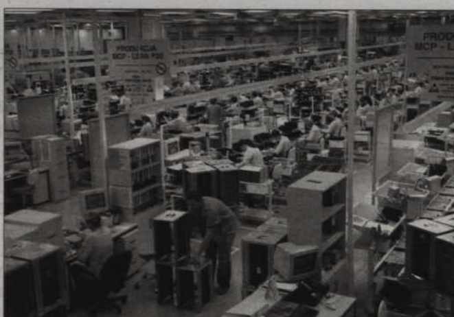
Kwidzyńska fabryka telewizorów Jabil ma zwolnić pod koniec marca ponad 800 osób. Trwają jeszcze negocjacje ze związkami zawodowymi.

odnawialnej. Jesteśmy dalecy od pozostawienia tematu kryzysu i jego potencjalnych skutków na rynku pracy samemu sobie i staramy się sensownie działać w tych obszarach, na jakie mamy rzeczywisty wpływ. W przypadku naszego powiatu zdecydowałem o przeznaczeniu znacznych środków, przyznanych nam przez Ministerstwo Pracy i Polityki Społecznej, na takie formy aktywizacji zawodowej, które gwarantują tworzenie miejsc pracy, motywują lub przyczyniają się do wzrostu zatrudnienia. To m.in. jednorazowe dotacje na podjęcie własnej działalności gospodarczej lub refundacje tworzenia miejsc pracy dla bezrobotnych, a także staże dla osób wchodzących na rynek pracy. Taka strategia będzie utrzymana w całym 2009 roku, zarówno w przypadku środków pochodzących z ministerstwa, jak i funduszy unijnych. Tego typu działania nadzorcze powiatu nad urzędem pracy są ważne, ale najważniejsza jest koniunktura gospodarcza. Ustawowa rola powiatu to przede wszystkim promocja, łagodzenie i aktywizowanie. Nasze kompetencje