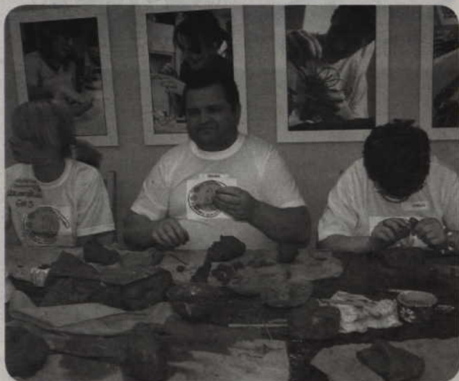
Obecnie w zajęciach terapeutycznych Warsztatu Terapii Zajęciowej w Górkach uczestniczy 47 niepełnosprawnych.

Warsztat Terapii Zajęciowej w Górkach, prowadzony przez Fundację „Misericordia” prowadzi diagnozę potencjalnych uczestników zajęć terapeutycznych, wśród niepełnosprawnych z całego powiatu kwidzyńskiego. WTZ to możliwość rehabilitacji zawodowej i społecznej. Tutaj zdobywa się wiele umiejętności, które mogą przydać się nie tylko w życiu codziennym, ale też w przyszłej pracy zawodowej. Aby skorzystać z zajęć, wyjaśnia Bogdan Muchowski, kierownik Warsztatu Terapii Zajęciowej w Górkach, należy spełniać pewne kryteria.