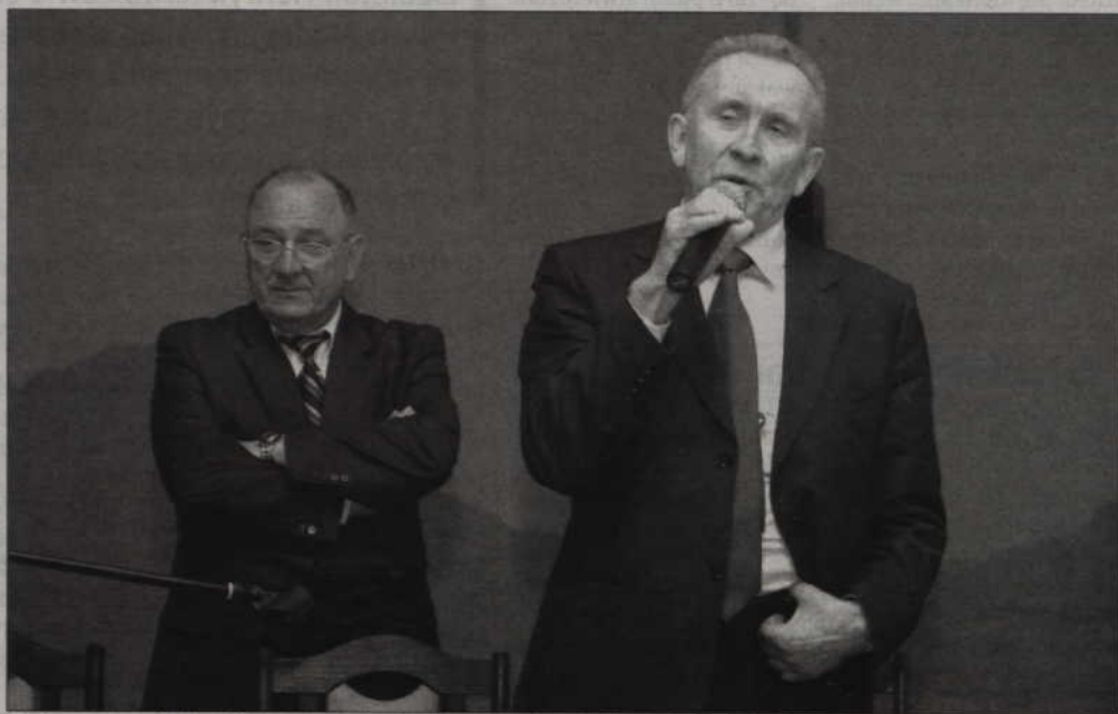
Minister sprawiedliwości Andrzej Czuma na spotkaniu z członkami Platformy Obywatelskiej w Kwidzynie.

zlikwidowania kilkustopniowej hierarchii sądów na rzecz uproszczonej, trzystopniowej. Jego plan zakłada rezygnację z prokuratorów krajowych, którzy są, jak to ujął, „grupą starszych panów, którzy oprócz czytania gazet myślą, o tym, jak zabić wolny czas, a jednym z efektów