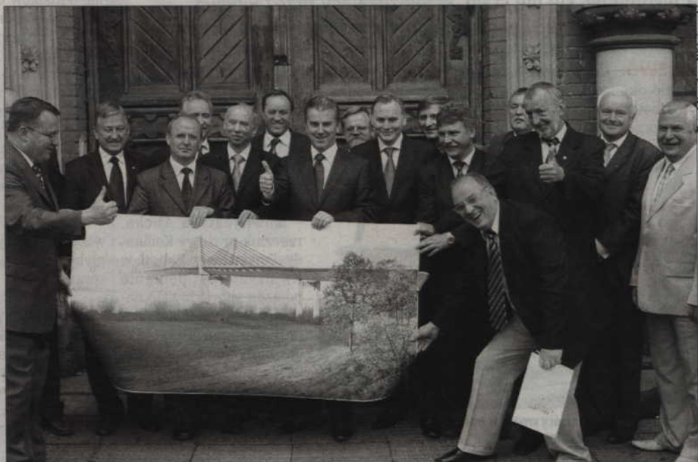
W ubiegłym roku przyjechał do Kwidzyna minister infrastruktury Cezary Grabarczyk, by obiecać mieszkańcom most. Z dumą zaprezentowano ostateczny jego projekt. Czy zastrzeżenia ekologów uniemożliwią budowę?

- Planowaliśmy budowę tunelu, który połączyłby ulicę