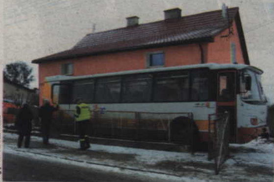
Autobus zjeżdżając z góry wpadł w poślizg, uderzył w ogrodzenie i budynek mieszkalny.