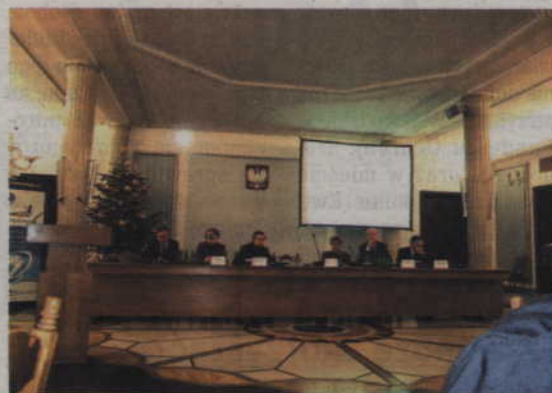
Spotkanie nauczycieli z Sali Kolumnowej polskiego sejmu. Uczestniczyli w nim m.in.: minister edukacji Katarzyna Hall i marszałek sejmu Bronisław Komorowski.

Są to liderzy, kraje osiągające średnie wyniki, nadrabiające dystans oraz „tracące grunt”. Niestety nasz kraj zaliczany jest do tej ostatniej grupy. Dziesięć lat temu, dzięki wysiłkom podejmowanym w ramach programu Interkl@sa polskie szkoły weszły w epokę informacji. Otrzymały tysiące komputerów i możliwość korzystania z internetu. Obecnie na rynek pracy wchodzi pierwszy