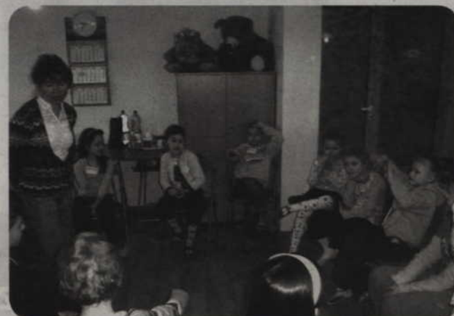
Realizując program „Przygoda z książką” poradnia po raz dziewiąty włączyła się w kampanię Fundacji ABCXXI - Cała Polska czyta dzieciom, która propaguje głośne czytanie książek.