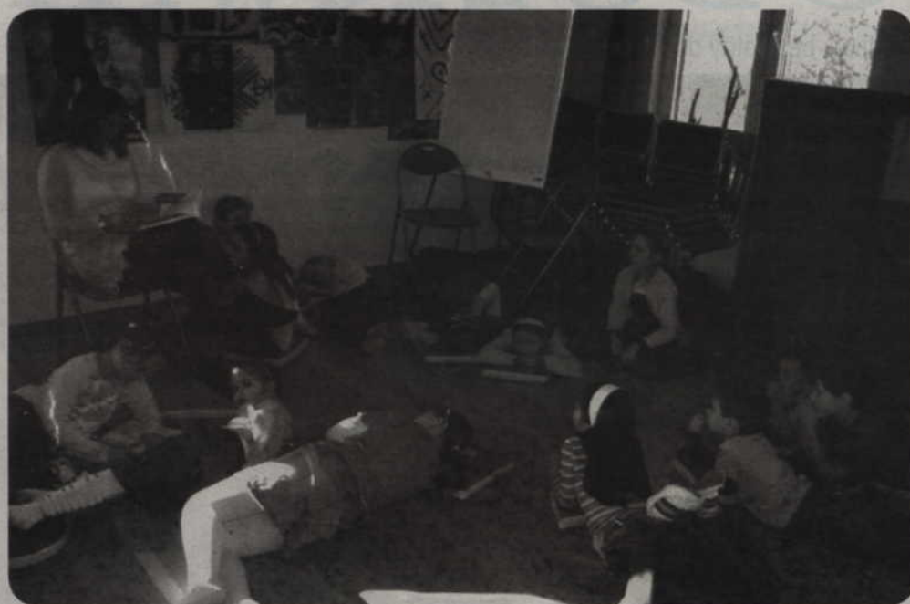
Pracownicy Poradni Psychologiczno-Pedagogicznej w Kwidzynie nie wycoczywali podczas zimowych ferii. Dla dzieci i młodzieży przygotowali wiele różnych zajęć.

Pracownicy Poradni Psychologiczno-Pedagogicznej w Kwidzynie nie wycoczywali podczas zimowych ferii. Dla dzieci i młodzieży przygotowano wiele różnych zajęć. W pierwszym tygodniu zimowego wypoczynku grupa dzieci w wieku 7-9 lat uczestniczyła w zajęciach „Przygoda z książką”.